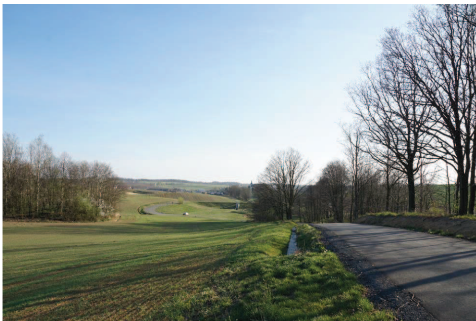
Obr. 27 Prudký sjezd od větrné elektrárny do Hati na horní konec – nová cyklostezka s posezením a informačními panely