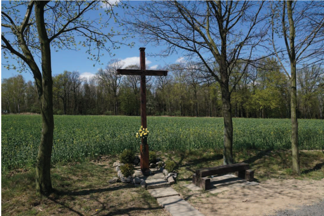
Obr. 3 Nový kříž s umělecky kovaným Kristem