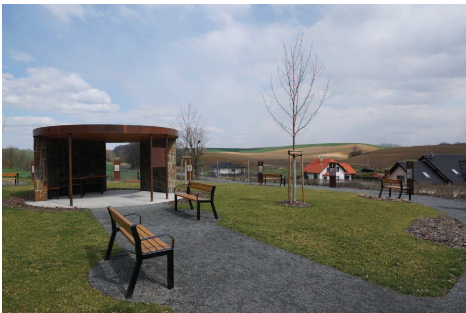
Obr. 28 Nová křížová cesta v Hati s posezením

Umělecký malíř a řezbář si nejdříve vytvořil sádrový model podle návrhu, poté odlil lukoprénovou formu, až byl do forem nalit zmíněný beton. Následovalo čištění a impregnace.