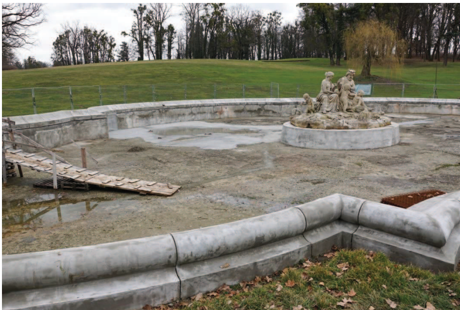
Obr. 13 Rekonstrukce Neptunovy kašny, dříve i místo ke koupání v létě

Nanebevzetí Panny Marie (Obr. 18), místnímu hřbitovu a sportovně-rekreačnímu areálu Baumšula včetně soukromé tenisové školy (Obr.19)