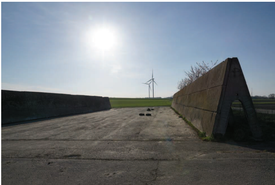
Obr. 24 Železobetonové hnojiště blízko větrné elektrárny v Hati

Větrná elektrárna má 2 větrníky (turbíny) a dodavatelem byla dánská společnost Vestas. Investorem je firma SWPOW s.r.o. z Ostravy Mariánské Hory (Obr. 25). Obec Hať dostává od provozovatele roční finanční příspěvek cca 200.000 Kč. První turbína VE1 byla instalována v roce 2012 a druhá VE2 v roce 2019.