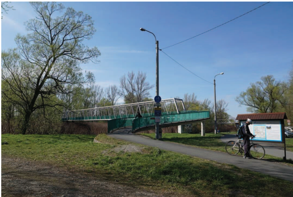
Obr. 5 Antošovická lávka otevřená v roce 2000. Nahradila starou lávku strženou povodní v r. 1997. Zajímavá technická konstrukce