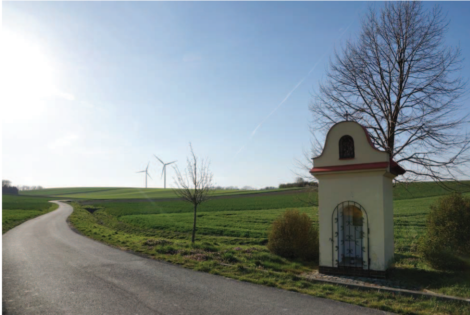
Obr. 23 Boží muka blízko větrné elektrárny v Hati