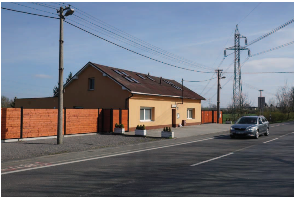
Obr. 3 Apartmány Flora na Ostravské ulici