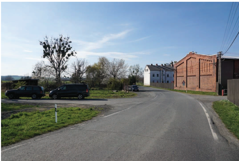
Obr. 7 Statek Paseky. Místo pro odbočení vlevo do Černého lesa