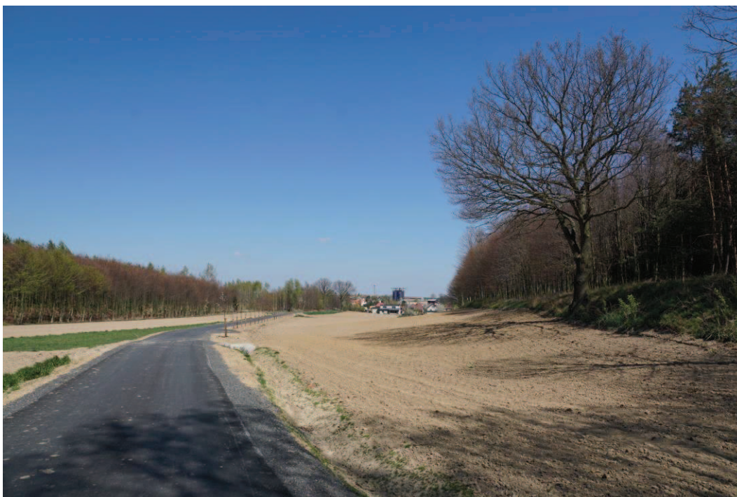
Obr. 6 Nová alej v blízkosti Hati