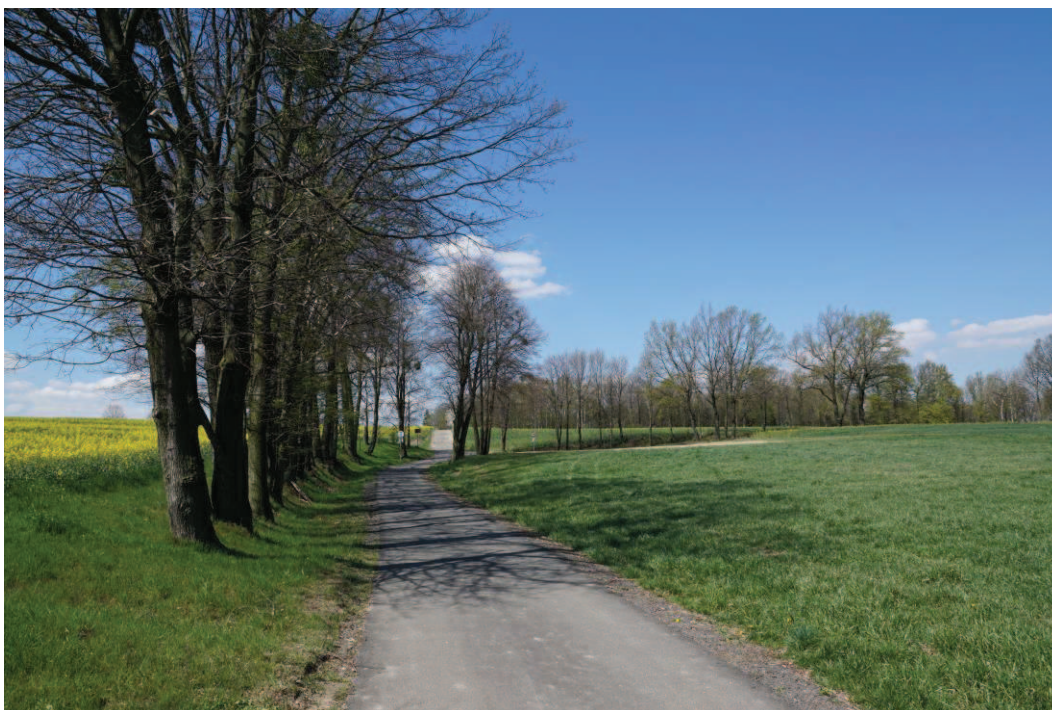
Obr. 2 Zde odbočíme z trasy 6093 vpravo