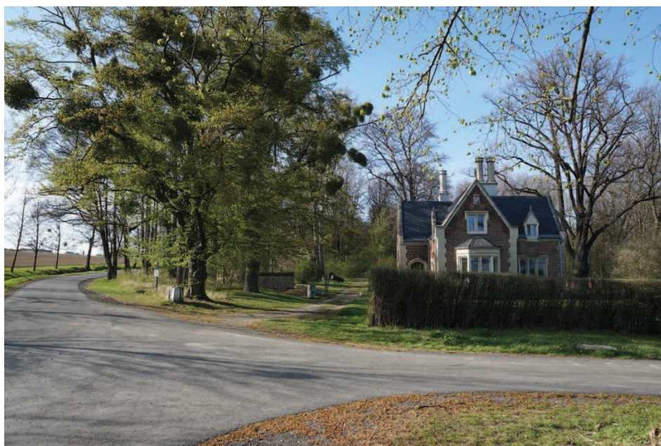
Obr. 11 Manor House a Ostravská kovaná brána. Brána je dnes demontována a restaurována. Zde odbočíme vlevo nahoru