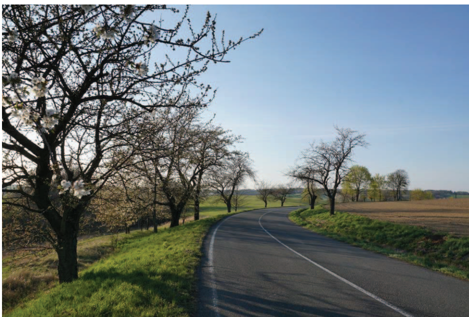
Obr. 31 Státní silnice č. 469 – výjezd z Hati směrem na Darkovičky, Štípký a Hlučín