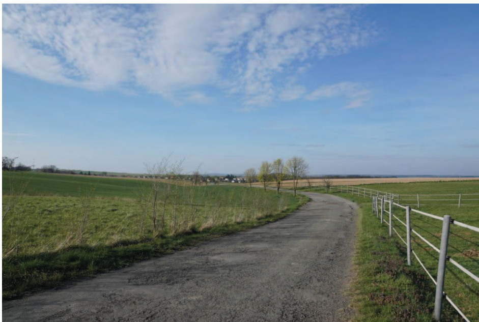
Obr. 20 Silnice mezi poli ze Šilheřovic do Hati - Polní