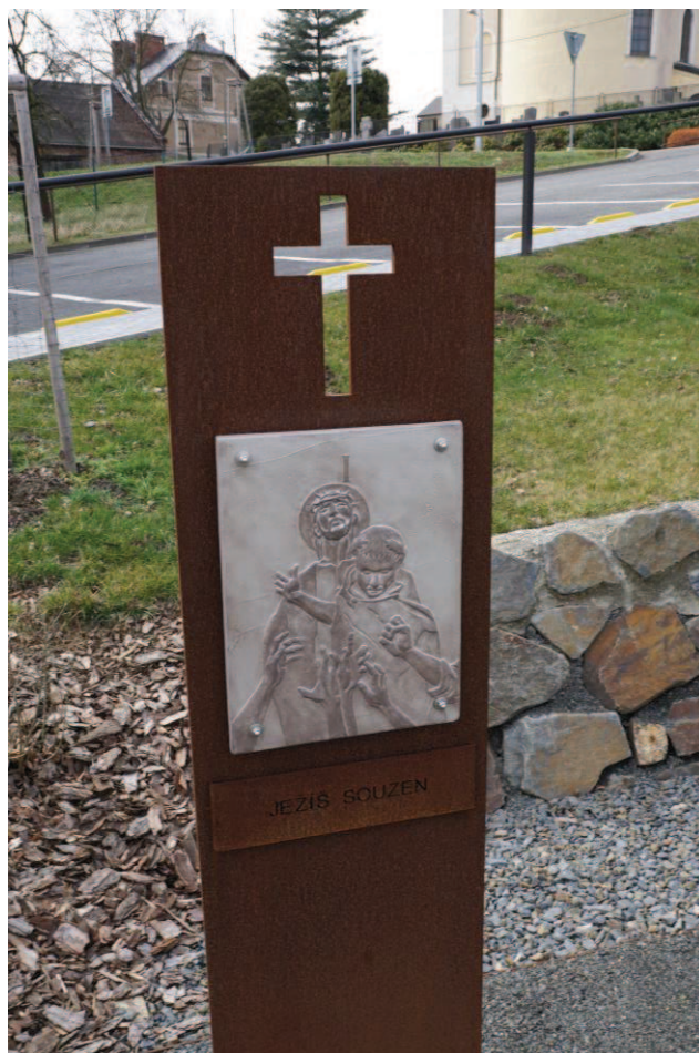
Obr. 29 Nová křížová cesta v Hati - první zastavení ze 14 „Ježíš souzen“

Křížová cesta byla slavnostně otevřena a požehnána v pátek 28. června 2019 a pro obyvatele Hati a okolí to znamenalo velkou událost.