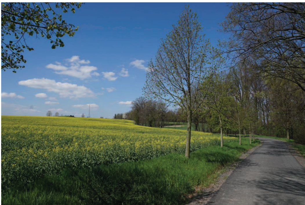
Obr. 1 Pokračování Kostelní po 6093 k vysílačům