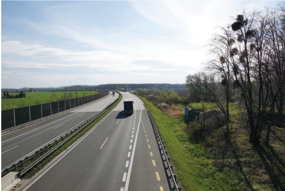
Obr. 6 Pohled z nadjezdu přes dálnici v Antošovicích