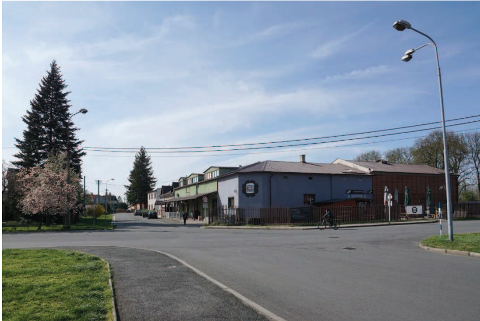
Obr. 2 Bývalé kino Apollo – dnes Restaurant Food Factory