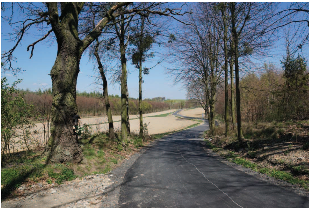
Obr. 5 Serpentina sjezdu do Hati – pozor na 3 příčné odvodňovací žlaby!