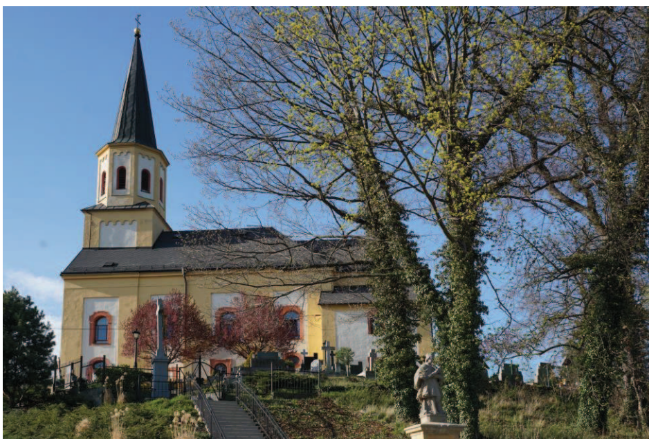
Obr. 18 Kostel Nanebevzetí Panny Marie v Šilheřovicích z roku 1713, vybudovaný zásluhou Jezuitů

Pokračujeme dále dolů z kopce po silně rozbité a neudržované Polní (Obr. 20) a ulici Dolina až do Hati , (mostek je dnes v rekonstrukci, ale s provizoriem pro chodce a cyklisty) kde odbočíme vlevo na Lipovou. Míjíme známý a cyklisty oblíbený Hostinec U sv. Mikuláše s velkou venkovní zahrádkou a dětskými atrakcemi (Obr.21).