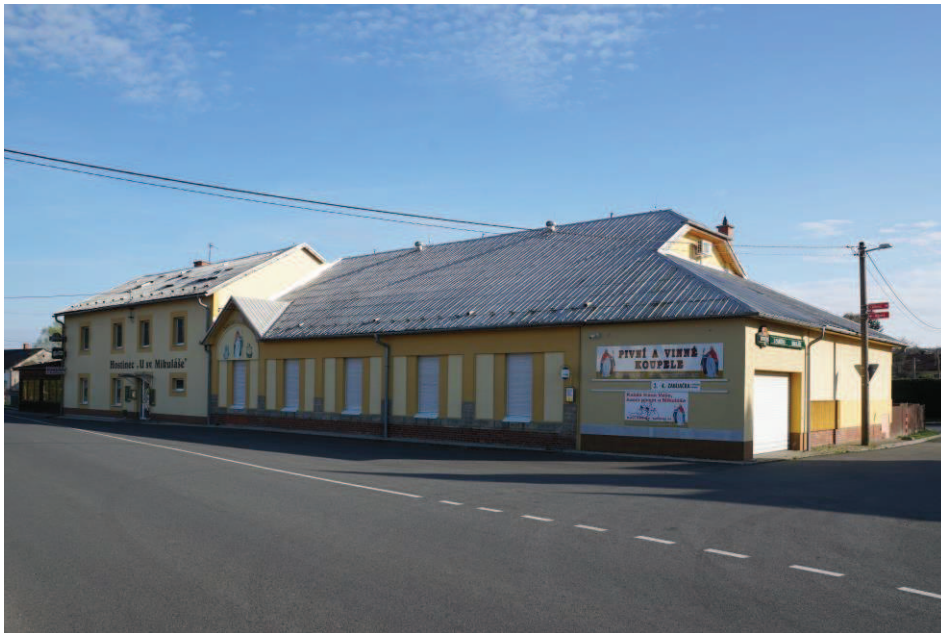
Obr. 21 Hostinec „U sv. Mikuláše v Hati“