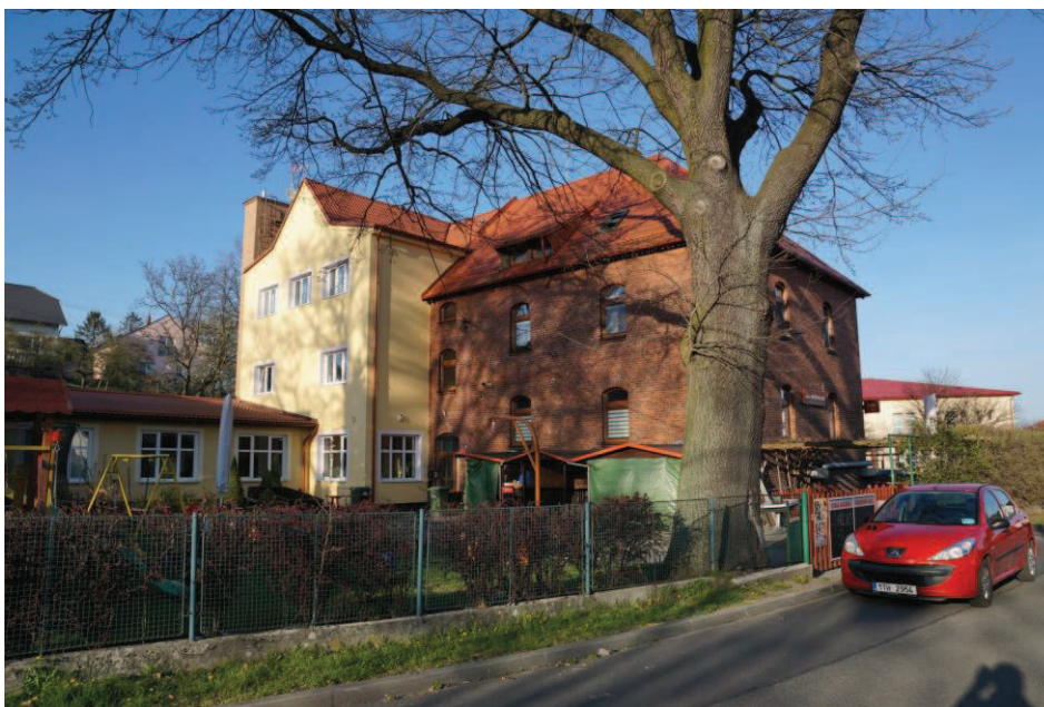
Obr. 30 Hospůdka Sklep v Hati se zahrádkou