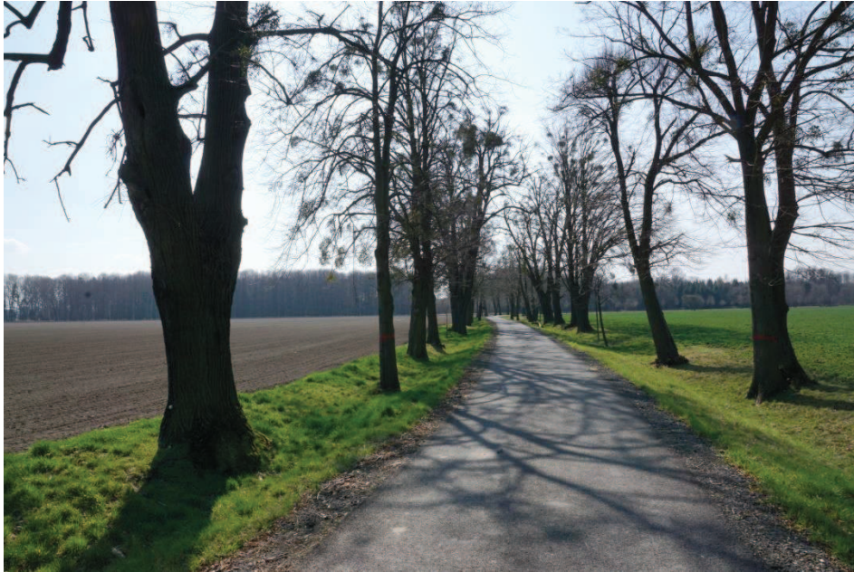
Obr. 8 Lipová alej Paseky – Černý les. Stromy silně napadené jmelím

Za závorou, bránící vjezdu motorových vozidel a včelařskou základnou nás při vjezdu do lesa potěší nádherná stará dubová alej (Obr. č. 9) a dojedeme postupně až ke komunikaci vedoucí zleva z Koblova kolem opraveného Anniny dvora lesem do Šilheřovic. (Obr. č. 10)