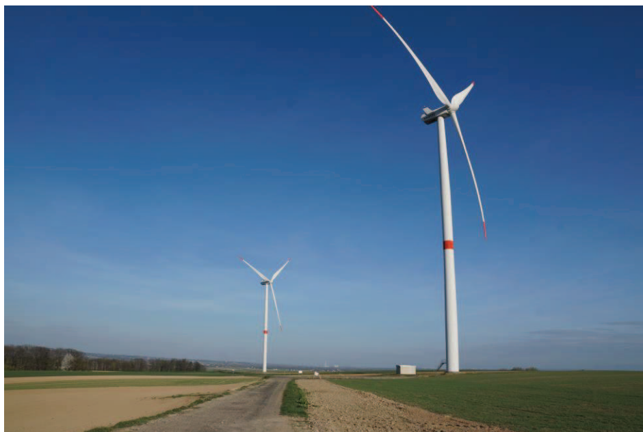
Obr. 25 Větrná elektrárna v Hati – 2 x 2 MW