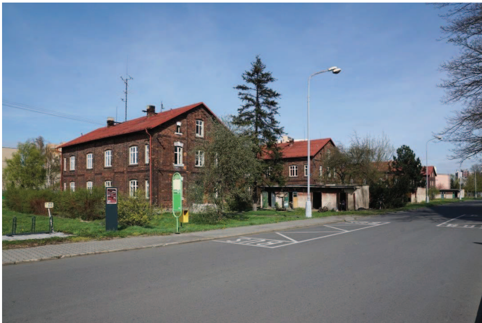
Obr. 1 Rafinérská kolonie , plánovaná rekonstrukce na moderní 2 až 4 - pokojové byty

Výlet z centra Bohumína zahájíme po trase „C“ - po tř. Dr. Edvarda Beneše a pokračujeme dále po Okružní , kde projedeme okolo staré Rafinérské kolonie z červených cihel z let 1896-1897 (Obr. 1). Bydlely zde rodiny dělníků pracujících v Rafinérii minerálních olejů (Mineralöl-Raffinerie, A. G.)