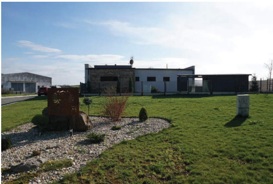
Obr. 16 Lokalita novostaveb Golf Villas – energeticky úsporné dřevostavby