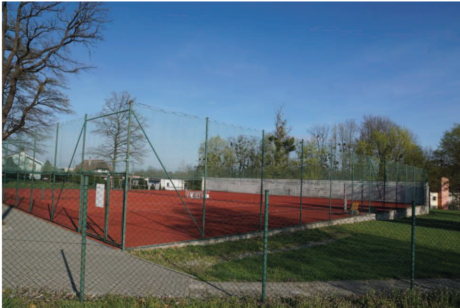
Obr. 19 Soukromá tenisová škola Baumšula

k větrné elektrárně. (Obr. 25). Můžeme se pokochat pěknými výhledy na Polsko na obec Tworków.