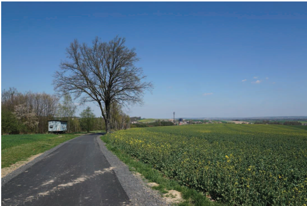
Obr. 4 Sjezd do Hati s výhledy