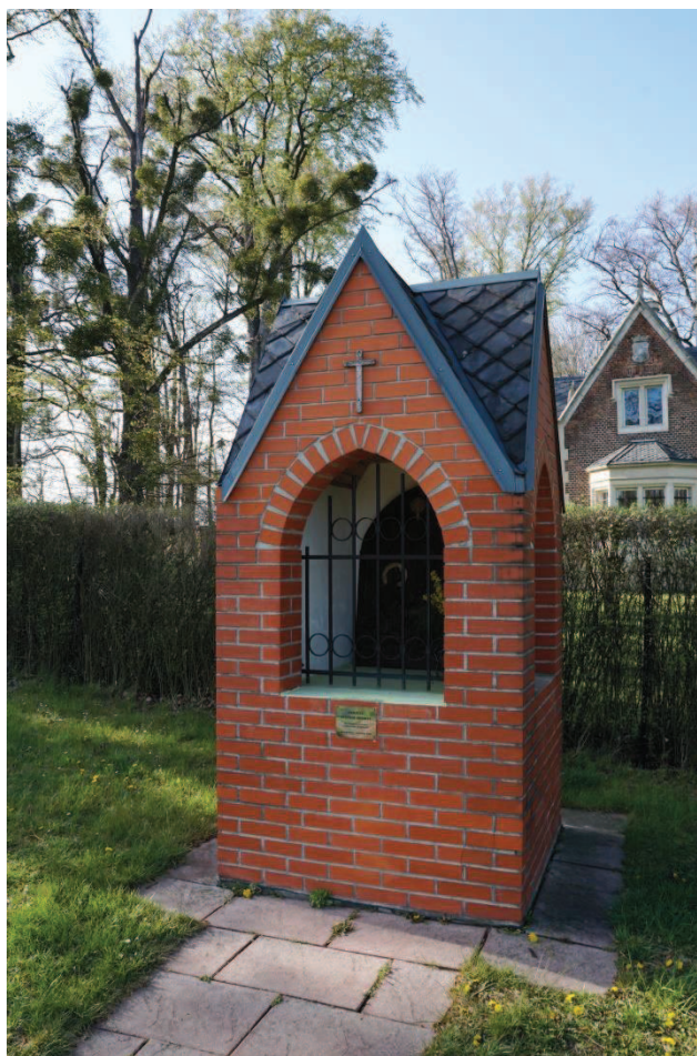
Obr. 12 Kaple s. Huberta , patrona lovců a myslivců, dar od lesníků a myslivců z Bažantnice 2006

Za zmínku stojí, že park má symbolicky celkem 7 vstupních bran :