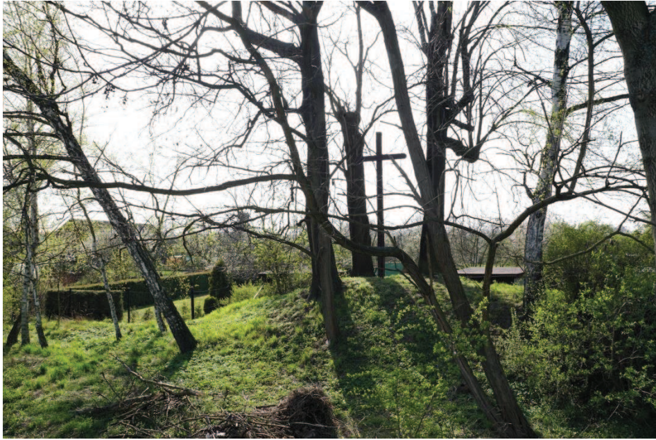
Obr. 4 Švédský kříž (Kříž na Orli)