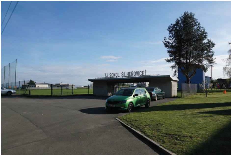
Obr. 15 Fotbalový areál TJ Sokol Šilheřovice