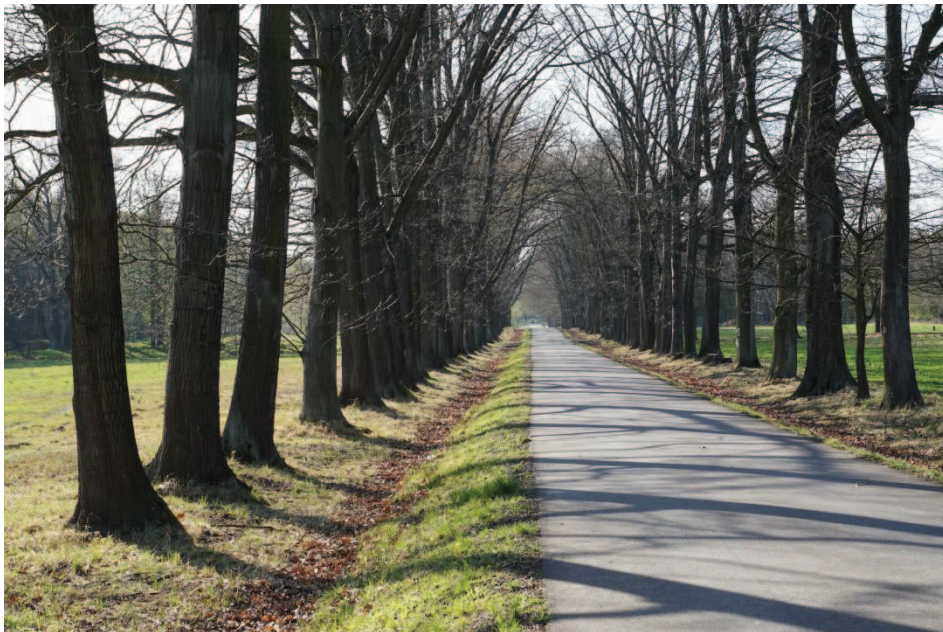
Obr. 9 Černý les, stará dubová alej

Za závorou, bránící vjezdu motorových vozidel a včelařskou základnou nás při vjezdu do lesa potěší nádherná stará dubová alej (Obr. č. 9) a dojedeme postupně až ke komunikaci vedoucí zleva z Koblova kolem opraveného Anniny dvora lesem do Šilheřovic. (Obr. č. 10)