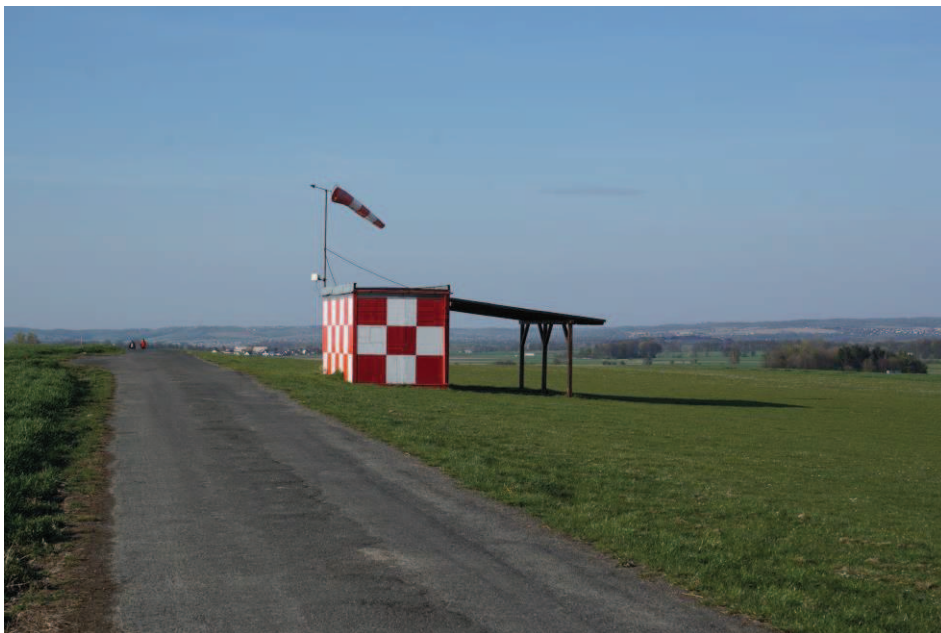
Obr. 22 Letiště Hat' u Hlučína (LKHATH) – pro modeláře a ultralighty