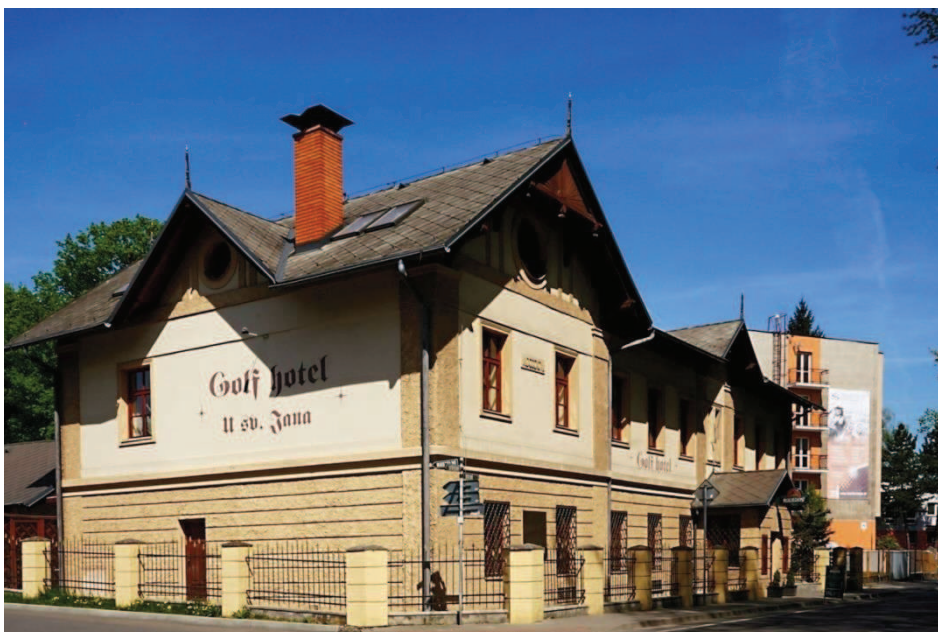
Obr. 17 Golf hotel „U sv. Jana“ – bývalá správní a administrativní budova Rothschildů http://www.hotel-silherovice.cz/cz/ubytovani