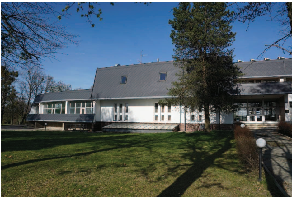
Obr. 14 Hotel Golf, s bazénem a fitness centrem, málo využívaný