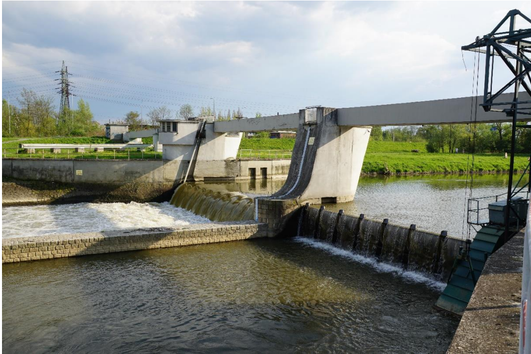
Obr. č. 3 Odra / ř. km 11,830 – jez Přivoz