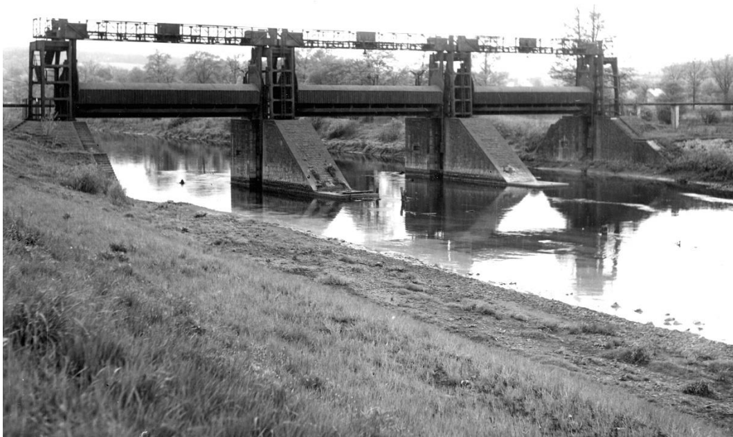
Obr. č. 1 Odra / ř. km 9,70 – historická fotografie bývalého jezu Koblov