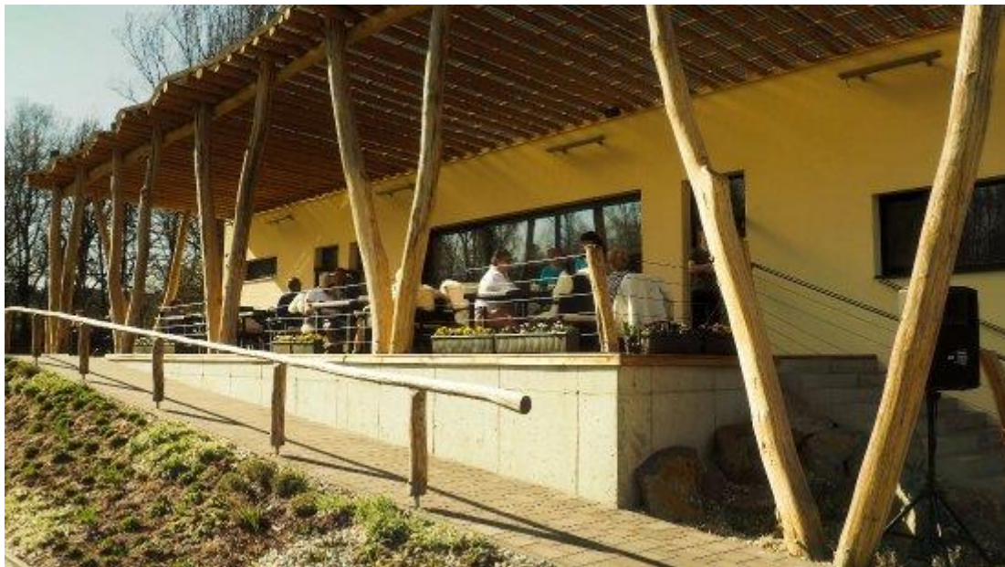
Obr. č. 11 Restaurace Golf Park Lhotka s venkovní zahrádkou