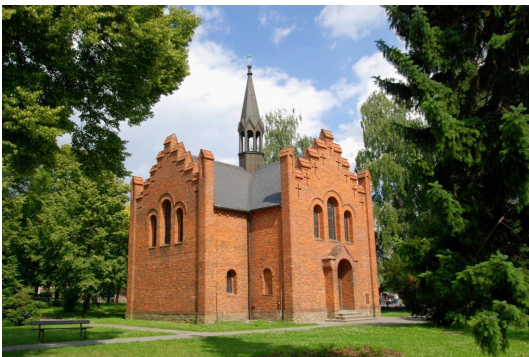
Obr. č. 15 Bývalý evangelický kostel v Hlučíně z režných cihel z roku 1862, vybudovaný v novorománském stylu. Původně součást evangelického hřbitova