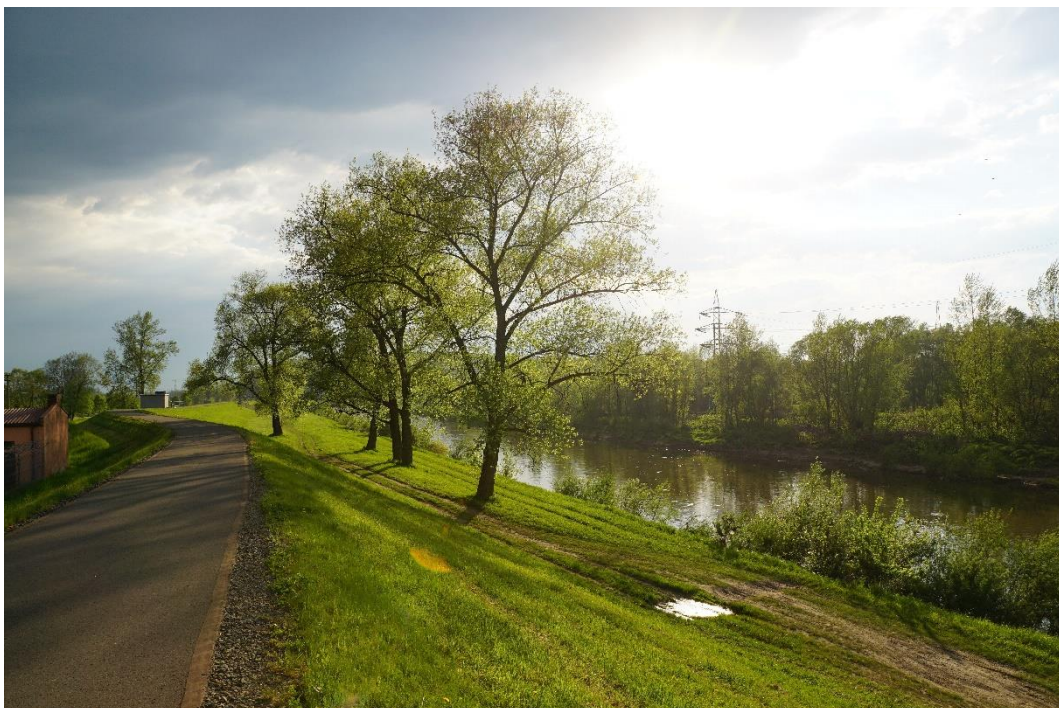
Obr. č. 2 Odra / ř. km 9,70 – místo bývalého jezu Koblov – přes řeku směrem ke hřbitovu Koblov