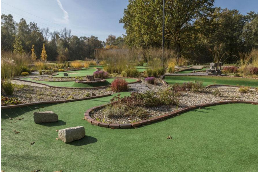
Obr. č. 10 Adventure golf Lhotka