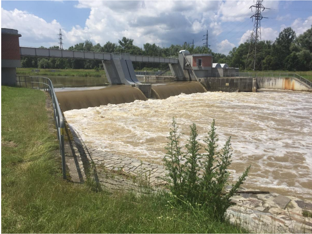
Obr. č. 5 Odra / ř. km 14,940 – jez Lhotka v době vysokého průtoku