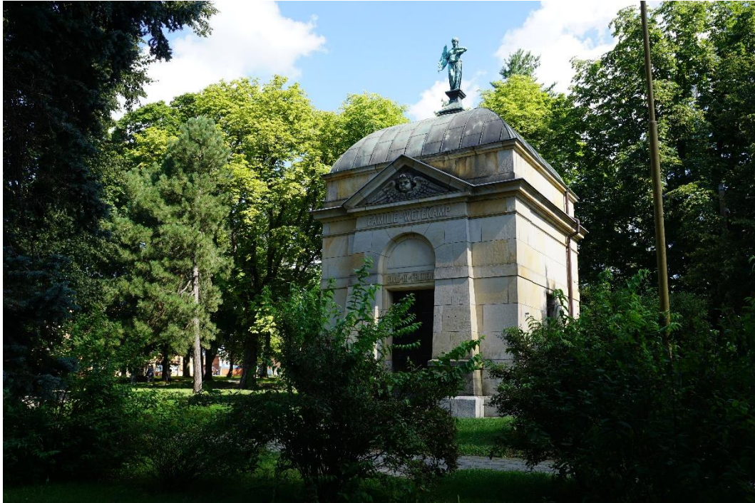
Obr. č. 16 Empírová stavby hrobky rodiny Viléma Wetekampa, vrchního účetního statků Rothschildů, v Hlučíně z roku 1898