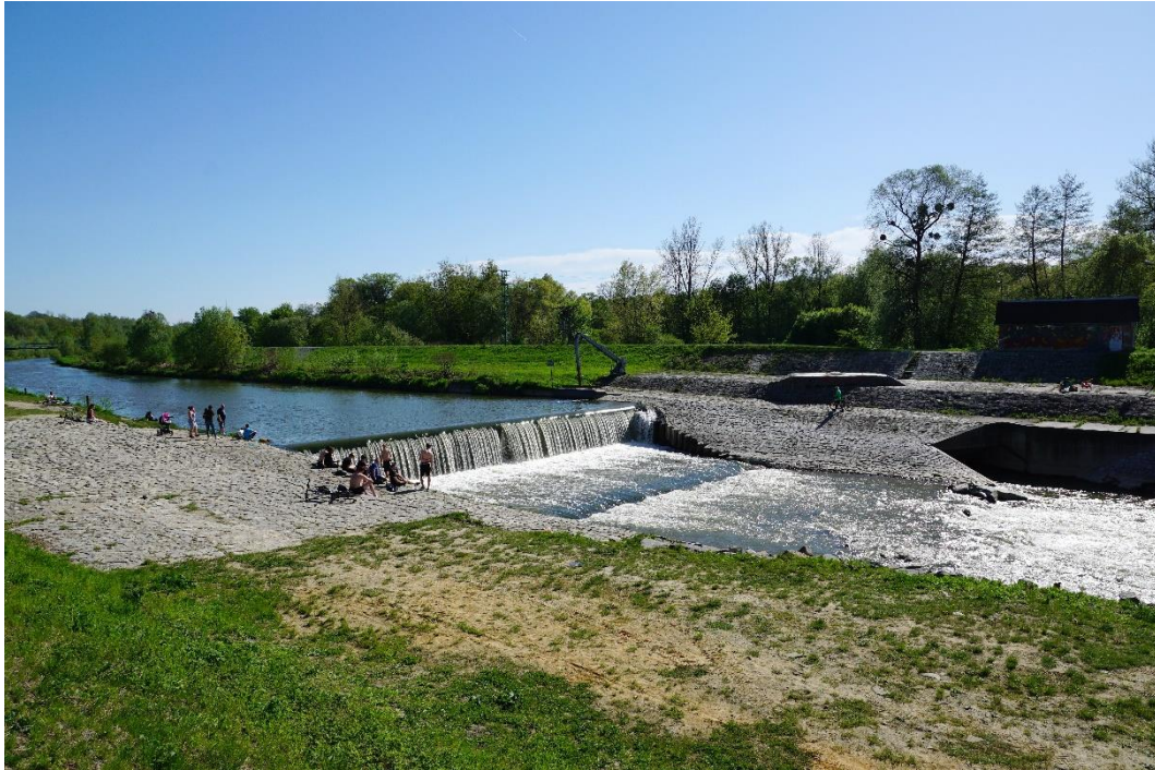
Obr. č. 7 Odra, km 20,5 – jez Zábřeh