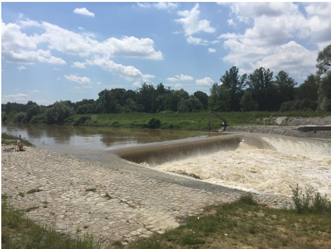
Obr. č. 8 Odra, km 20,5 – jez Zábřeh v období vysokého průtoku