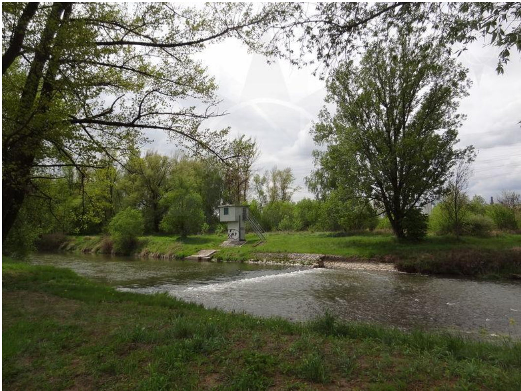
Obr. č. 6 Odra, km 19,1 – říční práh Ostrava – Svinov