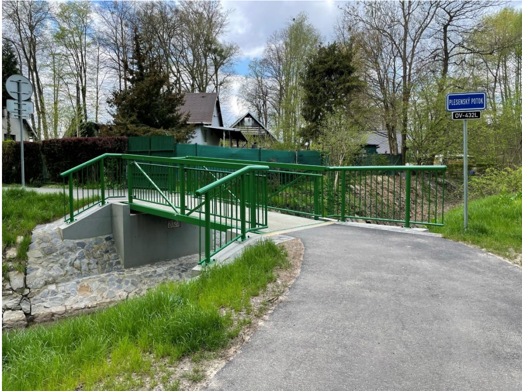
Obr. č. 12 Nová lávka přes Plesenský potok na cyklostezce podél řeky Opavy z Třebovic do Děhylova