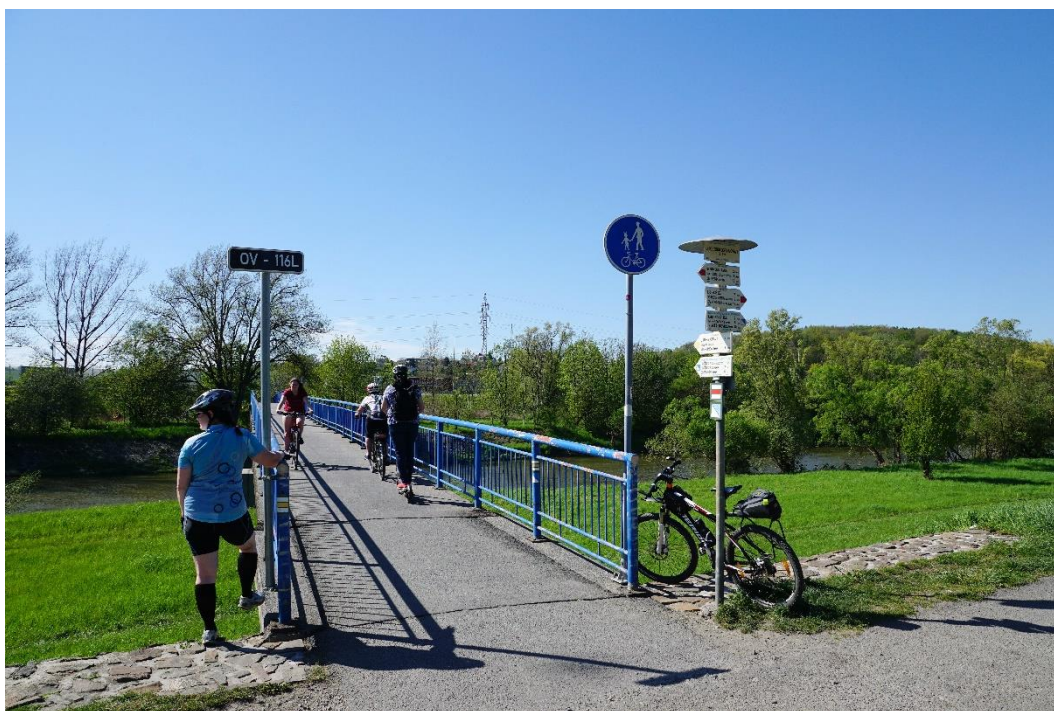
Obr. č. 9 Lávka OV-116L „U soutoku Odry a Opavy“

Po výjezdu z Hlučina se vyhneme silnému provozu na silnici 469 tím, že ihned sjedeme na cyklostezku na Darkovičky (ulice K Mýtu) a přes Šilheřovice a Antošovice dojedeme do Bohumína .