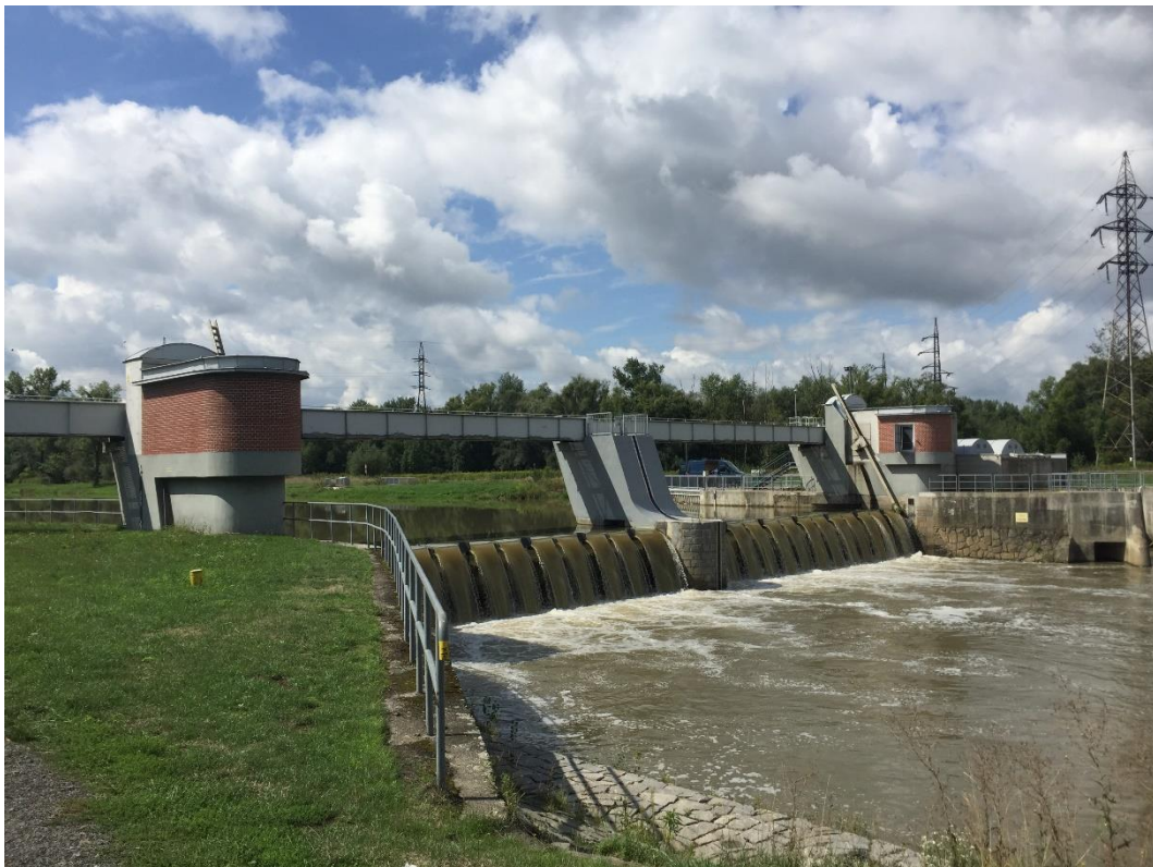
Obr. č. 4 Odra / ř. km 14,940 – jez Lhotka . U řeky podrobná informační tabule