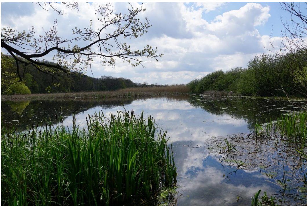
Obr. č. 13 Rybník a přírodní rezervace Štěpán