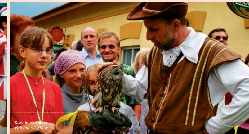
Sokolnická show Falconers' Show