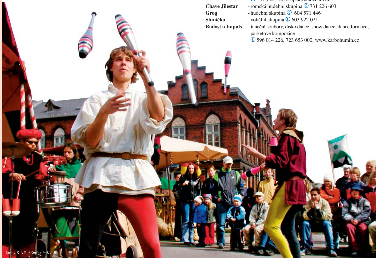
Jaro v K.A.R. / Spring in K.A.R.