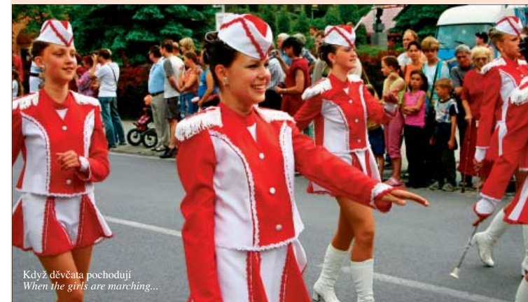
Když děvčata pochodují When the girls are marching...