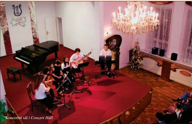
Koncertní sál / Concert Hall