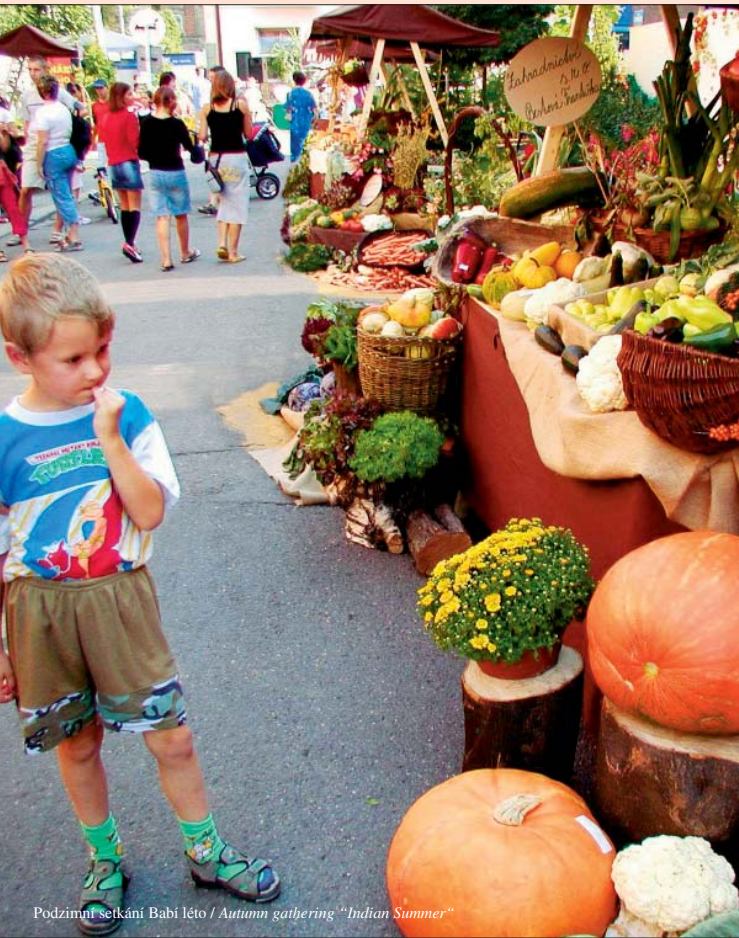
Podzimní setkání Babi léto / Autumn gathering “Indian Summer”

Andrusi - the Polish compatriot variety ensemble ☎ 737 984 914, czapekb@seznam.cz Čhave Jilestar - the gypsy band ☎ 731 226 603 Grog - the band ☎ 604 571 446 Sluníčko - vocal group ☎ 603 922 021 Radost and Impuls - dancing groups, disco dances, show dances, dance formations, parquet compositions ☎ 596 014 226, 723 653 000, www.karbohumin.cz