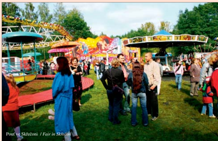
Pout ve Skřečoni / Fair in Skřečoni