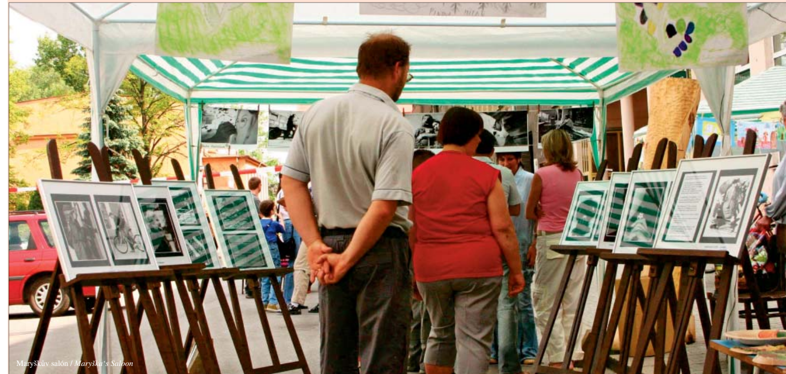
Maryškův salón / Maryška's Salon