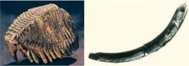
Stolička a část mamutího klu nalezených v Bohumině. Znalezione w Boguminie ząb trzonowy i fragment mamuciego kła.

Korytem řeky Odry se ve čtvrtohorách před několika desítkami či stovka-mi tisíci let procházeli mamuti se zahnutými kly a dlouhými chlupy. Dokazu-je to hned několik nálezů mamutího klu i stoličky u řeky Odry. Část mamutí-