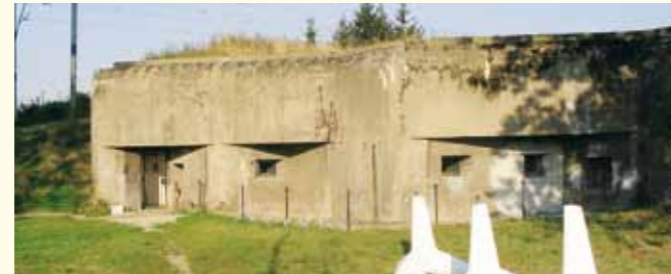
Pěchotní srub MO-S5 Na Trati je kulturní památkou. Obiekt fortyfikacyjny MO-S5 „Na torach“ to zabytek techniki.

Mohutné a technicky téměř dokonale... Jejich historie se začala psát ve druhé polovině 30. let 20. století. Vyrostly za zhruba 2,5 roku v nejisté době, kdy se k moci dostal Adolf Hitler a ve vzduchu viselo ohrožení naší republiky. A tyto stavby nás měly před Němci ochránit. Československá armáda je začala budovat po vzoru Francie na hranicích s Německem a Polskem. V celé republice vzniklo do září 1938 téměř 10 tisíc objektů lehkého opevnění a 263 objektů těžkého opevnění. Jedny z vůbec prvních byly vybudovány právě v Bohumíně. Dějiny bohužel nakonec způsobily, že armáda musela bunkry bez boje opustit. Dodnes