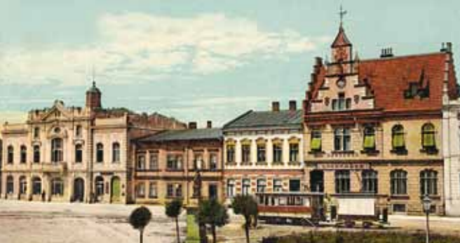
Starobohumínské náměstí v roce 1914. Vlevo je hotel Zelený strom a vpravo budova radnice. Starobogumínský rynek v 1914 r. Z levé strany hotel Zielone Drzewo, z pravé – budýnek ratusza.

Vůbec první objevená písemná zmínka o Bohumínu, respektive o vsi Bogun, pochází už z roku 1256. Jedná se o dnešní nejstarší městskou část Starý Bohumín. Vstupným cestovním ruchem totiž přibývalo osadníků, takže osada byla v době krále Přemysla Otakara II. již velkou vesnicí. Tvořilo ji tehdy 57 velkoměšťan-ských domů s právem várečným a čepováním vína. Žilo tady asi 350 obyvatel. Na základě jména Bogun můžeme soudit, že se jednalo o slovanské sídlo. Držení vesnice bylo díky vybírání mýtného od pocestných a dobré poloze na hranicích fi-nančně a strategicky výhodné. Už ve 12. století procházely Bohumínem křižovačky