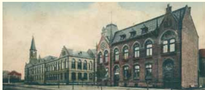
Dobový pohled na budovu radnice i školy. Dnes v obou budovách sídlí úředníci. Historyczny widok ratusza i szkoły. Obecnie w obu budynkach są biura Urzędu Miejskiego.

Dzisiejszy gmach ratusza wyrastał stopniowo jako kompleks niemieckich szkół pod koniec XIX i na początku XX wieku tuż obok kościoła. Pierwsza