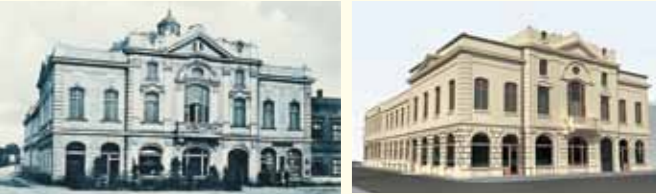
Bývalý secesní hotel Zelený strom vznikl v roce 1907. V Bohumině je ojedinělý. Čeká na svou rekonstrukci, která mu vrátí lesk i slávu. Dawny secesyjny hotel Zielone Drzewo został wybudowany w 1907 r. W Boguminie to wyjątkowy obiekt. Czeką na rekonstrukcję, która przywróci mu dawny blask.

Nárožní dům má tvar písmene L, bohatou secesní ornamentiku. Uprostřed hlavního průčelí do náměstí je rizalit (středová vystouplá část s balkonem). Zadní fasáda je hladká, prolomena obdélnými okny, v průčelí velké schodištní okno s vitráží se secesními motivy – stuha a pletence.