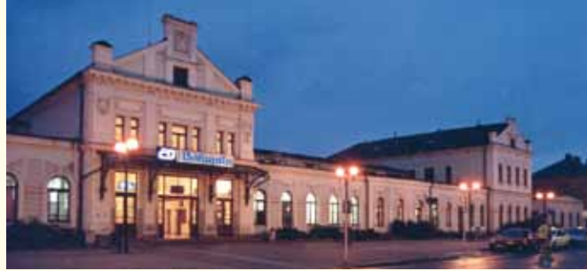
Novorenesanční budova nádraží v Novém Bohumíně patří k nejhezčím v České republice. Neorenesančný budyněk dvorcowy w Nowym Boguminie należy do najpiękniejszych w Republice Czeskiej.

Vznikla v roce 1847, kdy do Bohumína přijel i první vlak. V roce 1860 na jejím místě vyrostla nová stanice. V letech 1902 až 1904 byla přebudována v novorenesančním stylu. Má bohatou štukovou výzdobu. V devadesátých letech 20. století došlo ke komplexní opravě stanice v původním stylu. V roce 2003 prošlo rekonstrukcí i nádraží. Jako komplex teď patří k jednomu z nejhezčích a nejmodernějších nádraží v České republice.