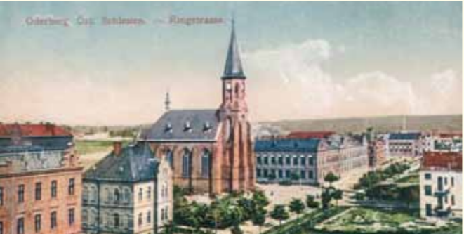
Kostel Božského Srdce Páně, v pozadí škola a radnice v Novém Bohumině v roce 1919. Kościół Najświętszego Serca Jezusowego, na drugim planie szkoła i ratusz w Nowym Boguminie – rok 1919.

ké, aby nabídla ke stavbě „Císařsko–královské soukromé dráhy Košicko–bo-humínské“ své bažinaté pozemky uprostřed lesů. Na nejnevhodnějším mís-tě, které se muselo vysoušet, tak začala vznikat železniční trať, která předur-čila rychlý rozvoj tohoto místa. Začaly vznikat domy pro úředníky, femeslní-ky, obchodníky, zaměstnance železnice. První vlak sem přijel 1. května 1847. Později vznikly továrny, a dělnické kolonie, které nadlouho poznamenaly ráz města. Překotná výstavba si ale vybrala svou daň. Kvůli ní nevzniklo mnoho architektonicky zajímavých památek, ani dominantní náměstí.