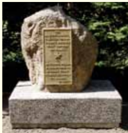
Pamětní deska obětem polenlagru stojí také v parku Petra Bezruče. Tablica upamiętniająca ofary „polenlagru“ znajduje się w parku Petra Bezruča.

Zvláštní druh nacistických koncentračních táborů ve Slezsku, tzv. penlenlager, vznikl v roce 1942 také v Bohumíně. Dostal číslo 32 a podle odhadů v něm najednou pobývalo až 800 vězňů. Fungoval až do května 1945 a byl určen pro polské vysídlence, kteří museli zanechat svou půdu Němcům. Jako levnou pracovní sílu je přesunuli do záchytných táborů, kterým se později začalo říkat polenlagery. Museli tady bez ohledu na věk pracovat při regulaci říek, na stábkách a opravách cest i železnice, někteří v místních průmyslových podnicích. Děti pak přímo v táboře, ty starší u místních rolníků. Dozorci s nimi jednali tvrdě a podle německé propagandy je považovali za pouhé kriminálníky. Kvůli špatným hygienickým podmínkám v bohumínském polenlageru zemřelo mnoho lidí. 104 obětí je pohřbeno na hřbitově v Bohumíně-Skrěčoch. Mají tam i monumentální pomník.