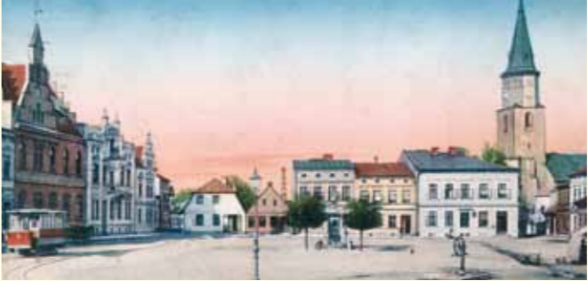
Náměstí ve Starém Bohumině v roce 1907. Vpravo je kostel Narození Panny Marie. Rynek w Starym Boguminie w 1907 r. Z prawej kościół Narodzin Panny Marii.

Náměstí je historickým jádrem Bohumína. Až do 20. století bylo náměstí a jeho budovy centrem kulturního i společenského života. Kvůli častým záplavám nechali navězt na nízko položené náměstí na začátku 18. století majitelé bohumínského panství Henckelové z koryta řeky Odry, kde bylo hodně štěrkových ostrůvků, až 1,5 metru šterku. To povodňové škody zmírnilo. Místní měšťané však byli nakonec při vyměňování budoucí železniční trati v polovině 19. století proti stavbě železnice. A to se stalo nejstarší městské částí osudným. Rozvoj se tady zastavil a město postupně ztrácelo na svém významu.