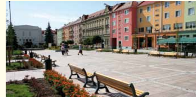
Současný pohled na náměstí v Novém Bohumíně. Tak dziś wygląda rynek w Nowym Boguminie.

V roce 1997 slavila nejnovější městská část Nový Bohumín 150 let od svého vzniku a současně si Bohumín připomněl stejné výročí od příjezdu prvního vlaku. Rok 1997 se však nesl nejen ve znamení oslav, ale také katastrof. Začátkem července totiž postihla Bohumín ničivá tisíciletá povodeň, kdy v některých oblastech dosahovala voda až do výše 2,2 metru a zasáhla většinu města. Pod vodou byly nejen městské části kolem řek Odry a Olše, ale také centrum včetně náměstí T. G. Masaryka, kde hladina vody vystoupila do výšky 80 centimetrů. Tato novodobá historie zanechala na dlouhou dobu v obyvatelích hraničního města nepřijemné vzpomínky. Přesto se však město s povodněmi dokázalo vypořádat a po této katastrofické události rozkvetlo. Povodně ve městě udeřily od té doby několikrát znovu, nejvíce však v květnu roku 2010, kdy do města vtrhla stoletá voda. Mezitím však přibyla část protipovodňových hrází, takže škody nebyly tak velké jako v roce 1997.