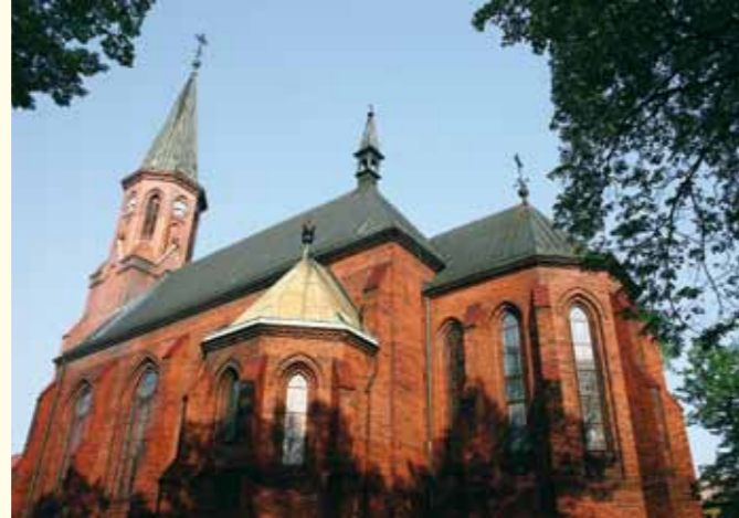
Novogotický kostel Božského Srdce Páně v Novém Bohumíně. Neogotycki kościół Najświętszego Serca Jezusowego w Nowym Boguminie.

Novogotická římsko-katolická kostelní stavba z červených neomitaných cihel, tzv. typ backsteingotiky, začala vznikat v roce 1892 a dokončena byla v roce 1894. Kostel ale nestačil pojmut neustále stoupající počet věřících, takže už 50 let po jeho existenci se začalo uvažovat o jeho rozšíření o dvě boční lodě. K tomu však kvůli politické situaci v zemi nedošlo. Kostel je od roku 2002 kulturní památkou.