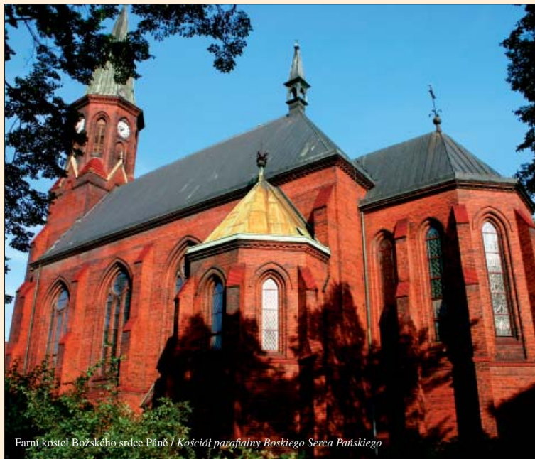
Farní kostel Božského srdce Páně / Kościół parafialny Boskiego Serca Pańskiego

Národní dům čp. 37 je příkladem výstavného městského hotelu z počátku 20. století s velmi kvalitní secesní architekturou.