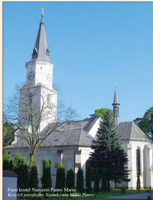
Farní kostel Narození Panny Marie / Kościół parafialny Narodzenia Marii Panny

Kościół parafialny Boskiego Serca Pańskiego. Pseudogotycki kościół katolicki Boskiego Serca Pańskiego z czerwonych cegieł był budowany w latach 1892 - 1895. Chodzi o budowlę jednonawową z jednolitym wnętrzem. Wieża kościoła razem z krzyżem mierzy 53 metry.