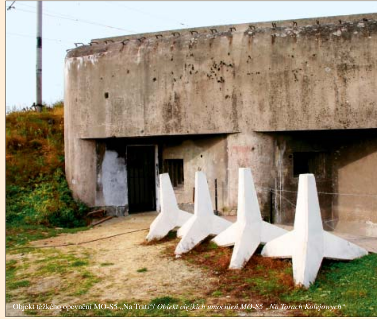
Objekt těžkého opevnění MO-S5 „Na Trati“ / Objeť těžkých umocnění MO-S5 „Na Torach Kolejových“

z 1. polowy XIX wieku z polichromowanego piaskowca. Kaplica choleryczna na terenie cmentarza epidemiologicznego. 19 Pochodzi z 1831 roku, kiedy wybuchła wielka epidemia cholery. W roku 2004 kaplica po rekonstrukcji została ponownie poświęcona i nazwana Kaplicą Aniołów Stróżów (pierwotnie Kaplica Marii Panny Bolesnej). Rzeźba św. Jana Nepomucena. 20 Pochodzi z 2. polowy XVIII wieku i jest wyrazistym elementem wpływającym na wygląd rynku. Jej podstawa