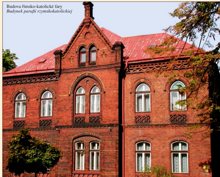
Budova římsko-katolické fary / Budynek parafii rzymskokatolickiej