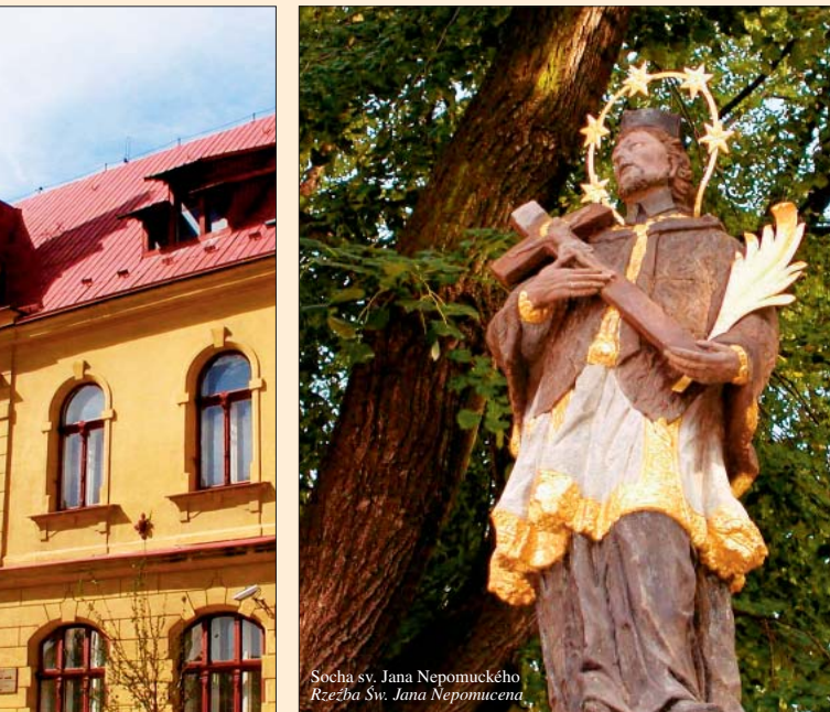
Socha sv. Jana Nepomuckého / Rzeźba św. Jana Nepomucena