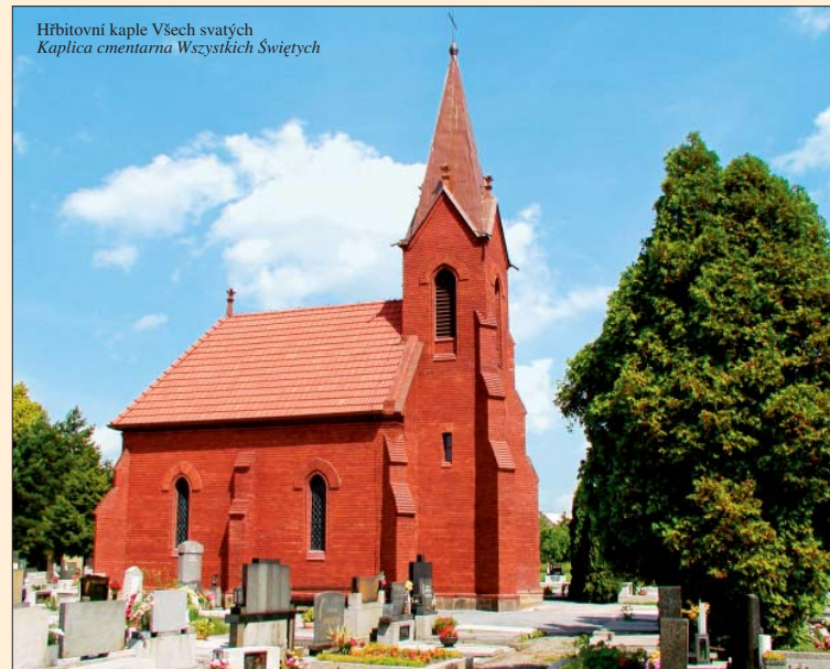
Hřbitovní kaple Všech svatých / Kaplica cmentarna Wszystkich Świętych

szczególny, który został zgłoszony na listę zabytków kultury. Klub Historii Wojskowej Bogumin, www.mos-5.wz.cz