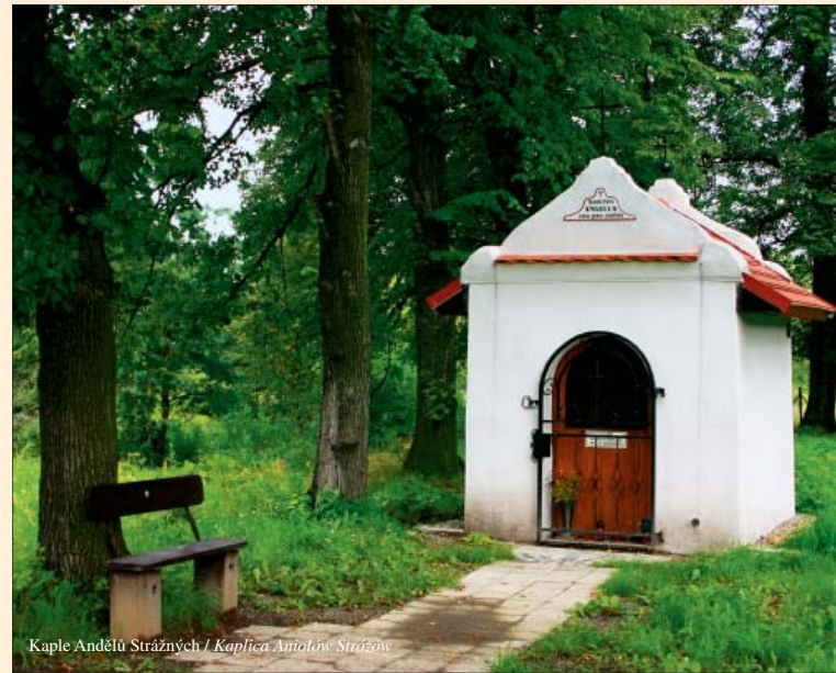
Kaple Andělů Strážných / Kaplica Aniołów Stróżów

Kaplica zwana Pustelníá. 21 Niewielka budowla barokowa za cmentarzem w Starým Boguminie pochodzi z połowy XVIII wieku. Jak prawi legenda, została wybudowana przez dwu bogumińskich mieszczan, którzy wiedli w niej pustelniczy život. Grobowiec hrabiów Henckelów z Donnersmarcku. 22 Niewielka dwukondygnacyjna budowla barokowa pochodzi z 1752 roku, w XIX w. została przebudowana. Obok grobowca stoi rzeźba św. Józefa, ludowa praca kamiennarska