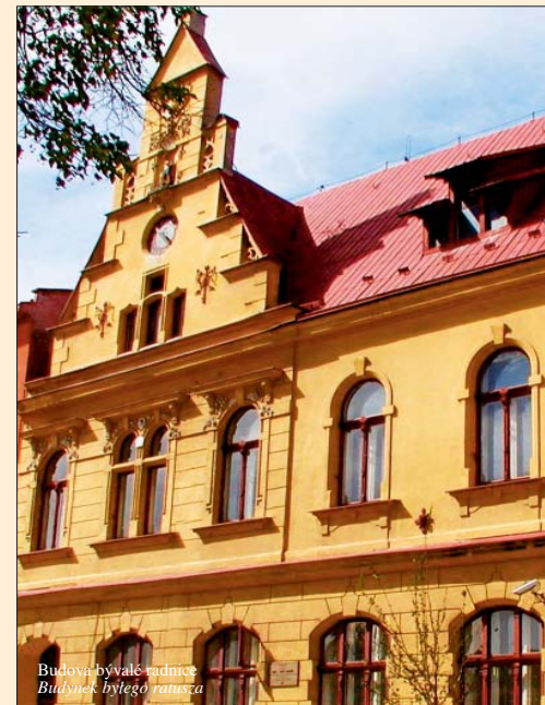
Budova bývalé radnice / Budynek byłego ratusza