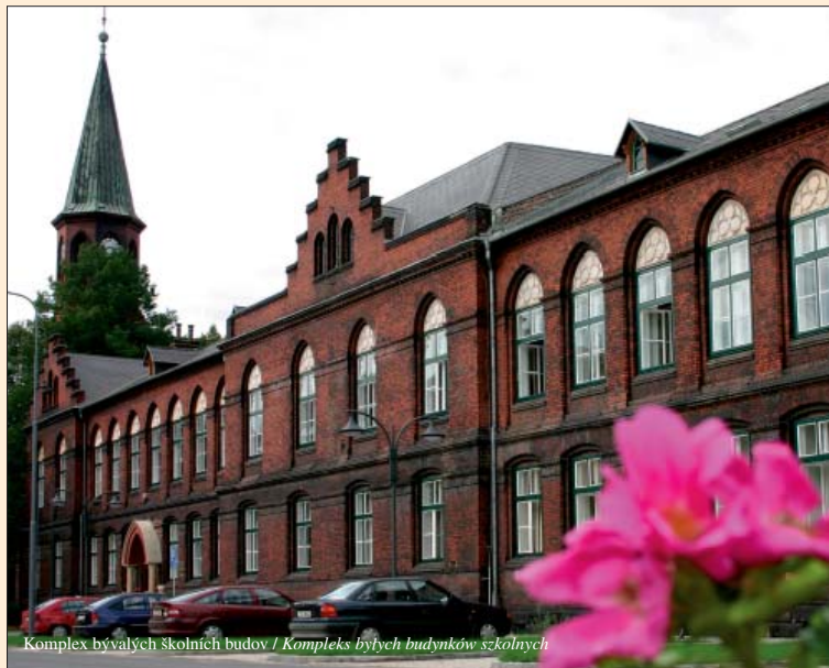
Komplex bývalých školních budov / Komplex byłych budynków szkolnych