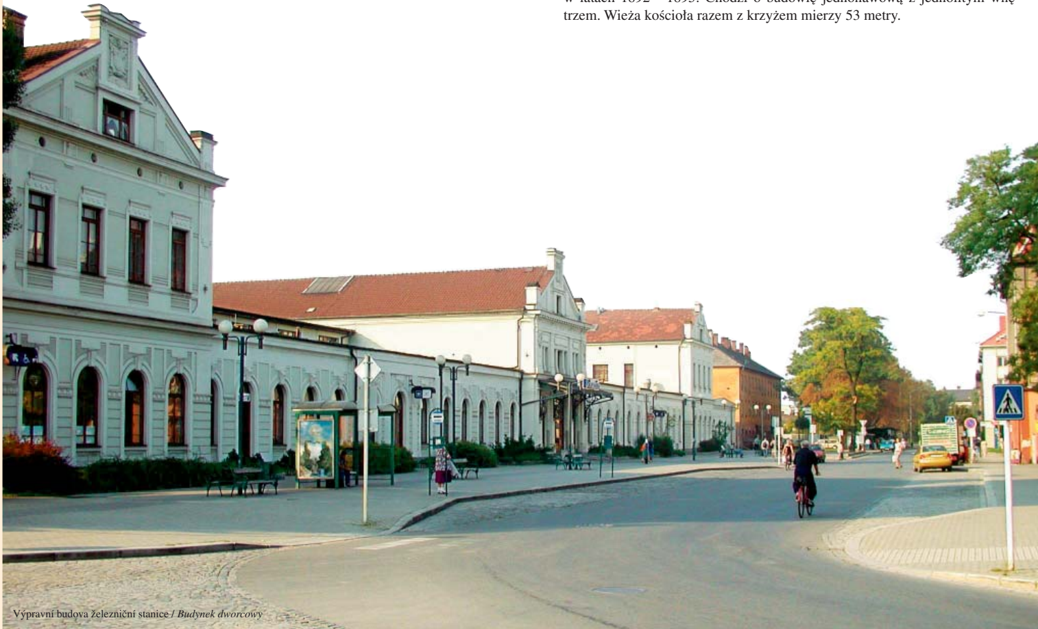
Výpravní budova železniční stanice / Budynek dworcowy

V Záblatí Na Pískách se nachází jedinečná památka v rámci ČR, která nás informuje o osídlení a životě populace v období ústupu poslední doby ledové. Datování - 10. a 9. tisíciletí př. n. l.