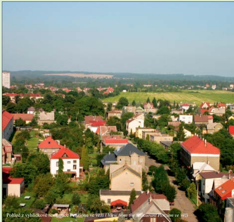
Pohled z vyhlídkové restaurace Penzionu ve věži / View from the restaurant Penzion ve věži

Klub vojenské historie Bohumín, 604 148 470, www.mos-5.wz.cz