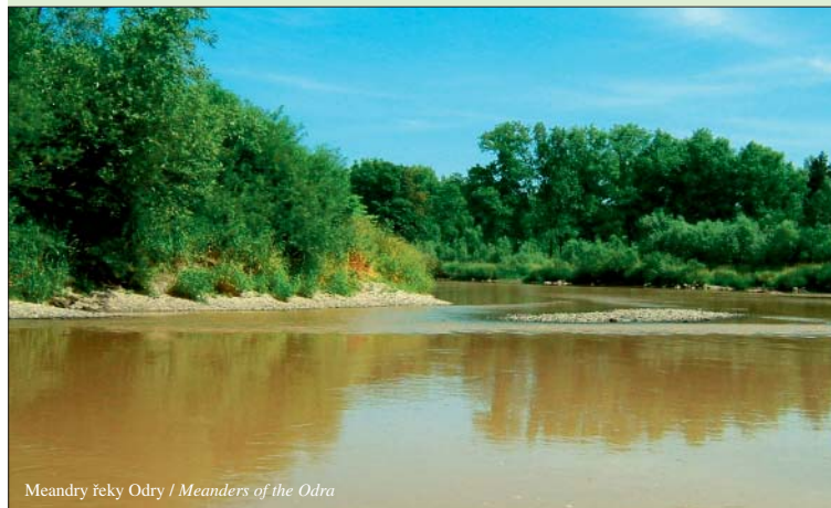
Meandry řeky Odry / Meanders of the Odra