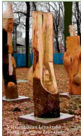
Výtvarná díla z Léto-kruhů Works of art from Léto-kruhy

The Cholera Chapel commemorates the disease epidemic which killed almost two hundred people in Starý Bohumín in 1831. Občanské sdružení Maryška (the