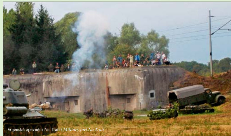
Vojenské opevnění Na Trati / Military fort Na Trati

civic association) takes care of its maintenance and repairs its surroundings. The place is accessible to the public.