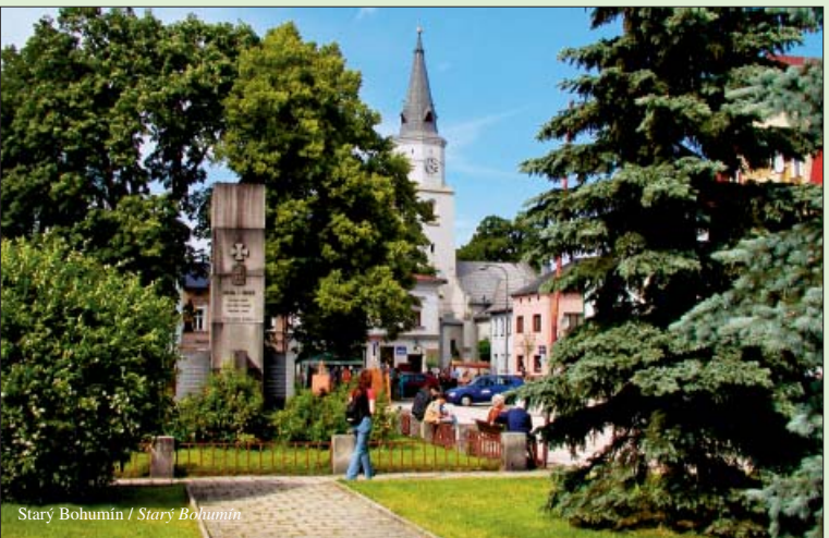
Starý Bohumín / Starý Bohumín Spolufinancováno ze Společného regionálního operačního programu (SROP) a Moravskoslezského kraje. Vydalo Město Bohumín v roce 2006.