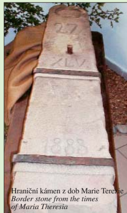
Hraniční kámen z dob Marie Terezie Border stone from the times of Maria Theresia