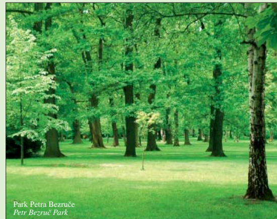
Park Petra Bezruče Petr Bezruč Park