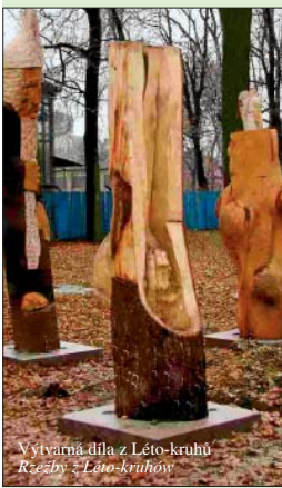
Wytwórnia dzieł z Léto-kruhów Rzeźby: „Léto-kruhów“

Kaplica choleryczna przypomina o epidemii zarazy, która w Starym Boguminie w 1831 roku zabiła prawie dwieście osób. Zrzeszenie obywatelskie „Maryška“ zajmuje się jej konserwacją i porządkowaniem najbliższej okolicy. Udostępniona do zwiedzania.