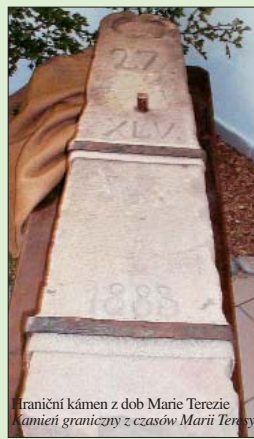
Hraniční kámen z dob Marie Terezie Kamień graniczny z czasów Marii Teresy