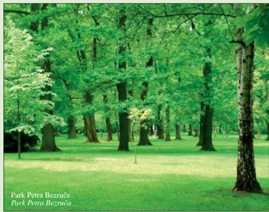
Park Petra Bezruče Park Petra Bezruča