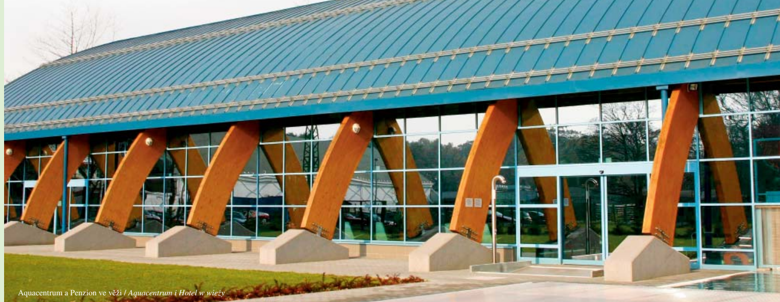
Aquacentrum a Penzion ve věži / Aquacentrum i Hotel w wieży

Hobby park 📍 - miejsce ogólnie dostępne. W pobliżu stadionu zimowego, w parku znajduje się centrum zabaw dla dzieci Hobby Park z mnóstwem atrakcji - od wielkiej karuzeli dla dzieci, przejazdów, drabinek, zjeżdżalni linowej, poprzec huštawki i wodny świat aż po karuzelę z lian dla młodzieży.