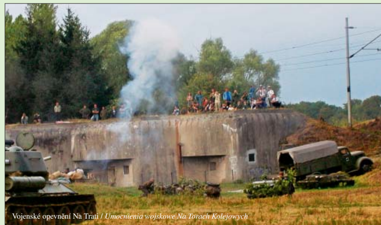
Vojenské opevnění Na Trati / Umocnienia wojskowe Na Torach Kolejowych

Wiele innych budowli w mieście znajduje się na liście zabytków kultury – patrz publikacja „Bohumín zajímavě“.