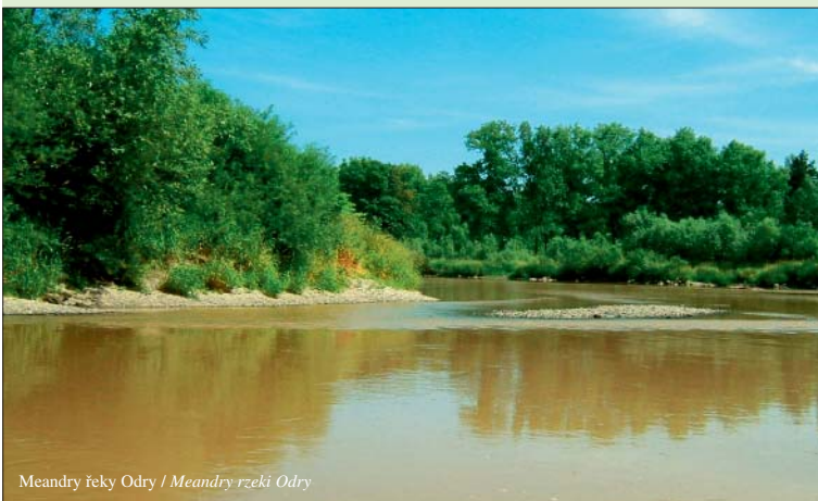
Meandry řeky Odry / Meandry rzeki Odry