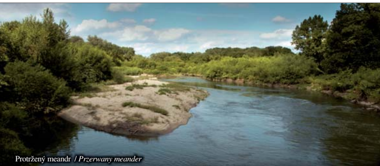
Protřzený meandr / Przerwany meander

Z pająków chronionych żyje tutaj duży paják wymyk szarawy . Ten paják nie tworzy pajęczyn, ale poluje przy wedrówkach na żywirnych ławicach. W meandrach żyje 62 gatunków pająków. Bardzo rzadki jest chrząszcz zgniotek cynobrowy i chrząszcz pachnica dębowa , którzy żyją w spróchniałych, starych drzewach. Do rzadkich chrabąszczů zaliczamy też biegacze . Lasy łęgowe i mokradła są siedliskiem 28 gatunków wažek, niektóre to rzadkie okazy. Występują tu szablak południowy , gadziogłówki itp. Żyje tu również 41 gatunków motýli dzienních, włącznie dużých i kolorowych gatunków – paź królowej , pokłonník osinowiec , mieniák tęczowiec i mieniák stružník . Lata tu również czerwończyk nieparek . Pojawia się tu pawica gruszówka . Jest to największy europejski motýl, rozpície jego skrzydełek wynosi do 15 cm.