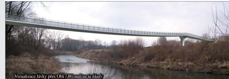
Vizualizace lávky přes Olši / Wizualizacja kładki

Kontakt: Město Bohumín, Masarykova 158 tel.: +420 596 092 111, 737 596 092, 732 596 092 e-mail: info@mubo.cz • www.mesto-bohumin.cz Občanské sdružení Hraniční meandry Odry, Sokolovská 90, Starý Bohumín (ZŠ) tel.: +420 608 766 556 e-mail: hran.meandry@seznam.cz • www.meandryodry.wz.cz Gmina Krzyżanowice, ul. Główna 5, 47-450 Krzyżanowice tel.: +48 (32) 419 40 50, 419 40 51, 419 42 13 e-mail: ug@krzyzanowice.pl • www.krzyzanowice.pl Gmina Gorzyce, ul. Kościelna 15, 44-350 Gorzyce tel.: +48 (32) 45 13 056 • e-mail: gorzyce@gorzyce.pl • www.gorzyce.pl