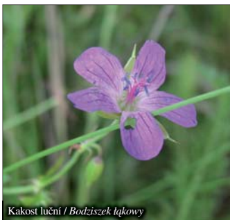
Kakost lužní / Bodziśczek łąkowy