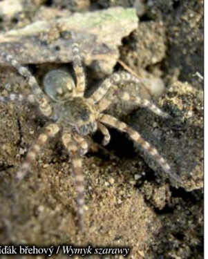
Slídká břehovy / Wymyk szarawy

Najważniejszym powodem ochrony obszaru chronionego Graniczne meandry Odry jest naturalny zachowany odcinek rzeki Odry z unikatowymi procesami korytotwórczymi. Podobne odcinki rzek w środkowej Europie są już bardzo rzadkie. Dla zachowania przyrody w jak najlepszym stanie powstał plan ochrony na okres 2006–2017, w którym są uregulowane warunki działalności człowieka na tym obszarze. Miasto Bogumín chce teren meandrów wykorzystywać sportowo i rekreacyjnie. Rzeki Odry i Olza staną się częścią między-narodowej trasy sportów wodnych – kajakowych. Stowarzyszenie obywatelskie Graniczne meandry Odry z Bogumina poza tym planuje wybudowanie ścieżki krajoznawczo-przyrodniczej z informacjami