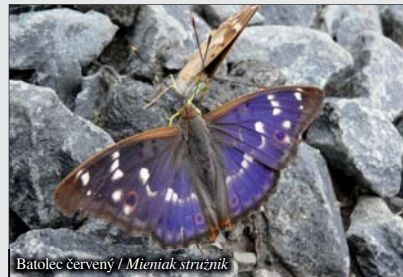
Batolec červený / Mieniák stružník