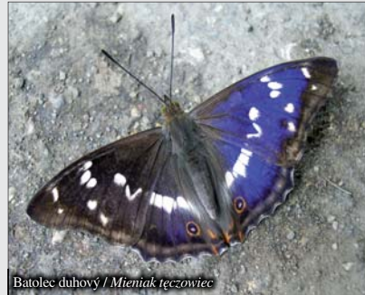
Batolec duhový / Mieniák tęczowiec