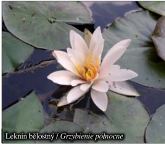
Leknín bělostný / Grzybieńe północne