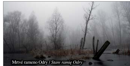
Mrtvé rameno Odry / Stare ramię Odry