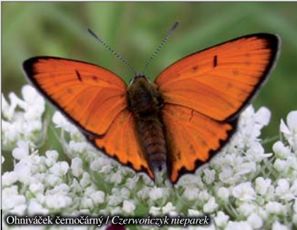
Ohniváček černočárny / Czerwończyk nieparek