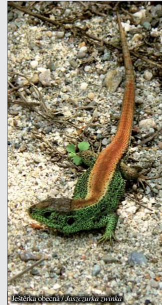
Ještěrka obecná / Jaszczurka zwinła