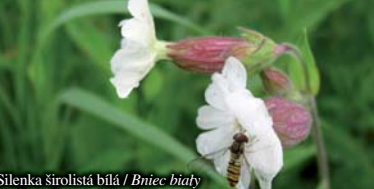
Silenka širolistá bílá / Bniec biały