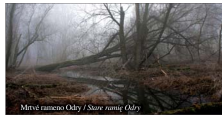
Mrtvé rameno Odry / Stare ramię Odry