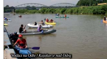
Vodáci na Odře / Kajakarce nad Odrou

Wspólnie z polskimi partnerami - Krzyżanowicami i Gorzycami, przygotowuje miasto Bogumín już trzy projekty współpracy trans granicznej. Pierwszy projekt to połączenie historycznej części Starego Bogumina z gminą Chalupki. Celem tego projektu jest odnowa historycznego traktu – drogi, między Czechami a Polską. Drugi projekt nazwany "Czerwiec - miesiąc przyjaźni na spływie Odry i Olzy", chce obie rzeki udostępnić dla sportów wodnych, a konkretnie spływów kajakowych. Popularyzacja spływów kajakowych i granicznych meandrów Odry przy ujściu Olzy do Odry, będzie pomagać w zbliżeniu mieszkańców okolic granicznych rzek. Trzeci projekt pt. "Mamy do siebie bliżej" ma za cel zbudowanie kładki dla pieszych i rowerzystów przez rzekę Olzę. Miasta w ten sposób chcą faktycznie zbliżyć do siebie mieszkańców Gorzyc i Bogumina, aby miejscowi ludzie mieli do siebie bliżej, planują miasta zbudować przez graniczną Olzę most.