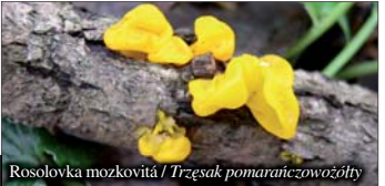
Rosolovka mozkovitá / Trzęsak pomarańczowozółty