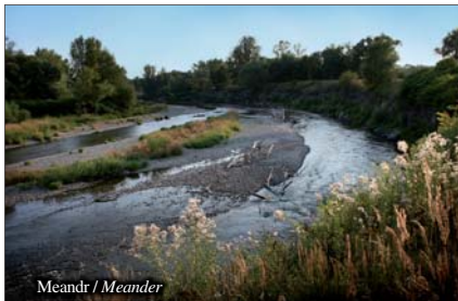
Meandr / Meander