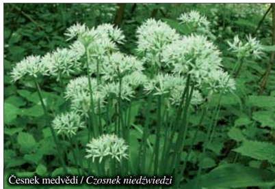
Cesnek medvědí / Czosnek niedźwiedzi