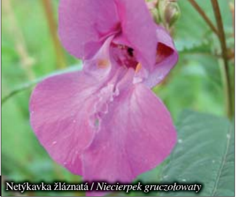
Netykavka žláznatá / Niecierpek gruczołowaty

Przy badaniach, które miały na celu ochronę obszaru granicznych meandrów Odry, wykonanych w 2004 roku, było zarejestrowano tutaj 297 gatunków roślin. Nie jest to jednak stała, ostateczna ilość. Dzięki czystemu powodziom do meandrów dostają się ciągle nowe gatunki roślin. Niektóre znajdują tu dla siebie przyjazne środowisko i mogą się dalej rozwijać. Inne rodzą się pojawiają się tu przypadkowo i na krótki czas. Dla istnienia cennych siedlisk i ekosystemów w leżącym najniżej meandrującym odcinku Odry jest najważniejsze aby nie budować i nie zmieniać naturalnego toku rzecznoego systemu. Najważniejsze aby nie doszło do ingerencji technicznej np. budowy śluz czy kanału, albo prostowania brzegów. Brak ingerencji to jedyny sposób jak zachować i ochronić ten mały powierzchnię, ale ważny i unikatowy obszar na terenie czesko-polskiego pogranicza. Wyjątkowo chronione wodne rośliny, które tu występują są kotewka orzech wodny , jeziora mniejsza , grzybień północne , oczeret jeziorny , łączeń baldaszkowy i zamokrzyca rýžowa .