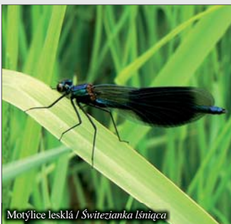
Motýlice lesklá / Swiętozianka lśniąca