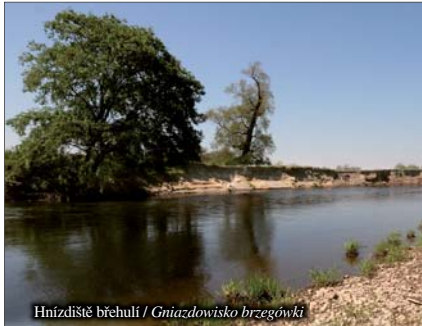
Hnízdiště břehulí / Gniazdlowisko brzegówki