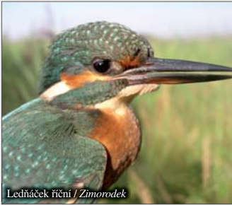
Ledňáček říční / Zimorodek