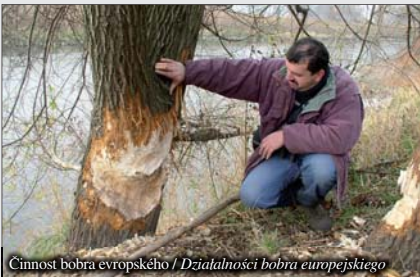
Činnost bobra evropského / Działalności bobra europejskiego