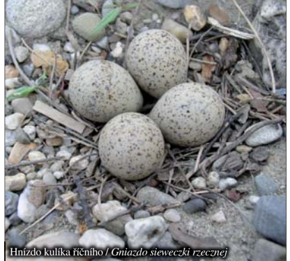
Hnízdo kulíka říčního / Gniazdo sieweczki rzecznej