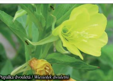
Pupalka dvouletá / Wiesiołek dwuletni