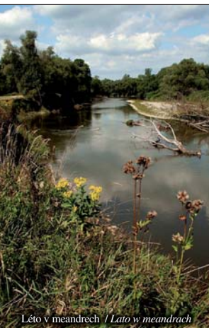
Léto v meandrech / Lato w meandrach