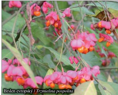
Brslen evropský / Trmielina pospolita