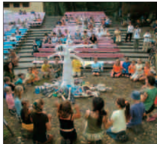
▲ Loňské Bohumínské léto-kruhy měly řadu doprovodných programů - pro děti třeba „prožitkovou dílničku“