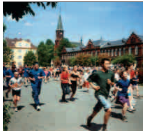
▲ Květnový běh ulicemi Bohumína startuje na náměstí T. G. Masaryka, kde se rok od roku schází víc a víc běžců.