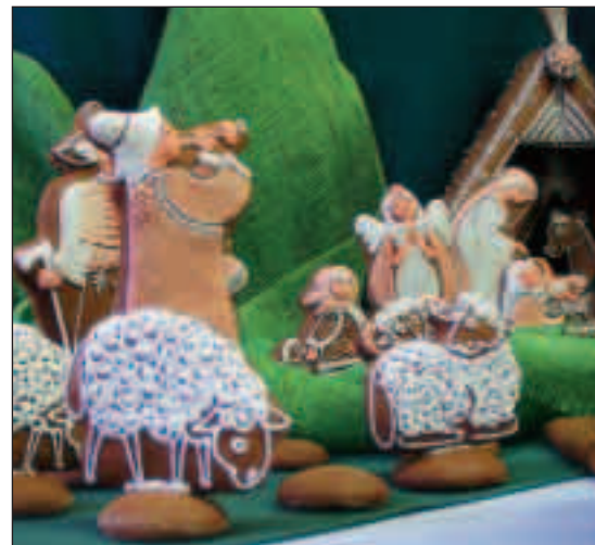
▲ Tradiční výstava K.A.R. v perníku už dýchá poezií Vánoc - nechejte se inspirovat...

ZLATA, STŘÍBRA JAKO Z POHÁDEK, NABÍZÍ VÁM OVÁDEK