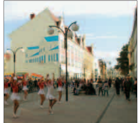
▲ Taneční show mažoretek spolu s koncerty dechovky, které na pěší zóně pravidelně pořádá K.A.R., se divákům líbí.