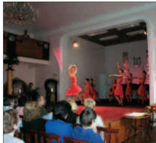
▲ Koncerty žáků Základní umělecké školy jsou pořádány v krásném prostředí koncertního sálu ZUŠ.