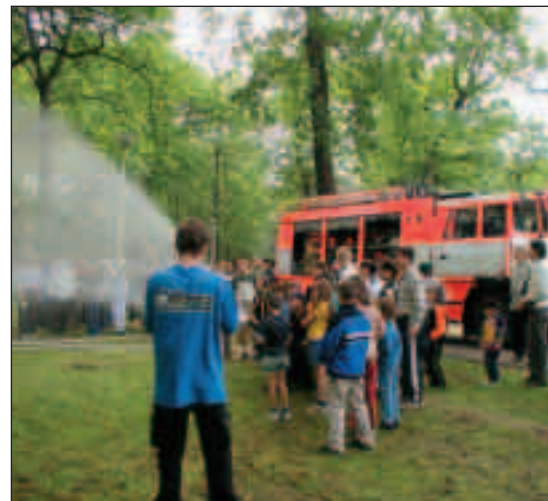
▲ HASIČI DĚTEM - tak zní název akce, kterou každoročně připravují hasičské jednotky města dětem k svátku.