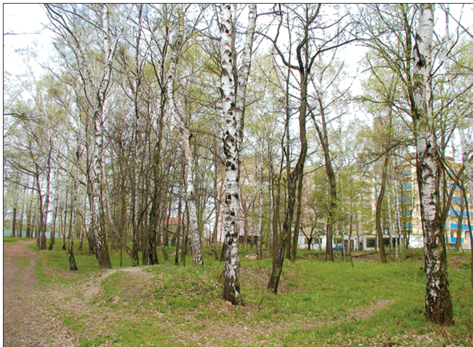
▲ Rafinérský lesík by se mohl stát odpočinkovou zónou v centru města.