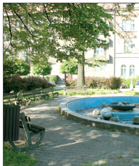
▲ Takhle vypadá okolí kina v současnosti.

V plánu jsou nové, širší chodníky kolem budovy kina, výsadba nové zeleně, nový vodní prvek v místě původního. Vyrostou také nová parkovací stání na Studentské ulici a Masarykově ulici - celkem 12.