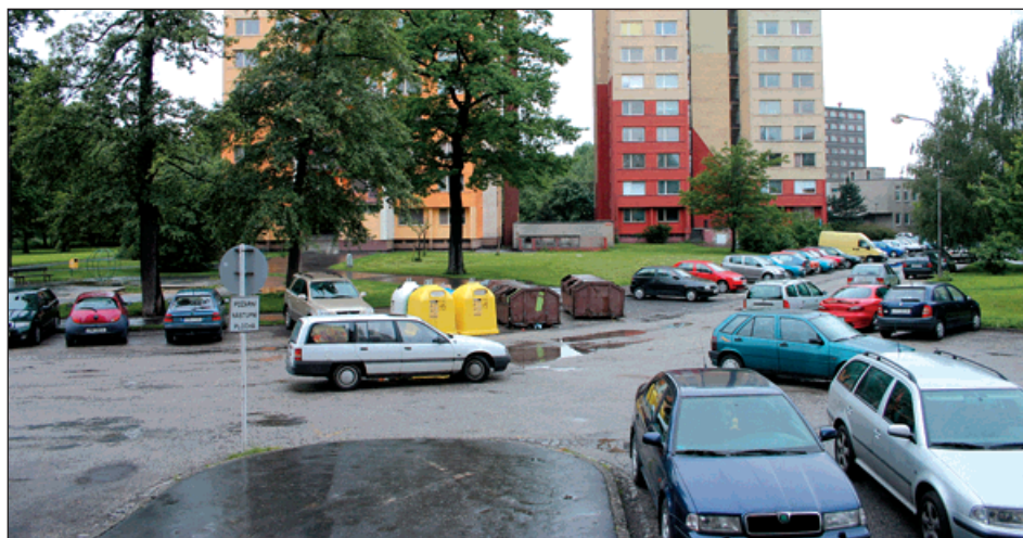
▲ Regenerace sídliště Sv. Čecha přinese mimo jiné i rozšíření parkovacích stání.

Týká se sídliště na Nerudově ulici a sídliště na ulici Svatopluka Čecha. V rámci regenerace dojde k vybudování nových parkovišť (u hotelového domu a na ulici Sv. Čecha celkem 120 stání) a k úpravě veřejného prostranství. Budou vybudovány nové chodníky, provedena výsadba zeleně a živých plotů, nainstalováno nové osvětlení, mobiliář (lavičky, odpadkové koše). Na Tovární ulici se vybudují nová parkoviště s kapacitou 48 míst.