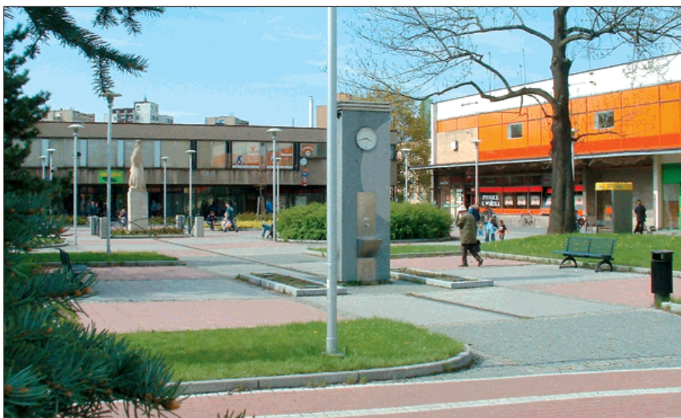
▲ »Dům služeb« kazí dojem z krásně upraveného náměstí Budoucnosti.

Celková rekonstrukce objektu a jeho dostavba rozšiřující jeho užitkové plochy dotvoří celkový vzhled náměstí Budoucnosti. Na tomto prostranství je to poslední městský objekt, který čeká na svou renovaci. Zadní strana směrem k poliklinice by měla být dořešena výkladci nebo okny a rampa by měla zmizet. Objekt by měl být i po rekonstrukci využíván k poskytování služeb.