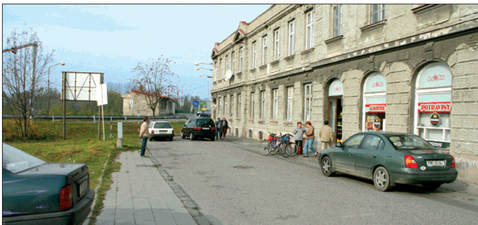
▲ Zaslepená ulice u Národního domu bude znovu propojena s mostem.