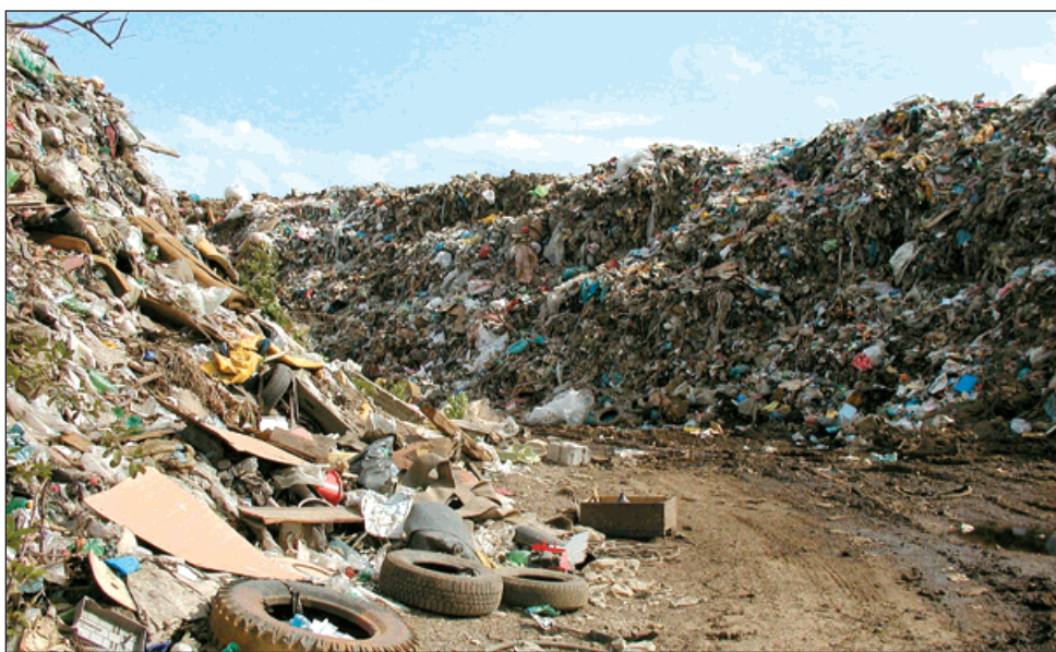
▲ Druhá etapa skládky už dosluhuje. Její životnost skončí v roce 2008.

Dostavba kanalizace v městských částech. Výstavba 12 čerpacích stanic a 25 km kanalizačních stok, které odvedou splaškovou vodu do čistírny odpadních vod v Šunychlu. Stavba je koordinována v rámci sdružení devíti obcí Karvinska (mikroregion Poolší). Město bude žádat o dotaci z EU. Výstavba by probíhala po dobu 5 let.