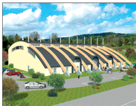
▲ Vizualizace návrhu sportovní víceúčelové haly.

Sportovní hala pro míčové, sálové a kolektivní hry pro veřejnost i sportovní kluby a oddíly je situována do prostranství současného kynologického hřiště a doplní sportovně společenský areál v parku.