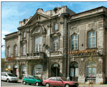
▲ Budova Národního domu ve Starém Bohumíně.