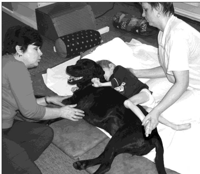
▲ Polohování dítěte a psa je to nejlepší, co canisterapie nabízí.

Ve stacionáři se při cvičení se psem Julou vystřídalo v průběhu týdne třináct dětí. Individuální terapie probíhala po dohodě terapeutky s rodiči. Ve skupinové terapii se děti vždy střídaly při hře. Házely Julie míček, schovávaly se, aby je musela najít, česaly ji kartáčem nebo jí na otevřené dlani nabízely granuli. Nakonec da-