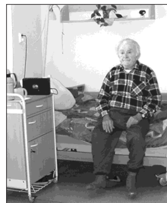
▲ Mezi potřebné sociální služby patří určitě i zkvalitňování péče o seniory.

Z výše uvedených důvodů bude dne 23. března v 16.00 hodin ve velkém sále MěÚ v Bohumíně uspořádána konference na téma Komunitní plánování sociálních služeb města Bohumína s přístupem široké veřejnosti.