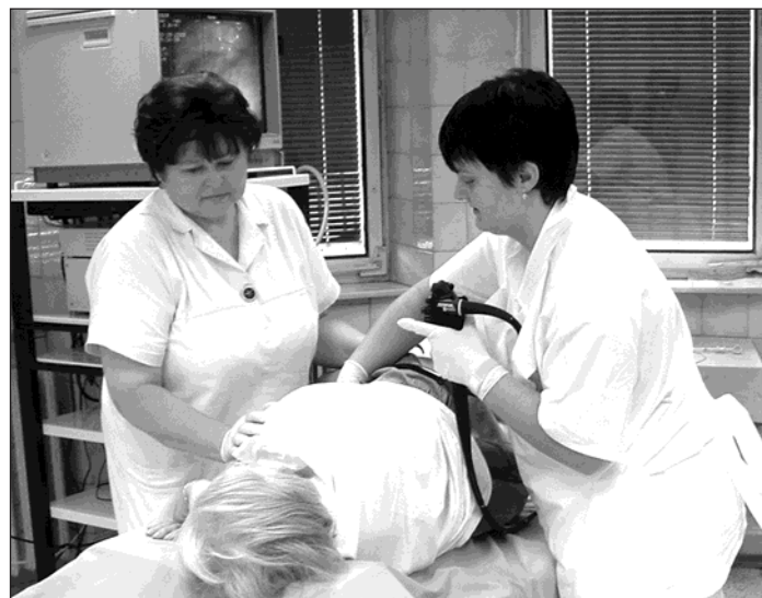
▲ Kolonoskopické vyšetření tlustého střeva na interním oddělení Bohumínské městské nemocnice.