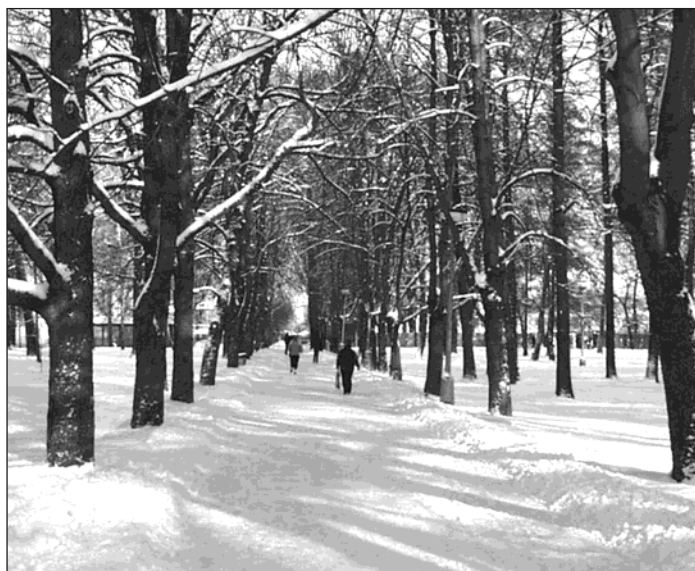
▲ Park Petra Bezruče má své nesporné kouzlo i v zimě. Vznikl v roce 1907 v místě bažantnice hraběte Larische. V příštím roce tomu bude 100 let.

Potenciálně nebezpečných stromů je v parku bohužel více. Nejakutnější je v současné chvíli starý dub s vyhnílou dutinou uvnitř kmene, do které se dostala voda. Vlivem letošních mimořádných mrazů