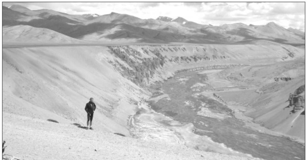
▲ Řeka Indus vytváří v pohoří hluboký kaňon.

Všichni vyrazili na asi patnáct kilometrů dalšími roletkami. Po dvanácti kilometrech jízdy přichází protivítr, zatím se to ale dá. V protisměru mě mívají motocyklisté, všichni troubí a mávají, já jsem schopna jen apaticky zvednout ruku jako odpověď na pozdrav. Cesta vede dále, ale už zdaleka ne jenom asfalt, ale i horší povrch. Čím dál víc mě napadá popěvek z Krylovy písničky »Cesta je prach a štěrka a udušaná hlína...« Můj koleg, kteří doplňují tekutiny i energii při svých střevních potí-