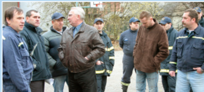
▲ Schůzka velitelů hasičských družstev v terénu.