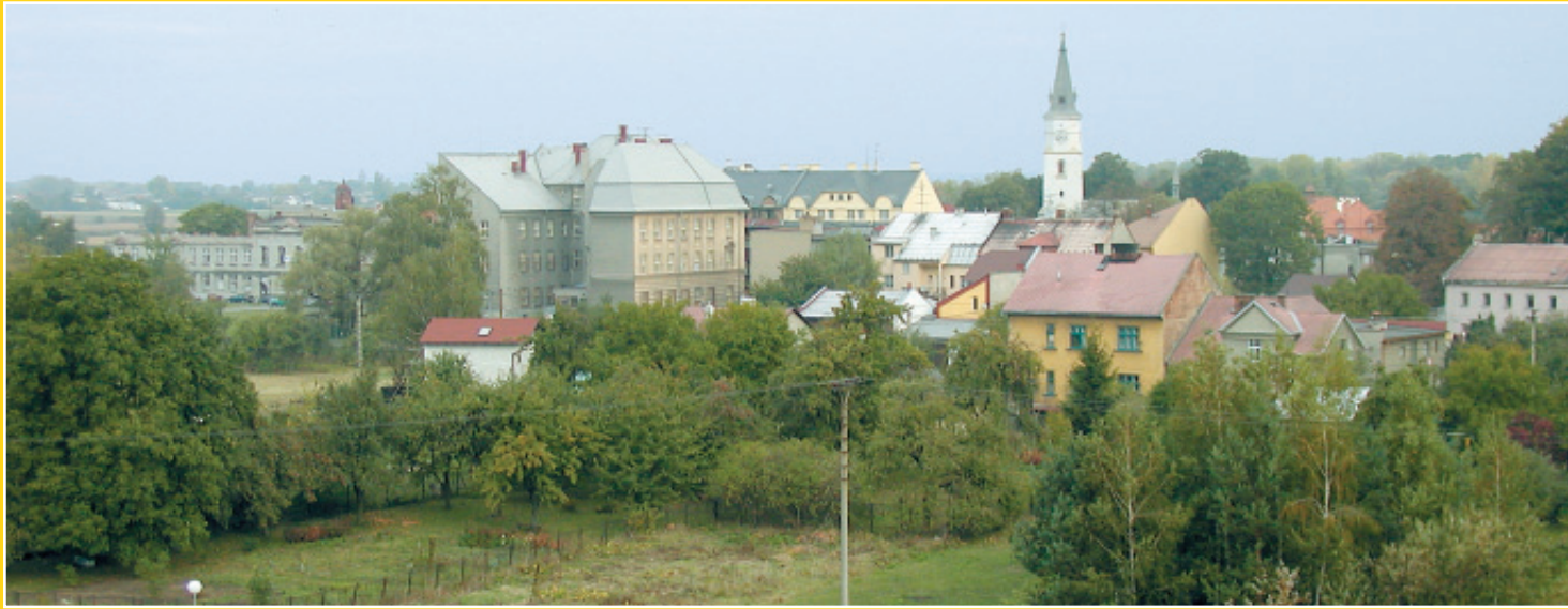
▲ Pohled na Starý Bohumín z věže hřbitovní kaple. Byla postavena v roce 1901 a rekonstruována v roce 2003. Letos byla kaple Všetech svatých prohlášena kulturní památkou.