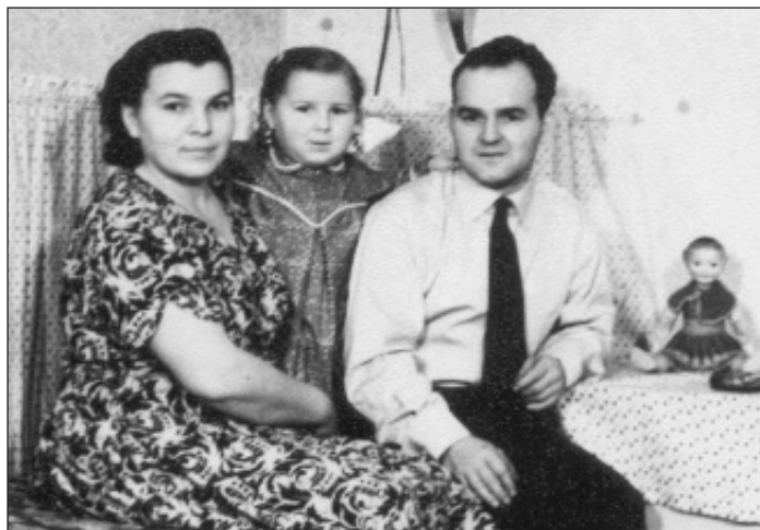
▲ Každodenní život padesátých let v koloniálním domě č. 269.

Historický kalendář připravil Jan F. TEISTER