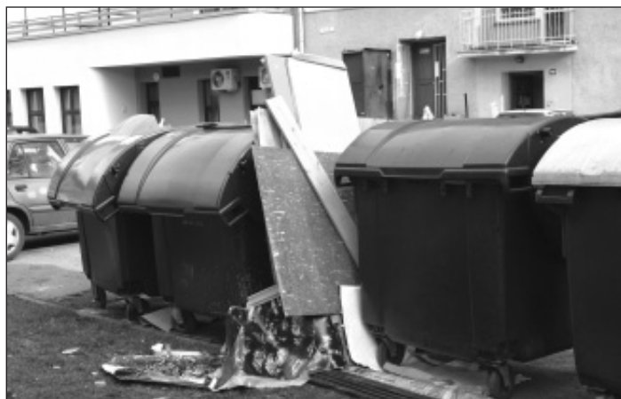
▲ Ve sběrném dvoře odevzdáte tento odpad bezplatně. Nebo chcete raději platit vysokou pokutu?

své povinnosti zjednoduší na své pohodlí. Nešvar, odkládat starý nábytek k popelnici před domem, nebo dokonce k sousedům, je považován za založení černé skládky a podle toho také pokutován. Sběrný dvůr přijímá odpad bezplatně, pouze je nutné prokázat bydliště ve městě, nejlépe občanským průkazem. (red)