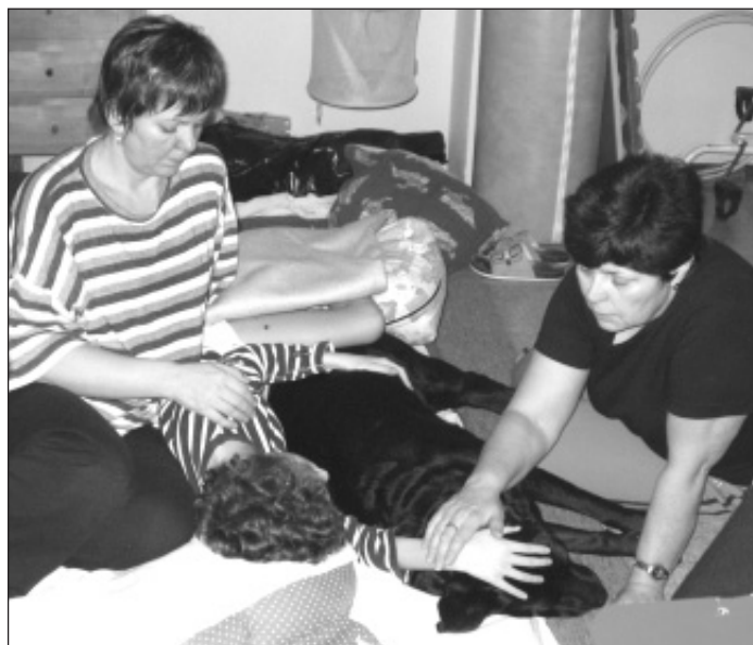
▲ Individuální terapie využívá nejtěsnějšího kontaktu dítěte se psem.

Skupinová terapie se na rozdíl od terapie individuální týká vzájemné práce mezi psem a skupinou dětí. Uprostřed týdne si děti hrály společně