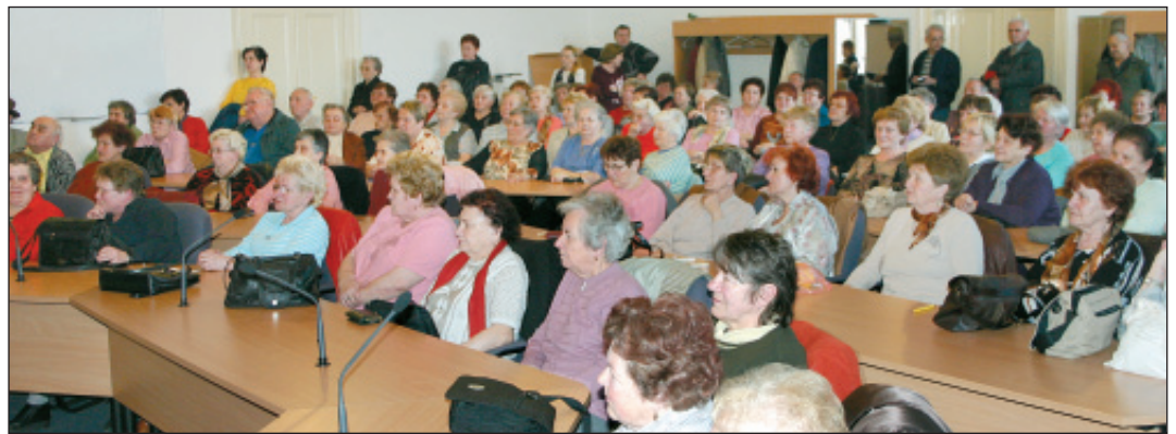
▲ Zatím se stále početnější skupina seniorů schází střídavě na radnici (foto z posledního setkání 14. března) nebo v Kassi klubu.