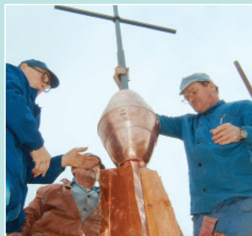
▲ Do bány na věži kaple bylo při rekonstrukci v roce 2003 uloženo poselství příštím generacím.

Oproti původnímu návrhu Národního památkového ústavu Ostrava nebyl za součást této