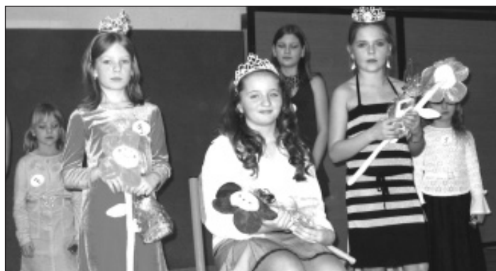
▲ Ve Skřečoni volí miss mezi mladšími začkami.