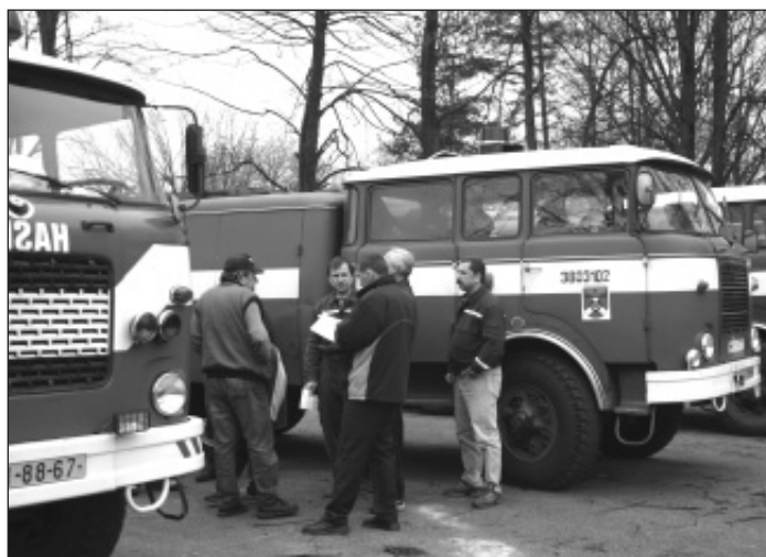
▲ Velitelé jednotek se s cisternami sjeli na jedno místo, aby společně posoudili technický stav vozidel a navrhli přesun cisteren v rámci jednotek v Bohumíně po dokončení nové stříkačky.

Město vzhledem ke stáří hasičského vozového parku usiluje o získání dotací od HZS již několik let. V rozpočtu roku 2007 byl výdaj na nové auto veden tzv. pod čarou a v okamžiku přiznání dotace bylo komisí pro komplexní rozbor doporučeno vyčlenit z finanční rezervy města částku tří milionů korun. Poslední slovo