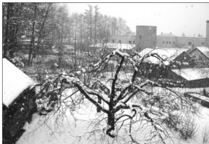
▲ První jarní ráno ve Skřečoni bylo hodně netypické - ostatně stejně jako celá letošní zima.

● Byt na ulici Sv. Čecha 1093, 1+3, kategorie I., číslo bytu 66, 12. nadzemní podlaží. Celková plocha 69,80 m 2 , pro výpočet nájemného 67,35 m 2 . Prohlídka bytu 17.4. od 9 do 9.30 hodin. Licitace se koná 18.4. v 16 hodin. (vac)