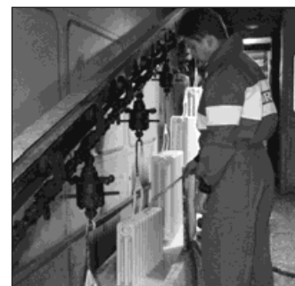
▲ Máčení radiátorů v závodě Viadrus.

Export závodu za šest měsíců dosáhl 426 milionů korun, což je nárůst o 22 milionů ve srovnání s prvním pololetím loňského roku. (žel)