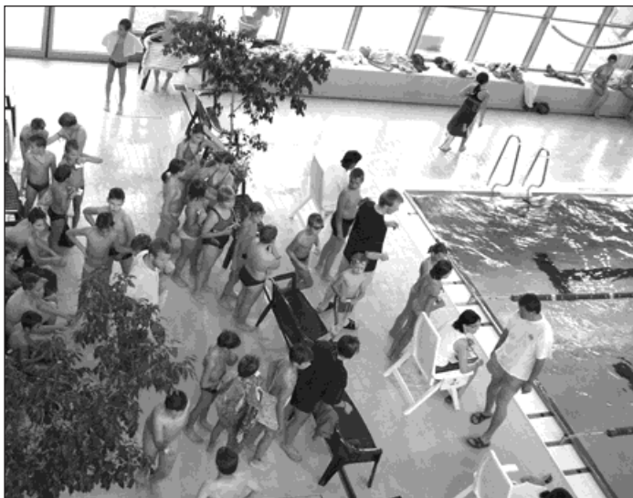
▲ Účast v loňském ročníku plavání byla pro naše město premiérou.

Jedná se o soutěž, která je určena pro rekreační plavce všech věkových kategorií. V den konání bude bohumínském aquacentrum po celý den zdarma přístupné těm, kteří si přijdou zaplavat na čas trať 100 metrů jakýmkoli plaveckým stylem. Dosažené výkony pořadatelé ohodnotí podle bodovacích tabulek, přizpůsobených věku a pohlaví. Organizátoři mohou zařadit mezi účastníky i ty zájemce, kteří ne-