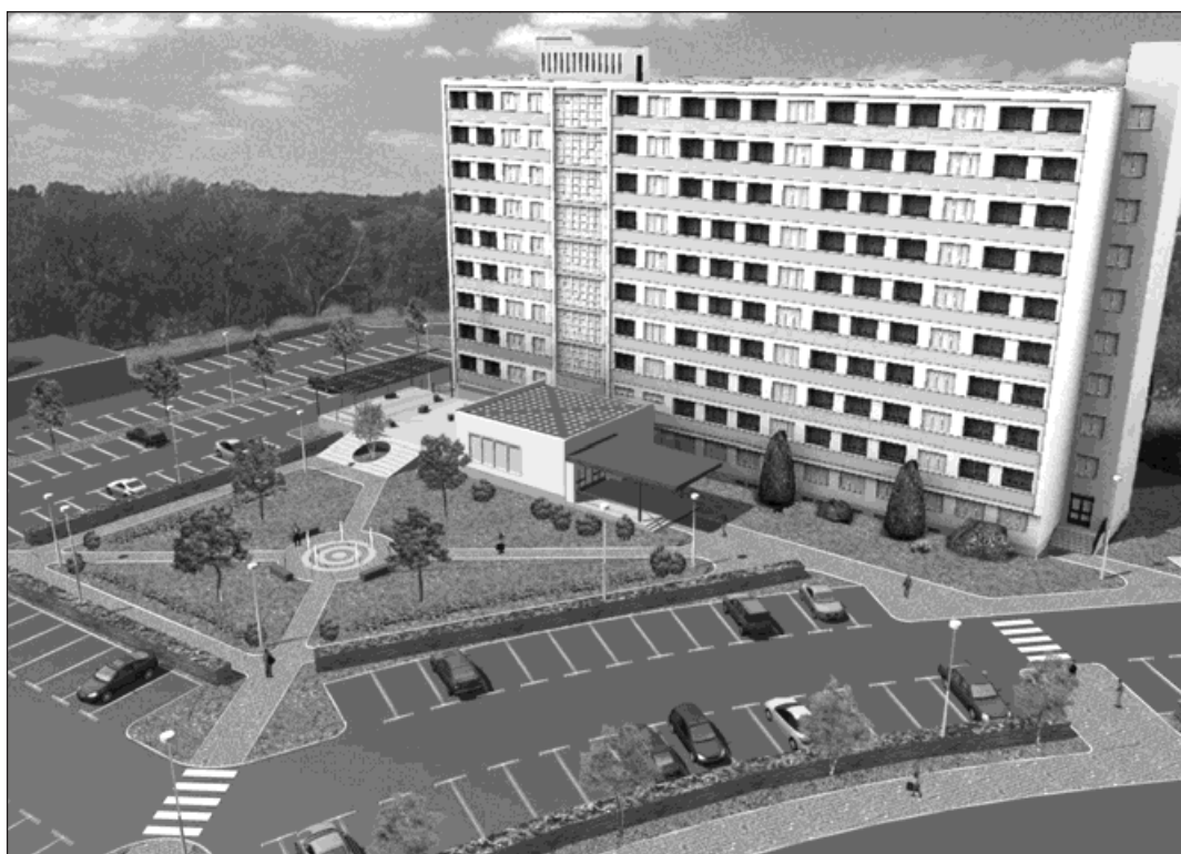
▲ Demolice nebytové části domu č. 716 na Okružní ulici otevře pohled do právě modernizovaného sídliště na ulici Svatopluka Čecha a usnadní parkování v širokém okolí.