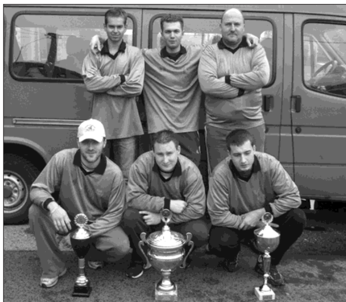
▲ Vrbičtí dobrovolní hasiči jsou k neporažení. Ve dvou závodech za sebou získali dvě prvenství.

Noční soutěž v požárním útoku se konala v Bohuslavicích v okrese Opava 3. srpna. Vrbičtí hasiči zde obhájili již potřetí v řadě prvenství.