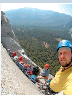
▲ V některém z příštích čísel Oka přineseme nádherné fotky a poutavé vyprávění Pepeho Piechowicze z expedice do národního parku Yosemite v USA.