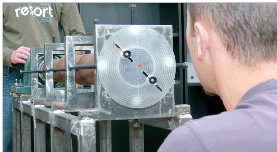
▲ Měření laserem, jedna z metod optických měření.

nostiky strojů, montážních a optických měření a ustavování strojů. Po absolvování získá účastník certifikát o absolvování kurzu. Na základě absolvování cyklu školení v DTI může požádat Asociaci technických diagnostiků o složení zkoušky v daném oboru. Vydaný certifikát má podporu v evropské normě EN 17024 o profesní certifikaci osob a má mezinárodní platnost, takže pracovník bude moci svou profesi vykonávat i v zahraničí. Absolvent všech školení se může uplatnit jako vedoucí technický pracovník v oblasti diagnostiky a optických