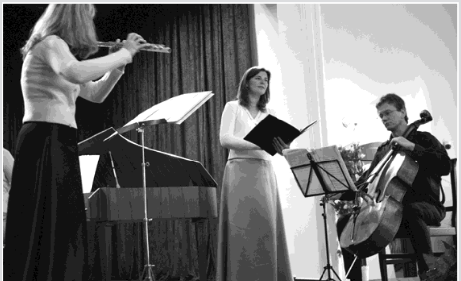
▲ V základní umělecké škole vystoupila pražská formace Lyra de camera s barokní hudbou.