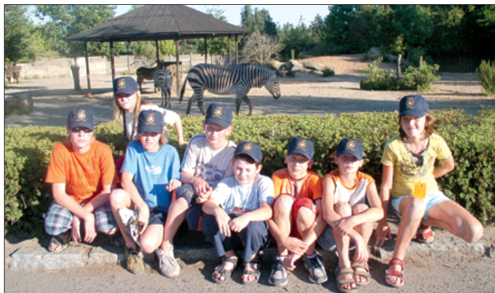
▲ Na safari ve Dvoře Králové se dětem líbilo.

Měli možnost zhlédnout Karlův most, Pražský hrad, Národní muzeum, Petřínskou rozhlednu, letiště Ruzyně, Staroměstské i Václavské náměstí. Navštívili centrální stanici hasičského záchranného sboru hlavního města, pluli na parníku po Vltavě, prošli hrad Karl-