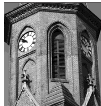
▲ Město přispělo také na opravu žaluzií ve věži kostela.

Po opravě věžních hodin kostela Božského srdce Páně, na kterou letos město přispělo částkou 60 tisíc korun, budou