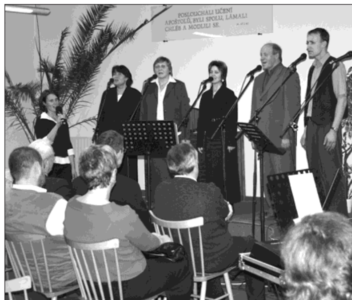
▲ Pěvecký soubor Okteto při koncertě v Bohumíně v loňském roce.

Protože máme zájem zpřístupnit tento koncert široké