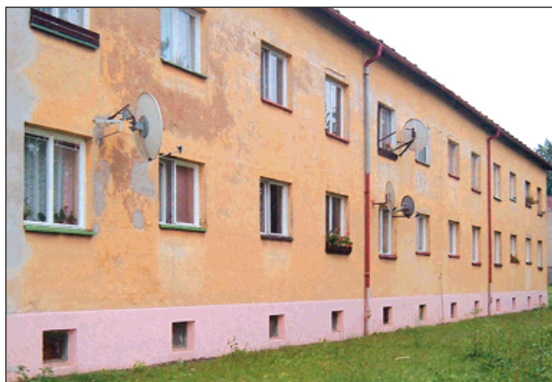
▲ Jeden z domů před opravou.