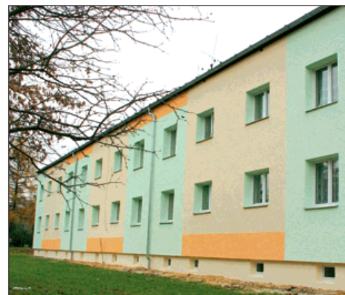
▲ Dva domy po opravě s barevnou fasádou.