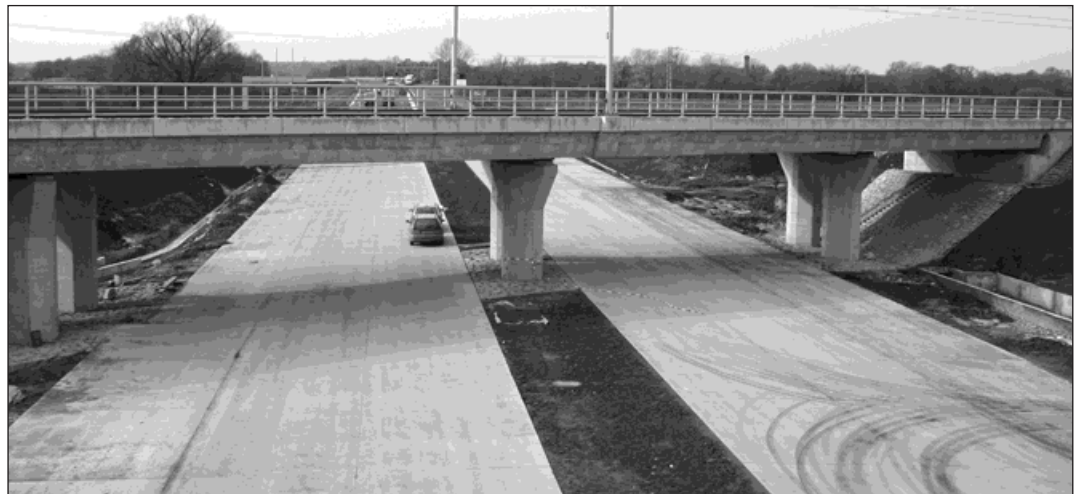
▲ Poslední úsek dálnice před Starým Bohumínem.

Moravskoslezský kraj a město Bohumín připravilo pro občany dopravu autobusy zdarma nejen na místo slavnostního zahájení, ale také projížďku v části úseku nové dálnice z Antošovic do Ostravy, včetně výkladu. Autobusy budou vyjíždět z náměstí T. G. Masaryka v hodinových intervalech a stejně se budou vracet nazpět. První spoj odjede v jedenáct, poslední v patnáct hodin.