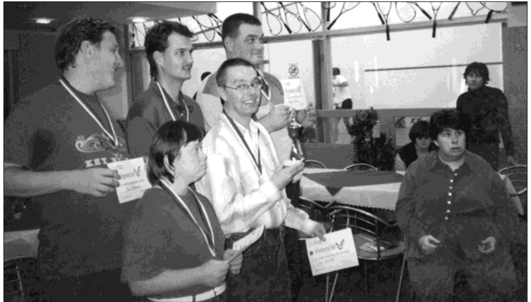
▲ Naši klienti získávají medaile z nejrůznějších sportovních klání.

Sport pokračoval i v říjnu. Karvinská organizace pořádala soutěž ve stolním tenisu. I když je to pro nás neaktuální sport,