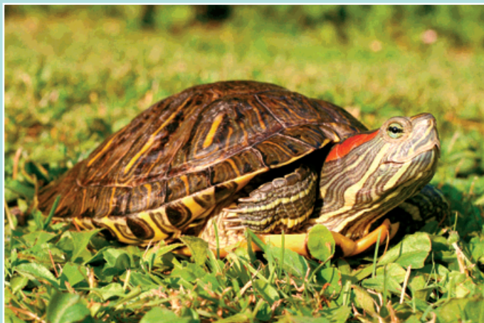
▲ Na hlavě želvy nádherné je nápadná červená kresba.

Želva nádherná pocházející z jihovýchodu Spojených států patří k častým terarijním zvířatům. A právě jedinci vypuštění do volné přírody přispěli k jejímu zdomácnění nejen v Evropě, ale i v Asii, jižní Africe a Americe mimo původní areál. V Evropě se výborně aklimatizovala především na jihu kontinentu. V České republice žije již na desítkách lokalit, přesný rozsah rozšíření zatím zmapován není.