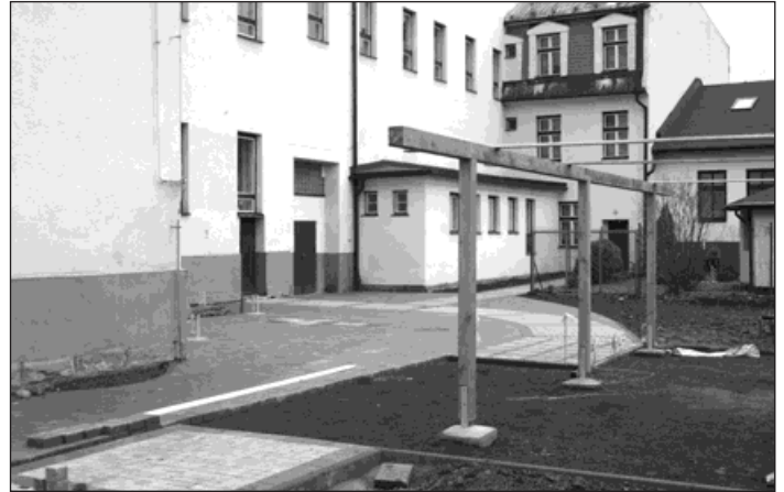
▲ Nová tvář školního dvora se už rýsuje.