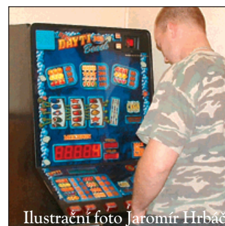
Ilustrační foto Jaromír Hrbáč

Navíc už léta platí zákaz umístění výherních automatů ve 140 městských nebytových