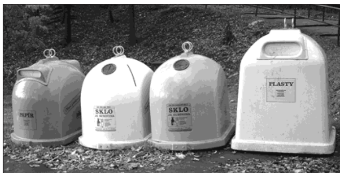
▲ Na separovaný sběr skla, plastů a papíru máme ve městě 96 kompletních stanovišť s barevnými zvony.

● Pojízdna sběrna nebezpečných odpadů sváží nebezpečné odpady (např. zbytky barev, oleje, autobaterie) a vyřazené elektrozařízení (ledničky, televizory, zářivky). V roce 2008 vyjede pojízdna sběrna