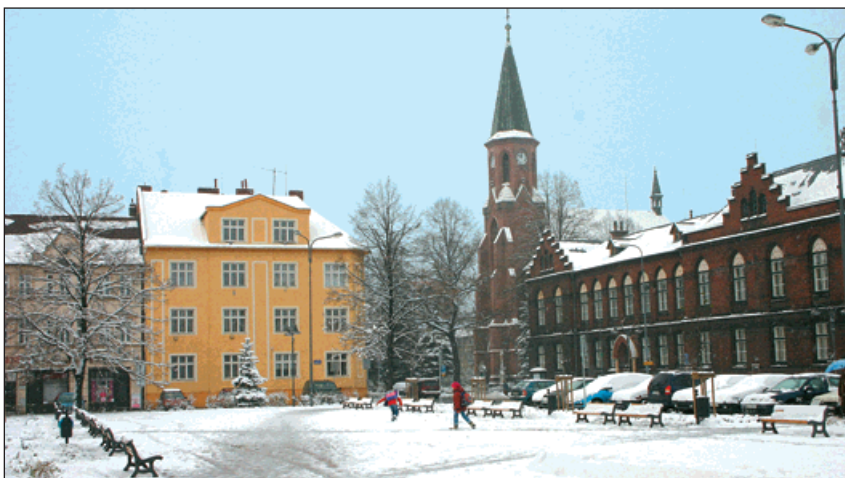
▲ První sníh u nás letos napadl už 13. listopadu. Vydrží nám bílá nadílka až do Vánoc?