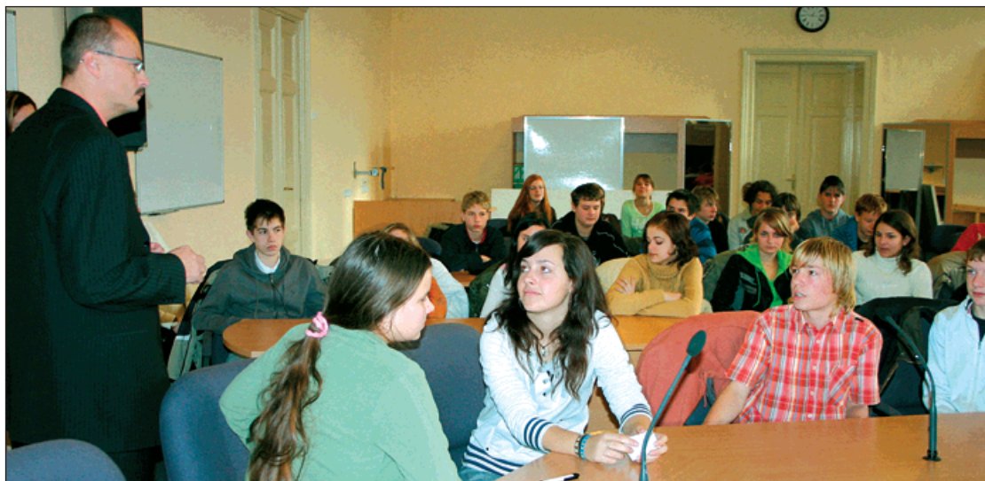
▲ Žáci devátých tříd Základní školy ve Skřečoni diskutují se starostou.

Starosta Petr Vícha přikládá těmto rozhovorům velký význam: »Mladí lidé jsou našimi nástupci a je prozřetivé připravovat je na možnost, že jednou oni sami usednou do křesla starosty nebo městských úředníků