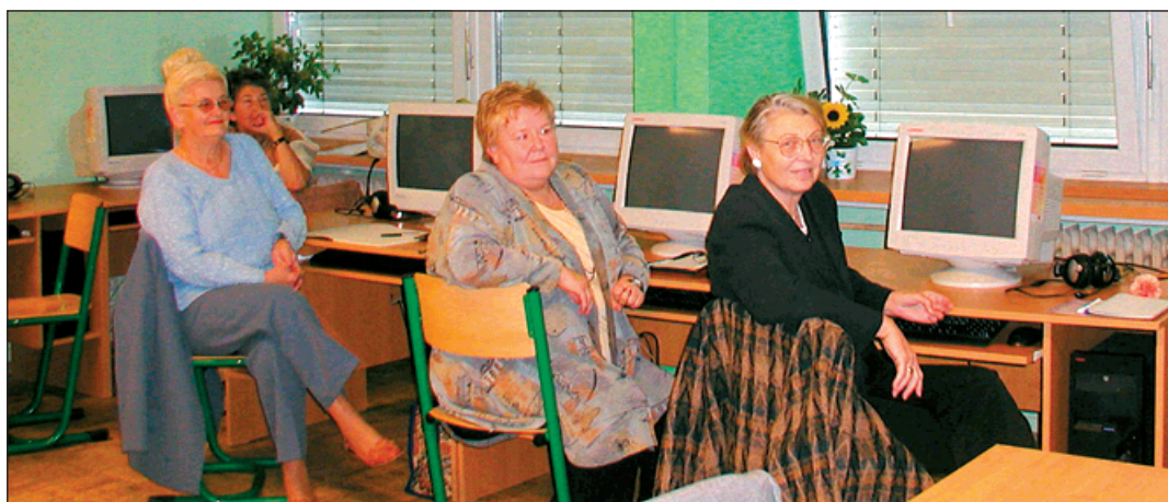
V prvním semestru školního roku 2007/2008 ukončili studenti univerzity třetího věku výuku informatiky (více čtete na str. 8).

Dvouleté vysokoškolské studium ostravské Vysoké školy podnikání je rozděleno do čtyř semestrů. Univerzitní učebny najdou zájemci v prostorách základní školy na ulici Čs. armády. Od října by noví vysokoškoláci-senioři měli začít studovat ve dvou studijních skupinách po 16 studentech. Cena jednoho semestru bude 1 800 korun, ale dospělí stu-