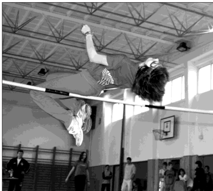
Děvčata z kategorie starších začek skákala výšku 140 cm.

Na stupních vítězů v jednotlivých kategoriích podle věku stanuli: