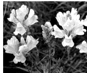
Lnice květelná je bylina vysoká dvacet až šedesát centimetrů a má žluté květy ve tvaru kalichu.

Lnice působí protizánětlivě, projímavě, močopudně, snižuje křehkost cév, tlumí bolesti při průjmech i kolikách nejrozličnějšího původu (např. žlučníkové či ledvinové kameny). Je ji možno použít u léčby chronické zácpy, u jaterních a žlučníkových poruch spojených se zácpou, protizánětlivého působení lze využít při léčbě hemeroidů, zánětu spojivky nebo oční rohovky, při žlutence, při zánětu močových cest nebo při léčbě dvanácterníkové a žaludečního vředu. V těchto případech se