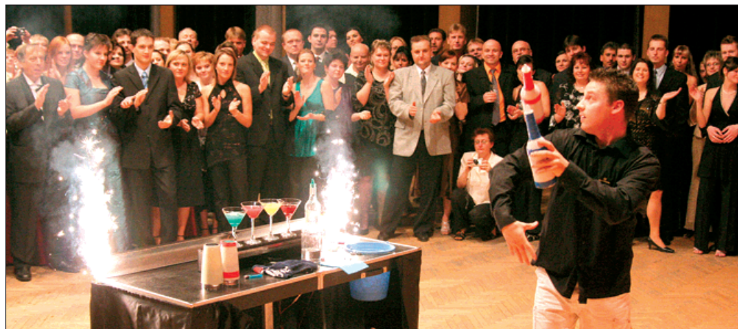
Účastníci plesu nadšeně tleskali i barmanské ohňové show.