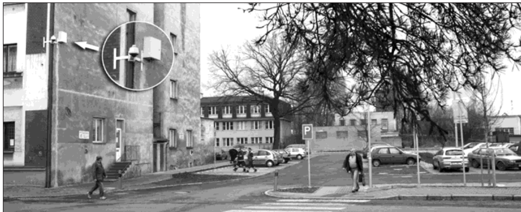
Nedávno nainstalovaná kamera u parkoviště nedaleko nádraží monitoruje nejen zaparkovaná vozidla, ale také prostor před nádražím. Vlevo umístění kamery, vpravo její detail.

Ve městě můžete potkat 30 strážníků městské policie. Mimo území Bohumína mají na starost také Rychvald. Během loňského roku řešili 3 187 přešupků. Většinu blokovými pokutami, více než tisíc z nich postoupili k dořešení přešupkové komisi městského úřadu nebo Policii České republiky.