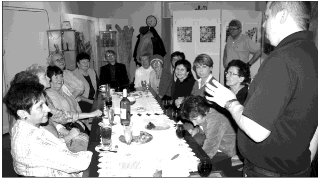
Studenti univerzity třetího věku se v Maryšce loučili se svým lektorem.

»Další semestr bude ještě těžší, budeme se učit jazyky - angličtinu nebo němčinu. Slovíčka nám budou dělat problémy, ale nestydíme se před sebou,« doplňuje