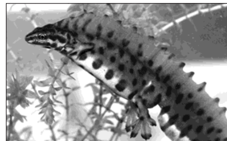
Pro samce je v době rozmnožování příznačný vysoký hřebínek.

Ve vodní fázi se čolci obecní živí drobnými vodními bezobratlými nebo jejich larvami, v předjaří někdy nepohrdnou vajíčky skokana hnědého. Na souši požírají drobné členovce a kroužkovce. Dožívají se 8 až 10 let. Přezimování začíná od října nebo listopadu na souši, někdy i v lidských obydlích.