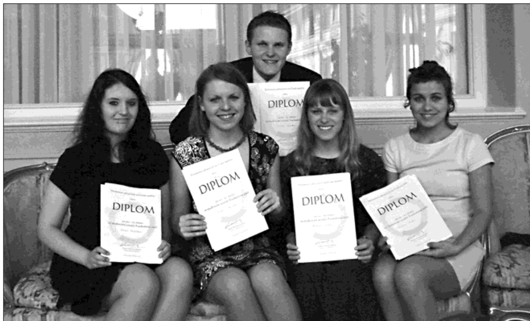
Studenti našeho gymnázia obsadili v soutěži Frankofonie 3. místo.

Soutěžili jsme v totožné, úspěšné sestavě jako v minulých dvou letech. Po předložském 5. a loňském 8. místě jsme se v nabité celorepublikové konkurenci letos konečně dočkali »bedny« a mezi 104 týmy jsme