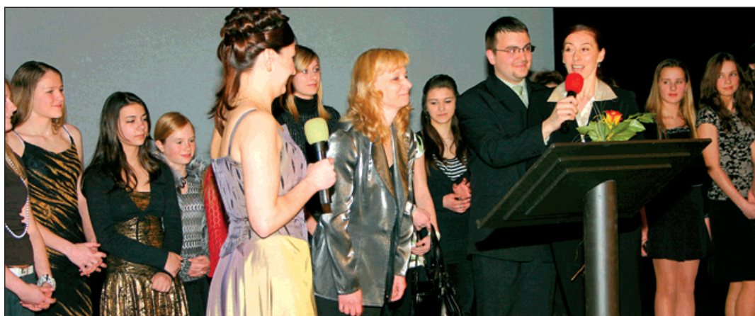
▲ Taneční soubor Radost, kolektiv mládeže roku 2007. ▼ Družstvo starších žáků Atletického klubu Bohumín.