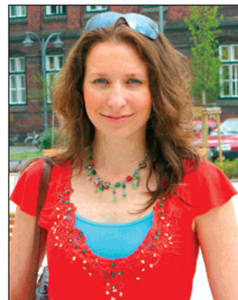
Herečka Tereza Bebarová, osobnost roku v kultuře.