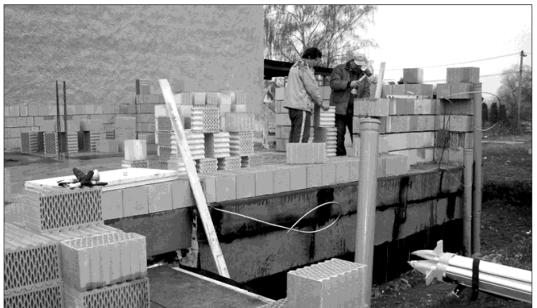
Na náměstí Svobody by měl už za rok stát nový obytný dům.

Stavba je pokračováním fronty budov na Slezské ulici. Založení na pilotech muselo být zvoleno pro vysoký stav spodní vody a nekompaktní podloží. V objektu, který by měl být dokončen na jaře příštího roku, vznikne třináct nových bytů a v přízemí komerční nebytová plocha. Z pohledu od náměstí se bude stavba jevit jako dva domy vedle sebe. Je to však jen optické členění, jednak barvou fasády a také dvěma stíty. (frk)