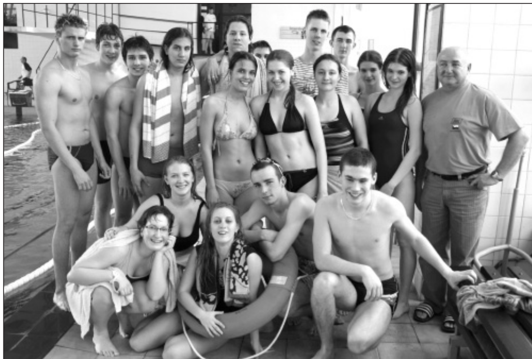
Stříbrné družstvo plavců bohumínského gymnázia.