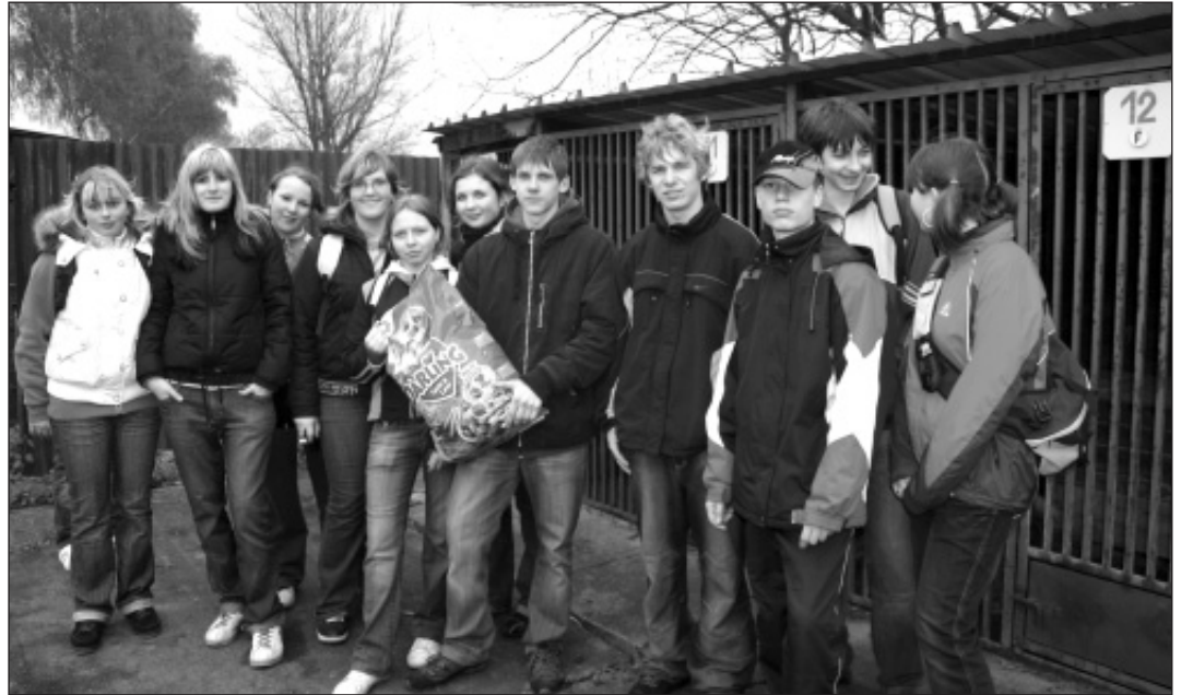
Žáci devátých tříd přinesli do útulku krmivo pro psy.

Když jsme se dozvěděli, že půjdeme na čistírku odpadních vod, srdce nám zrovna nejásalo. Naše mínění o tomto výletu podtrhlo ještě to, že třída 9.B jela autobusem. Za to my jsme si museli přivstat a ujít 5 km až do Kopytova. Počasí nebylo zrovna nejlepší, a i když nás bolely nohy, dostali jsme se do cíle. Cím více jsme se blížili, naše nosy dostávaly pořádně zabrat. To se ovšem nedá říct o nosu místního pracovníka, který na nás čekal. Provedl nás celým areálem čistírky a vysvětlil, co k čemu slouží. Někteří z nás byli překvapeni, když zjistili, že tato čistírka neslouží k vyčištění oblečení, ale odpadních vod. Po zajímavé exkurzi, celí »načuchlí«