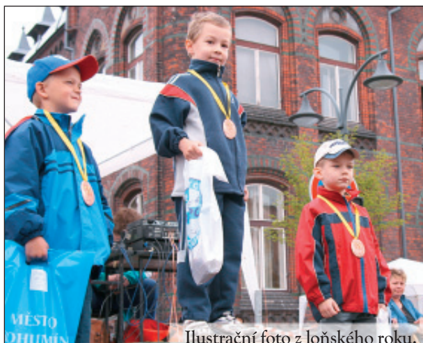
Ilustrační foto z loňského roku.

Jaký bude ten letošní ročník Běhu ulicemi města? Rozhodně po letech opět jedinečný v tom, že 8. května ozdobí dokončené náměstí v centru města.