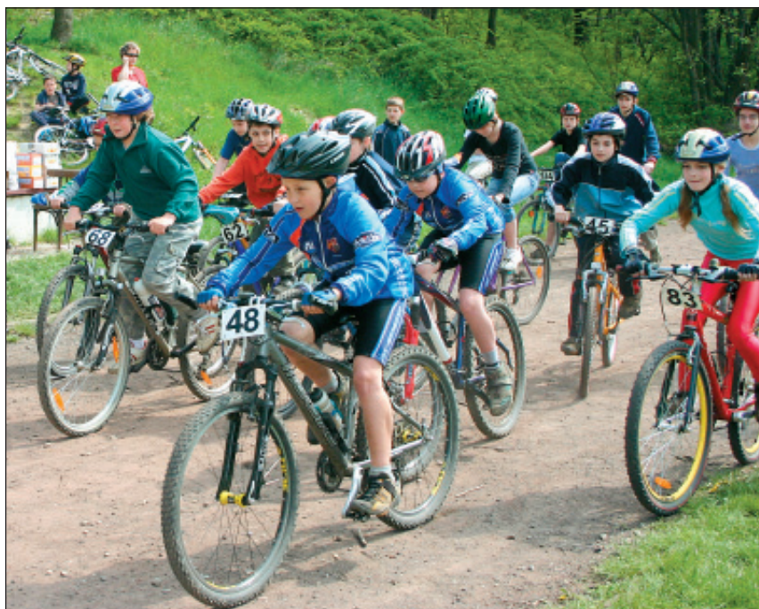
Start starších žáků v závodě Školní MTB ligy (1). Starší žákyně na stupních vítězů stejného závodu. (2).