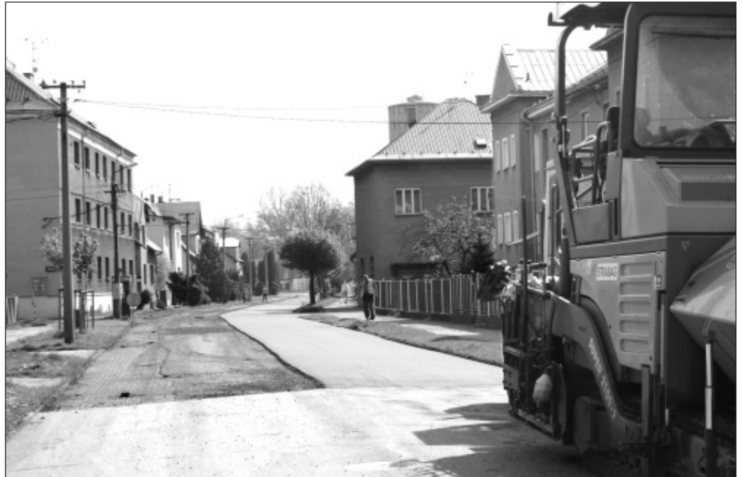
Letos byla dokončena oprava Palackého ulice. Poslední úsek komunikace dostal nový povrch.

Po letošní mírné zimě nejsou komunikace naštěstí příliš poškozené. Proto město letos investuje více peněz do oprav chodníků, než do oprav silnic. »Nejvíce peněz, přes půl milionu korun, si vyžádá oprava Palackého ulice, opravovat se bude i Čáslavská ulice za 310 tisíc korun a část náměstí Svobody ve Starém Bohumíně za 360 tisíc korun. V městské části Záblatí se