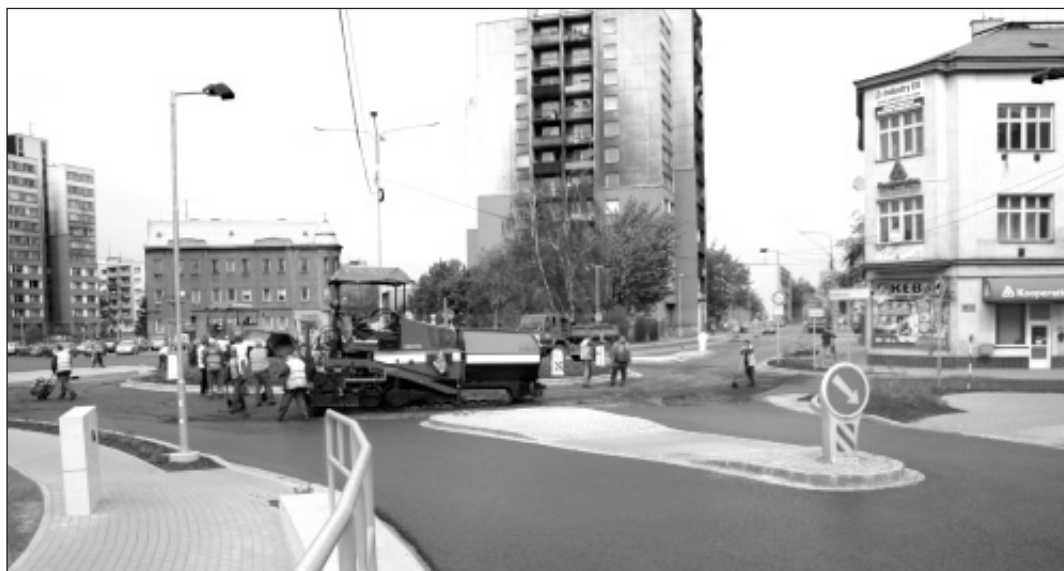
První kruhový objezd dokončen Kruhový objezd pod železárenským mostem již slouží plnohodnotně svému účelu. Prvního května během dopoledne dokončili silničáři pokládku živičného povrchu a obnovili dopravu.