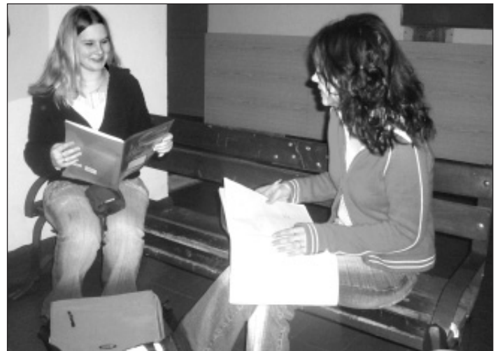
»Studentský stres« se dá pohodlně zahnat v průběhu přestávky rychlým vyvoláním trvale uložených informací v hloubkové paměti (poznámka redakce).

Článek pro Vás napsala Barča z Community