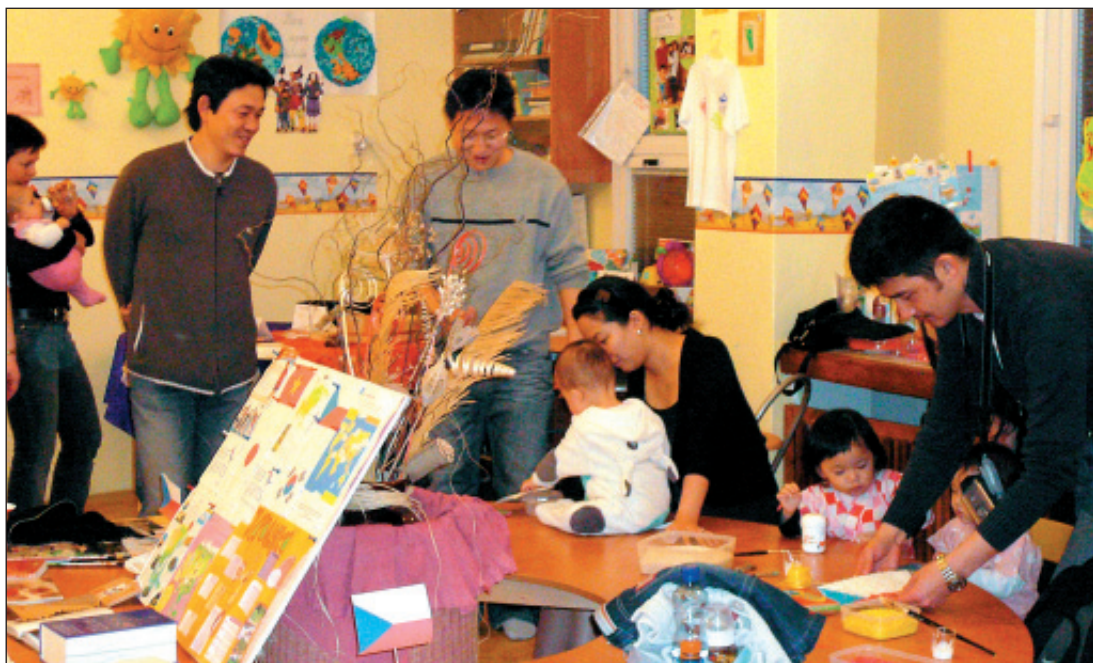
Asijské rodiny předvedly v Centru Bobeš mnohá národní jídla, zvyky a tradice.

Zjistili jsme, že poskládat origami (pozn. redakce: skládanky z papíru) vyžaduje trpělivost a zručnost, ale i nám se některé kousky pěkně povedly. A zatímco si dospělí za pomoci tlumočnicků povídali - děti české, vietnamské, korejské i japonské se proháněly hernou a vůbec neřešily případné meziná-