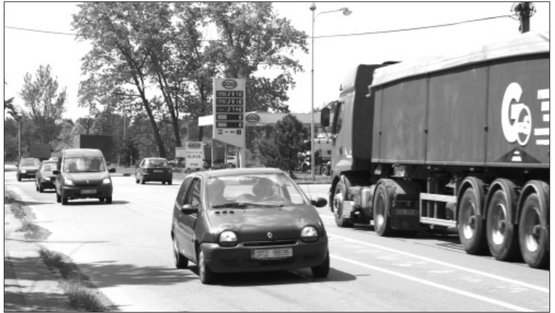
Provoz nákladní dopravy po Ostravské ulici by měl od července radikálně klesnout.

Díky vstřícnému postupu, zejména náměstkovi hejtmana Pavola Lukši, který se maximálně snažil nám vyhovět, se podařilo problém vyřešit. Výsledkem jednání byla dohoda o umístění zákazové značky omezující vjezd vozidlům, jejichž okamžitá hmotnost překračuje 12 tun, s dodatkovou tabulkou »Mimo dopravní ob-