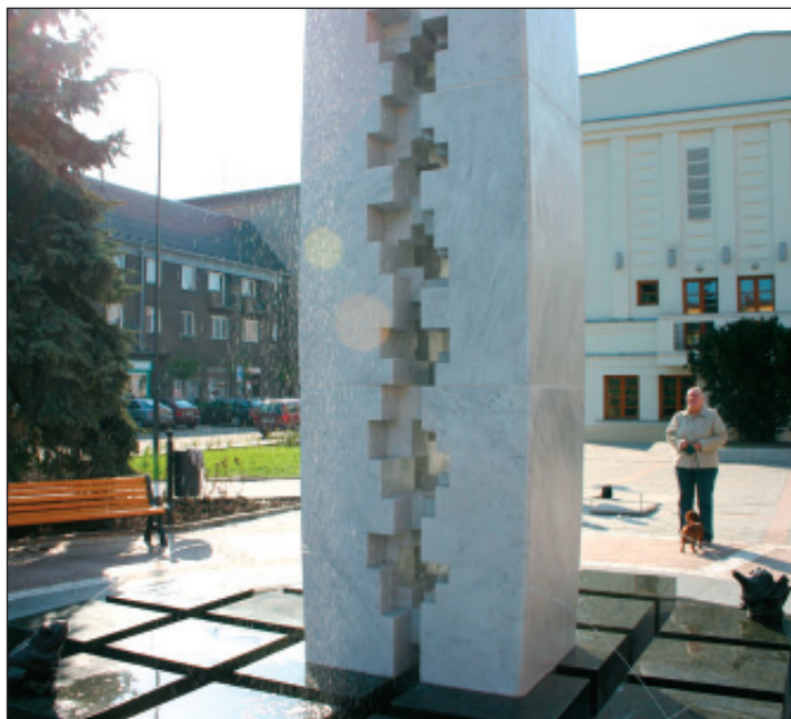
Nová dominanta náměstí T. G. Masaryka se třpytivými kapičkami vody.

Úprava okolí kina spolu s fontánou byla vybudována nákladem 16 milionů korun. První etapa proměny centra začala v roce 2002 rekonstrukcí třídy