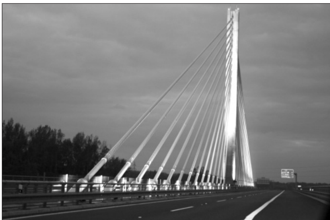
Již několik dnů se s přicházejícím soumrakem rozsvěcuje efektní nasvětlení dálničního mostu D47 u Vrbsce.