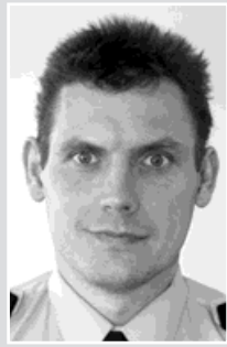
pprap. Böhm, okrsek č. 1: železnice ve služební obvodu