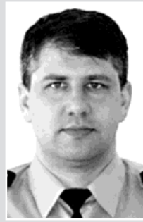
pprap. Kubiena, okrsek č. 4: Bohumín, část Pudlov, Vrbice