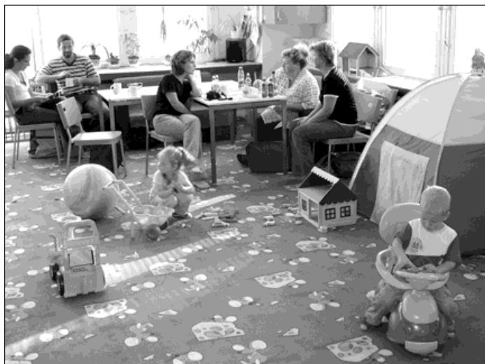
Bobeš každoročně pořádá setkání dvojčat.

Skupina pracuje pod vedením Petry Kalichové (Centrum mladé rodiny Bobeš) ve složení: Pavla Skokanová -