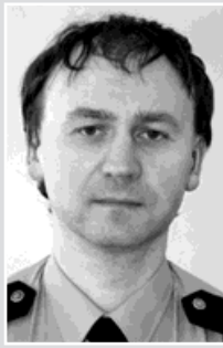
pprap. Foltýn, okrsek č. 2: Rychvald