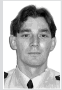
pprap. Samlík, okrsek č. 6: Bohu- mín, část Záblatí, Skřečůň, Nová Ves

Ve snaze poskytnout kvalitnější policejní službu občanům rozdělila policie v Bohumíně svůj služební obvod do několika okrsků.