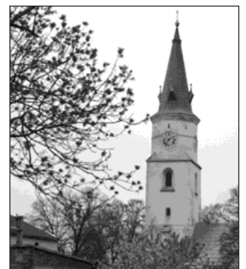
Kostel Narození Panny Marie se stal poutním místem.

Mezi projekty, které dostanou z kraje dotaci, je i farní kostel Narození Panny Marie ve Starém Bohumíně. Obnova střešní krytiny, kterou letos provede Římskokatolická farnost Starý Bohumín, si vyžádá náklady 705 433 korun. Moravskoslezský kraj bude opravy dotovat 440 tisíci korunami. (red)