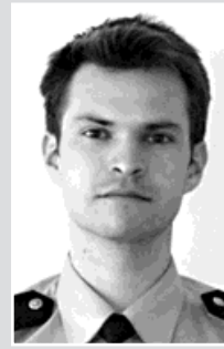
pprap. Sala, okrsek č. 5: Bohumín, část Starý Bohumín, Kopytov, Šunychl