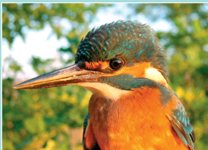
Ledňáček nás upoutá především zbarvením.

K našim nejpestřeji zbarveným ptákům patří bezesporu ledňáček. Jeho český název napovídá, že se s ním můžeme setkat na nezamrzajících vodách i v zimě. Obdobně je označován i v polštině (zimorodek) a němčině (Eisvogel). V Bohumíně byl koncem 20. století vzácný, po výrazném zlepšení kvality vody v Odře se zde nyní vyskytuje poměrně běžně. Během zimování jsem ho jednou pozoroval i v Novém Bohumíně.