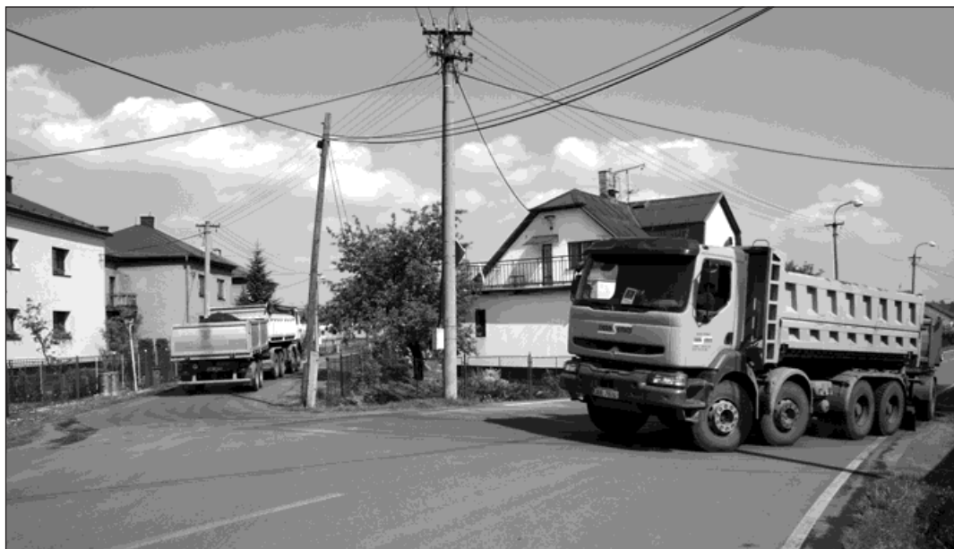
Do konce června projede Novou Vsí každých pět minut jeden nákladní automobil.

Jsou dohodnuty časy, po které bude doprava provozována. Od pondělí do pátku musejí občané počítat s průjezdy od šesté hodiny ranní do