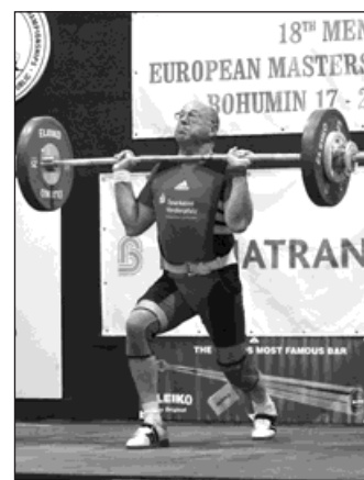
Senioři věkové kategorie od 70 do 74 let zvedali přes sto kilogramů.

• K organizaci nejsou žádné připomínky ani ze strany předsednictva, ani od účastníků vzpěračských soutěží. Při kon-