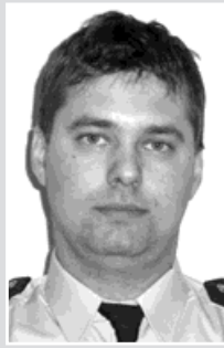
pprap. Košárek, okrsek č. 3: Bohumín, část Nový Bohumín