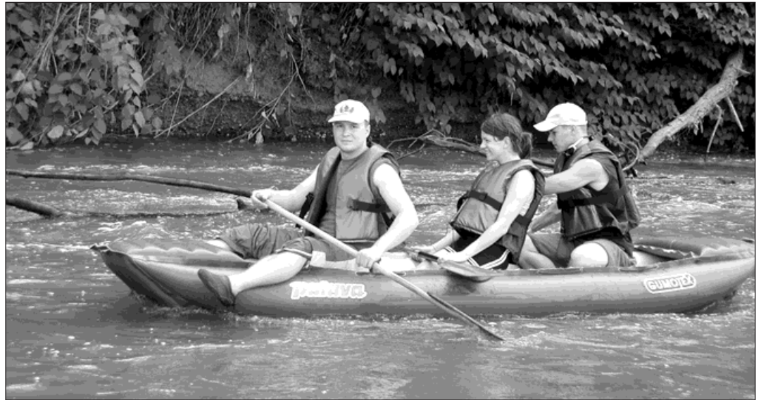
Proplouvání meandrů Odry při ložském Pływadlu 2007.

Nejhezčí úsek meandrů Odry od Starého Bohumína až za soutok Odry s Olší se plaví 1,5 - 2 hodiny. Končit plavbu lze pohodlně za soutokem u mos-