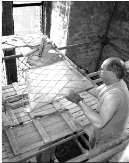
Restaurátoři demontují vitráže z oken věže novobohumínského kostela Božského srdce Páně.

Restaurátoři vitrážová okna vyjmou a odvezou do dílny v Zábřehu na Moravě. Tady budou chybějící části oken doplněny