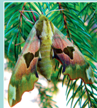
Čerstvě vylíhnutý lišaj lipový.

Samičky kladou vajíčka jednotlivě nebo po dvou na spodní stranu lipových listů. Další-