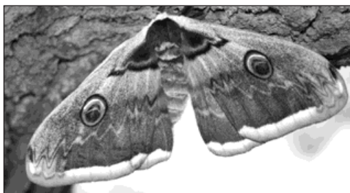
Martináč patří k ohroženým druhům.

Jde o největšího evropského motýla, jehož rozpětí křídel může být až 15 centimetrů. »Na vysoké škole jsem studoval lepidopterologii, takže jsem jej poznal hned na první pohled. Je to sameček, který se vylíhl z kukly velké asi pět centimetrů,« uvedl Tomáš Frnka. Martináč hrušňový se nachází ve střední Evropě jen ostrůvkovitě, především v oblasti Dolních Rakous, jižní Moravy a tamní hranice se Slovenskem. Izolovaný výskyt odborníci zaznamenali v Polabí. V Poodří a na Bohu-