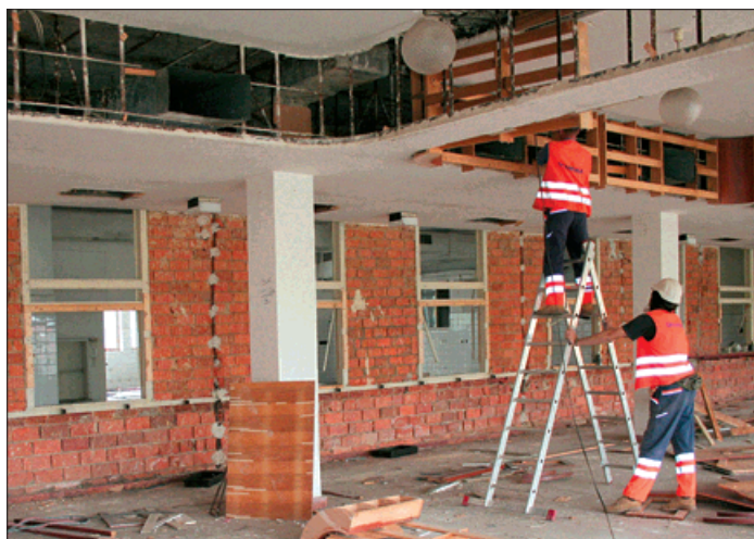
V nebytové části se zatím demontuje topení, obložení a vzduchotechnika.

Demolice potrvá do konce června a spolu s úpravou vstupu do bytové části Slunečnice bude stát 8,3 milionu korun. (Dokončení na str. 2)