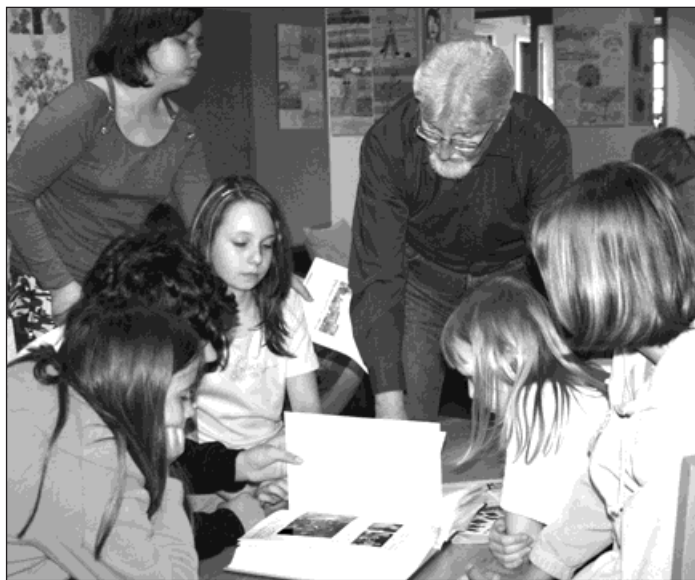
O novou kroniku Bohumína měli školáci zájem.

»Do kroniky jsem tradičně vylíčil nejzajímavější události uplynulého roku, které se pojí nejen s Bohumínem jako takovým, ale i s děním kolem nás. Po dvou letech jsme ve spolupráci s městskou organizací K3 Bohumín obnovili besedy nad kronikou a mile