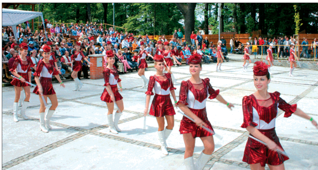
Městské slavnosti se mezi lidmi těší velké oblibě.

»Pohádky pod širým nebem sehraje pražské divadlo Pohádka od 15 hodin. Pohádkové leporelo vychází z motivů klasických českých pohádek - O třech bratřích, Strašidelný mlýn a Poštovský panáček. První pohádka vypráví o tom, jak díky své šikovnosti a chytrosti napálili tři bratři hloupé králov-