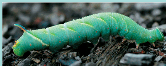
Housenka lišaje před zakuklením.