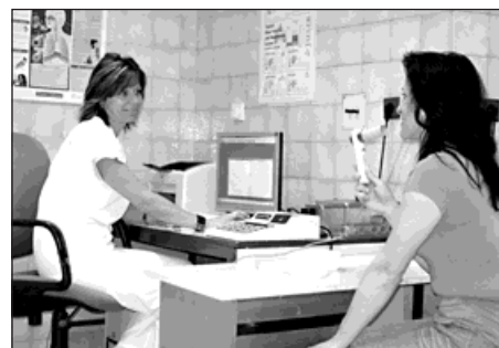
Vyšetření pacientky na plicním oddělení.

Proto znovu připomínám, že jednou nasazený lék je nutno užívat trpělivě a trvale, dávkování lze po poradě s lékařem měnit, ale vždy po poradě s lékařem! Těmito