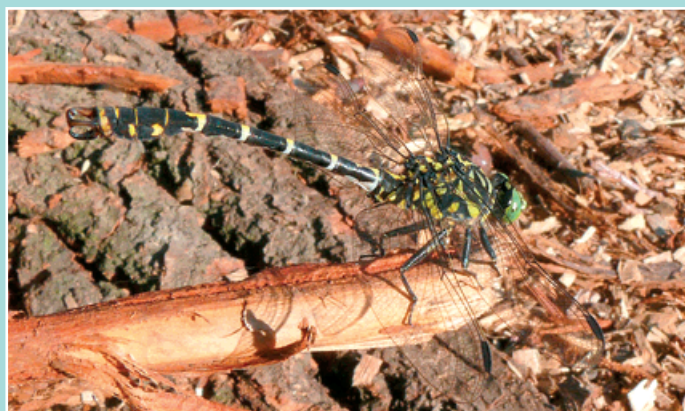
Klínatka vidlitá ( Onychogomphus forcipatus ).