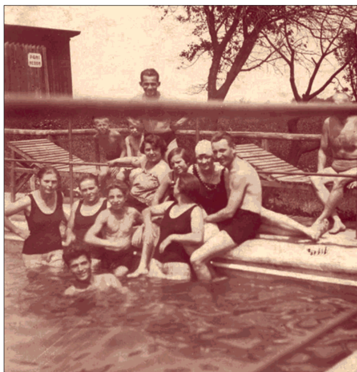
Historický snímek ze starobohumínského plovárny. 35. výročí jejího uzavření si bohumínští připomněli během léto-kružího Rozmarného léta na náměstí Svobody ve Starém Bohumíně.

Maryška děkuje městu Bohumínu, spolupořádajícímu občanskému sdružení Bart, partnerům i lidem, kteří Léto-kruhy podpořili a pomohli jim jakoukoliv formou. (luk)