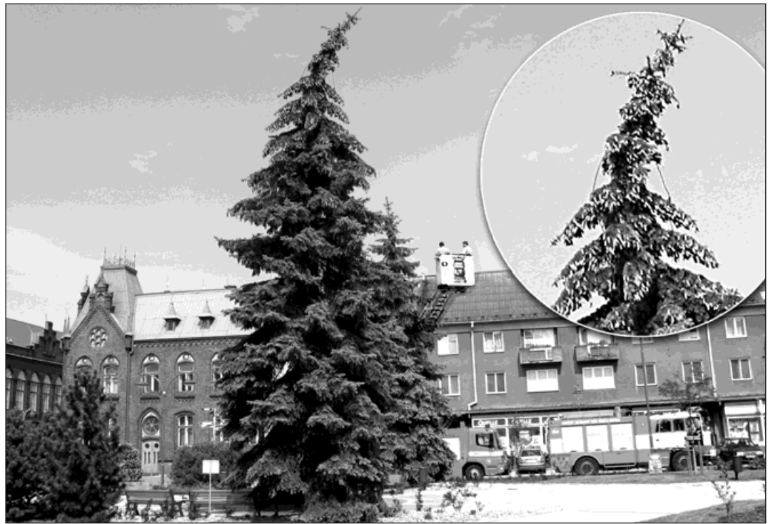
Vrchol smrku se pod tíhou šišek ohnul. Na detailu je vidět, jak byl šiškami obsypán.

Při větším nebo nárazovém větru by mohlo dojít ke zlomení a poškození stromů. »Raději jsem urychleně zavolala na pomoc hasiče, kteří z vršků smrků nadměrnou úrodu šišek obrali a ulehčili tak stromům,« informovala Lubica Jaroňová z odboru životního prostředí a služeb. Z vysokozdvizné plošiny hasiči obrali šišky ve čtvrtek 14. srpna. Ještě tentýž den v noci přišel lijavec, bouřka a silné poryvy větru. Zásah tedy přišel na poslední chvíli a nebyl zbytečný. (red)