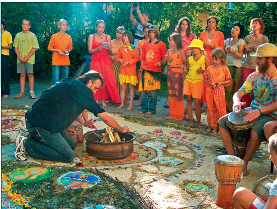
1) V dílničkách se malovalo na trička nebo na keramické destičky. 2) Duhoví bojovníci vytvořili mandalu ve tvaru velryby.