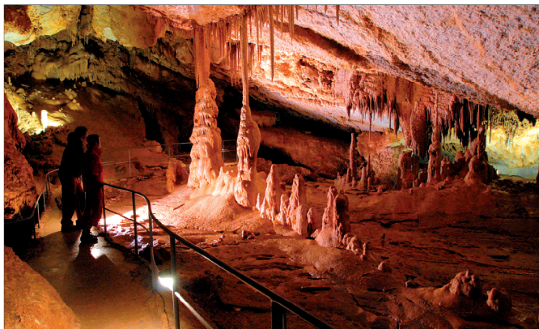
Před lety objevili bohumínští speleologové tuto nádhernou Mramorovou jeskyni. Není se proto čemu divit, že se na místo tolik let stále vrací.

Toto město je stálým sporem mezi Ukrajinou a Ruskem. Kot-