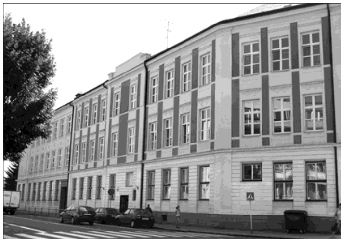
Dvě horní patra školy na tř. Dr. E. Beneše dostala o prázdninách nová plastová okna.

V září 2007 se tři zástupci naší školy zúčastnili školení,