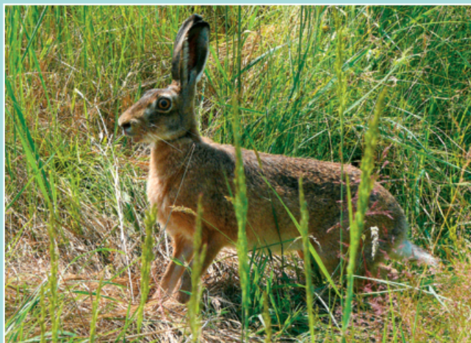
Počet zajíců ve městě, zejména na území průmyslových závodů, vzrostl.

V Bohumíně dostaly v roce 1997 již tak prořídle stavy zajíců další ránu v podobě povodně. Od té doby lze vidět zajíce v nivě Odry jen vzácně. Rozhodně jich je méně než srnců. Naopak vzrostly počty zajíců ve městě na území průmyslových závodů, v kolejistích Českých drah nebo třeba v Rafinerském lesíku. Tady je neohrožují jejich predátoři, ale na druhé straně jich ročně několik zahyne pod koly nepozorných řidičů.