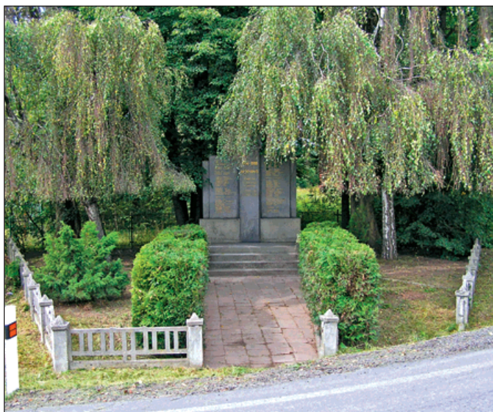
Památník padlým ve Skřečoni po údržbě

Vrbíčtí hasiči tímto za vydařenou soutěž děkují všem sponzorům, městu Bohumín a pořadatelům, kteří se podíleli na této náročné sportovní akci. Ukázky sportovních záběrů ze soutěže ve Vrbici je možno zhlédnout na internetových stránkách vrbických hasičů ( www.sdhvrbice.com ). (rei)