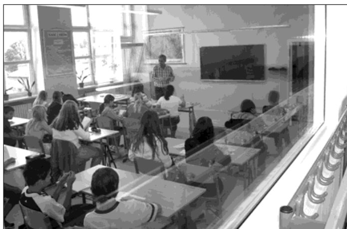
Pohled do třídy přes nové okno z chodby školy.

Jiné opravy dodaly budovám opět hezký vzhled. Nová okna v prvním a druhém poschodí školy na tř. Dr. E. Beneše však mimo estetickou funkci zejména odhluční třídy od okolního rušného prostředí dopravní tepny a zabrání úniku tepla.