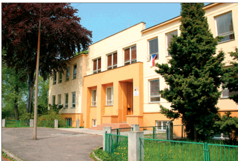
Základní škola T. G. Masaryka slaví osmdesátiny.

Během odpoledne vystoupí dechová hudba Českých drah Bohumín s mažoretkami souboru Radost, budou připraveny atrakce pro děti. (red)