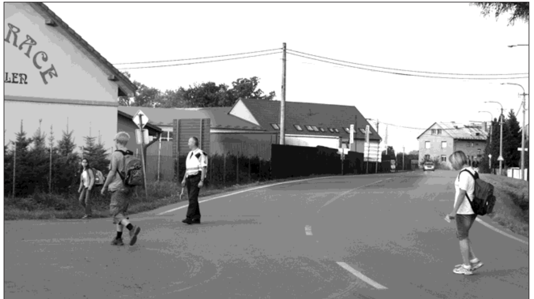
Na křižovatce u restaurace Zlatý jelen je dozor strážníků městské policie opravdu nutný. Je tady velmi silný provoz nákladních vozidel ze stavby dálnice.

Podle občanů, kteří bydlí v blízkosti firmy Progress, je slyšet v noci z areálu hluk vyspávaných špon, motory vysoko zdvižných vozíků. Problém byl projednán s majitelem firmy, který sdělil, že začala výměna motorových vysoko zdvižných vozíků za elektrické. Práce ve třetí, noční směně nyní neprobíhají. Noční směny se plánují až od října