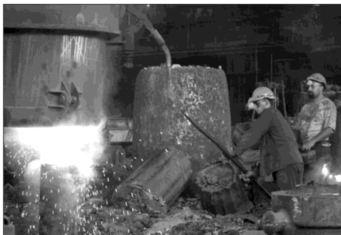
Ilustrační foto z archivu ŽDB Group a.s.

Žáci se během studia mohou profilovat do profese tažec drátu, lanař, valcář kovů a hutník-ocelář. Bohumínská firma žákům kromě budoucí pracov-