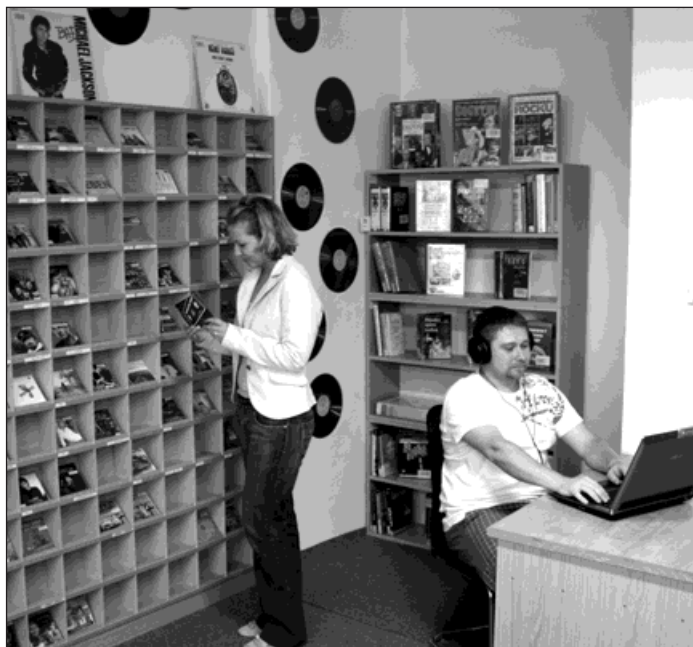
V novém hudebním oddělení knihovny najdete více než pět set titulů.

Od 1. září funguje v knihovně také nové hudební oddělení s více jak pěti sty tituly. Část studovny se proměnila v hudební zónu, v níž si mohou návštěvníci půjčit CD na svou průkazku zdarma. Vratnou zálohu 200 korun při vypůjčení dvou hudebních CD až na čtyři dny dostane po vrácení disků