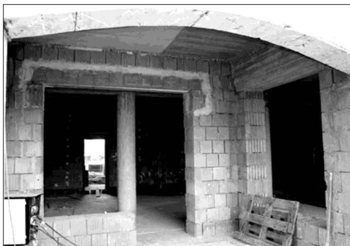
Do budoucí provozovny je vstup podloubím.

V jeho přízemí jsou navrže- ny i nebytové prostory, ve kte- rých by měly vzniknout nové obchůdky nebo například ka- várna s cukrárnou či podobná provozovna. A do nich by se už na jaře příštího roku mohli nastěhovat noví provozovate- lé. Na náměstí, v historické části města, v blízkosti kostela, který je také známým a hojně navštěvovaným poutním mís- tem. V lokalitě, která se ještě dále ztraktivní po propojení náměstí přímo s hraničním přechodem do Polska, což jistě dále povzbudí návštěvnost ne-