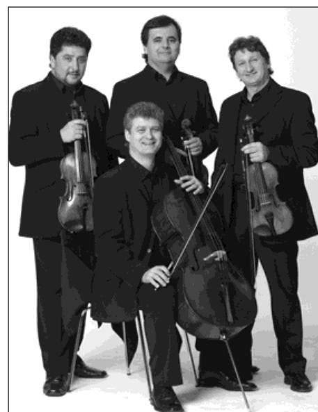
Wihanovo kvarteto je hostem letošního jubilejního Vánočního koncertu se Sluníčkem.