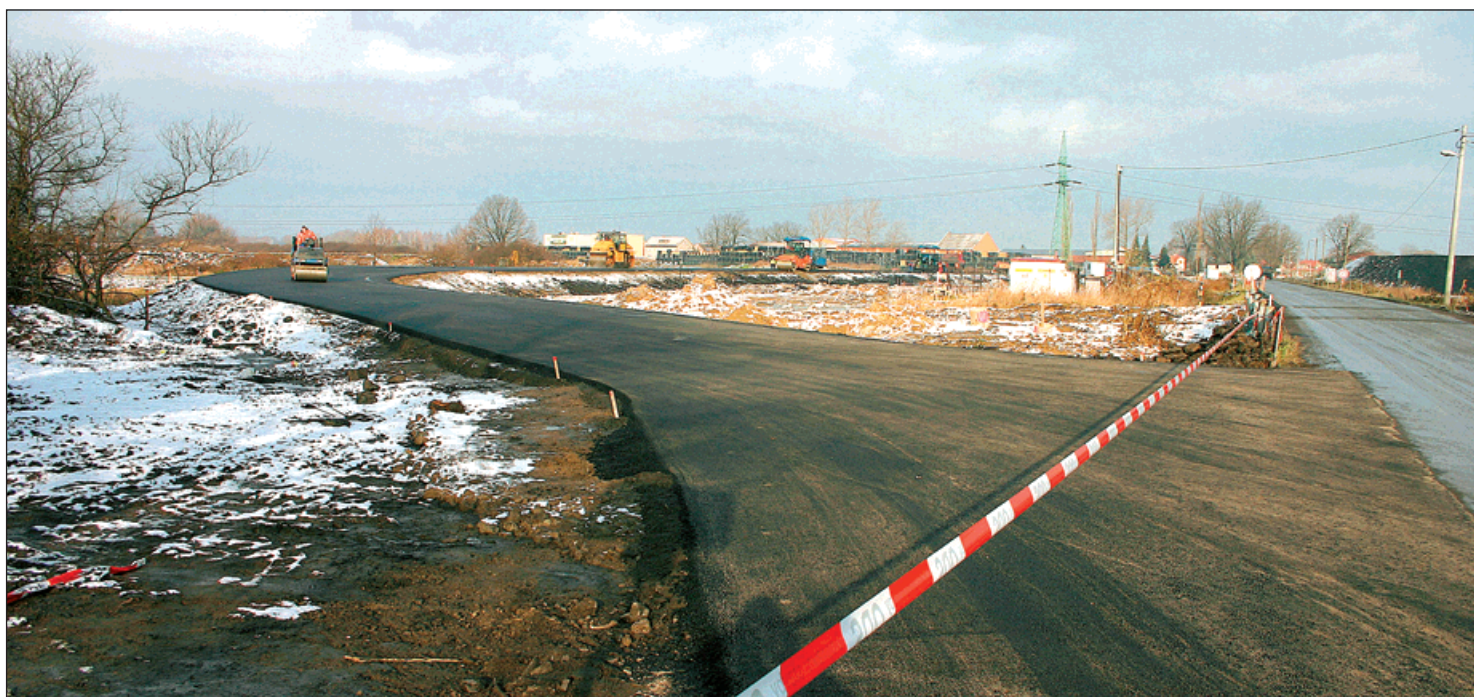
Budovaná přeložka ulice Šunychelské ve směru na Šunychl.