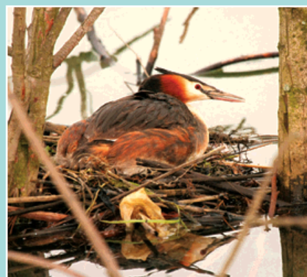
Potápka roháč na hnízdě.

Jejich potravou jsou drobné rybky, plži, korýši, čolci a vodní hmyz, vzácně i žáby a užovky. Loví většinou pod vodou, kde mohou zůstat až 50 vteřin a potápějí se několik metrů hluboko. Dříve byli roháči nemilosrdně pronásledováni rybáři. Nyní