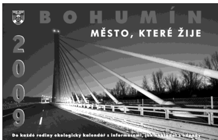
Titulní stránka kalendáře s fotografií Štefana Špice, zachycující noční pohled na dálniční most u Vrbiče, který se stal stavbou roku 2008.

Každá domácnost bude mít na stole ucelený přehled o záležitostech odpadového hospodářství i o dění ve městě. V kalendáři je časový harmonogram svozu nebezpečných odpadů, včetně stanovišť a hodiny přistavení. Ceny za svoz odpadů. Přehled odebíraného odpadu ve stacionárním i mobilním dvoru, seznam stanovišť mobilního sběrného dvoru a jeho provozní dobu. Na dalších dva-