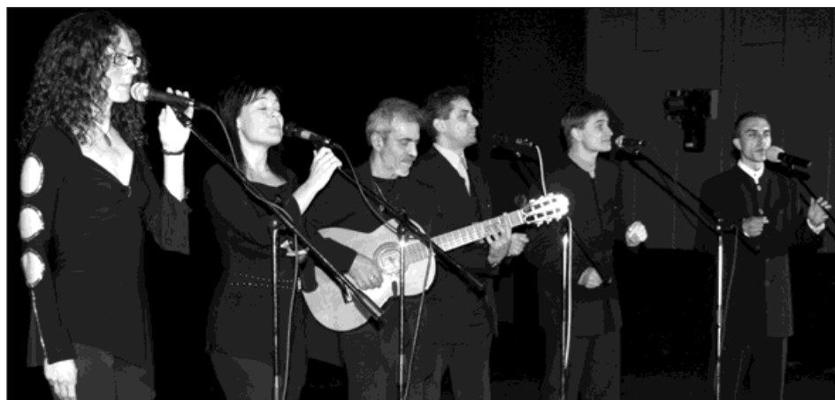
Vokální skupina Sluníčko pořádá vánoční koncerty už deset let.

Opět nastala doba, kdy uprostřed zimy zklidníme své životy, abychom s úctou poděkovali za krásu svého bytí a navzdory neúprosnému času s radostí očekávali rok příští. V tyto předvánoční dny přichází již tradičně vokální skupina Sluníčko se svým přáním a Vánočním koncertem.