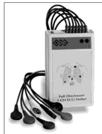
Nový typ EKG holteru nahradí starší typ, který nemocnice využívá od roku 1993.

Kromě nemocnice v Bohumíně společnost ŽDB Group poskytuje sponzorské dary například pro Slezskou diakonii a její stacionář Salome v Bohumíně, Svaz postižených civilizačními chorobami, Sdružení pro pomoc mentálně postiženým, Sjednocenou organizaci SONS (tzn. organizace nevidomých a slabozrakých), kteří z darů hradí zejména ozdravené pobyty svých členů či dary slouží k vybavení specializovanými pomůckami pro postižené. Firma také podporuje bohumínské Centrum mladé rodiny Bobeš, kde tráví maminky s malými dětmi volný čas. Dále podporuje Střed-