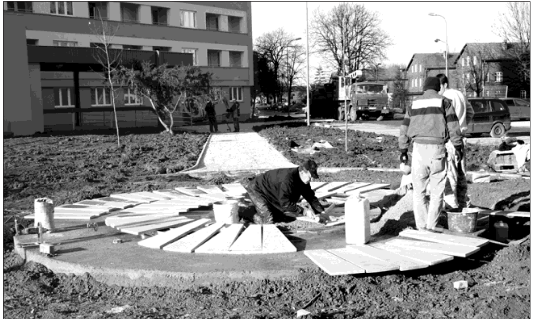
Místo, kde na jaře vytrysknou čtyři prameny vodotrysku, nepůsobí dnes ještě esteticky. Získává teprve svou budoucí podobu.