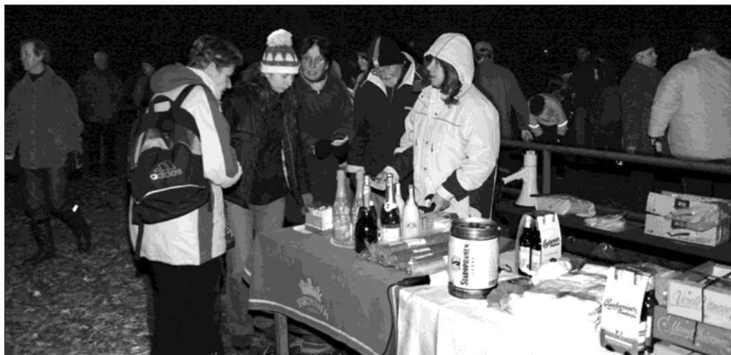
Každoročně je při Silvestrovském běhu připraveno horké občerstvení a mnoho zajímavých i chutných cen.

Otázku z titulku dnes nikdo nezodpoví, ale běh se uskuteč-