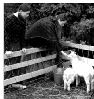
Ilustrační foto web města.

Každou prezentaci si žáci připraví na CD a před fórem ostatních spolužáků a učitelů budou účastníci svůj příspěvek komentovat. (red)