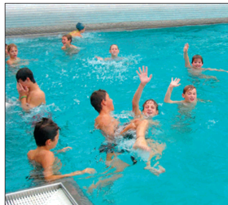
Venkovní bazén se těší velké oblibě.

Vysokou návštěvností, úspornými opatřeními a dobrým marketingem. Velké bohumínské firmy Bonatrans, ŽD a AZ Fin zakoupily pro každého svého zaměstnance permanentku v hodnotě tisíc korun, jen z toho jsme získali dva miliony korun. Vyrábíme si vlastní elektrickou energii (926 MW ročně), díky čemuž ušetříme ročně jeden milion korun a ještě dostaneme půlmilionovou dotaci z Energetického regulační-