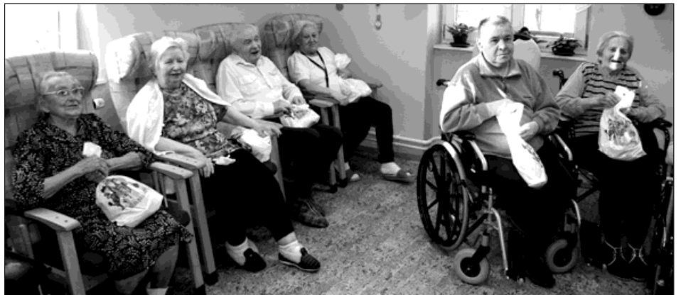
Domov Jistoty je sociálním zařízením poskytujícím služby osobám se sníženou soběstačností, jejichž situace vyžaduje pravidelnou pomoc jiné fyzické osoby.