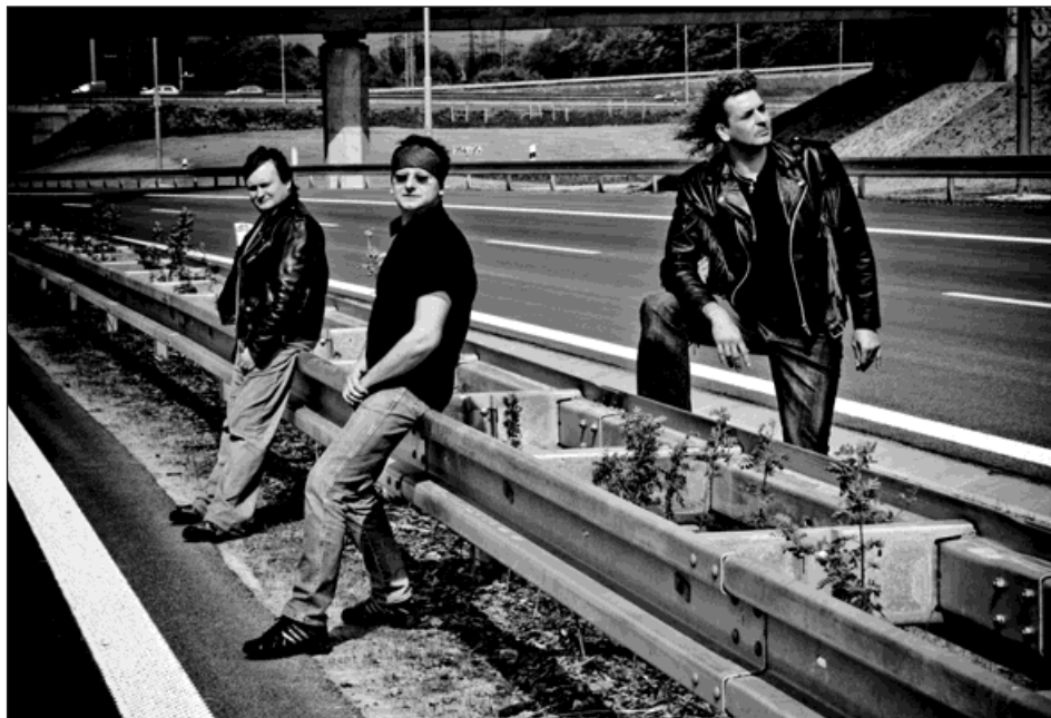
Visalaje, album bohumínské kapely Grog, rok 2008.

Kapela, která koncertuje nejen v Bohumíně, natáčela písničky pro nové album Visalaje od května 2006 do října 2008.