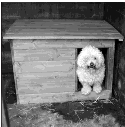
Někteří psi v útulku už dostali teplé boudy.

»Bouda má dvě části, předstříšku a zateplenou »ložnici«, která je obalena izolačním polystyrénem a zabezpečena překližkou proti prokousání. Pes ležící v »ložnici« ji svým tělesným teplem vyhřeje a izolace zabrání úniku tepla. Zatím mají ve svých kotcích tyto zateplené boudy ti nejmenší psi, kteří nejhůře snášejí mrazy a chlad. Během letošního roku chceme získat finanční prostředky z rozpočtu města na zbývajících vybavení kotců,« řekla Eva Liszoková z odboru životního prostředí a služeb. Na pozemku stojí 22 kotců a všechny jsou obsazené. (frk)