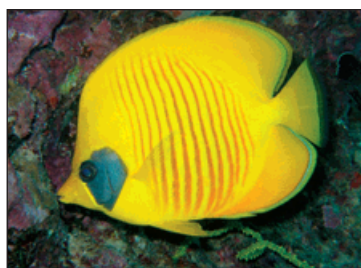
Nádherně barevný život pod hladinou.