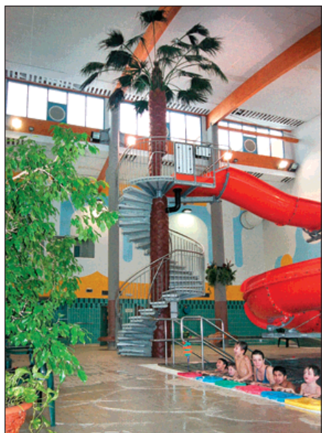
Z nosného sloupu skluzavky se stal kokosový strom, všude je plno zeleně.

Propojení bazénu a sauny a možnost využití venkovního koupání po celý rok. Koupí-li si klient pobyt v sauně, má automaticky pobyt v bazénu zdarma. Zájem je i o plaveckou školu. Nabízíme plavání škol také zájemcům ze vzdálenějších míst, z Hlučína, Rychvaldu, Darkoviček, Ludgerovic. Náš aquabus zajišťuje jejich dopravu na bazén i zpět.