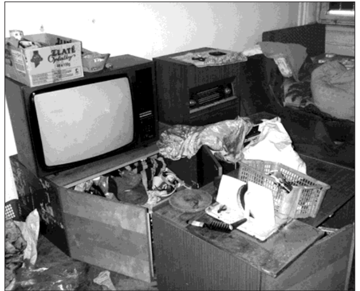
Byt byl po vystěhování nejen zdevastován, ale další náklady vznikly při likvidaci zařízení, které majitel v bytě zanechal.

Anna Honkyšová z majetkového odboru, která je za město u exekuce přítomna, vyčíslila škody, které na tomto konkrétním bytu na Okružní ulici vznikly neplacením nájmu a následně náklady na uvedení bytu do původního stavu: »Dluh na nájmem a službách činil u tohoto bytu 55 759 korun. K tomu se připočítává penále. Jde o byt 2+1 a náklady na jeho