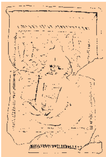
Kachle mají okrajovou lištu, rostlinné motivy a různé centrální motivy. Pocházejí z konce 15. a počátku 16. století.