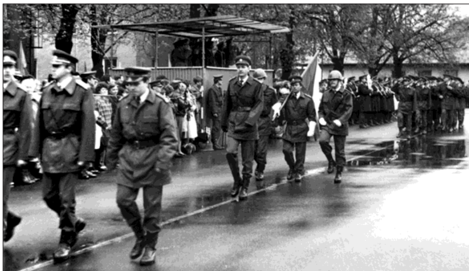
Bohumínská kasárna železničního vojska v době plného nasazení.

Příslušníci útvaru byli v rámci vojenské základní služby přidělováni vybraným železničním uzlům a vypomáhali drahám zejména ve funkcích výpravčích a v depech kolejových vozidel. V železniční stanici