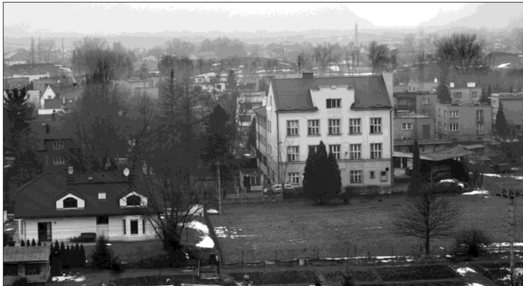
Na pozemku před Domem Jistoty na Koperníkově ulici vyroste objekt pro chráněné bydlení.

Hlavním smyslem transformace ústavní péče je umožnit lidem s postižením žít život v běžném přirozeném prostředí s využitím komunitních služeb (podpora samostatného bydlení, chráněné bydlení, osobní asistence, podporované zaměstnávání atd.). Život lidí s postižením musí být srovnatelný se životem jejich vrstev-