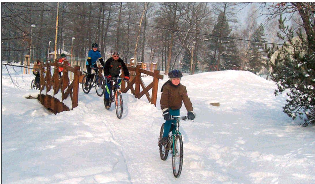
Idylická novoroční jízda cyklistů Sportovního klubu Šafrata Bohumín.

V březnu se pak připojí i nováčky klubu, protože už poslední víkend měsíce je závodní. Bikeri zamíří na zahájení polsko-českého seriálu GP Silesia do Wodzisławi. A plány? Vyhrát