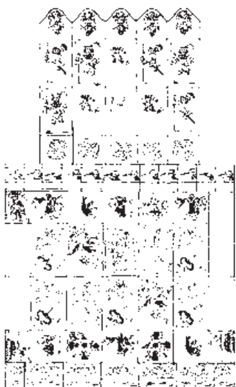
Perokresba kachlových kamen