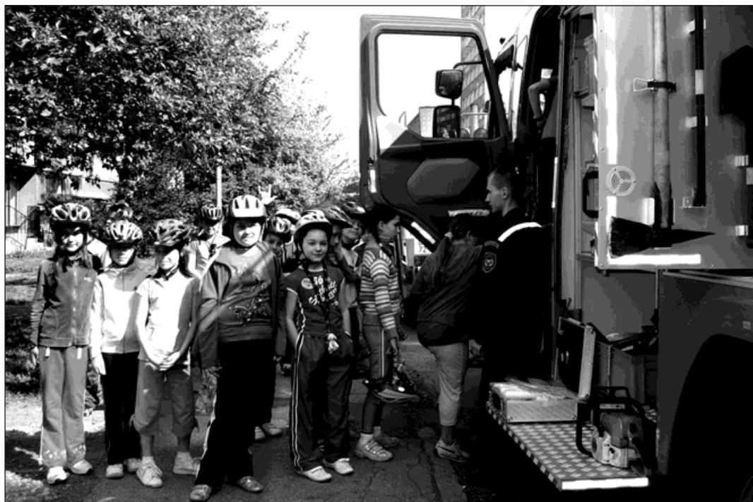
Profesionálové i dobrovolníci z řad hasičů předvedli dětem svou techniku.