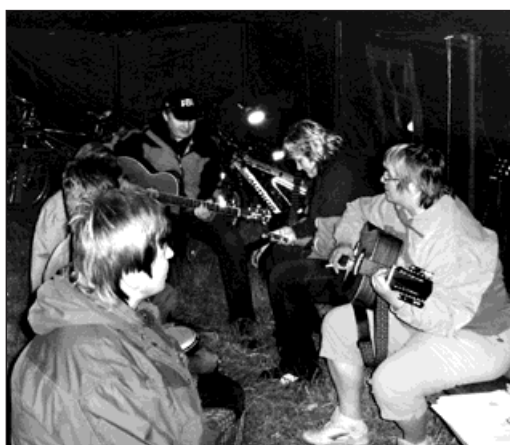
I když počasí akci nepřálo, zábava po skončení pochodu pokračovala pod přístřeším stanové plachty.