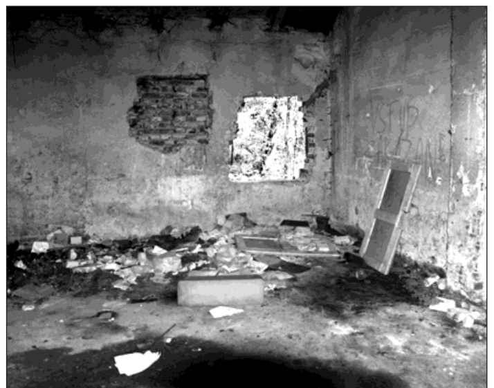
Vstupovat do tohoto objektu je nebezpečné.

na a v krátké době opět vybourána. Objekt byl označen cedulemi s nápisem »Zákaz vstupu - nebezpečí pádu střešní konstrukce - objekt určen k demolici«, které byly opětovně strhány. Po otevření Kauflandu byl areál otevřen a je velmi obtížné provádět kontrolu a strážení. Na odstranění staré ekologické zátěže má Benzina uzavřenou smlouvu s Ministerstvem financí ČR a čeká již několik let na rozhodnutí státu, kdy, kým a jakým způsobem bude zátěž likvidována. Současně dojde k odstranění i této stavby.« (red)