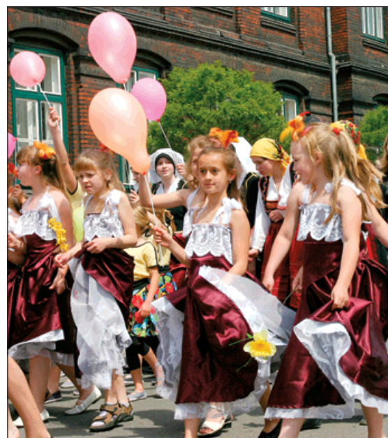
První přivítání před školou obstaraly školní mažoretky. (1) Průvod si žáci užili - prošli městem v kostýmech, připravených na odpolední akademii. (2)