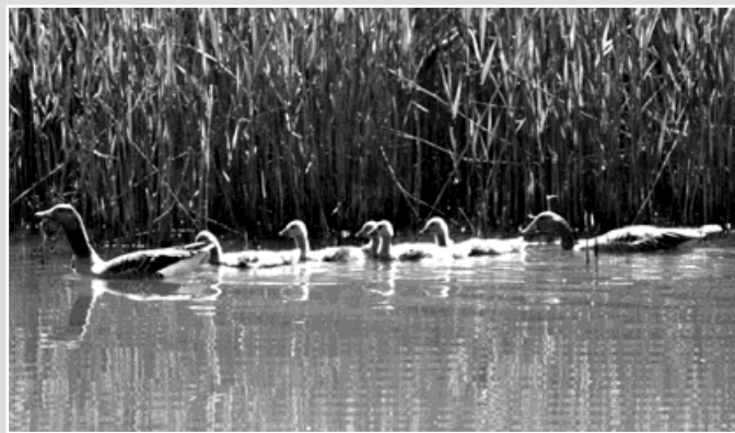
Vodící pár hus velkých s housaty.