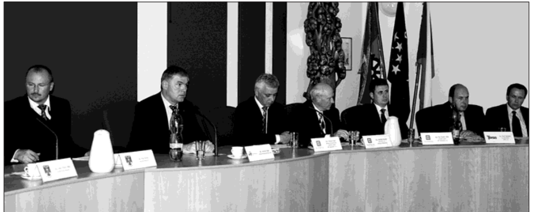
Na tiskové konferenci před zahájením slavnostního výkopu odpovídali na otázky novinářů zástupci investora, realizační firmy i vedení města.