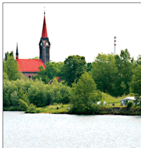
I přes lákavý pohled na zavěšený most na dálnici D47 (na snímku vlevo) je pro Vrbici dominantní kostel sv. Kateřiny a Vrbické jezero.

Oslavy, které připravil Sbor dobrovol- ných hasičů z Vrbi- ce, komise pro městskou část Vrbi- ce a Fotbalový klub Bohumín B budou pokračovat v sobotu 13. června pro-