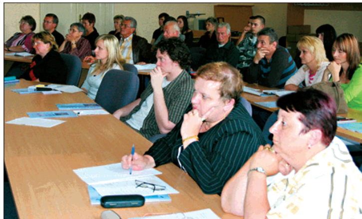
Školení členů okrskových volebních komisí.

Vůbec první volby do Evropského parlamentu v roce 2004 přilákaly v Bohumíně k voleb-