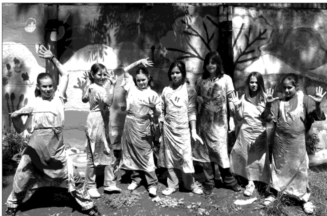
Nejen stěna byl plná barev, barvami zářily od hlavy až k patě také malířky.