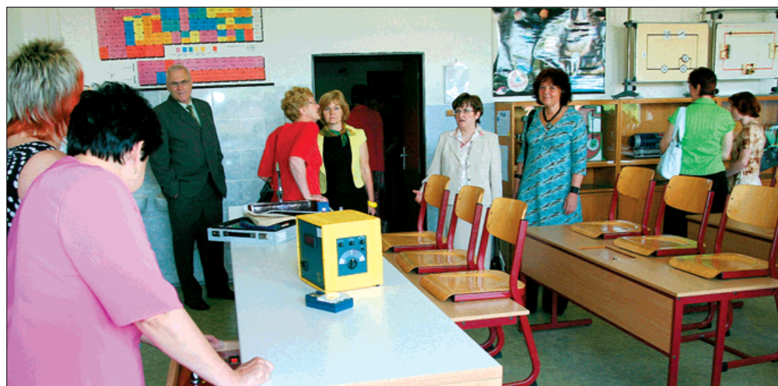
Hosté navštívili i odbornou učebnu fyziky, dobře vybavenou pomůckami.