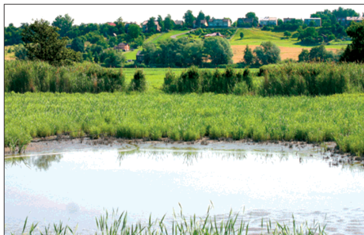
Pohled přes Záblatský rybník na obec, ležící na kopci v jinak rovinaté krajině. Vpravo kaple sv. Jana Nepomuckého.