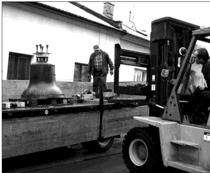
Zvon ze Starého Bohumína se 19. května vydal na cestu do Podkrkonoší.

Protože zvon sv. Mikuláš byl i nadále schopen plnit své poslání, nabídli jej starobohu-