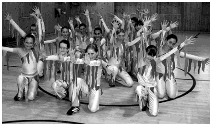
Starší děvčata z klubu Aerobic cvičila »Plameny« v »planoucích« žlutonudých kostýmech.

V Praze se 16. května uskutečnilo finále 10. ročníku soutěže Děti fitness aneb Sportem proti drogám ve skupinových choreografiích, na které se proboujaly i dva týmy děvčat školního klubu Aerobik při Základní škole na třídě Dr. E. Beneše z Bohumína.