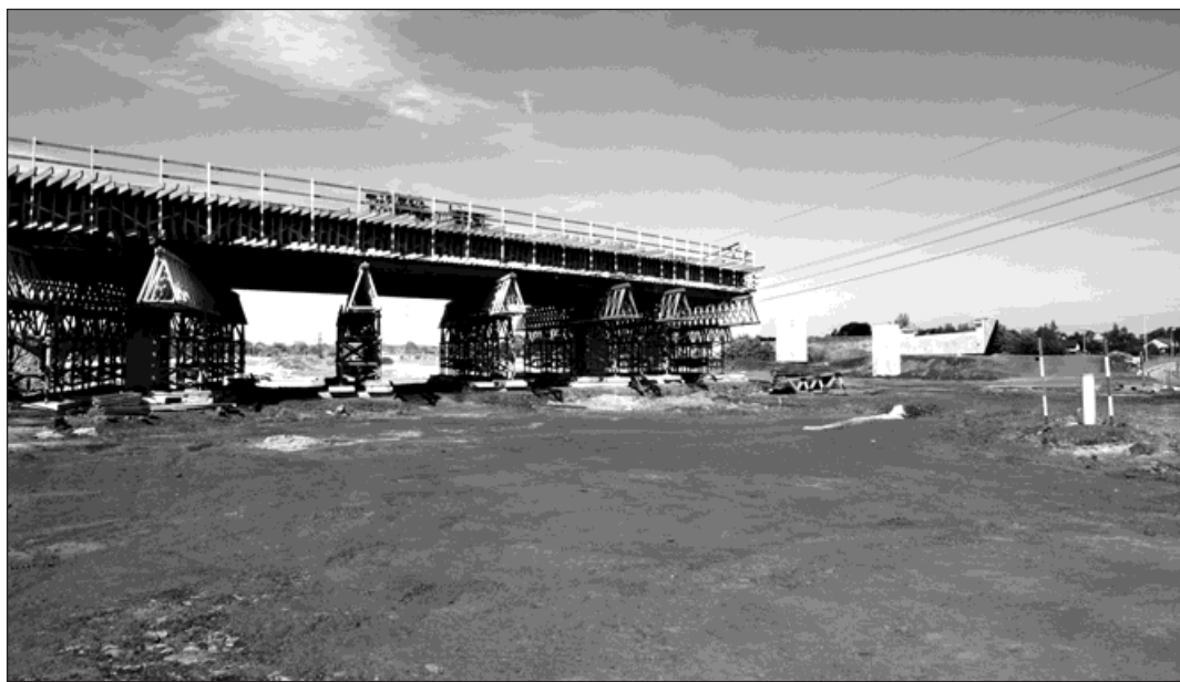
Stavbaři věří, že se podaří smontovat konstrukci nadjezdu přes celou šíři dálnice.

Do poloviny šířky budoucí dálnice se již zvedá nadjezd, po kterém bude nově pokračovat ulice Slezská směrem na Starý Bohumín.