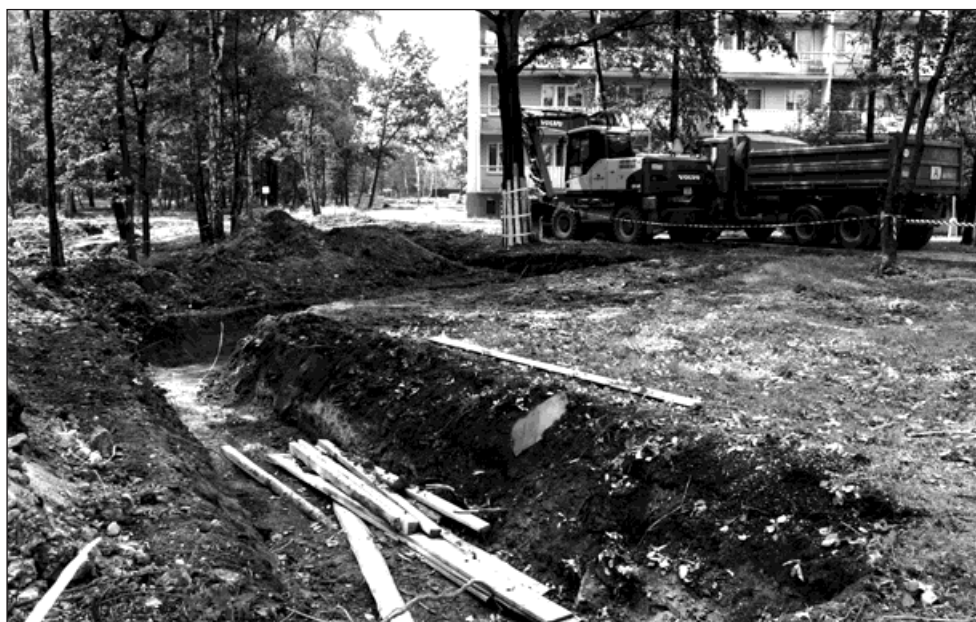
První výkop pro pokládku teplovodu začal za Shuměčnicí.