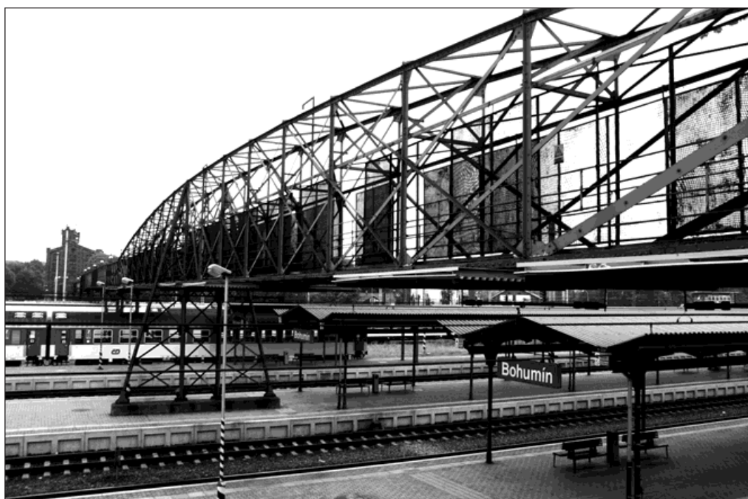
Lávka je kulturní památkou: Ocelová lávka nad kolejíštěm Českých drah byla prohlášena kulturní památkou. Byla postavena v roce 1899 a spojuje náměstí Adama Mickiewicze s ulicí Lidickou.