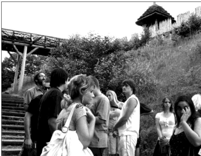
Studenti navštívili Archeopark v Chotěbuzi.

V budově kina K3 Bohumín a na střední škole se konal 17. června 2. pracovní seminář výše uvedeného projektu. Studenti zhlédli film o městě Bohumín v polském jazyce, prezentaci o Střední škole Bohumín, proběhla přednáška Dany Matyaszkové na téma daň z přidané hodnoty, daň z příjmu fyzických a právnických osob. Následoval klasický český oběd a cesta za kulturou na Zámek Fryštát, do Archeoparku v Chotěbuzi a lázní Darkov. Třicet českých a třicet polských studentů dále pracovalo v osmi skupinách, které zpracovávaly materiály týkající se daní, počítaly daně, vyplňovaly daňové příznání k praktickým příkladům, řešily testové otázky. Nejlepší skupiny získávají z jednotlivých seminářů body do celkového hodnocení, které proběhne příští rok v březnu. Máme naplánovány dva semináře v Polsku a dva semináře v Česku, spousty přednášek a besed.