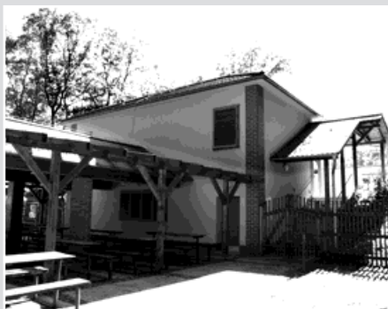
Letní kino v areálu parku Petra Bezruč.