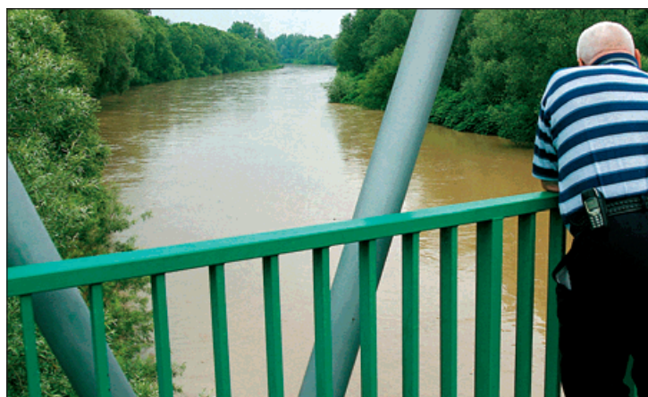
Pohled na stoupající hladinu Odry.

Pod dojmem víkendové návštěvy záplavami postiženého Novojičína inicioval starosta Bohumína akci na pomoc postiženým lidem. »Obvolal jsem naše zastupitele, zda finančně pomůžeme zatopeným obcím. Reakce jsou kladné, shodujeme se i v tom, že pokud to půjde, pošleme více finančních prostředků než zamýšlených 200 tisíc korun,« uvedl Petr Vícha.