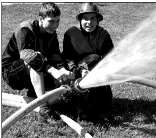
Kopytovští mladí hasiči v akci.

Celá akce se konala v rámci oslav 85. výročí Sboru dobrovolných hasičů Kopytov, které se