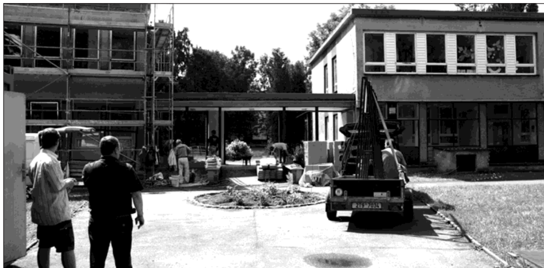
Provoz školky a mateřského centra Sluně je do konce rekonstrukce přerušen.