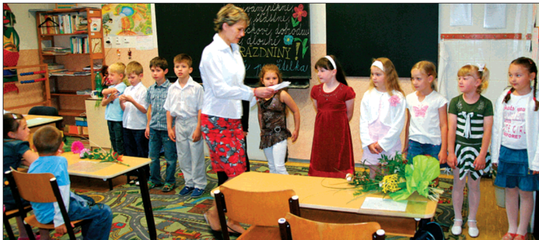
Prvníci zažívali své první ocenění za právě skončený školní rok.