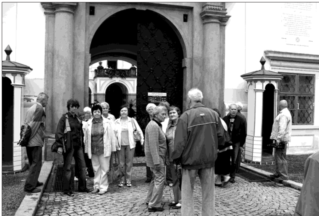
Bohuminští senioři před Arcibiskupským zámkem v Kroměříži.

Koncem května navštívili polskou Wislu a Ustroň. Obě města leží v jižním Polsku pod Slezskými Beskydami. Zájezdem nás doprovázela průvodkyně cestovní agentury Zdeňka Válková. Díky ní jsme se dozvěděli spoustu zajímavých informací. Byli jsme na kopci Rovnica, odkud byl úžasný výhled. Protější kopce - Malou a Velkou Čantoryji a Stošek jsme měli jako na dlani. Na oba tyto kopce jede z polské strany lanovka. Cestou do Wisly jsme si prohlédli malý dřevěný katolický kostelíček, postavený v letech 1981 až 1983. Obrovskou raritou zde je fakt, že má 31,5 metru vysokou věž z roku 1750, dovezenou z Wodzisławi. Ve výšce 431 m. n. m. jsme navštívili městečko Wisla s jeho 11 000 obyvateli na 110 km 2 . Z tohoto turistického střediska pochází trojnásobný vítěz Poháru světa ve skoku na lyžích Adam Malysz. V informačním středisku na náměstí Hoffa má tento sportovec svou sochu zhotovenou z čokolády.