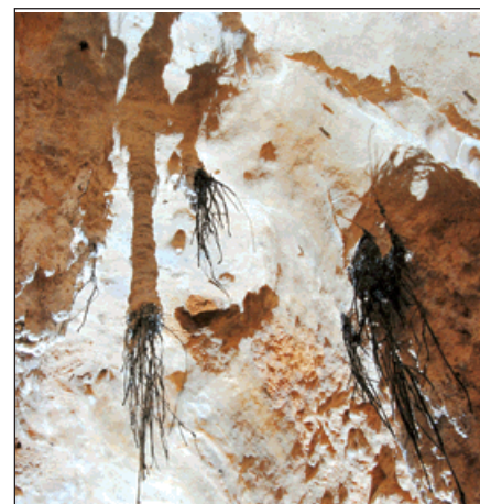
V objevené jeskyni jsme se kochali přírodním unikátem - stalaktity okolo prorůstajících kořenů.

dále zvětšujeme. Je třeba začít se seriózní akcí. Každá nová jeskyně ukrývá spoustu nebezpečí. Volné balvany, možnost sesuvu hlíny a skalních bloků a mnohá další. Je to nádherný pocit jako první vstupovat do prostor, kde před ob-