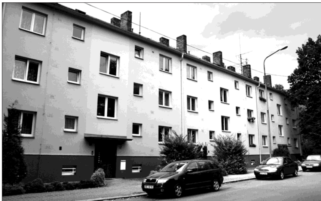
Městské domy v Masarykově ulici se už nových oken a fasády dočkaly.