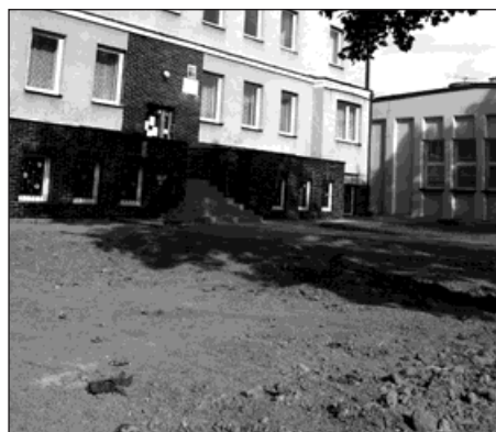
Před domem dětí a mládeže právě vzniká malé golfové hřiště.

V září proběhl postřik původní travnaté plochy tak, aby drny neprorůstaly do nově položeného trávníku. Na místo bylo dopraveno rovněž několik tun hlíny, která vyrovnala terén. »Zemina je rozhrnutá, probíhá tvarování a válcování plochy. Do 10. října chceme stihnout rovněž umístění pískového golfového bunkru,« uvedl zástupce ředitelky domu dětí a mládeže Ondřej Veselý.