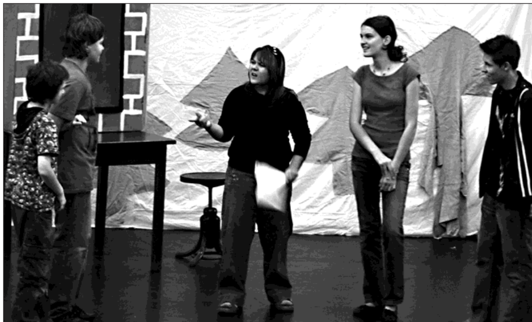
Mladí herci si pro bohumínské publikum připravili pohádku O perníkové chaloupce.

První představení je pohádka O perníkové chaloupce v netra-