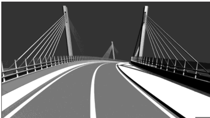
Do dvou let budeme jezdit po novém skřečošském mostě.

Od 25. do 30. října bude most uzavřen, přemísťuje se lávka pro pěší