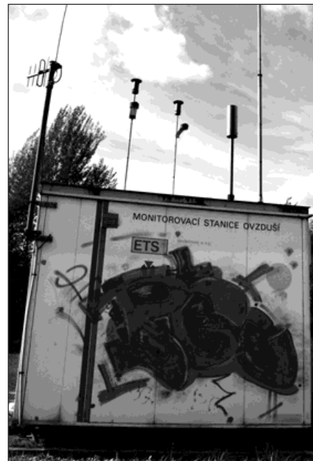
Sprejeři se nezastaví před ničím. »Vyzdobili« i jedinou monitorovací stanici ovzduší v Jateční ulici.

Nemalý vliv mají na znečištění ovzduší také malé zdroje, mezi které patří topení tuhými palivy v rodinných domcích. Kvůli rostoucím cenám zemního plynu se totiž mnoho občanů v rodinných domcích vrátilo k vytápění méně kvalitními pevnými palivy, například hnědým uhlím či kaly, což životnímu prostředí neprospívá. Město přitom do plynofikace vložilo desítky milionů korun. Do roku 2000 město zrealizovalo výstavbu plynového zařízení za 50,3 milionu a v roce 2001 až 2002 byla dokončena plynofikace Bohumína, kdy byla provedena výstavba zbývajících plynových zařízení v městských částech za