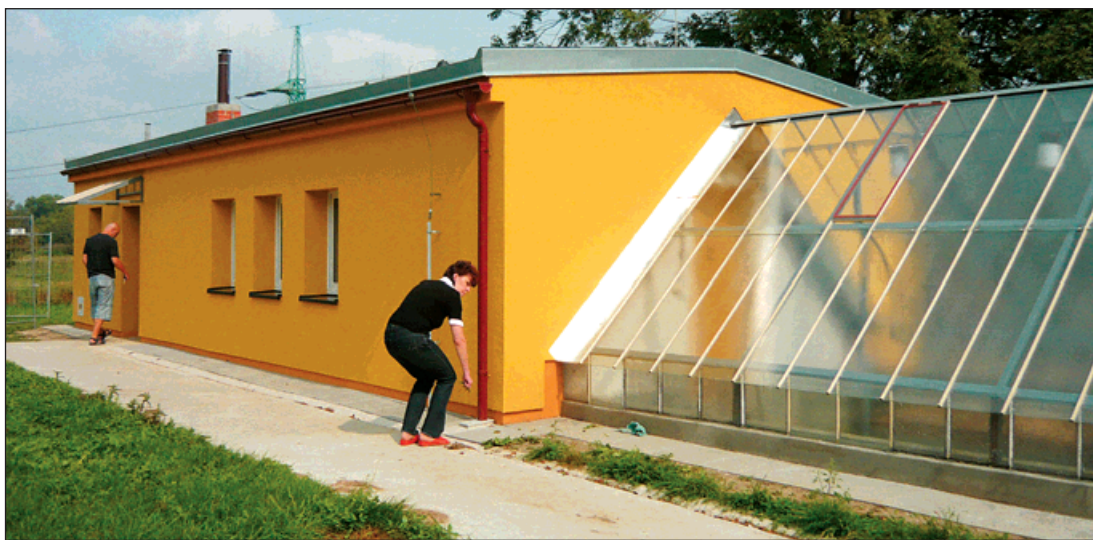
Nová podoba skleníku a učebny (vzadu) na školní zahradě v Pudlově, nový chodník.