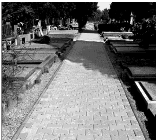
Opravené hlavní chodníky na hřbitovech ve Starém Bohumíně (1) a Záblatí (2).

Za pár dnů jsou tady Dušičky a Památka zesnulých. Kdo ještě neopečoval hrob, má nejvyšší čas. Město připravilo pro ty, kteří na hřbitovy chodí za svými zemřelými, příjemné překvapení.