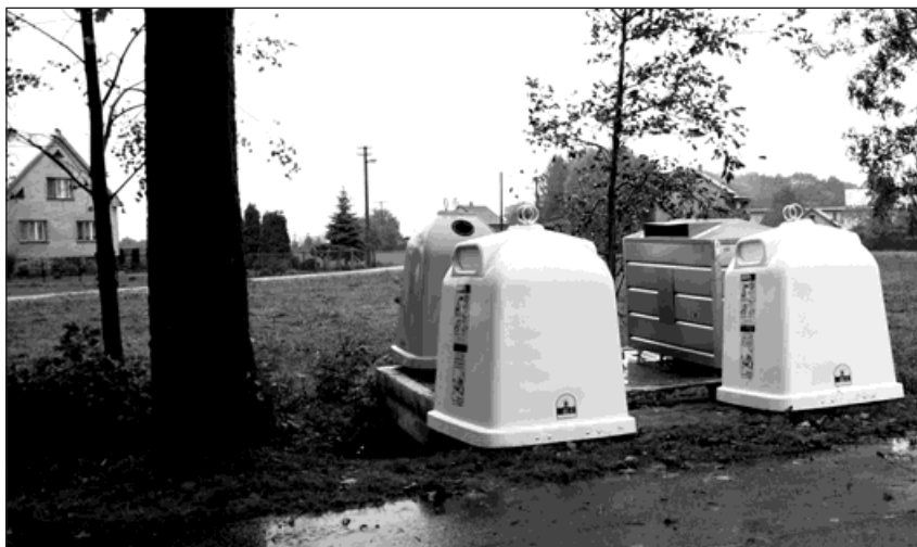
V Záblatí na Anenské ulici bylo separační hnízdo pro třídění odpadu přemístěno na místo původní autobusové zastávky.

Poslední svoz nebezpečného odpadu a elektrozařízení bude letos naposled proveden 17. listopadu. Celkově během roku již vyjždí tato sběrna čtyřikrát. Vozidlo, do kterého se materiály odkládají, stojí na jednotlivých stanoviš-