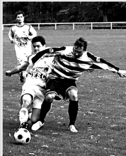
Ilustrační foto Zdeněk Šrubař