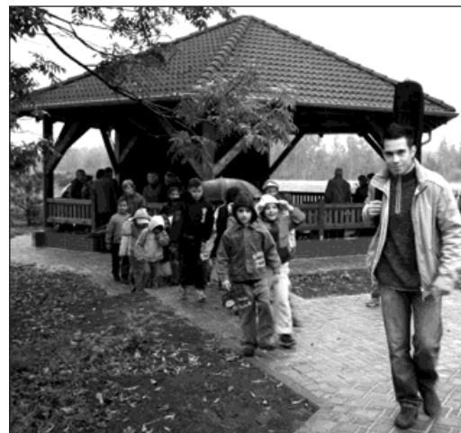
Nový výukový altán v zahradě pudlovské školy.