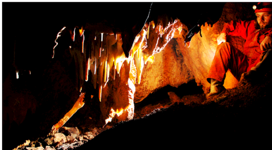
Bohumínská propast asi ještě nevydala všechna tajemství.

ná Pepa dokum skupin do ver těch, k končuj a důkl kamen na plat byla vy zdoba. dávám ně pro ale vše 20 me kopání koušim Veče »Koma menty, kyně a chodbu ní. Tach dy opě progra