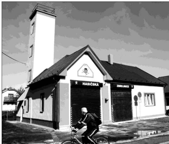
Hasičská zbrojnice po rekonstrukci.

»Náklady na opravu hasičárny v částce 680 tisíc korun pokryly výměnu dvou garážových rolovacích vrat, nová plastová okna,