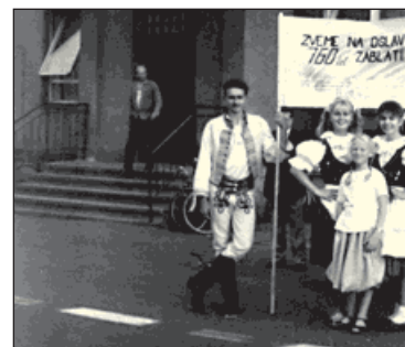
▲ Agitační skupinka z roku 1989 v příležitosti založení Záblatí.

ním a společenským životem. Vznikl zde čtenářský spolek Zahradka, na jeho půdě pak fungoval pěvecký kroužek i ochotnické divadlo. V roce 1911 byla v Záblatí založena tělovýchovná jednota Sokol a o 19 let později, v roce 1930, otevřena vlastní sokolovna. Pokračování ochotnické tradice se ujali právě sokolové. Lesík Vidlok se stal místem, kde vznikl Scheinerův háj, nádherné přírodní