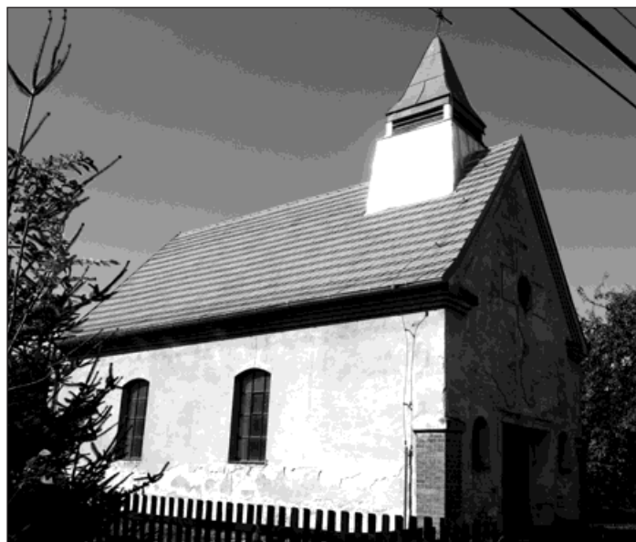
Příští rok bude dokončena rekonstrukce kaple sv. Jana Nepomuckého v Kopytově.

Kaple sv. Jana Nepomuckého v Kopytově letos dostala ozdravnou injekci ve výši 200 tisíc korun. Její krovy byla ošetřeny, napadené trámy vyměněny a statika věžičky vylepšena novými prvky.