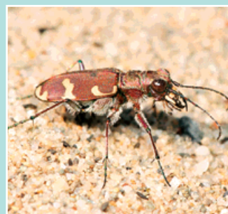
Dospělý svižník je dlouhý 11 až 16 milimetrů.

Dospělý brouk, dlouhý 11-16 milimetrů, se objevuje již brzo zjara, kdy čile pobíhá trhavými pohyby po suchých písečných svazích. Jeho měďově hnědavé nebo tmavozelené krovky splývají s barvou podkladu, takže si ho všimneme zpravidla až při jeho útěku. Je velmi plachý, a pokud zaregistruje naši přítomnost, rychle odlétá o několik metrů dál, přičemž mu ve slunci září modrý zadeček, jinak skrytý pod krovkami. Stej-