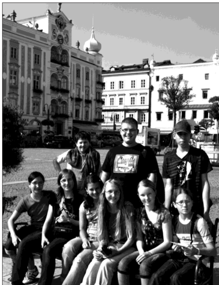
Bohumínští gymnazisté, výherci soutěže Expedice Eurorebus 2009, při návštěvě rakouského města Gmund.