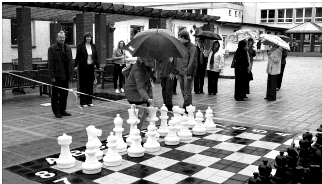
Slavnostní přestřižení pásky na školním dvoře Základní školy na ulici Čs. armády.

Další dvě školy ve městě začaly používat nově vybudované školní dvory, které dostaly nový smysl a využití. Základní škola na ulici Čs. armády je ukázkou, co vše může žák během povinné školní docházky využít. Nový školní dvůr nabízí zastřešené parkoviště pro kola, odpočinkový sektor pro hry a zábavu, část pro výuku vybraných předmětů, takzvaná učební hnízda, ale také estetické prvky. Přestavba si vyžádala náklady téměř 6 milionů korun a byla provedena během dvou prázdninových měsíců a prvního měsíce nového školního roku.