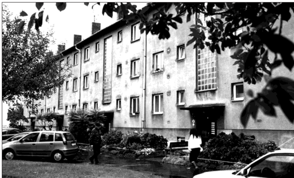
První družstevní domy v Bohumíně postavené v roce 1959.

První investice do revitalizace domů začaly v osmdesátých letech minulého století. Bylo to zateplování bočních stěn skelnou vatou a plechem. S komplexní revitalizací domů začalo družstvo v roce 2003. To představovalo celkové zateplení včetně střech a suterénů, výměnu oken, rekonstrukci elektrorozvodů ve společných prostorech, opravu balkonů a rekonstrukci výtahů. Celkovou opravu provedlo družstvo