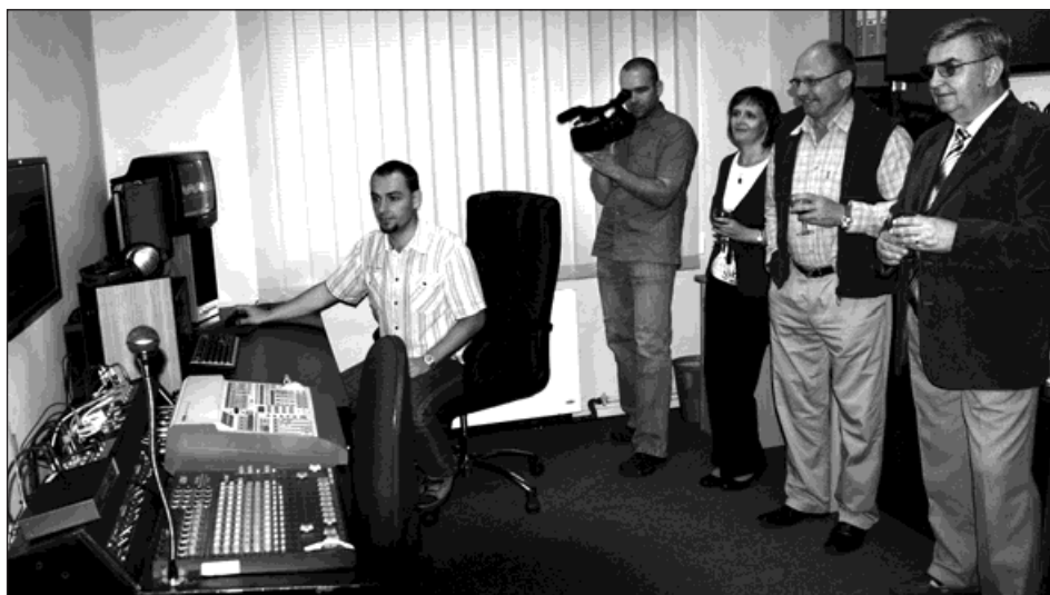
Nové prostory TV Marko jsou vybaveny profesionální televizní technikou.

Současný redaktor T.I.K.u Lukáš Kania spolupracuje se studiem od roku 2003. Úroveň zpravodajství a celého vysílání neustále stoupá, což dokumentují ocenění ze