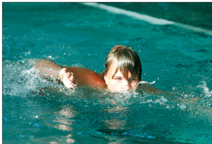
Tradičními účastníky soutěže Plave celé město jsou žáci základních škol.