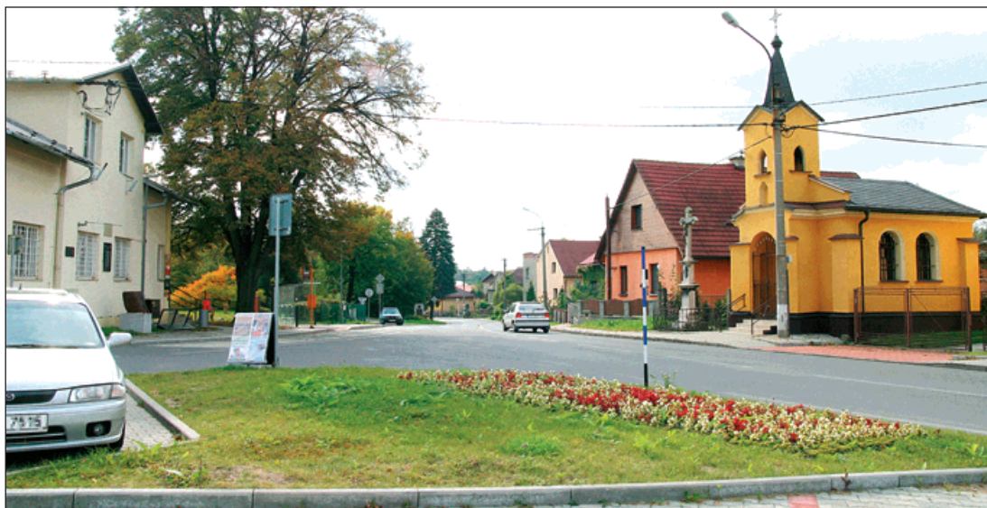
Náměstí s kapličkou sv. Jana Nepomuckého a dopravní točnou je nejznámějším pohledem do Záblatí. ▲ ◀ Nová část Záblatí na Tovární ulici s odstavným parkovištěm. (1) Základní škola s novým vstupem. (2)