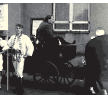
ve před sokolovnou na oslavy 760.

divadlo s amfiteátr pro 1500 diváků. Zajížděli do něj hostovat ostravští divadelníci, ale také umělci z Prahy. Scheinerův háj slyšel a viděl Prodanou nevěstu. V prvé řadě však sloužil záblatskému divadelnímu spolku, v jehož řadách účinkovaly desítky ochotníků.