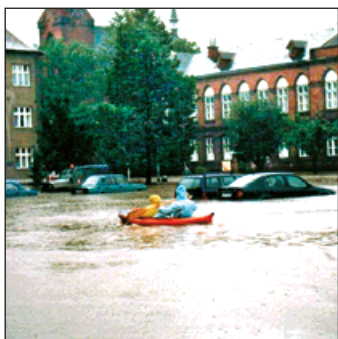
1997: S výjimkou Záblatí a Skřečoně bylo celé město pod vodou. Ta v centru dosahovala výše 75 cm.

Povodeň v roce 1997 je z historického hlediska událostí, která nemá ve městě obdoby. S výjimkou Záblatí a Skřečoně je celé město pod vodou. Humanitární pomoc zajišťuje armáda a Český červený kříž. Město schvaluje obecně závaznou vyhlášku o poskytování úvěrů vlastníkům obytných budov a bytů. Po ústupu vody se provádějí první nejnnutnější opravy komunikací. Železárny a drátovny se dostávají do finančních problémů. Bohumín slaví 150 let od svého vzniku. Městu je poprvé představena vizualizace dálnice D47. Do