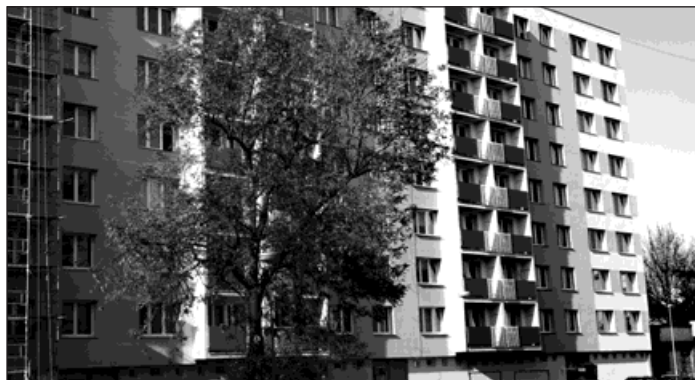
K úsporám tepla výrazně přispívá i zateplení fasád budov. Před dokončením zateplení je i blok domů na Štefánikově ulici.

Realizační firma je samozřejmě povinná uvést všechny povrchy do původního stavu a za dočasné záборы prostran-