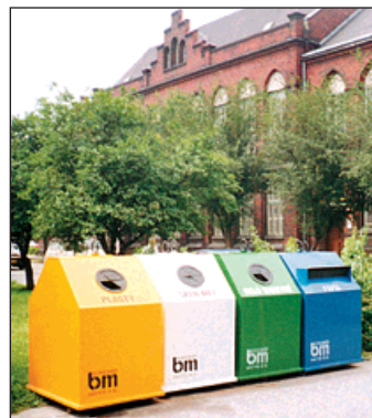
1993: V ulicích se objevují první separační kontejnery a BM servis zřizuje třířadovou linku.

Prioritou města se stává odpadové hospodářství. Bohumínský městský servis je transformován na akciovou společnost. V ulicích se objevují první separační kontejnery a BM servis zřizuje třířadovou linku. Zásady zdravého života ve městě prosazuje odbor životního prostředí, který v tomto roce na radnici nově vznikl. Městská policie buduje pro zvýšení bezpečnosti v Bohumíně pult centralizované ochrany. První obecně závazná vyhláška o hospodaření s městskými byty je na světě. Pro mentálně postižené děti se otevírá Domovinka. Kino dostává plynové vytápění. Průměrné ceny základních potravin jsou v tom roce poměrně vysoké - litr mléka 8 Kč, vejce 1,90 Kč, mouka 8,50 Kč, 1,5 kg chléb 10 Kč, vepřová kýta asi 100 Kč... Rozpočet města atakoval ve výdajích hranici 114 milionů korun.