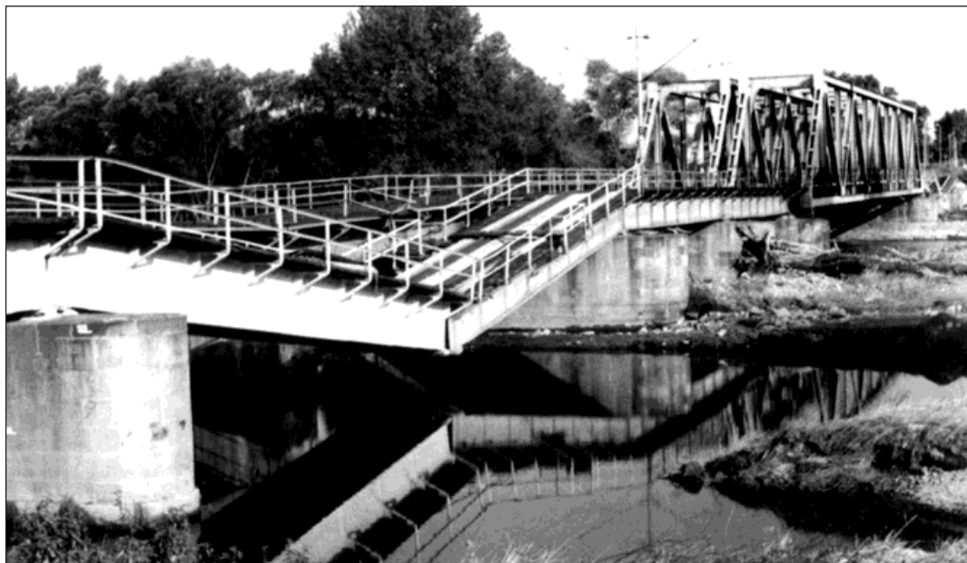
Železniční most poničený povodní v roce 1997.

Po železničním mostě, při jehož stavbě bylo použito kamenných pilířů, na které byla položena ocelová mostní konstrukce, projel první vlak z dnešního Bohumína do pruského Annabergu (dnešní Chałupki) 3. září 1849. Vzniklo tím nejkratší vlakové spojení mezi Vídní a Berlínem, čímž most získal velký strategický význam. Proto hned první den, kdy vypukla Prusko-rakouská válka (23. června 1866) a prus-