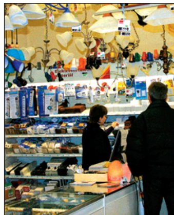
1991: V Bohumíně začínají fungovat první soukromé obchody a služby, mezi nimi i Pálka elektro.