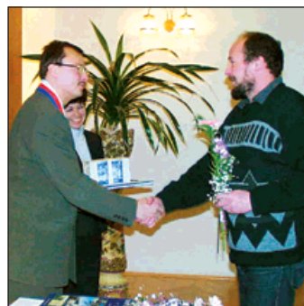
1998: Na radnici se poprvé scházejí dárči krve. Město jim předává finanční odměny jako výraz díků.

Bohumínská nemocnice slaví 70. narozeniny, je otevřen Parčík zakladatelů nemocnice ve Starém Bohumíně. Vedení města preferuje informovanost občanů a volí novou formu městských novin. Navíc je doplňuje o zpravodajství Televizního informačního kanálu. Na radnici