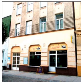
1992: Město začíná prodávat svůj majetek do soukromých rukou, zejména bytové domy.

fikaci. Městská rada postupně schvaluje další desítky žádostí o pronájem prostor k podnikání. Na podzim je zahájen provoz skládky komunálního odpadu. Ve volbách do Sněmovny lidu, Sněmovny národů Federálního shromáždění a České národní rady zvítězila v Bohumíně ODS před Levým blokem. Rozpočet města je téměř vyrovnaný a dosahuje necelých 100 milionů korun.