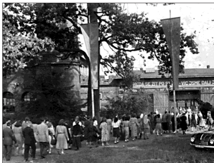
Fronta budov bývalých dílen dnes už nestojí, zůstal pouze komín, který je částečně ukrytý vlevo za stromem.

V prázdninových číslech jsme dvakrát zmiňovali věž v Šilheřovicích, která se mohla stát cílem vašich výletů. Po druhém zmínce se přihlásil Horst Roeder, přímý potomek Rajdů, kteří zde hospodařili.