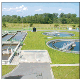
1995: Je zahájena výstavba čistírny odpadních vod, na kterou město získalo státní půjčku.

Nové vedení zpracovává první investiční koncepci města. Městské části mají své komise, jejich předsedy jmenovala městská rada. ŽDB oslavily 110 let svého trvání. K pronájmu může město nabídnout 130 nebytových prostor a 58 garáží. Nádražní budova září novotou po rozsáhlé pětileté rekonstrukci. V centru města je položena další zámková dlažba za dva miliony korun. Na festival dechových hudeb přijíždějí také soubory z Polska. Začíná první přeshraniční spolupráce. Je dokončen dům pro imobilní občany na náměstí ve Starém Bohumíně. Začíná fungovat profesionální hasičský záchranný sbor. Je zahájena výstavba čistírny odpadních vod. Rozpočet města dosáhl téměř dvojnásobku předešlého roku. Na výdaje šlo 332,9 milionu korun.