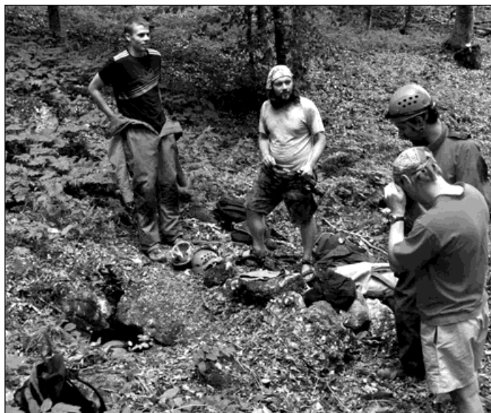
Objevený a rozšířený vstup do jeskyně Komar, který jako malou škvírku nalezl Luděk ve svazích velkého závrtu.

A před námi je opět 2000 kilometrů k domovu.