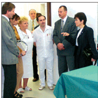
1996: Bohumín se po složitých jednáních stává zřizovatelem vlastní městské nemocnice.

Bohumín se po složitých jednáních stává zřizovatelem vlastní městské nemocnice, kterou získává od Okresního úřadu Karviná. Do země jsou položeny první rozvody kabelové televize bez majetkové účasti města. Další