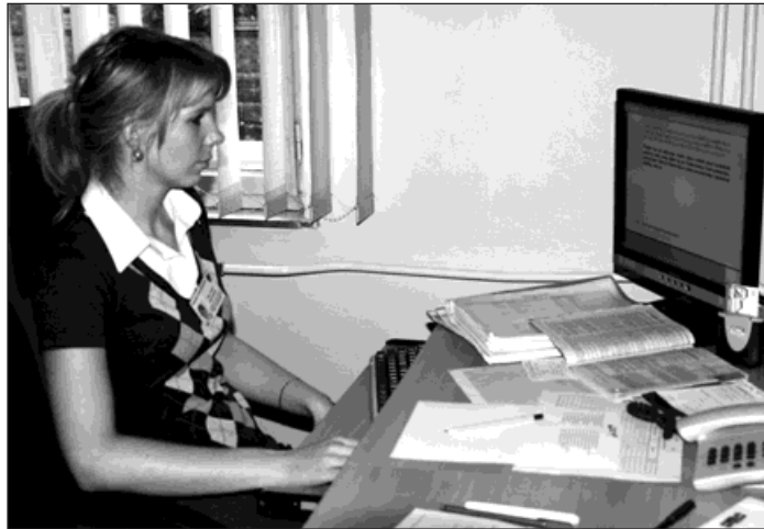
Jedním z míst na radnici, které budou komunikovat pomocí datové schránky je Czech POINT na živnostenském úřadu.

Město Bohumín má datovou schránku aktivovanou od 12. října 2009 a za 3 týdny do ní dorazilo více než 40 datových zpráv (většinou od vel-