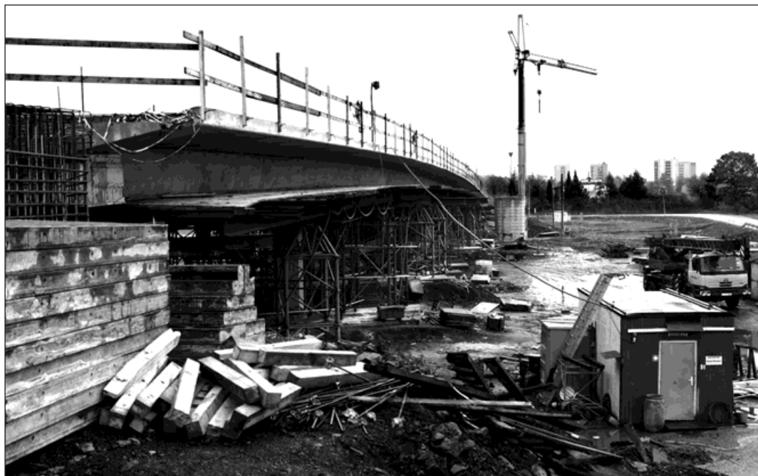
Nadjezd D47 na Šunychelské ulici směrem k centru.