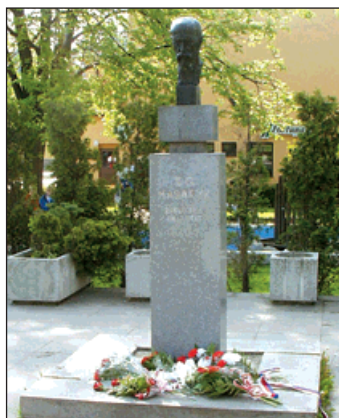
1990: Na náměstí T. G. Masaryka je navrácena busta prvního zakladatele Československého státu.