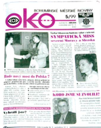
1999: Městské noviny Oko výrazně mění svou tvář, jsou zajímavější.