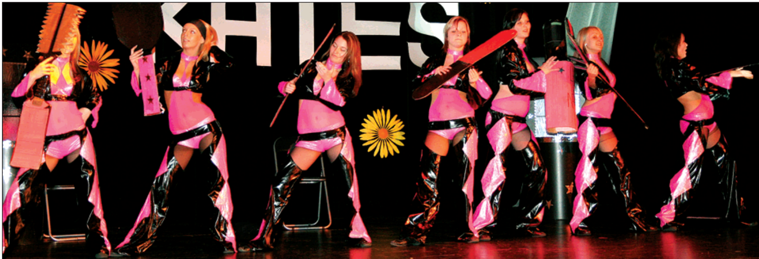
Tanečníci Katesu oslavili 20 let trvání souboru v sobotu 20. února slavnostním koncertem v kině K3.