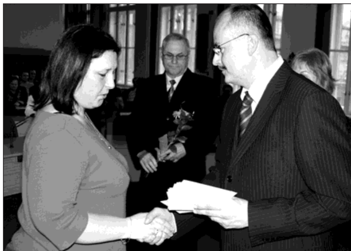
Při loňském setkání bylo na radnici, stejně jako letos, pozváno 46 občanů, kteří bezplatně darovali krev.

Od roku 1997 se datují každoroční setkání dárců krve se zástupci radnice i Českého červeného kříže. Finanční pomoc této organizace po povodních nastartovala myšlenku zveřejnit a ukázat na ty, kteří svým dárcovstvím zachraňují životy jiných. Jako projev uznání za tuto humánní službu město odměňuje symbolický-