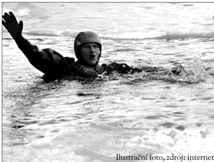
Ilustrační foto, zdroj: internet

Cvičení se zúčastnili také družební hasiči z polských Gorzyc a Dětmarovic. Odborná příprava měla nejdříve část teoretickou, kde se hasiči dozvěděli něco o teorii záchrany z ledu, hypotermii a řešení různých situací. Školení vedl dlouholetý záchranář Štěpán Klen spolu se svým kolegou Petrem Krčkem, kteří se na záchrany z ledu specializují. Poté následovala část praktická na Kališáku. Hasiči pod vedením vodních záchranářů navrhovali způsoby záchrany to-