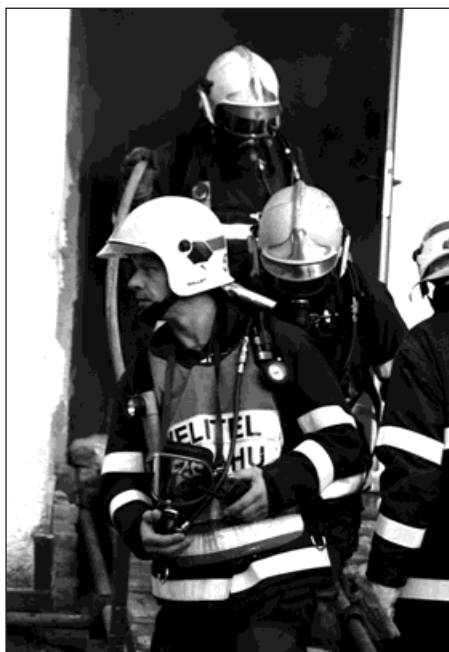
Zásah hasičů při řízeném požáru ve Skřečoni.

Technické havárie se sestávají z různých typů pomoci - od otevírání uzavřených prostor - byty, výtahy, přes záchrany zvířat z výšek a hloubek, čerpání vody ze sklepů či technologických zařízení mimo živelné události, dále různé úniky plynu či vody při poruchách v domech, pokud hrozí nebezpečí z prodlení. Spadlé elektrické drá-