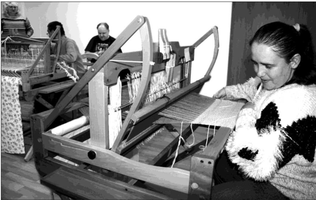
Dotace na rekonstrukci centra sociálních služeb dosáhla téměř 4 milionů korun.