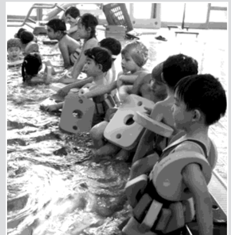
Ilustrační foto z mezinárodní plavecké školy v bohumínském aquacentru.