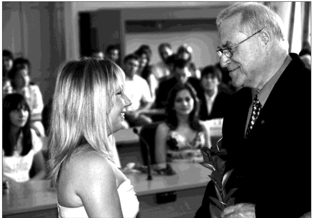
Komise pro občanské záležitosti zajišťuje i oceňování nejlepších žáků bohumínských škol.

Všichni členové majetkové komise přistupují k projednávání jednotlivých bodů programu se vší vážností a s jediným cílem - předložit orgánům města takové doporučení k jednotlivým projednávaným tématům, na kterém se shodne majetková komise jako ce-