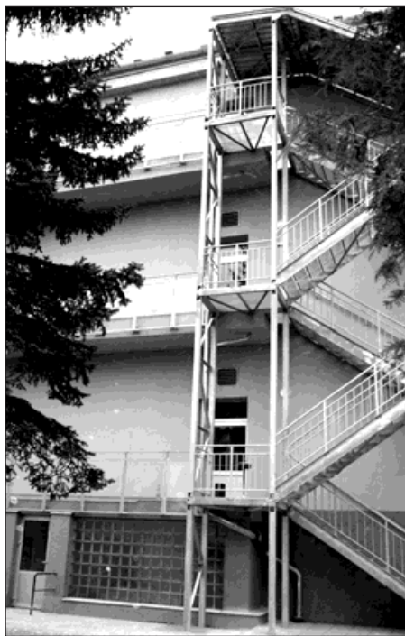
Boční vchod pavilonu B s venkovním bezpečnostním schodištěm.

V minulém roce byly provedeny nejradikálnější změny v pavilonech A a B, kde sídlí interní, chirurgické, plicní a další přídružená oddělení. Dokončila se zde výstavba a modernizace nových výtahů umožňující pohodlnější a rychlejší přesun pacientů. Do spojovacích chodeb mezi oběma pavilony byly instalovány nové automatické dveře, které přispěly k bezpečnosti i většímu soukromí pacientů a intimitě daného oddělení. K větší spokojenosti pacientů vede i dokončená oprava balkónů, které nejen v letních měsících zpříjemňují pobyt v našem nemocničním zařízení. Byly dovybaveny pokoje pacientů a dokoupena nová potřebná zdravotnická technika zaručující maximální komfort ošetření.