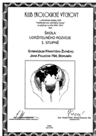
Certifikát »Škola udržitelného rozvoje 1. stupně«.

Titul je udělován školám ve třech stupních. První stupeň - nejvyšší, je udělován školám s dlouhodobějšími zkušenostmi v oblasti environmentální výchovy, kde jsou zapojeni téměř všichni pedagogové, škola má ustanoveného koordinátora, a může se pochlubit řadou programů k ekologické