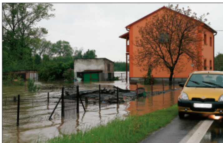
Pudlov: Ostravská ulice 18. května dopoledne.

Podle zkušeností z roku 1997 víme, že hlavní práce nastane, až opadne voda. Bude se muset vyklízet bahno, likvidovat uhynulý dobytek, odvážet zničený nábytek. Již v tuto chvíli máme příslib pomoci vojáků. Sociální pracovníci budou navštěvovat postižené rodiny s nabídkami sociálních dávek na nákup nejn nutnějších potřeb. Celá republika nám již nabídla pomoc materiální i finanční. Všechno půjde ve prospěch poškozených občanů.»