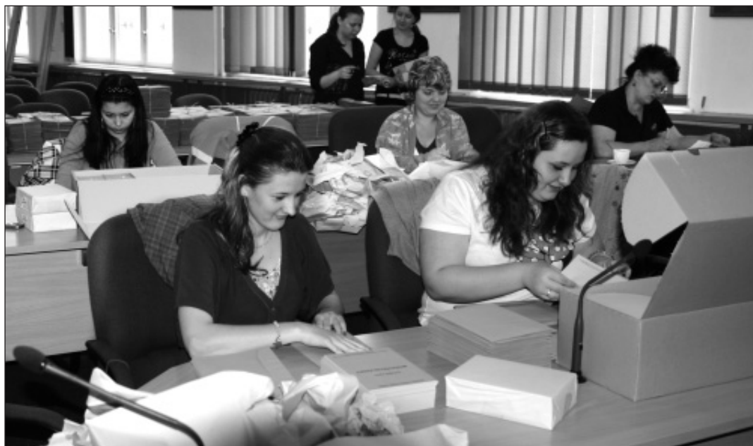
Studenti pomohli a připravili všechny obálky s hlasovacími lístky k distribuci.