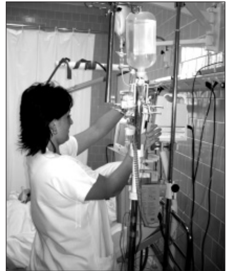
Jednotka intenzivní péče má čtyři špičkově vybavená lůžka.

Chirurgická ambulance II. na ulici Čáslavské, ve Středisku zdravotnických služeb, se zaměřuje kromě základní péče především na problematiku hemeroidů, mamologickou a onkologickou poradnu a také zde jsou prováděny plánované chirurgické