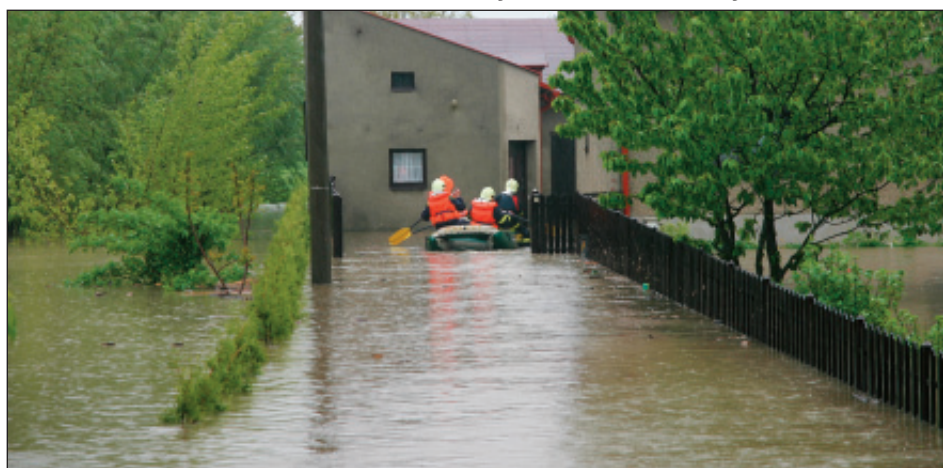
Nahore evakuace rodinného domku v Šunychlu. Dole odstraňování vyvráceného stromu v Pudlově.