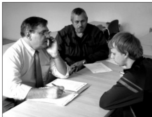
Závěrečné přezkoušení uchazeče.

V rámci projektu »Vzdělávejte se« proběhl ve dnech 26. dubna až 7. května pro zaměstnance ŽDB Group a.s., kvalifikační kurz »Obráběčské práce«. Úspěšně jej absolvovalo 11 uchazečů závodu Viadrus.