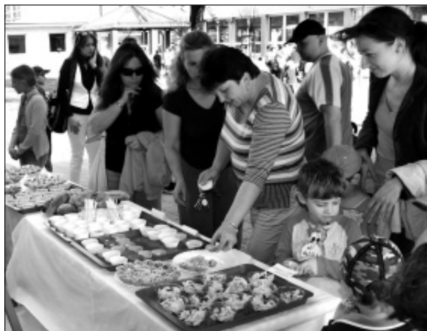
Návštěvníci odpoledního programu Dne zdraví mohli na dvoře školy na ulici Čs. armády ochutnat zdravé vaření.

Čekala na ně spousta pohybu, besed, tvoření, zábavy i zdravé stravy. Mohly si vyzkoušet břišní tance, cvičení na velkých gymnastických míčích a další netradiční sporty. Zajímavé byly i besedy s hasiči, policií, onkologem, gynekologem či přednáška o bylinkách a anorexii a bulimii. Zručné děti se přihlásily do keramiky, výtvarné tvorby, zpracování informací na počítači a v neposlední řadě do dílničky zaměřené na zdravé vaření a vykrajoování ovoce. Pro