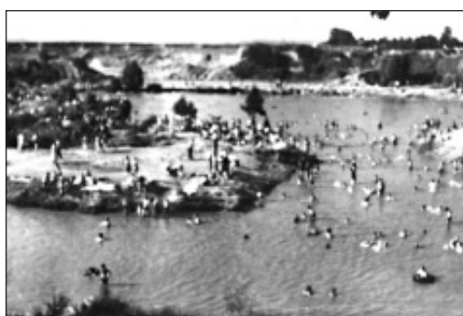
Archivní snímek z roku 1959 ukazuje ještě spojené rybníky v Gliňoči, kam se chodily koupat davy lidí. Při budování střelnice byla část rybníka zasypana.

V Gliňoči bývalo velké přírodní koupaliště, kde se o nedělích koupalo až osm set lidí. Byla tam čistá voda, protože to byla původně šterkovna. Krásné fotbalové hřiště bylo v místech, kde dneska stojí Rockwool. Hrály se tady zápasy i za umělého osvětlení. Na fotbal chodilo sedm set lidí. Rapid Skřečoš měl dobrý manšaft. Byla tady Dělnická tělocvičná jednota, Sokol Skřečoš, Orel nebo Polský tělocvičný spolek Síla.