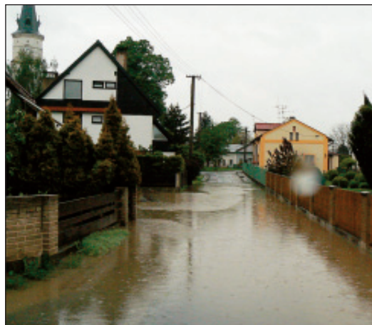
Starý Bohumín: (1) Zatopená kulturní památka vojenské opevnění »Na Trati«. (2) V Tiché ulici jsou pod vodou všechny zahrady.