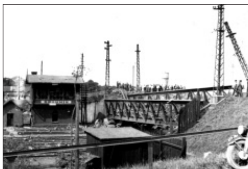
Pohled na skřečošský most z roku 1939.

Já jsem nastoupil k tramvajím ve čtyřicátém sedmém. Během několika měsíců jsem se z průvodčího stal řidičem a nakonec jsem dělal dispečera.