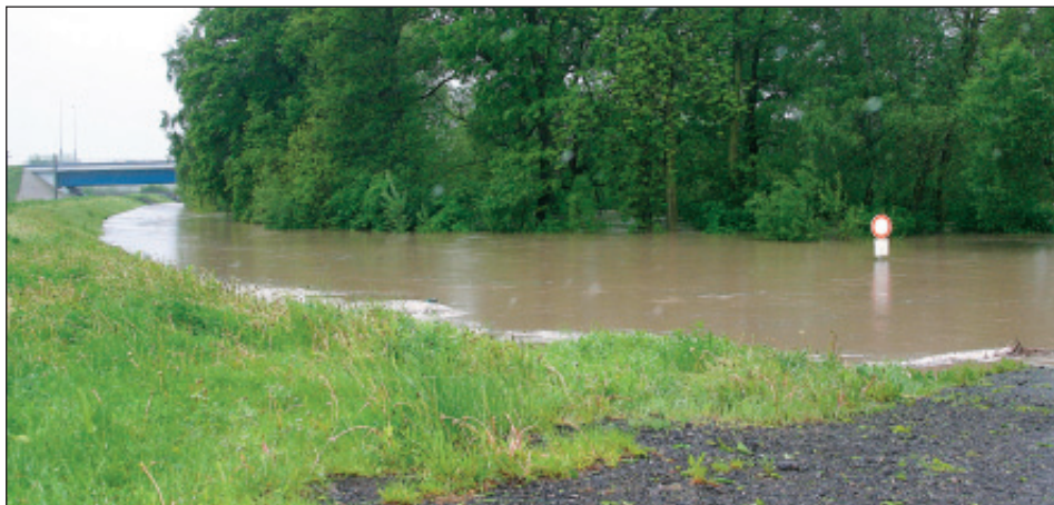
Pudlov: »Myší díra« s plujícími autem 17. května odpoledne. 4) Nové protipovodňové hráze ve Starém Bohumíně fungují - zabránily rozliti Odry do města.