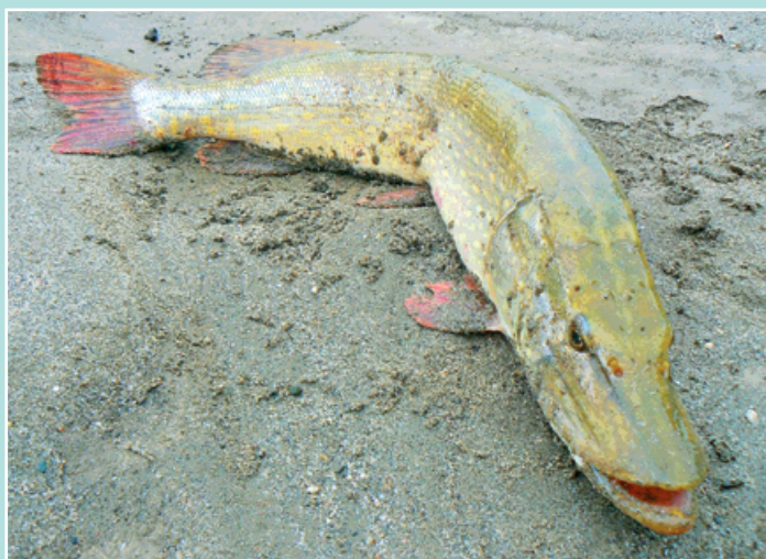
Zachráněný krasavec měřil 90 centimetrů.

Nevšední a zcela jistě nezapomenutelnou příhodu zažil s touto rybou autor snímku Libor Krišica. Po letošní povodni našel v hraničních meandrech Odry velkou štikou uvězněnou