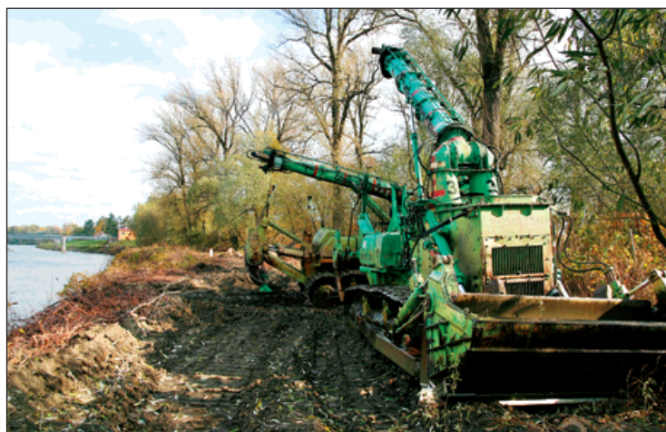
Vysílačkou ovládané kolosy čistily koryto Odry, aby zlepšily protipovodňovou ochranu Bohumína.