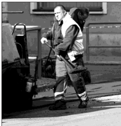
Cyklostezka ve Štefánikově ulici povede zčásti po silnici. Asfalt proto musí mít odpovídající barvu, aby ji oddělil od vozovky.