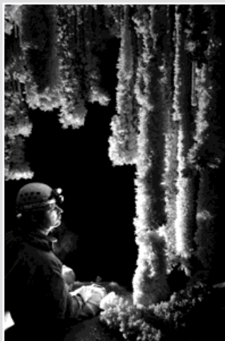
Fotografujeme části jeskyně Emine Bojir Chasar, které jsme před šesti lety nestihli.

Po návratu do tábora se dozvídáme smutnou zprávu. Na zhoubnou nemoc zemřel náš starý přítel a jeskyňář Žeňa