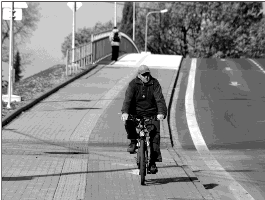
Zatím nejdelší úsek bohumínské cyklostezky začíná u mostu v Šunychelské ulici.

Zkušení velocipedisté dobře vědí, že je cyklostezky chrání před okolním provozem, a vznik nových tras kvitují s povděkem. Sváteční jezdci si ale na »novoty« těžce zvykají a je pro ně pohodlnější brázdit silnice, i když se tam pletou pod kola aut a ohrožují sebe i ostatní. I oni ale musí vzít existenci cyklostezek jako fakt, ze kterého pro ně plynou určité povinnosti. Pokud totiž u silnice