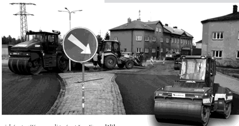
Položením finální vrstvy asfaltu u budoucího skřečoňského mostu skončil nepříjemný jednosměrný provoz řízený semaforem.