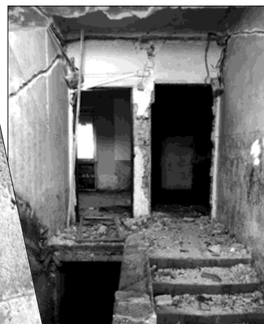
Nájemce měl domy zajistit proti vstupu nepovolaných osob. Ty jej ale hravě překonaly a domy vyrabovaly.

naší straně, budeme se snažit rozumně dohodnout, ať můžeme tuto kapitolu definitivně uzavřít,« poznamenala vedoucí majetkového