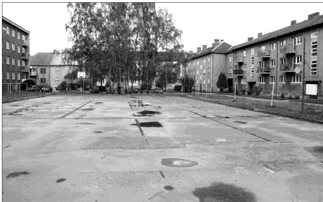
Nejslavnější éru už má plácek za sebou. Lidé z okolí teď rozhodují o jeho dalším využití.

Co s hřištěm teď? Má cenu investovat do jeho kompletní obnovy? Vždyť jen o pár kroků dál za prodejnu Hruška (dříve malý Albert) už jedno hřiště je. Blízko se nachází také zregenerovaný Rafinérský lesík. Má se tedy využít dvora od základů změnit? To mohou