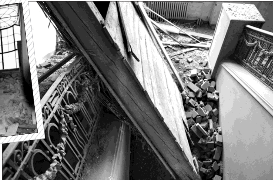
Plísňemi a houbami narušené trámy Národního domu, bývalého secesního hotelu z počátku 20. století, nevydržely. Zřítílo se asi padesát metrů čtverečních stropu.

Současná havárie v Národním domě je věc nepříjemná, ale ne překvapivá. Objekt bez údržby dlouhé roky chátral, a když se ho městu v roce 2007 konečně podařilo koupit, byl už jeho stav tristní. »Pád stropu zřejmě způsobilo napadení trámů plísněmi a houbami v souvislosti se zatékáním.« konstatoval Stanislav Svrčina z majetkového odboru. Stavbu prohlédne statik, ale už teď je jasné, že bude nutné narušenou část zajistit. Protože je objekt pod ochranou památkářů, oni