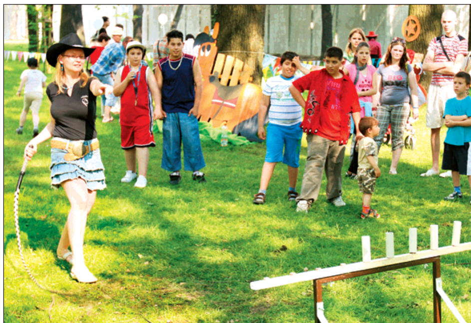
Malá kovbojka s »ohnivou vodou« a diváčky vděčná exhibice s bičem.