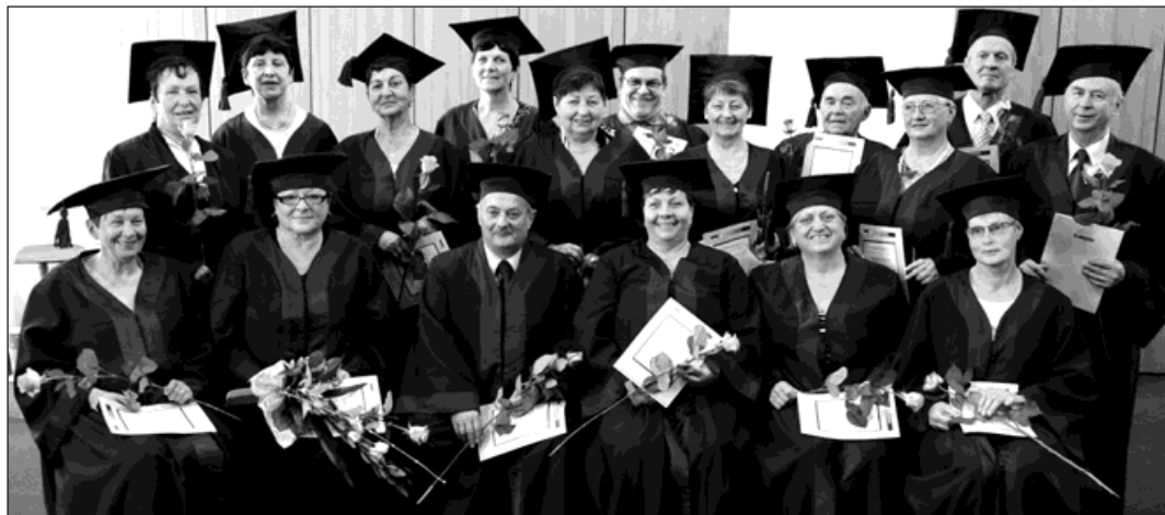
Univerzita dala studentům kromě vědomostí ještě jednu vzácnost - nová přátelství.

Bohumín má dalších osmnáct absolventů Univerzity třetího věku. Třináct žen a pět mužů zakončilo vzdělávací cyklus slavnostní promoci v obřadní síni radnice. Projekt U3V pro město připravuje Vysoká škola podnikání Ostrava.