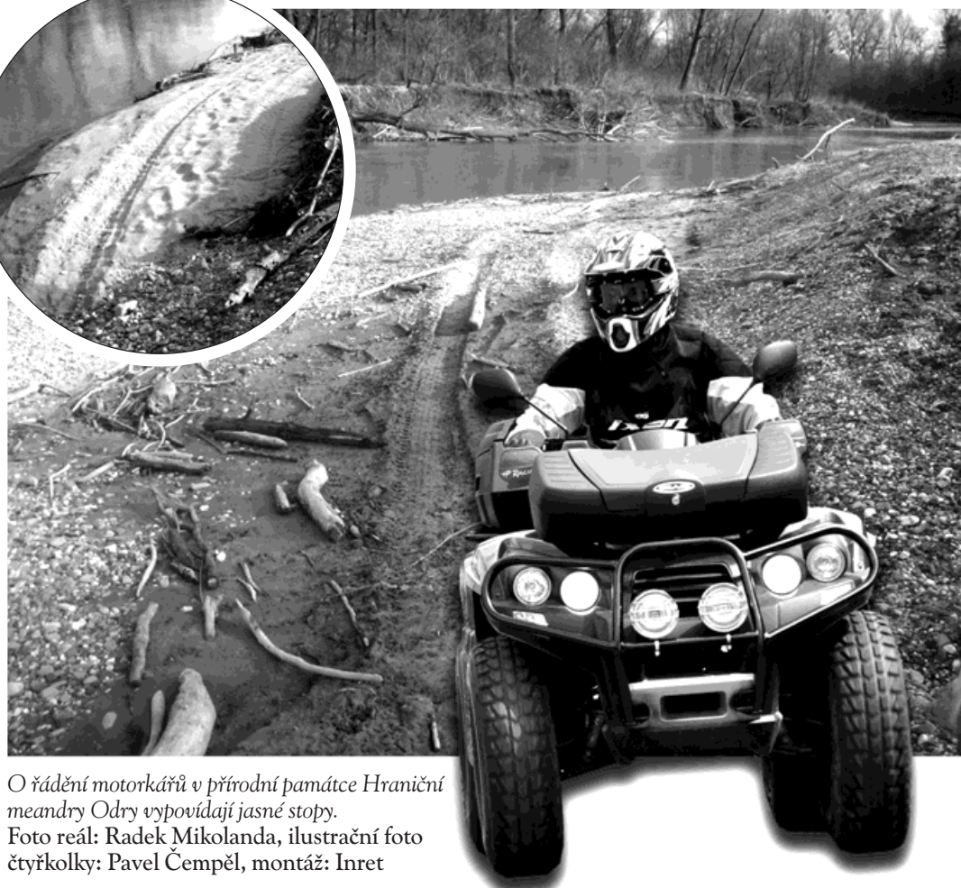
O řádění motorkářů v přírodní památce Hraniční meandry Odry vypovídají jasné stopy.

Nemám vůbec nic proti adrenalinovým sportům, když se provozují na patřičném místě. Podobné aktivity sleduji v posledních letech na jedné písčinné na Hlučínsku, kde terénní závodění čtyřkolek a motocyklů dokonce vítám.