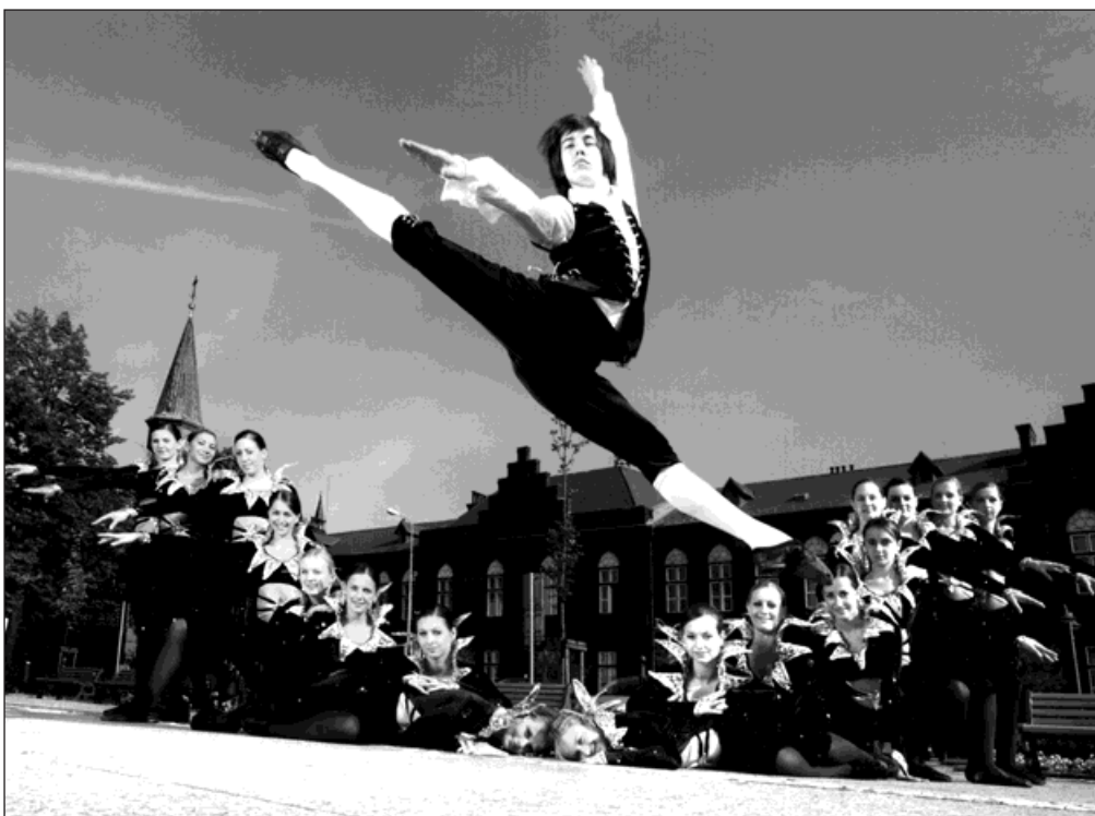
Jedna z fotografií aktuální výstavy tanečního souboru Impuls.

V zasedací síni radnice se tanečníkům dostalo uznání a díky za excellentní reprezentaci města. Soubor obdržel desetitisícový finanční dar a jeho členové se zveřejnili svými podpisy do pamětní knihy. Čekalo však na ně ještě jedno milé překvapení. V Galerii na chodbě v prvním patře radnice byla nainstalována nová výstava. Jsou to zvětšeniny uměleckých fotografií Impulsáků, pro které pózovali před objektivem na netradičních místech. Jsou zachyceni při tanečních kracích na náměstí, na rozestavěné dálnici nebo v tovární hale. (red)