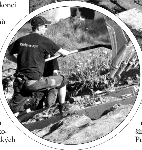
Stavba »schůdků« ve Starém Bohumíně. Trojice nástupních míst na české straně vyjde na 4,5 milionu. Devadesát procent nákladů pokryje dotace z Evropské unie.