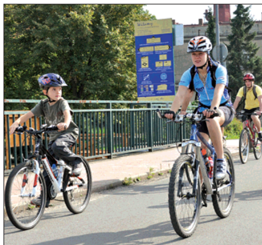
Bohumíňáci mohli volit mezi trasami různé náročnosti. Ta snazší startovala ze Starého Bohumína.

Akci aktivně podpořilo také přes šest desítek bohumínských cyklistů. Cyklistický had se na své cestě zastavil hned u několika kapliček v Czyżowicích, Gorzycích, Olze a Bluszczowě. V Olze se k pelotonu přidali další Bohumíňáci, kteří zvolili kratší trasu.