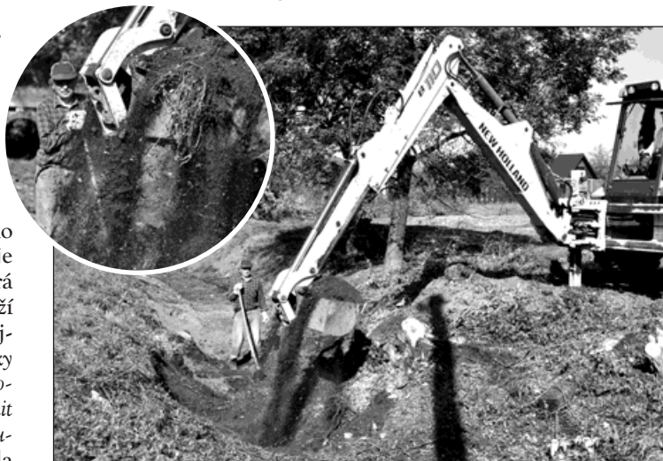
Zeminou i odpadem zanesený suchý příkop v Pudlově čistila těžká technika.