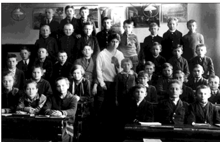
Vlevo prvorepublikové České státní reformní reálné gymnázium v Bohumíně a jeho žáci. Vpravo dnešní generace studentů Gymnázia Františka Živného.