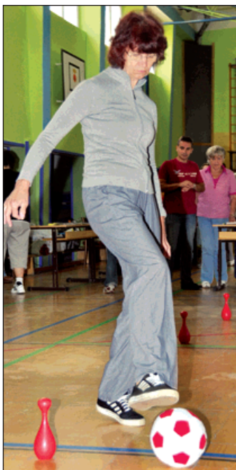
Slalom s míčem na čas.

Příjem kalorií bylo třeba také kompenzovat pohybem, a tak přišel čas sportovních klání. Soutěžící si vyzkoušeli košíkovou, slalom, překážkovou dráhu, nebo stěhbu na cíl. Zpestřením příjemně stráveného dopoledne bylo také kulturní vystoupení, letos v podání souboru Havřířovské babky. (erh)