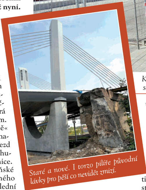
Staré a nové. I torzo pilyře původní lávky pro pěší co nevidět zmizí.

upomínka na původní přemostění, bude odtěžen také. Na řadu však přijde až později v rámci terénních úprav.