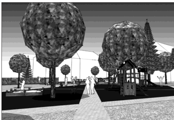
Studie vnitrobloku Nerudova – u hřbitova.

Ze 185 oslovených domácností v dané lokalitě odpověděla na anketní otázku čtvrtina. Jen čtyři procenta z nich byly kategoricky proti úpra-