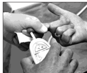
Měření hladiny cholesterolu z kapky krve.

Světový den srdce, do kterého se zapojuje přes sto zemí, vyhláší Světová federace srdce (WHF) spolu