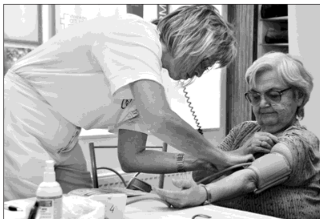
Vyšetření zabralo pár minut a bylo bezplatné.

se Světovou zdravotnickou organizací (WHO). V Česku umírá ročně na srdečně cévní onemocnění 54 tisíce lidí, ve světě 17 milionů. Jde o nejzávažnější civilizační chorobu. Odborníci se shodují, že hlavní vinu nese nedostatek pohybu, příliš kalorická strava s přemírou živočišných tuků, stres, a pochopitelně i kouření a nadměrné požívání alkoholu. Právě změnou životního stylu je přitom možné až osmdesát procentům úmrtí na tento druh onemocnění předejít. (red)