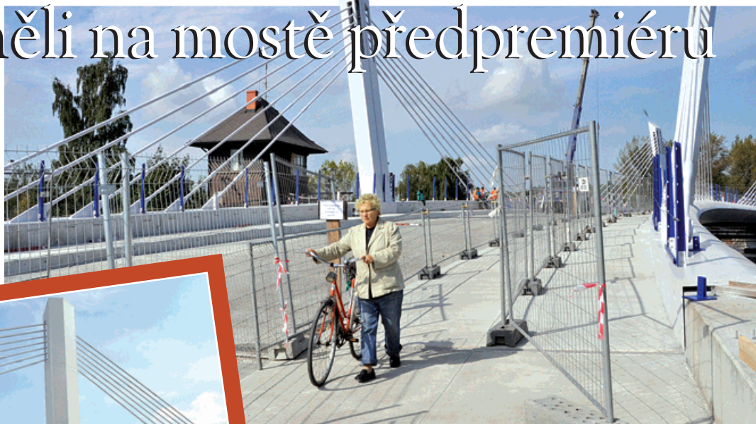
Kvůli bezpečnosti lemuje chodník drátěný plot. Na zbytku mostu se stále pracuje.

Není to žádné »nadřívání« ekologickým formám dopravy, zprovoznění chodníku na mostě má ryze praktické vysvětlení. Kvůli dokončovacím pracím museli stavbaři demonstrovat dosavadní staříčkovou ocelovou lávku, která vedla souběžně s mostem. Zmizelo také »schodiště« z lešení, které dočasně nahrazovalo odtěžený nájezd ze zeminy na novobohumínské straně železnice. Kopeček na skřečošské straně u nevyužívaného drážního stavědla, poslední