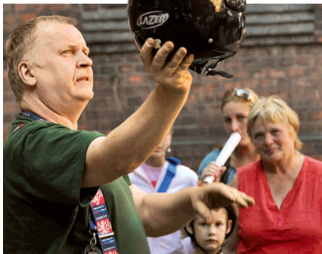
▲ Motorkářská přilba za dvě stovky. No, nekupte to. Celou čtvrtinu dražených předmětů tvořila jízdní kola.

Většinu položek si zájemci rozebrali už v prvním kole. Do druhého, ve kterém se vyvolávací cena snižuje, se dostalo jen šest ze sedmdesáti věcí. Prodal se všechny, až na jednu sluneční brýle. Ty byly nakonec z dražby kvůli »skryté vadě« vyřazeny. (tch)