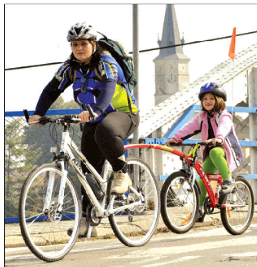
Do pohraničí se vydala i některá velmi originální cyklistická vozítka.

V Rogowě pak na všechny milovníky cyklistiky čekal piknik. Nechyběly ale ani cyklistické soutěže mezi českým a polským týmem v disciplínách jako byly želví jízda anebo cyklistický slalom s překážkami. Závodilo se i ve vrhu cyklistickými dušemi anebo v přetahování lanem. Z vítězství se nakonec radoval polský tým. Mezinárodní projekt finančně podpořila Evropská unie z operačního programu Přeshraniční spolupráce. (balu)