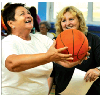
Chvilé soustředění a vsítit koš už je hračka.