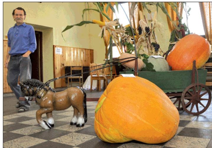
Největší exponát výstavy. Dýně vážící 65 kg vyrostla na zahrádce Heleny Hanuskové.

Problém však nastal u dveří, kterým nešlo otevřít jedno křídlo. V omezeném prostoru s ní museli manipulovat jako s přerostlým »ježkem v kleci«. (red)