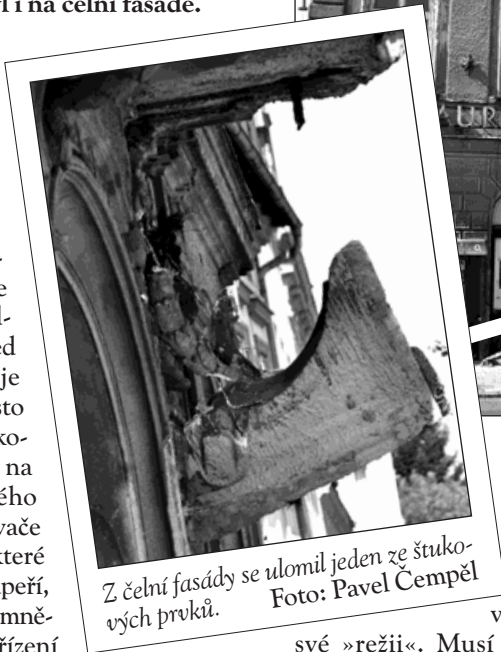
Z čelní fasády se ulomil jeden ze štukových prvků.

rozvoje a investic. Dodala, že vzhledem k ročnímu období a délce opravy bude mít vítězná firma v zimě celou střechu ve své »režii«. Musí se zkrátka o střechu o ploše 1150 metrů čtverečních postarat a zajistit před případným sněhem i ty části, na kterých se nebude pracovat. Strop nad hlavním schodištěm bohužel nebyl