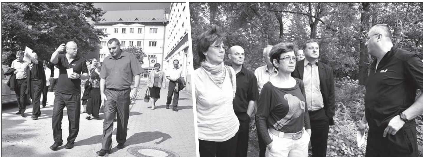
1) Výjezd každoročně absolvují zastupitelé a předsedové komisí pro městské části. 2) Obhlídka bývalé skládky v Budovatelské ulici u Bagince. Po její rekultivaci by měla lokalita sloužit k relaxaci.

Obhlídku stavenišť i míst, která na svou proměnu teprve čekají, mají za sebou naši zastupitelé. Po jednání vyrazili na tradiční obhlídku do ulic Bohumína. Nejprve pěšky a do vzdálenějších míst je dopravil autobus.