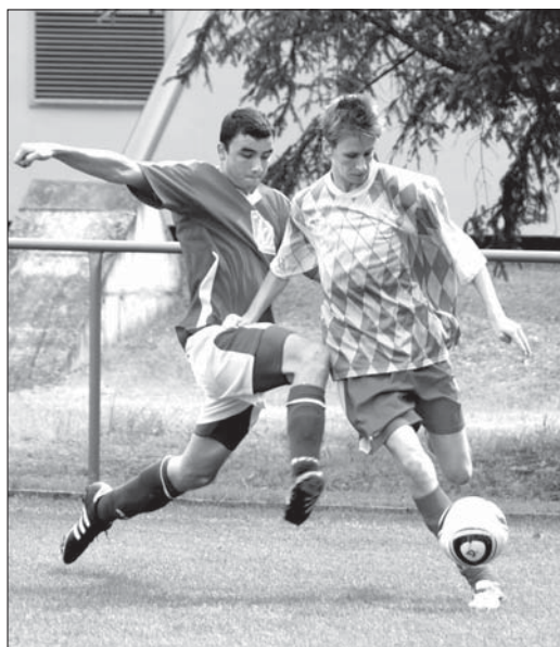
V úvodním zápase turnaje podlehl Slovan Záblatí sousední Dolní Lutyni (kostkované dresy) 0:2.

V sobotu 22. června se dorostenci Slovanu Záblatí zúčastnili tradičního Mezinárodního turnaje staršího dorostu pořádaného FK Bohumín. Mezi čtyřmi účastníky ze Slezska jsme obsadili 4. místo za mužstvy FK Bohumín, Sokol Dolní Lutyně a LKS Orzeł Zabłocie.