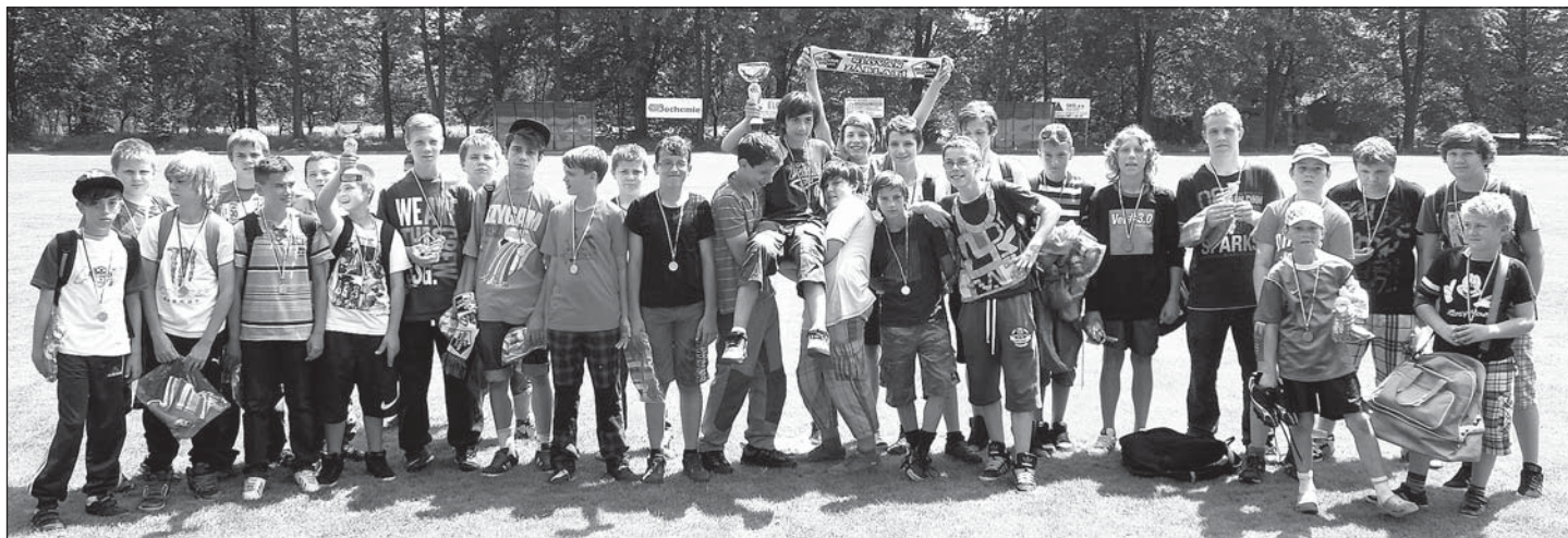
Mladí účastníci mezinárodního fotbalového klání.