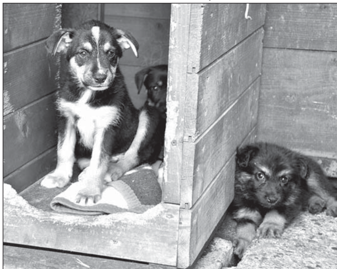
Těžko uvěřit, že někdo dokázal barbarsky vyhodit něco tak roztomilého.

Lidé jsou občas větší bestie než zvířata samotná. V Bohumíně už se dříve našli malí pejsci v lese, v popelnici. Ale sedm chlupáčů, kteří by ještě