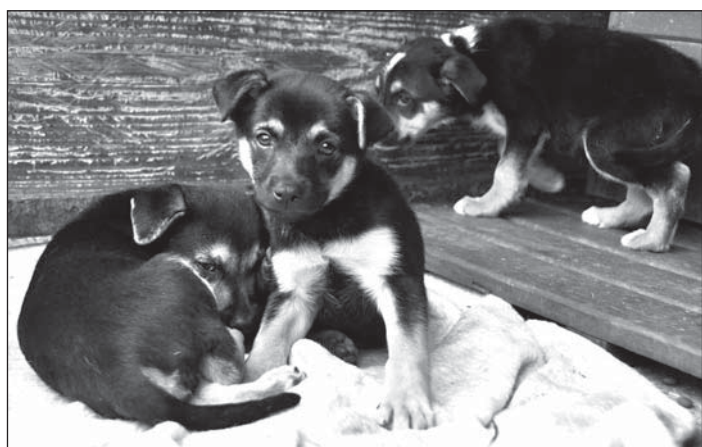
Sedm kříženců, z nichž každý byl originál, strávilo v útulku jen pár dnů. Bleskurychle si je rozebrali hodní lidé.

měli být u matky, vyhozených v bedně na maso? Něco tak odporného tu ještě nebylo.