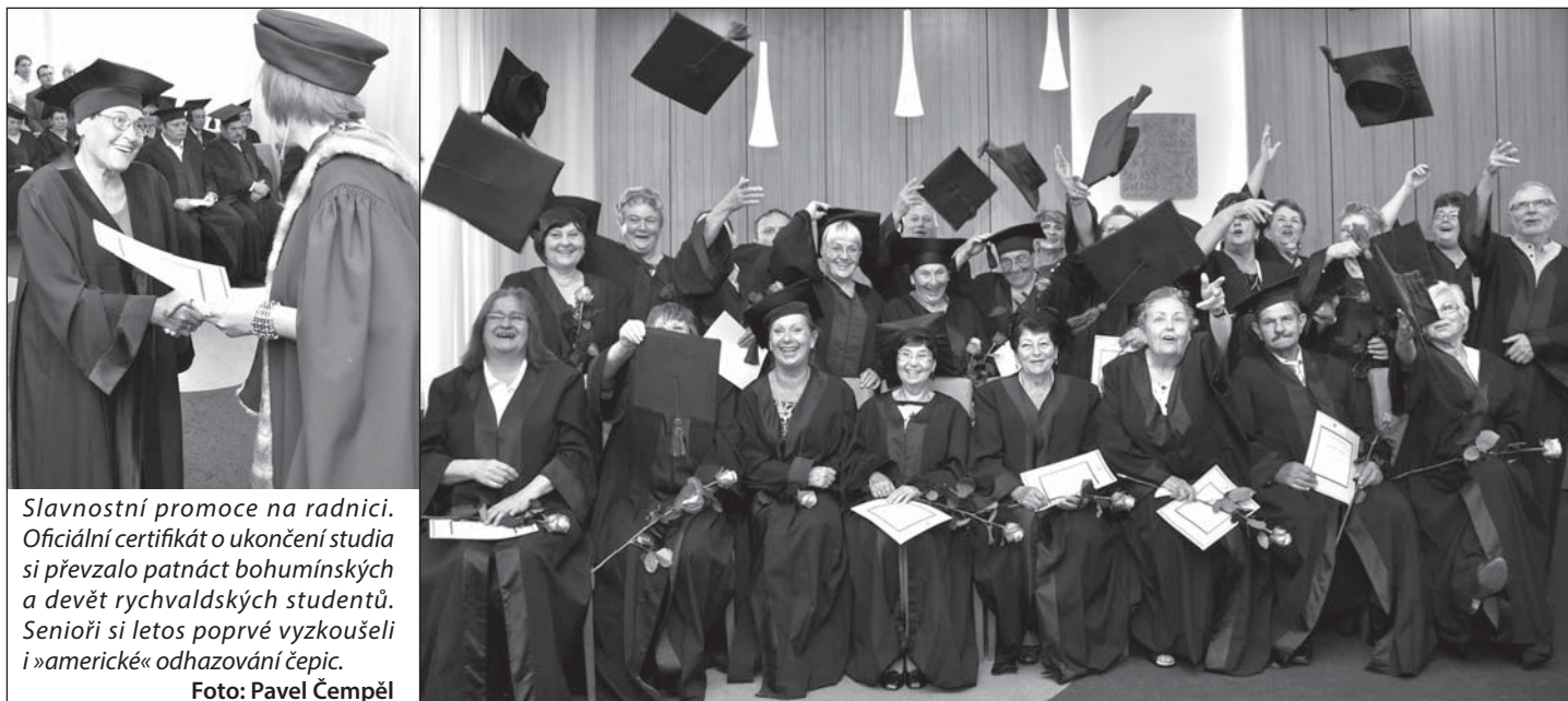
Slavnostní promoce na radnici. Oficiální certifikát o ukončení studia si převzalo patnáct bohumínských a devět rychvaldských studentů. Senioři si letos poprvé vyzkoušeli i »americké« odhazování čepic.

Ke studiu se mohou přihlásit senioři z Bohumína, Rychvaldu a Dolní Lutyně. Jejich radnice jim na U3V přispívají. Jeden semestr přijde na 1 800 korun, Bohumín a Rychvald hradí každému studentovi dvě třetiny nákladů, Dolní Lutyně polovinu. (tch, balu)