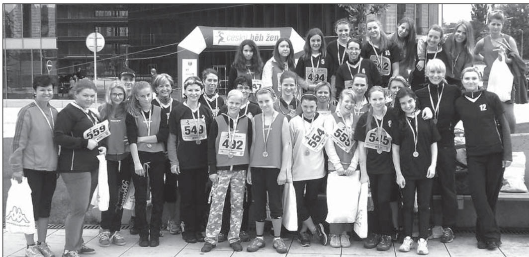
Masarykova škola vyslala do závodu nejpčetnější výpravu a slavila prvenství.

Ženská sekce bohumínské Masarykovy školy přijala tuto informaci jako výzvu. Proč si nejt zaběhat? Líbilo se nám motto závodu »Ženy, odskočte si od sporáku a udělejte něco pro své zdraví«. Je pravda, že přemlou-