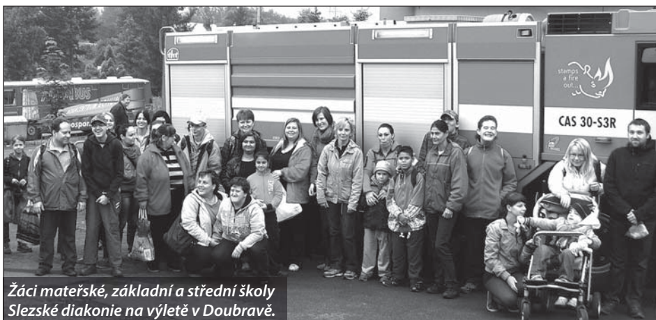
Žáci mateřské, základní a střední školy Slezské diakonie na výletě v Doubravě.