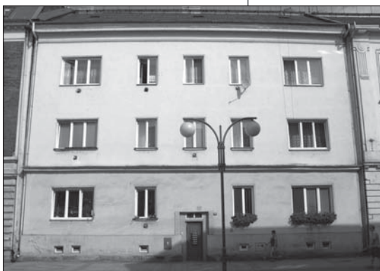
V tomto domě ve Studentské ulici 156 se nyní v licitaci nabízejí dva byty 1+1. Dům je nízkopodlažní, cihlový, stojí v centru města a byla v něm zřízena funkce domovníka.