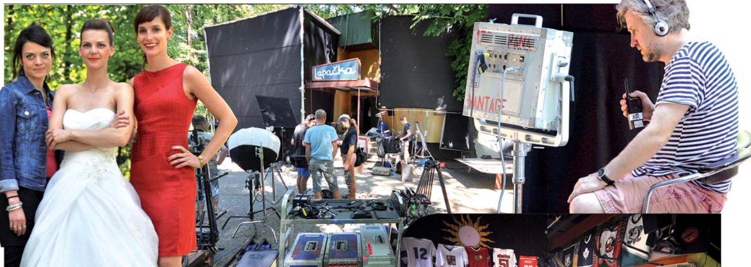
Ústřední herecká trojice – Jana Stryková, Zuzana Stavná, Hana Vágnerová. Vpravo režisér Jan Hřebejk v akci. Hudební klub Bublina v bohumínském parku si zahrál hokejovou hospodu »Lapačka«.

Kamera, klapka, akce! Mimořádně pilný režisér Jan Hřebejk, který zásobuje kina každý rok minimálně jedním filmem, točí konverzační komedii Zakázané uvolnění. Jednu ze stěžejních lokací našel v Bohumíně, v parku Petra Bezruče, kde se v polovině prázdnin se svým štábem »utábořil«.