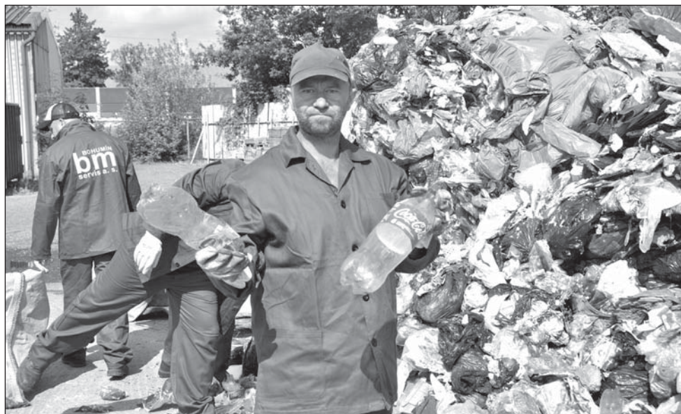
Odpad, který by běžně skončil na smetišti, vysypal popelářský vůz 5. srpna v areálu BM servisu. Pracovníky BM servisu čekal v tropickém počasí nelehký úkol. Vytřídit plasty a další komodity z šestitunové hromady smetí.

V Bohumíně žije mnoho bezdětných boháčů. I tak si lze vyložit výsledky pokusu, který proběhl počátkem srpna. V popelnicích ze sídlišť se našlo dvacet procent materiálu, který tam nemá co dělat. Patří do separačních nádob. Z toho vyplývá, že lidé ignorují ekologii a nemyslí na budoucnost svou a potomků. A také že neumí či nechťejí hospodařit. Množství vytríděného odpadu totiž ovlivňuje cenu za odvoz popelnic.