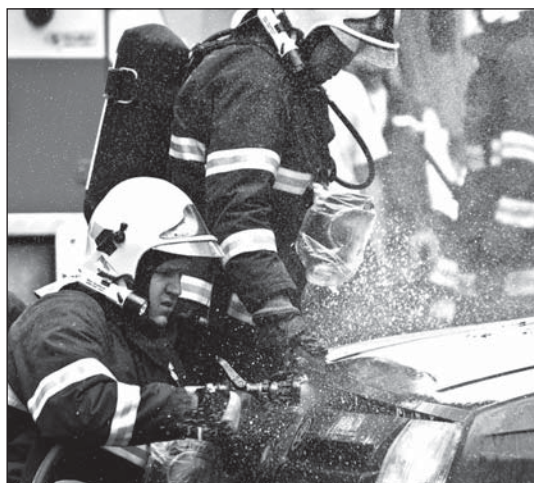
Program oslav zpestřily atraktivní ukázky zásahů. Na plácku za sokolovnou hořelo auto, vypukl chemický poplach a osobní vůz »srazil« cyklistu.