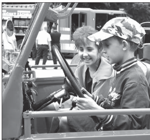
Historické i moderní vozy představili místní dobrovolní hasiči, SDH Starý Bohumín, Šunychl, Doubrava a profesionální hasiči z Bohumína, Karviné či Ostravy.