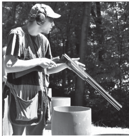
Střelci v hlavní soutěži měli za úkol zasáhnout čtyřicet letících holubů.

Na střelnici dorazilo jednadvacet soutěžících z celého Karvinska. Přesnou mušku prokazovali ve dvou disciplínách