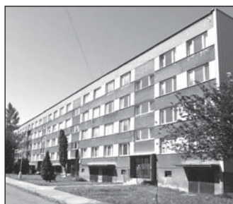
V tomto domě v ulici Osvoboditelů se nabízejí dva byty. O první z nich velikosti 1+2 se licituje 21. srpna. Druhý 1+3 jde do licitace až 16. září.