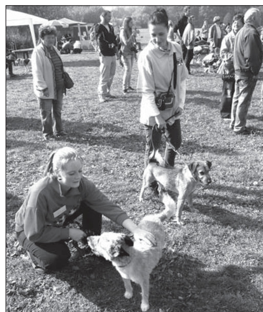
Dva pejskové z bohumínského útulku v Ostravě nové páníčky nenašli.