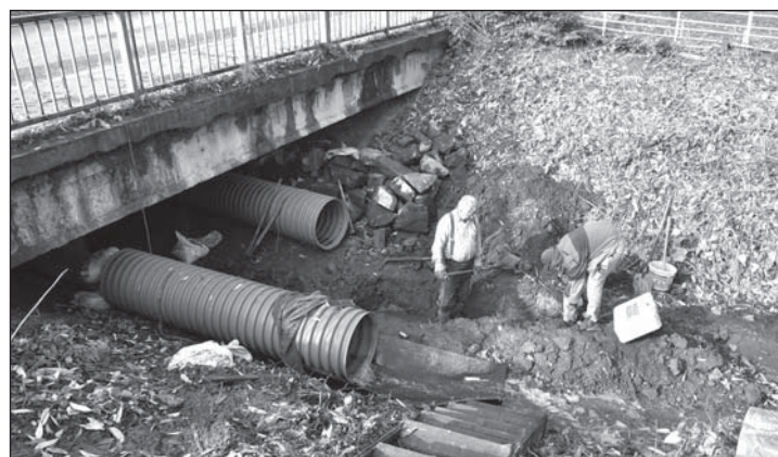
Pod můstkem ve Slezské ulici ve Starém Bohumíně probíhají práce ke zlepšení průtoku vody v Bajcůvce.

■ Myšlenka vybudovat v Kopytově lávku přes Olši na polské území, která by propo-