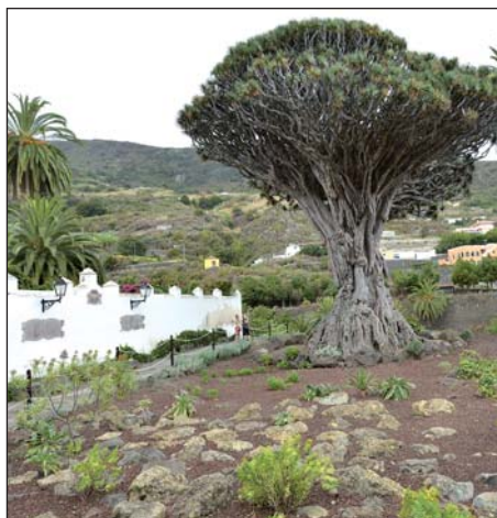
Město Icod de Los Vinos a v něm nejstarší a největší dračí strom.