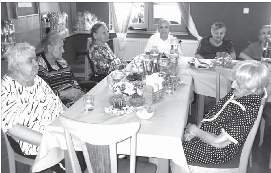
Senioři na oslavě 10. výročí zařízení, které se pro ně stalo druhým domovem.

Děkuji Iloně Židkové z květinářství v Kostelní ulici, která nám poskytla nádhernou květinovou výzdobu. V první řadě ale patří obrovský dík všem za-