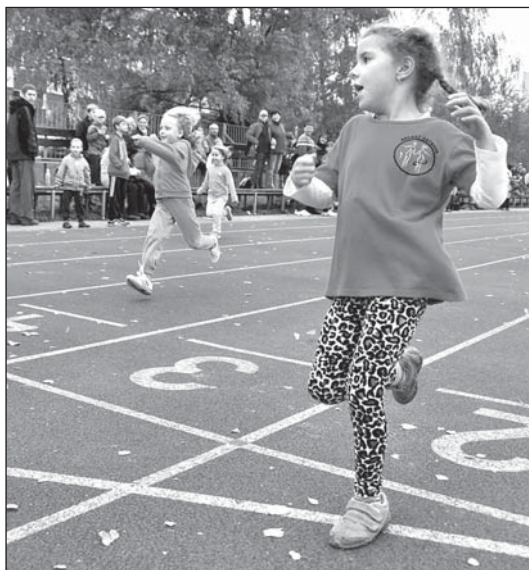
Do posledního závodu na otevřené dráze dali běžci všechny síly.

Ve středu 9. října se na stadionu u ZŠ ČSA konal 9. ročník Velké ceny Bohumína. Mítink, který pořádá Atletický klub Bohumín (AKB), je tradičním zakončením atletické sezony pod širým nebem. Letos se jej zúčastnilo 131 běžců.