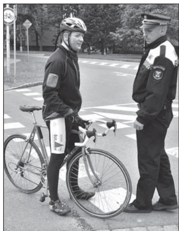
Kontroly cyklistů budou pokračovat.

jila stávající turistické trasy obou zemí, pokročila. Město díky vypořádání pozemků získalo do majetku přístupovou cestu k místu budoucí lávky. Hotová už je její projektová dokumentace a nyní se začíná vyřizovat stavební povolení. Do samotné stavby se ale město nechce pouštět bez dotace. Čeká proto na vhodnou finanční podporu v rámci česko-polských projektů v letech 2014–2020.