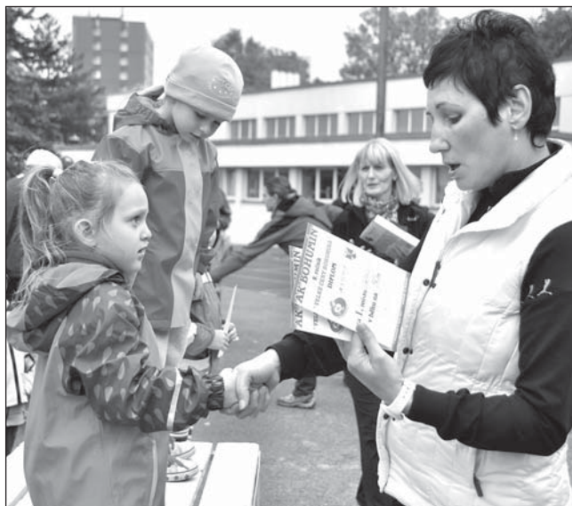
1) Někomu ukáply slzy radosti, jinému slzy zklamání. Také to ke sportu patří. 2) Na stupních vítězů se rozdávaly medaile, diplomy a další ceny.