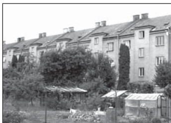
V tomto nízkopodlažním cihlovém domě v Janáčkově ulici se nabízí celkem šest bytů velikosti 1+1 o celkové ploše kolem 50 m 2 . O tři v čísle 805 a 806 se licituje 29. ledna, byty v čísle 807 jdou do licitace 3. února.

● Byt 1+1, ul. Janáčkova 806 , číslo bytu 4, kategorie I., 2. patro. Nízkopodlažní cihlový dům v klidné lokalitě poblíž parku, zimního stadionu a bazénu. V bytě je nově nainstalováno ústřední topení, nová koupelna se sprchovým koutem, plastová okna. Plocha pro výpočet nájemného 48,60 m 2 , celková plocha bytu 51,35 m 2 . Prohlídka 22.1. v 15.00–15.15 hodin a 23.1. v 10.00–10.15 hodin. Licitace se koná 29.1. v 16.45 hodin.