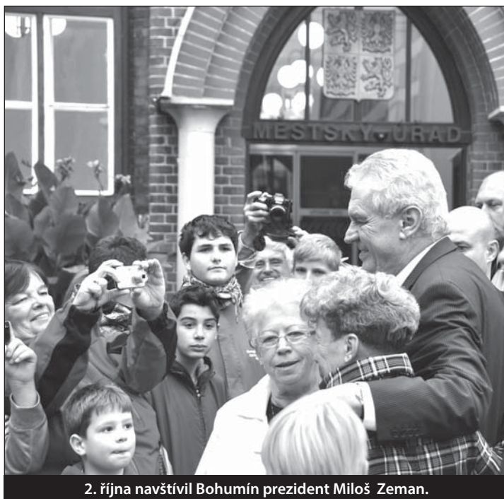
2. října navštívil Bohumín prezident Miloš Zeman.

• Začal školní rok a do lavic zasedlo 252 prvňáčků (loni 240, předloni 203). Kvůli vel-