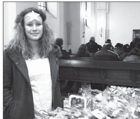
▲ Děti se představily v pásmu o narození Ježíše. ◀ Návštěvníci si mohli v kostele zakoupit výrobky žáků a učitelů školy.

Na závěr besídky zahrála kapela Duch Otce a pro rodiče, žáky a hosty bylo připraveno bohaté občerstvení.