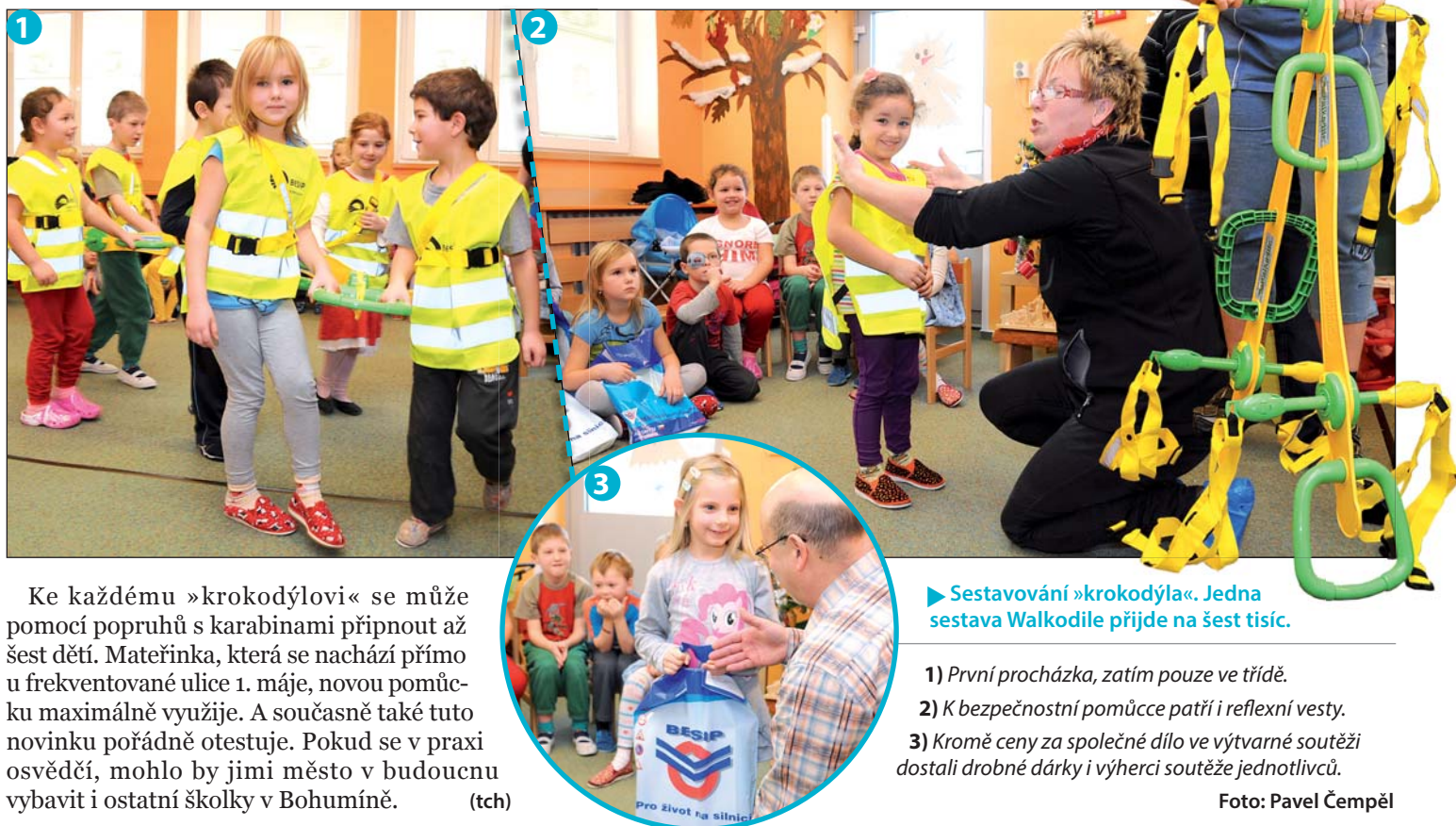
► Sestavování »krokodýla«. Jedna sestava Walkodile přijde na šest tisíc.