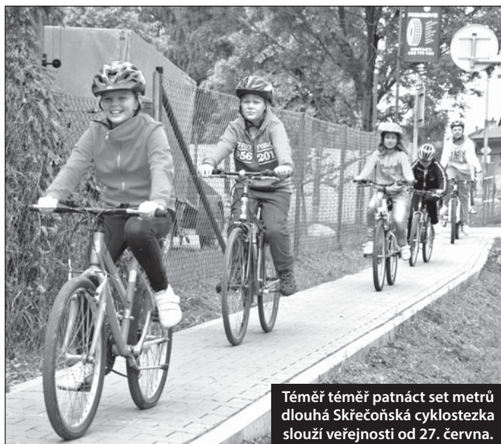
Téměř téměř patnáct set metrů dlouhá Skřečonská cyklostezka slouží veřejnosti od 27. června.

• Atletické minisoutěžení, neboli AMIS, zaznamenalo už 9. úspěšný ročník. Na hřišti ZŠ ČSA se utkalo 117 chlapců a dívek z devíti mateřských škol.