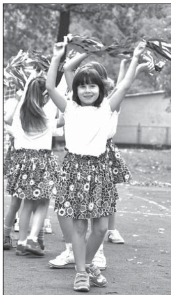
Děti slavnostně otevřely nové hřiště a dvůr u Bezručovy školy.

• 1. září uběhlo 20 let od zahájení činnosti Domovinky. Vznikla jako ústav sociální péče pro mentálně postiženou mládež. Od roku 2006 se z ústa-