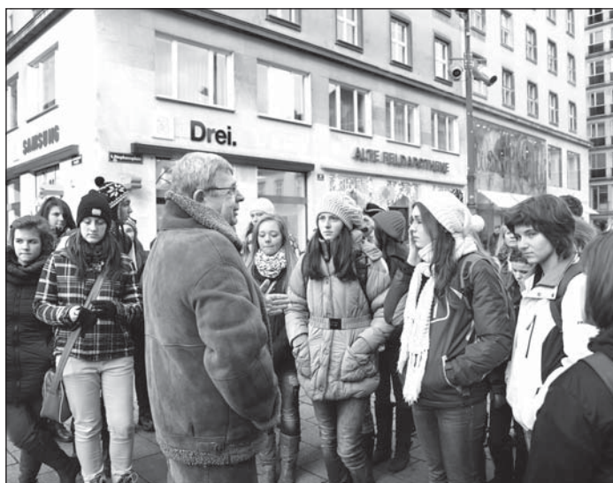
Studenti na náměstí sv. Štěpána v centru Vídně.

Rozespálí, ale všichni natěšení na následující den jsme se sešli v 5.30 ráno před budovou našeho gymnázia. Čekal na nás velmi útulný autobus, ve kterém každý rád ještě na chvíli usnul a nabral síly na náročný den. Cesta uběhla rychle a kolem desáté dopoledne jsme byli na místě.