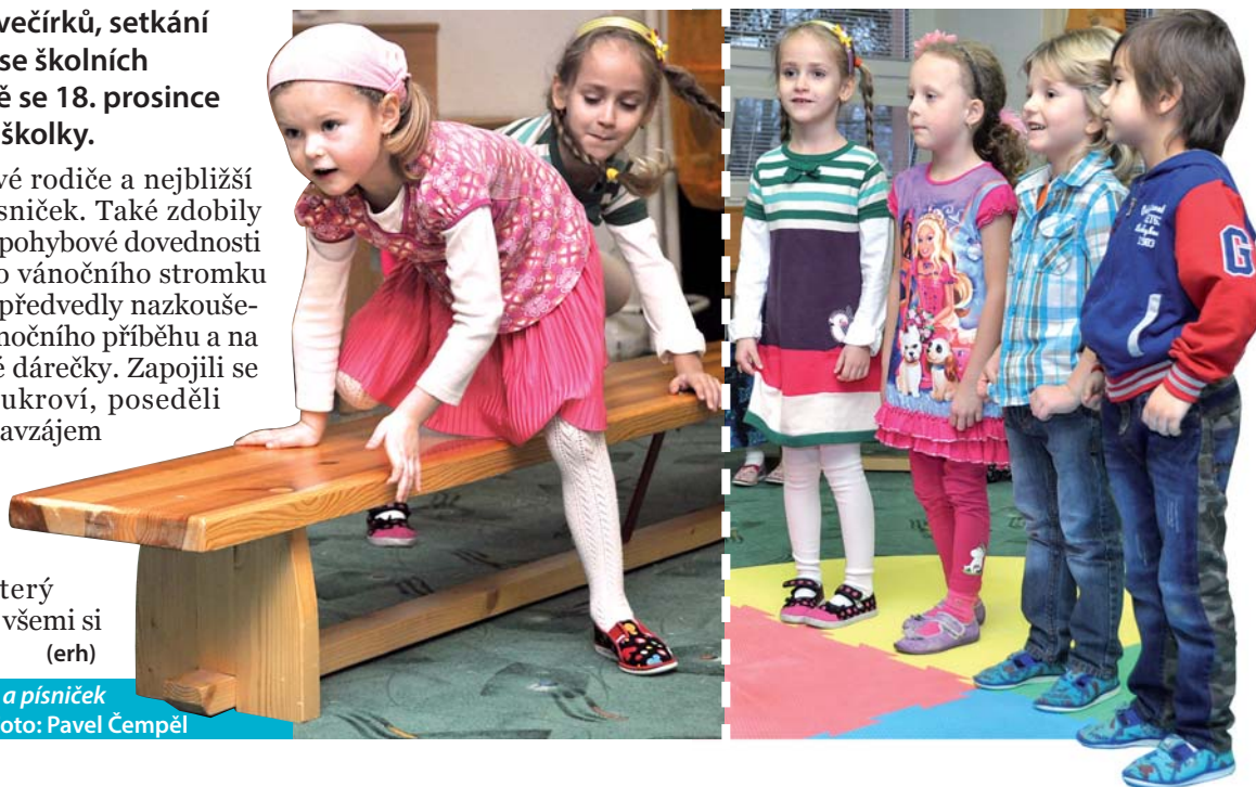
Předškoláci si kromě pásmo veršů a písniček připravili i malou lekci tělocviku.