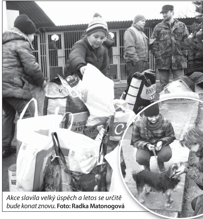
Akce slavila velký úspěch a letos se určitě bude konat znovu.