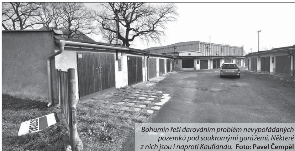
Bohumín řeší darováním problém nevyořádaných pozemků pod soukromými garážemi. Některé z nich jsou i naproti Kauflandu.

Nabídka darování se týká pouze pozemků od jednoho do patnácti metrů čtverečních. Pokud stavebník zabral městský pozemek ve větším rozsahu, bude o způsobu vypořádání rozhodovat zastupitelstvo města. (tch)