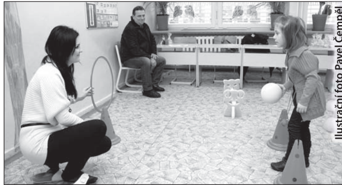
Ilustrační foto Pavel Čempěl

V menších bohumínských školách budou zápisy probíhat jeden, ve větších dva dny. Na místě rodič nebo učitel vyplní zápisní lístek a prověří školní zralost dítěte. „Způsoby jsou různé, některé školy volí formu hry, jiné neformální pohovor,“ uvedla Pavla Skokanová, vedoucí odboru školství, kultury a sportu. U zápisu se posuzuje zejména znalost základních pojmů (barvy, čísla, písmena, dny v týdnu), sociální zralost,