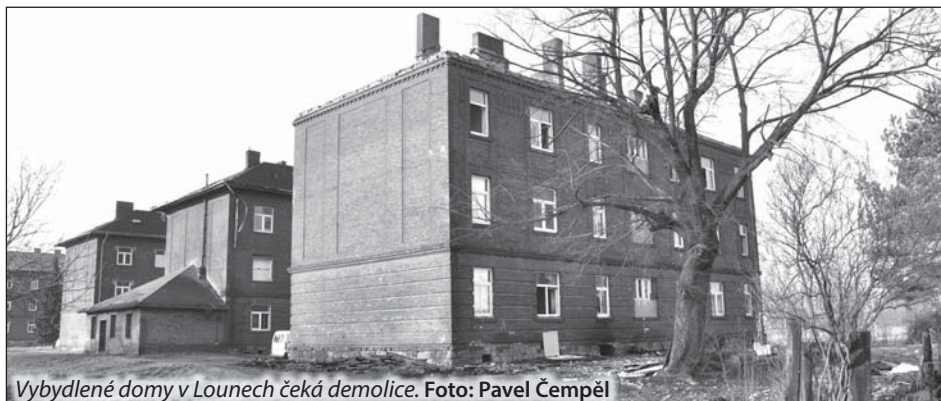
Vybydlené domy v Lounech čeká demolice.

Eva DRDOVÁ, Stanislav SVRČINA, majetkový odbor