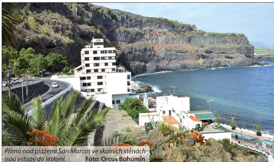
Přímo nad pláží San Marcos ve skalních stěnách jsou vstupy do jeskyní.