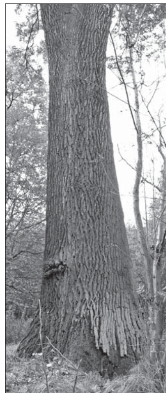
Nejmohutnější dub v Borku se značkou upozorňující na jeho význam z hlediska ochrany přírody.