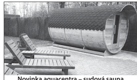
Novinka aquacentra – sudová sauna.

Škola bruslení pro děti: Osm hodinových lekcí, vždy v neděli od 13.40 do 14.40 hodin. Kurz 3: 2.2. – 23.3.