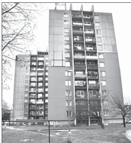
Město bude v nejbližších letech díky půjčce z programu Jessica zateplovat věžové domy.

V současné době je už možné na pobočkách Komerční banky (KB) konzultovat projektové záměry a projednávat