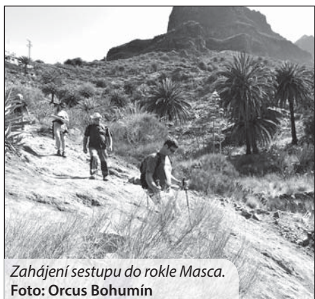
Zahájení sestupu do rokle Masca.

Vyrážíme z hotelu brzy ráno. Cílem je kaňon Masca. Leží na druhém konci ostrova a dojet k němu znamená překonat snad 50 kilometrů po dálnici, ale pak výjezd do městečka Santiago del Teide. V něm odbočuje do hor úzká serpentinová silnička. V každém průvodci je varování, že je velmi úzká, mnohokrát zatočená s velkým stoupáním a klesáním. Opravdu nejdříve prudce stoupáme do horského sedla a jen velmi těžce se míváme s protijedoucími osobními auty. A když se v protisměru objeví dokonce i autobus, znamená to velmi složitý manévr i několika vozidel. Ze sedla se otevírá pohled hluboko do údolí na vesničku Masca i na velmi prudce klesající pokračování hor-