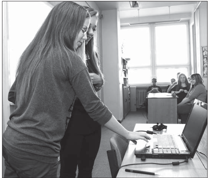
Žákyně »nové školy« si připravily prezentaci v angličtině. A zároveň také sérii dotazů pro své hosty z Turecka a Španělska.

referátech přišel čas na dotazy. Školáky, přesněji školáčky, protože ČSA reprezentovaly výlučně dívky, zajímalo, jak se španělsky a turecky řekne »ahoj«, »jak se máš?« a pochopitelně »miluji tě«. Hostů z jihu Evropy se také ptaly, co je u nás nejvíce překvapilo. Odpovědí byl »klid«. Cizinci si pochvalovali, že v Bohumíně nejsou stresující dopravní zácpy a že při svých pochůzkách všude vnímali klid a pohodu. (erh)