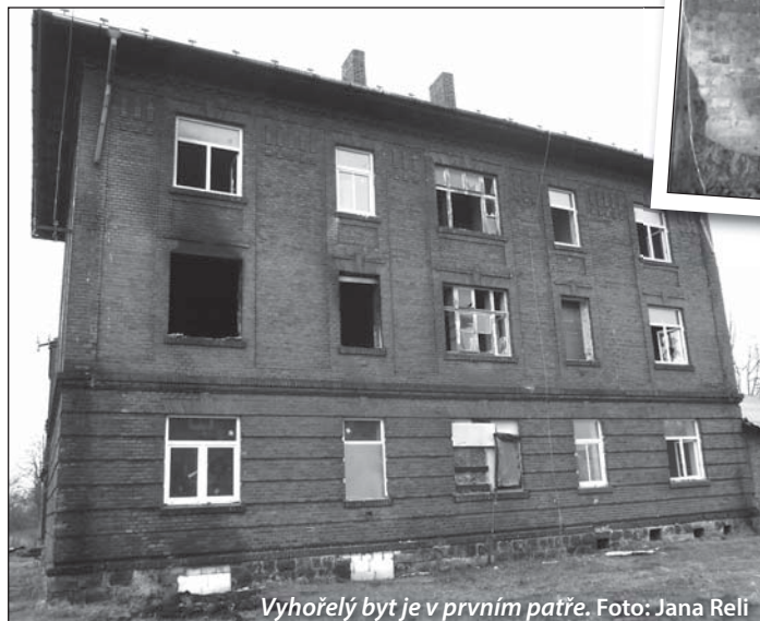
Vyhořelý byt je v prvním patře.

smysl, stejně jako sousední cihláky je v budoucnu