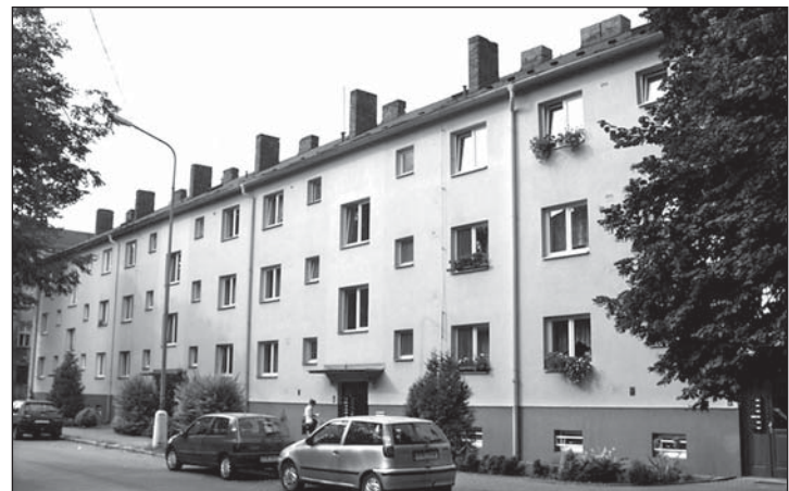
V Masarykově ulici jdou do licitace dva byty 1+2. První v čísle 928 je ve 3. patře a licituje se 26.2., licitace druhého bytu ve 2. patře čísla 929 je 5.3.

• Byt 1+2, ul. Čs. armády 148 , číslo bytu 5, kategorie I., 2. patro. Nízkopodlažní dům poblíž centra města, školy