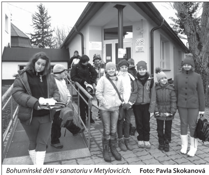
Bohumínské děti v sanatoriu v Metylovicích.

Vzhledem k tomu, že jsou léčebné pobyty pro děti zcela zdarma, dohodla se radnice se sanatoriem v Metylovicích na organizaci léčebných pobytů také na jaře a případně i o prázdninách. „Rodiče, kteří zimní termíny propásli, tak mají jedinečnou možnost