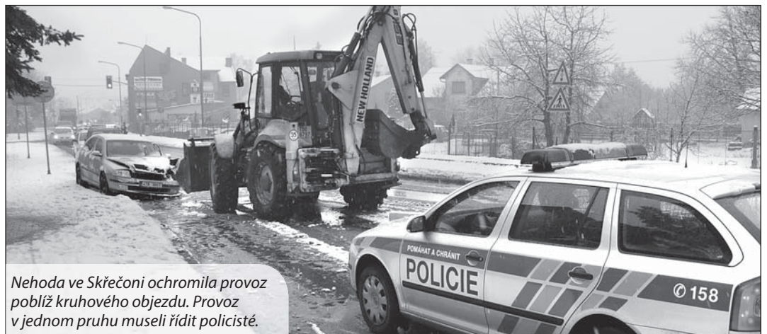
Nehoda ve Skřečoni ochromila provoz poblíž kruhového objezdu. Provoz v jednom pruhu museli řídit policisté.

a obchodů. Byt je po rekonstrukci sociálního zařízení včetně GO elektroinstalace. Plocha pro výpočet nájemného 53,21 m 2 , celková plocha bytu 55,79 m 2 . Prohlídka 5.3. v 15.45–16.00 hodin a 6.3. v 10.45–11.00 hodin. Licitace se koná 10.3. v 15.45 hodin.