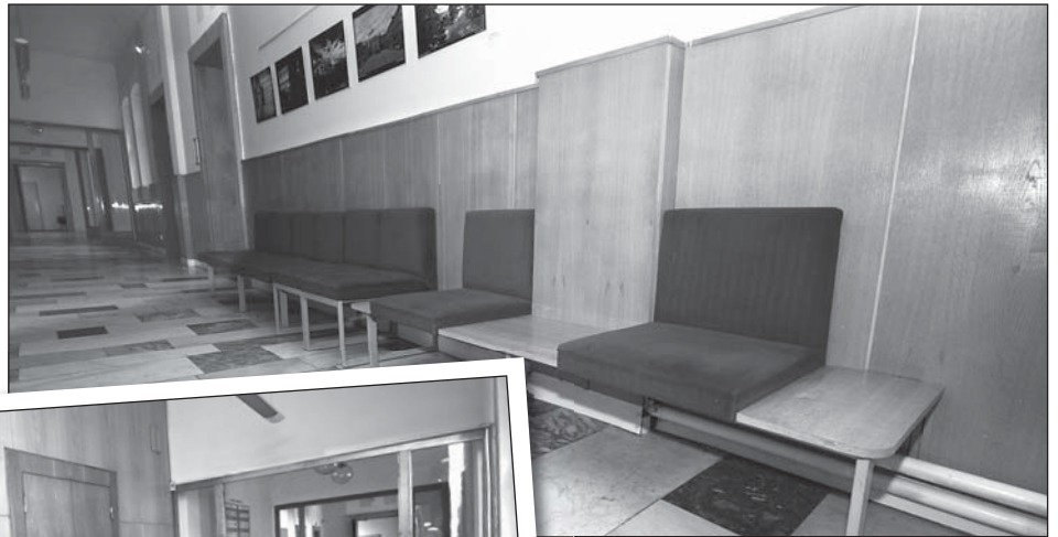
Překližkové kryty, obložky, sedáky, to vše musí pryč. Spolu s lítačkami stavbaři odstraní také vyzdívku nad nimi. Prostor se tak otevře.

Významnou optickou změnou bude i likvidace dvojice lítacích dveří. „Dveře