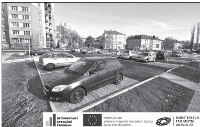
Loni proběhla dotací podpořená přestavba prostranství Osvěta.