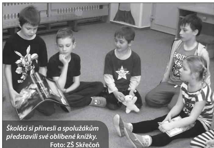
Školáci si přinesli a spolužákům představili své oblíbené knížky.

Ve skřečošské škole proběhl 7. března první ročník »Večerního čtení«. Děti si na akci přinesly spacáky, plyšového mazlíčka a svoji oblíbenou knížku.