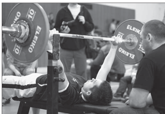
Bohumínští budou obhajovat loňský mistrovský titul, letos ale mají v Karviné silného soupeře.