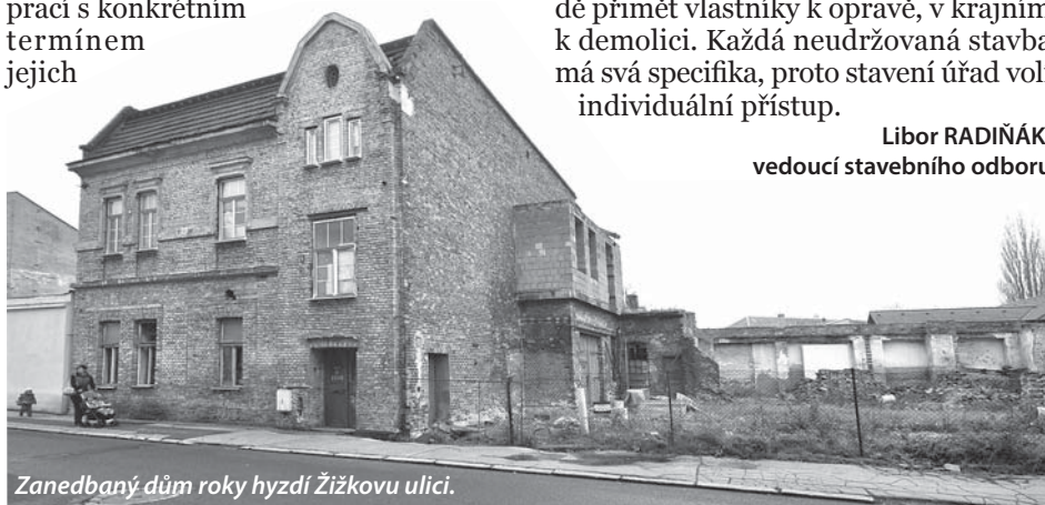
Zanedbaný dům roky hyzdí Žižkovu ulici.