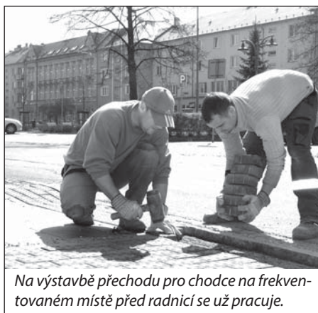
Na výstavbě přechodu pro chodce na frekventovaném místě před radnicí se už pracuje.

Některé »zebrý« by mohly vzniknout ještě v první polovině roku. Do přechodu před radnicí se už řemeslníci pustili. Vzniká v místě pro přecházení, takže si vyžádá instalaci nových dopravních značek a předlážďení současného povrchu na speciální, který bude chodce upozorňovat na přechod. K nasvětlení poslouží sloup veřejného osvětlení, který