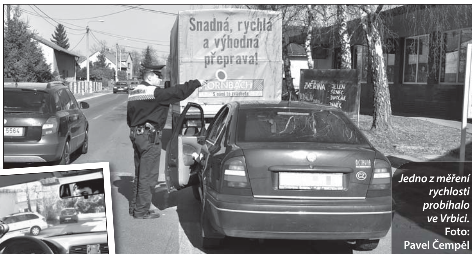
Jedno z měření rychlosti probíhalo ve Vrbici.

Vše letos kvůli absenci zimy začalo dříve. A tak i měsíc bezpečnosti, který se tradičně váže až k dubnu, pojali městští strážníci s předstihem. Kromě své běžné hlídkové činnosti věnovali celý březen zvýšenému dohledu na dodržování dopravních předpisů. A natchytili nejednoho hříšníka. Za březen uložili 180 pokut za přestupky v silničním provozu. Šoféři ulehčili svým peněženkám kvůli porušování zákazu stání, zákazu vjezdu ale nejčastěji za příliš »těžkou nohu« na plynu. Sankce za překročení povolené rychlosti tvořily rovnou polovinu. Hlídky měřily v Bohumíně a Rychvaldu. Dvaasedesát řidičů tady muselo za menší překročení zaplatit blo-