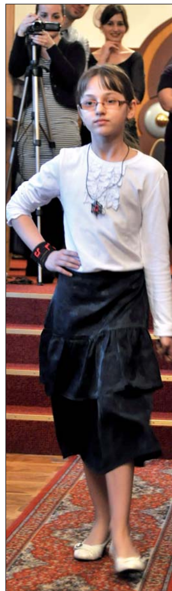
Koncertní sál bohumínské zušky se proměnil v módní molo.