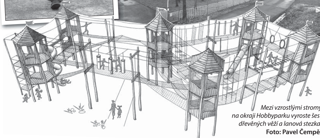
Mezi vzrostlými stromy na okraji Hobbyparku vyroste šest dřevěných věží a lanová stezka.