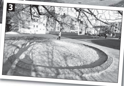
3) Území mezi hlavní třídou, Poděbradovou a Alešovou ulicí bude řešit studie.

Plácky, dvory nebo celá prostranství mezi domy. V uplynulých letech prošla v Bohumíně proměnou řada podobných míst. Stále se však najdou taková, kde zanechal svou vizitku nekompromisní zub času. Postupně se dostane i na ně. Nejnověji jsou v hledáčku tři dvory v Novém Bohumíně.