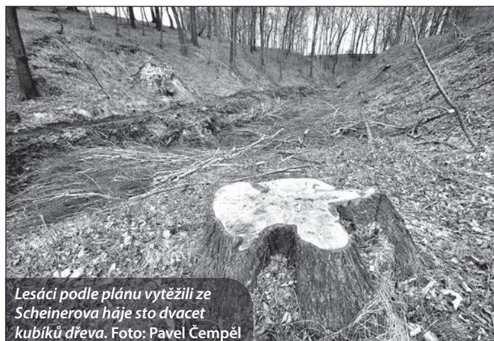
Lesáci podle plánu vytěžili ze Scheinerova háje sto dvacet kubíků dřeva.