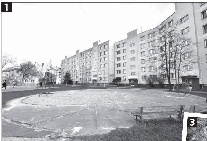
1) Hřiště za prodejnu Hruška vedle ulice Svatopluka Čecha. 2) Nevyužívané asfaltové hřiště u kotelny mezi ulicí Čáslavskou, Čs. armády a třídou Dr. E. Beneše.