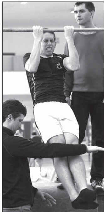
Čtyřbojář gymnázia vybojovali v krajském kole druhé místo, což jim zaručuje postup do finále.

Bohumínský tým silových čtyřbojářů z Gymnázia Františka Živného vybojoval postup na mistrovství republiky. Čtyři reprezentanti gymnázia obsadili 13. března v krajském kole soutěže druhé místo, díky kterému budou závodit i v celostátním finále.