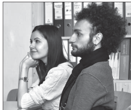
Studentka z rumunské Bukurešti a její současný spolužák z Turecka.

Po seznamovacích projekcích přišlo na řadu to, kvůli čemu se omladina z různých koutů Evropy vlastně sešla.