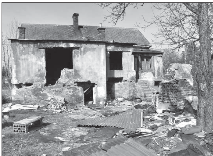
Na ruinu domku ve Vrbické ulici v městské části Vrbsice je vypsáno několik exekucí.

přinesly kýžený efekt. Nabízí se otázka, proč se takové přítěže prostě nezbaví, jenže i to vlastník odmítá. „Majitele kontaktovali zájemci o koupi, odkoupení nabídlo i město, leč zatím neúspěšně,“