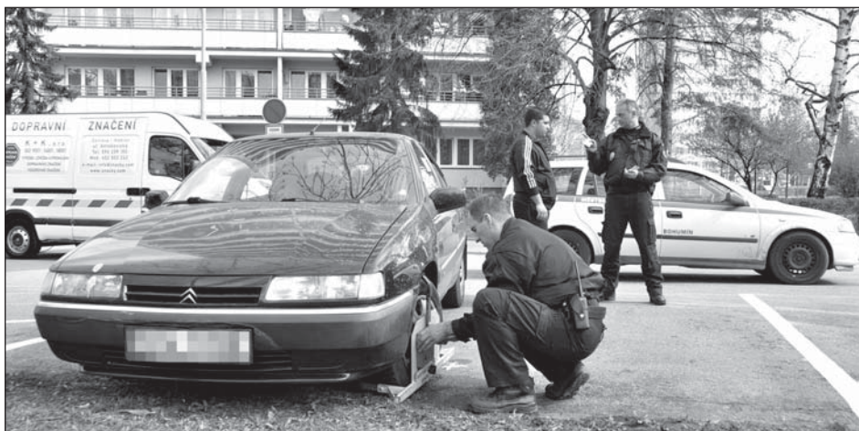
Řada řidičů ignorovala zákaz stání během čištění. Dočkali se tak botičky a pokuty.

»Zapomenutá« auta nezkomplikovala jen čištění, ale také obnovu značení.