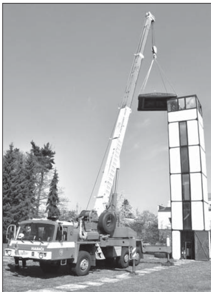
Oprava střechy byla díky její demontáži pohodlná a rychlá. Hasiči ji opravili na zemi v zahradě zbrojnice. Vyspravili krovy a vyměnili krytinu.

Novinkou letošních hasičských investic je pořízení tréninkových překážek pro děti i dospělé. „Poslední dobou se rozrůstá základna dětí u jednotlivých sborů, což nás velmi těší. Proto jsme se dohodli, že zakoupíme sadu pro malé hasiče. Do překážek investujeme sto tisíc,“ uvedla vedoucí organizačního odboru Miroslava Šmídová. Dětem poslouží k výcviku bariéra, tunel, lávka nebo terč, dospělým hasičům město zakoupí bariéru a kladinu. Překážky budou umístěny ve Starém Bohumíně a jednotlivé sbory si dohodnou časy tréninků. (tch)