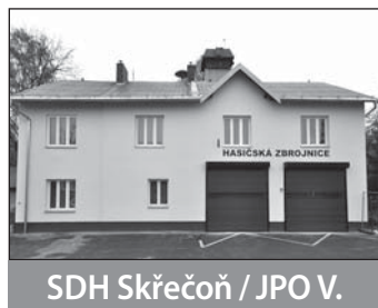
SDH Skřečoni / JPO V.

Technika: CAS Škoda 706 RTHP, nákladní automobil Praga V3S s hydraulickým