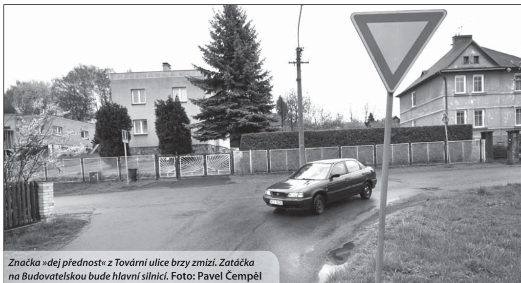
Značka »dej přednost« z Tovární ulice brzy zmizí. Zatávka na Budovatelskou bude hlavní silnicí.

V době, kdy byla Budovatelská ulice pod Bagincem průjezdná, měl její statut hlavní silnice svou logiku. Nyní je ale do úseku, který vede lesem, vjezd zakázán a z komunikace se tak stala slepá ulice. Argumenty řidičů,