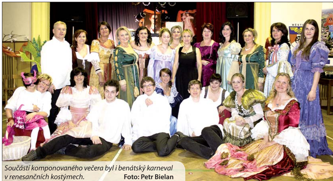
Součástí komponovaného večera byl i benátský karneval v renesančních kostýmech.

Více než sto žen, ale také několik mužů, se na chvíli přeneslo do Benátek 16. století. Diváci díky tomu mohli