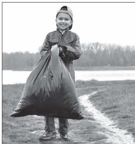
U Kališova jezera naplnili dobrovolníci smetím šedesát pytlů.

Jarní očista probíhala v prvních aprílových dnech i na pomezí Nového Bohumína a Záblatí. U pěšinky poblíž restaurace Partyzán a nedalekými věžáky v Bezručově vyrostlo přes zimu několik černých skládek. Veřejně prospěšní pracovníci naplnili sesbíraným odpadem dvě multikáry, které pak BM servis, stejně jako v případě brigády u »Kališoku«, odvezl na městskou skládku. Kromě úklidu se v lokalitě také mýtila křídlatka, pracovníci Rybářství Rychvald odváželi polámané větve a drcenou dřevní hmotou vyrovnávali upravená místa. (tch)