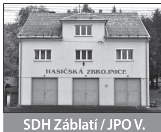
SDH Záblatí / JPO V.

Činnost v roce 2013: Starobohumínští měli loni na kontě 67 zásahů. Jednotka má jako jediná v Bohumíně klasifikaci JPO III, takže je »pravou rukou« profesionálních hasičů podílí se s nimi na likvidaci požárů a mimořádných událostí i mimo město. Ve svém teritoriu má malé a velké Kališovo jezero i Odru, a proto je také předurčena k zásahům na vodě. Jednotka zajišťuje také městskou půjčovnu lodí pro vodáky na Odře. Pro starobohumínský tým je prioritou zásahová činnost, s tím souvisí i pravidelná školení a výcviky. Na soutěžní aktivity mnoho času nezbývá, ale pokud je možnost, účastní se jich. Loni jednotka také jednu soutěž pořádala a mimo jiné zorganizovala slavnost v zahradě za zbrojnicí.