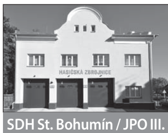
SDH St. Bohumín / JPO III.

Historické heslo z titulku, které bývá dodnes vyšito na praporech dobrovolných hasičů, ani po letech nezevšednělo. Ať vyšlehne plamen, přivalí se vody, spadne strom, dobrovolní hasiči vyrazí do akce. Pomoci a ochraně rodin, přátel, sousedů věnují svůj volný čas. A když neřadí živly, dokáží jim zprostředkovat společenská i sportovní setkání, zabavit je. I Bohumín a jeho městské části se mohou na své požárníky spolehnout. Dobrovolných sborů (SDH), které plní společenskou funkci, je šest. Pět z nich má navíc svou jednotku požární ochrany (JPO), která zasahuje u požárů a dalších mimořádných událostí.