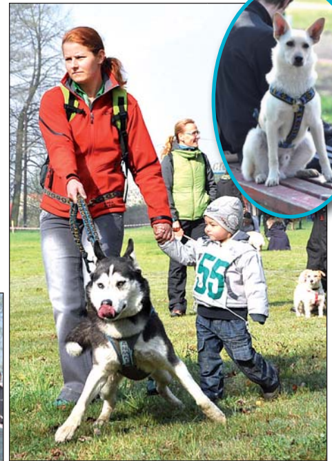
Pejskaři ze širokého okolí se sjeli na originální akci do Skřečoš. Na start se postavili hařani bez rozdílu rasy či velikosti.