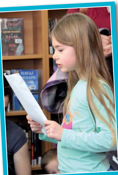
Prvníáci museli splnit několik úkolů. Například dokázat, že už skutečně umí číst.