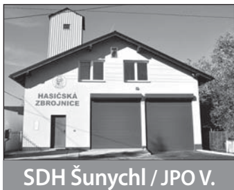
SDH Šunychl / JPO V.

Šunychl má tři závodní týmy – muže, ženy, veterány. Loni se zúčastnili deseti soutěžích, vždy s minimálně dvěma týmy. Vybojovali dvě první místa, pět druhých míst, jedno čtvrté a dvakrát skončili šestí. Jednou pohárovou soutěž v požárním sportu také sami pořádali. Sbor žil i kulturními akcemi. Proběhly dvě letní slavnosti, hasičský ples, den dětí nebo smažení vaječiny.