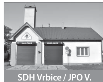
SDH Vrbice / JPO V.

Činnost v roce 2013: Proběhla kompletní rekonstrukce podlah, zasypání sklepních prostor, pokládka nové betonové podlahy a celkové malování garážových prostor. Jednotka si loni připsala pouze tři zásahy, protože od poloviny roku byla bez stěžejního vozidla CAS 25 Liaz, které procházelo kompletní přestavbou. Sbor má dvě soutěžní družstva, mužské i ženské, která se zúčastnila asi patnácti soutěží v okrese a v Polsku.