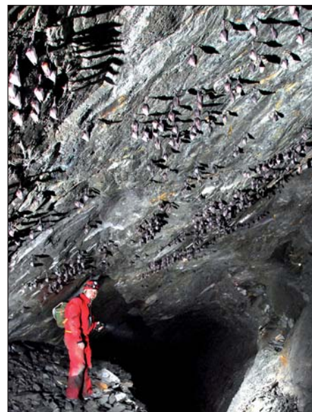
Ve starých důlních dílech Jeseníků jsou jedny z největších zimovišť vrápenců.

matky. Ještě čtyři až šest týdnů je mládě plně na matce závislé, přibližně prvních deset dní je nosí všude s sebou, i na noční lov. Později mládě zůstává v úkrytu a samice se k němu vrací v čase kojení, a to i několikrát za noc. Některé kolonie čítají i statisíce jedinců, samice je schopna díky pachovým a především individuálním zvukovým signálům poznat spolehlivě právě to své mládě. (Pokračování příště)