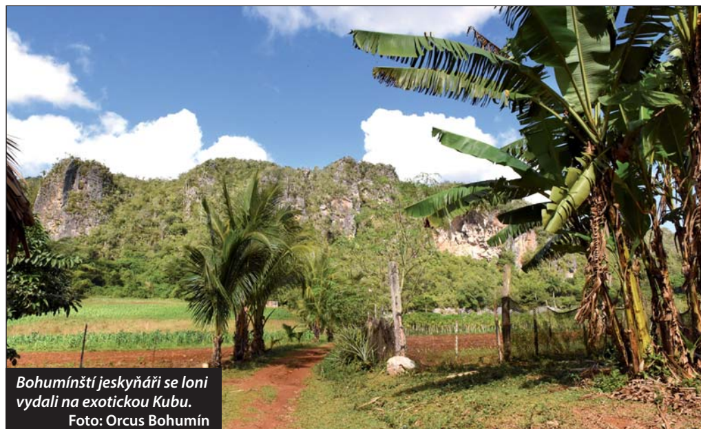
Bohumínští jeskyňáři se loni vydali na exotickou Kubu.

ukázaly, že v jeskyni je mnoho aragonitových a krystalických forem, jaké jsme objevili a mohli studovat v jeskyních na Krymském poloostrově.