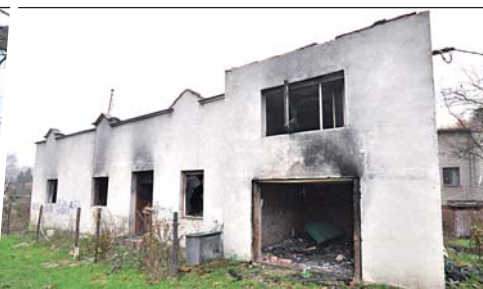
Na seznam neudržovaných staveb nově přibyl také vyhořelý dům ve Skřečoni.