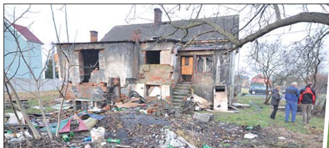
Z barabizny ve Vrbici a její zahrady je černá skládka. Ruina brzy zmizí, ale předtím bude třeba vyklidit okolí i vnitřní prostory domu.