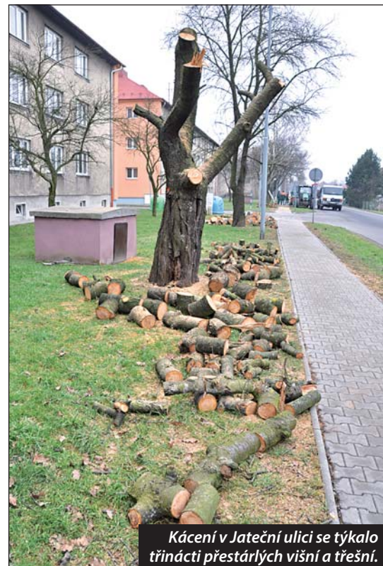
Kácení v Jateční ulici se týkálo třinácti přestárých višní a třešní.

„Projekt počítá s vytvořením deseti parcel pro rodinnou zástavbu. Město ke každé z nich vybuduje přípojky inženýrských sítí – plyn, elektřinu, vodu a kanalizaci,“ uvedla Eliška Pecháčková z odboru rozvoje a investic. Stěžejní položkou přípravy území však bude stavba příjezdové silnice. Protne celý pozemek, což umožní dojezd k jednotlivým parcelám, a současně propojí dvě již zmíněné ulice. Zatímco napojení na Rychvaldskou nic nebrání, v Anenské roste u vjezdu a ve výhledu alej stromů. A právě těm se nevyhne kácení, týká se dvou lip a jednadvaceti topolů. I kdyby topoly nemusely ustoupit stavbě, podle odborníků by se do nich dříve nebo později pily stejně zakously. „Všechny topoly jsou ve stadiu dožívání. V korunách se vyskytuje mnoho suchých a poškozených větví, které často padají na komunikaci,“ sdělila Lubica Jaroňová z odboru životního prostředí a služeb. Dodala, že některé perspektivní stromy v podrostu