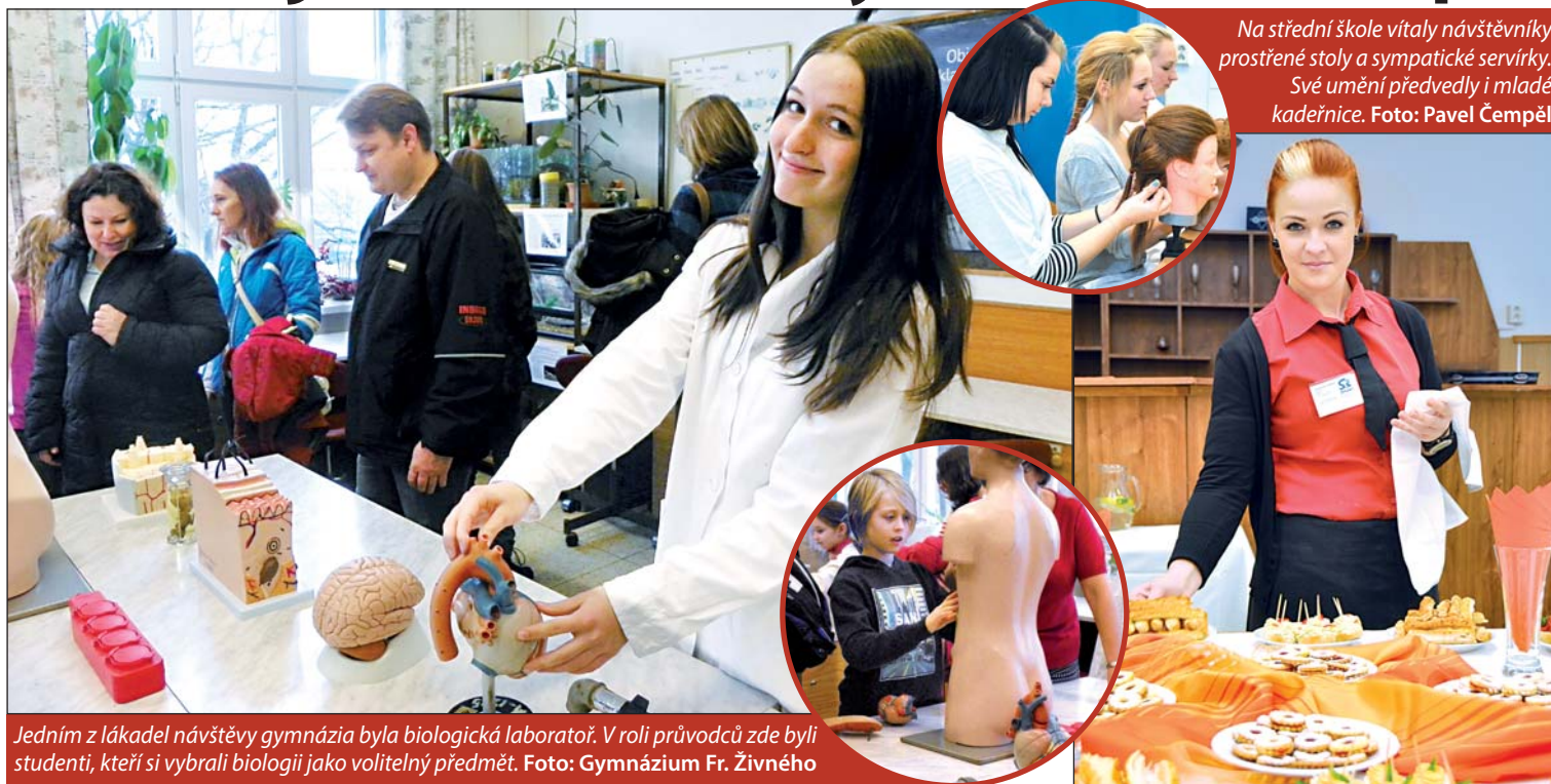
Na střední škole vítaly návštěvníky prostřené stoly a sympatické servírky. Svě umění předvedly i mladé kadeřnice.

Jedním z lákadel návštěvy gymnázia byla biologická laboratoř. V roli průvodců zde byli studenti, kteří si vybrali biologii jako volitelný předmět.