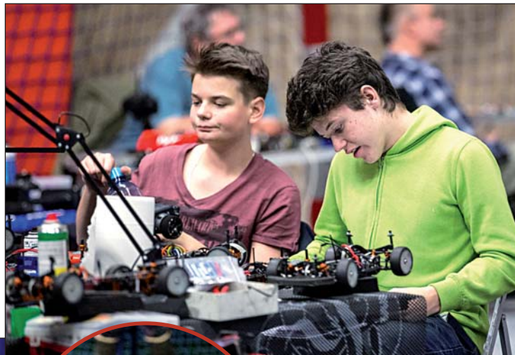
Na třetím závodě krajského seriálu RC cestovních vozů startovalo 74 modelů. Kromě regionálních stájí dorazili i jezdci z Polska nebo z Prahy.

Poslední závod krajského seriálu proběhne 7. března. Dráha bude velmi podobná a účastníci budou mít možnost vyladit své stroje k dokonalosti před zlatým