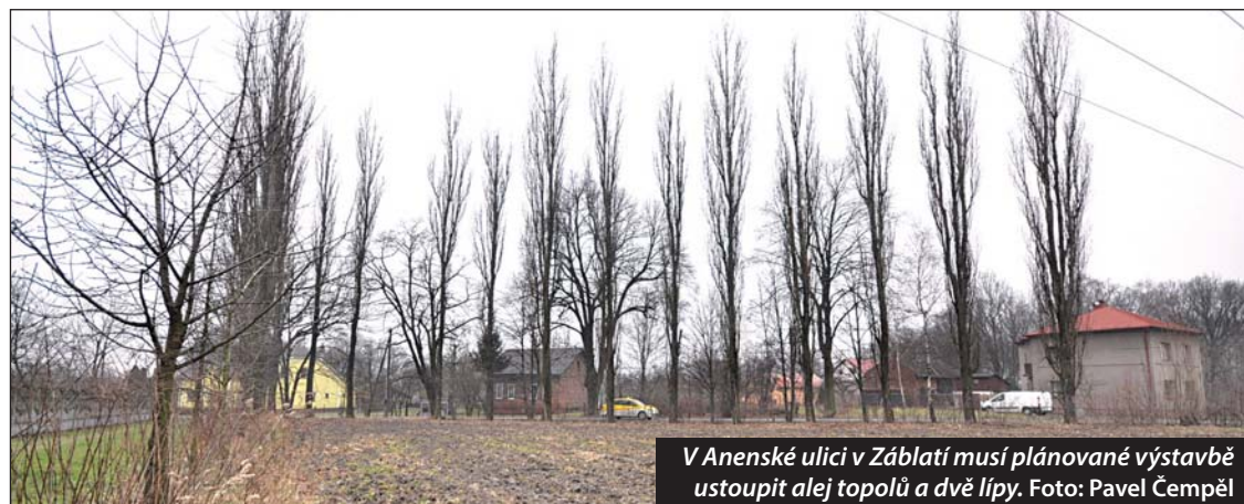
V Anenské ulici v Záblatí musí plánovaná výstavba ustoupit alej topolů a dvě lípy.

V lokalitě sice zprvu pár stromů ubude, ale v rámci přípravy pozemku se počítá i s novou výsadbou. Patnáct mladých habrů vytvoří zelenou bariéru mezi parcelami a sousední menší výrobní halou. (tch)