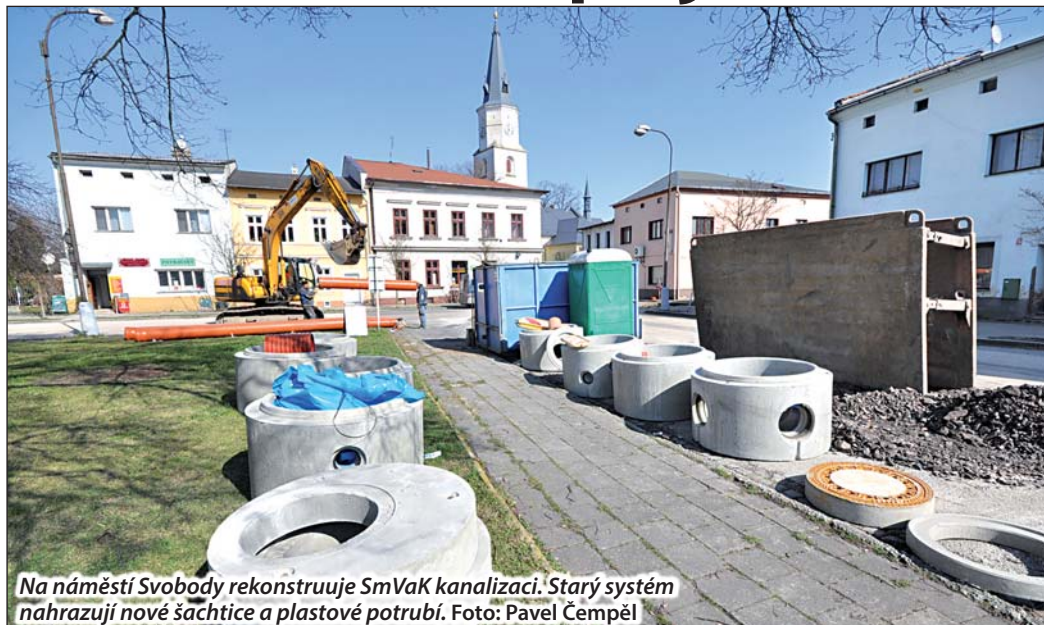
Na náměstí Svobody rekonstruuje SmVaK kanalizaci. Starý systém nahrazují nové šachtice a plastové potrubí.