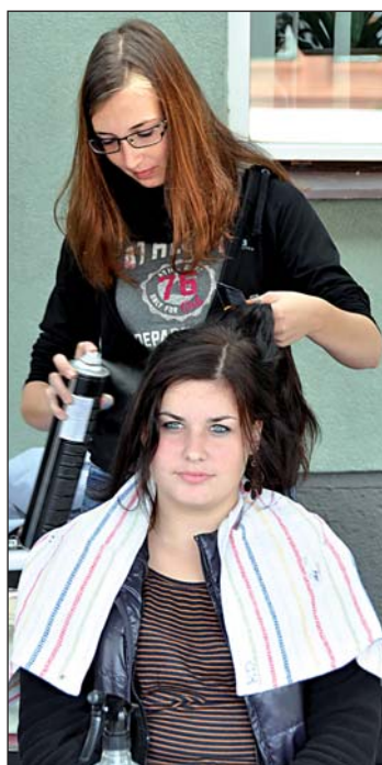
Ukázky kadeřnického umění na dni řemesel.