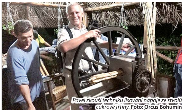
Pavel zkouší techniku lisování nápoje ze stvolů cukrové třtiny.

nejbližší přístřešek a zjišťujeme, že tady předvádí trojice Kubánců lisování šťávy přímo ze stvolů cukrové třtiny. A když se nás zeptají, zdali si dáme, přikyvujeme.