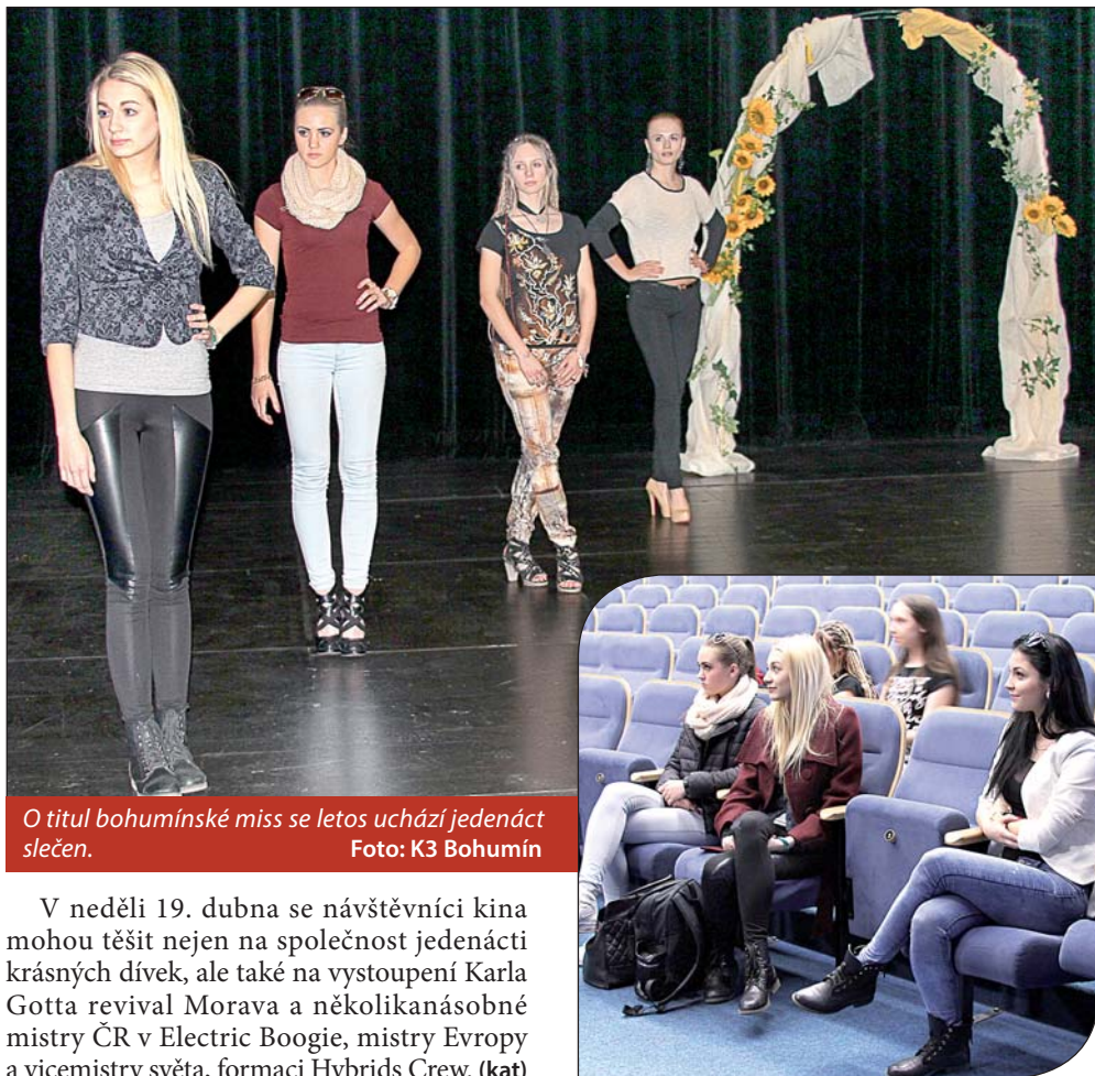
O titul bohumínské miss se letos uchází jedenáct slečen.

Pro vítězky je připravena spousta cen. Kromě hlavní – zájezdu pro dva do Paříže – také například vkusné šperky, poukazy na fotokurz K3, drobná elektronika a další ceny, které věnovaly dvě desítky sponzorů.