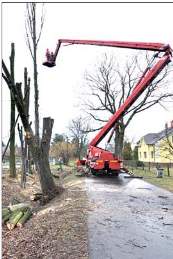
Příprava území pro stavbu rodinných domků začala v půli března kácením stromů.

V Záblatí začala úprava jedné z lokalit, určených k výstavbě rodinných domů. Prvním krokem bylo kácení stromů, především starých topolů. V době jejich výsadby původní pole lemovaly. Nyní však dožívající stromy novému využití pozemku spíše brání.