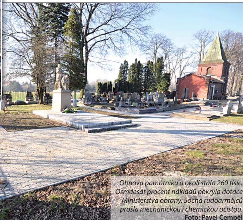
Obnova památníku a okolí stála 260 tisíc. Osmdesát procent nákladů pokryla dotace Ministerstva obrany. Socha rudoarmějců prošla mechanickou i chemickou очистou.