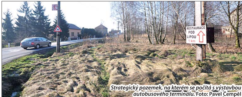
Strategický pozemek, na kterém se počítá s výstavbou autobusového terminálu.

„Tuto křižovatku stále vnímáme jako »komunikační závalu«,“ posteskl si Sobek. Proto v březnu proběhla k problematickému místu schůzka zástupců obou měst a silničářů. Počet majitelů klíčového pozemku se v uplynulých letech zredukoval na »pouhých« devět. Kontaktovat některé z nich je ale stále nesmírně složité, města se však nevzdávají. Pokud by se podařilo jejich souhlasy se stavbou terminálu získat, zadá správa silnic vypracování nového projektu. S tím z roku 2001 už pracovat nelze, řada norem a předpisů se za tu dobu změnila. „Přestavba křižovatky není nereálná, ale stále je to běh na dlouhou trať,“ uzavřel Sobek.