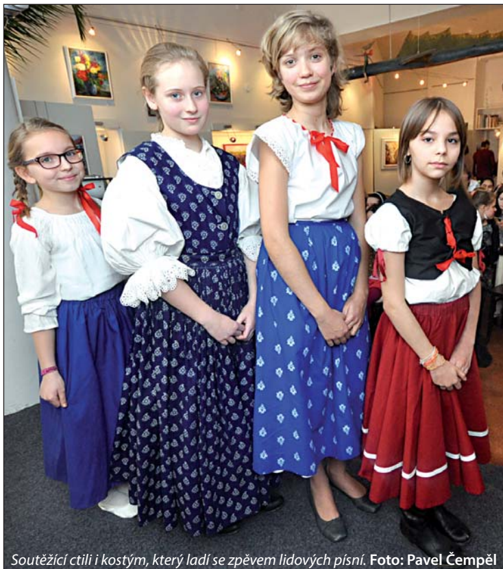
Soutěžící ctili i kostým, který ladí se zpěvem lidových písní.