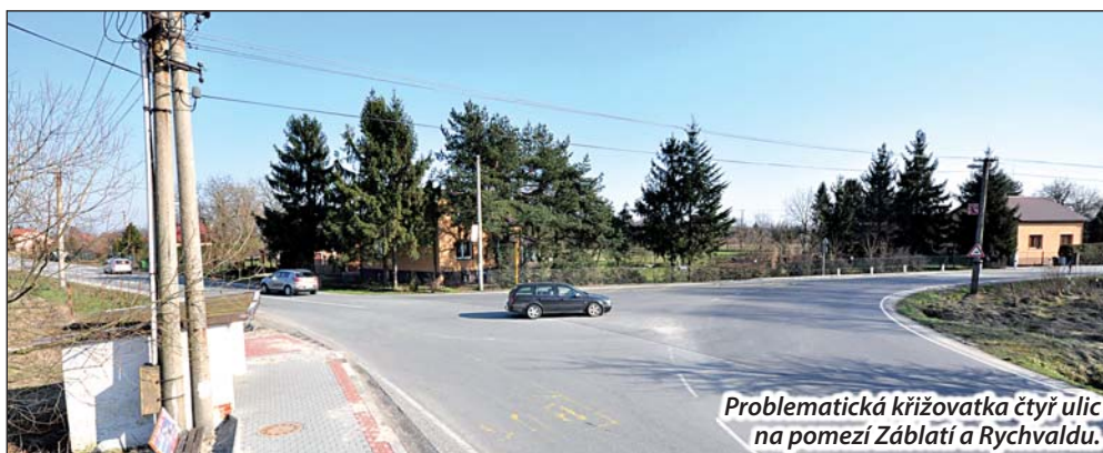
Problematická křižovatka čtyř ulic na pomezí Záblatí a Rychvaldu.

Už v roce 2001 vznikl projekt na rekonstrukci tehdy nevyhovující Bohumínské ulice v Rychvaldu. Jeho součástí byla i stavba dvou kruhových objezdů, u rychvaldského Penny marketu a na rozcestí – křižovatce Rychvaldské, Bohumínské, Hraniční a Záblaté ulice. Na tom druhém ale vše ztroskotalo. „Aby mohla na rozcestí vzniknout okružní křižovatka, je třeba vyřešit zdejší autobusové zastávky. Jsou tři a na rondelu logicky být nemohou. Proto měl v jeho sousedství vyrůst autobusový