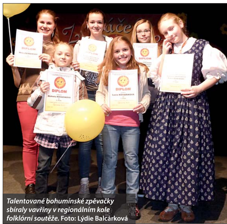
Talentované bohumínské zpěvačky sbíraly vavříny v regionálním kole folklórní soutěže.