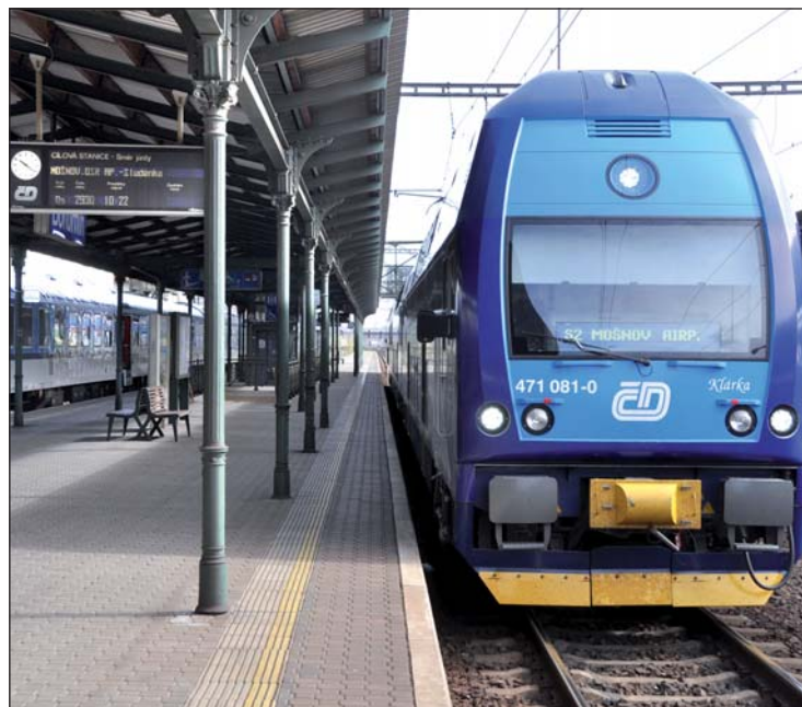
Vlaky do Mošnova jezdí přes stanici Bohumín. Z našeho nádraží je cestující na letiště za 40 minut.