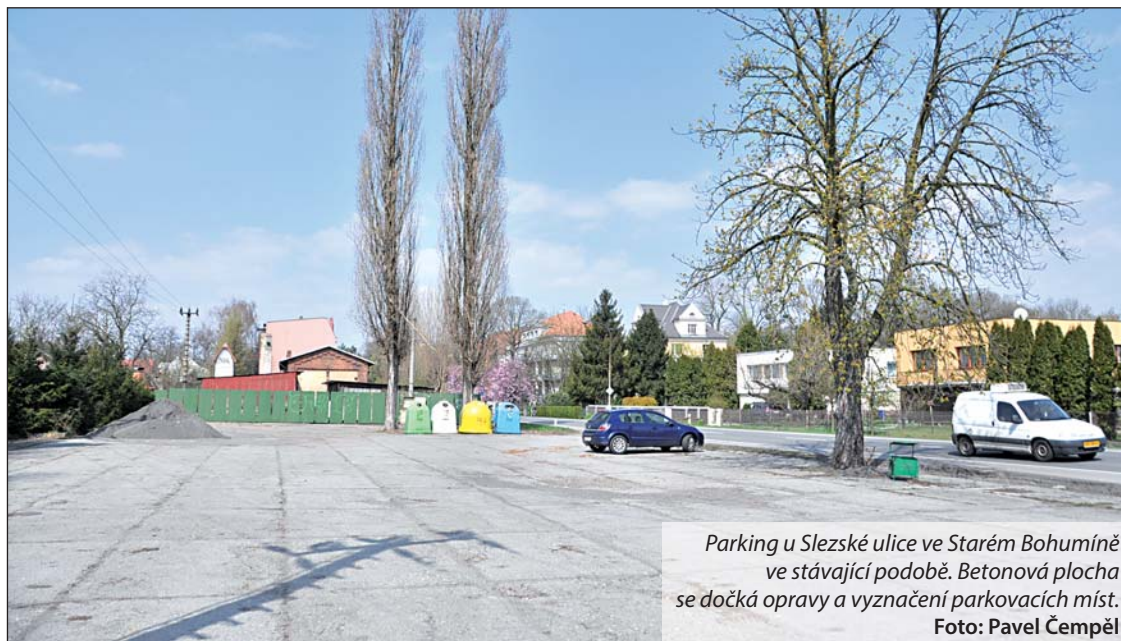
Parking u Slezské ulice ve Starém Bohumíně ve stávající podobě. Betonová plocha se dočká opravy a vyznačení parkovacích míst.

Chaotické parkování pomalu končí. I letos se další dvě parkoviště bez vyznačených míst dočkají nového »nalajnování«.