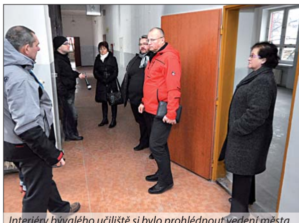
Interiéry bývalého učiliště si bylo prohlédnout vedení města.