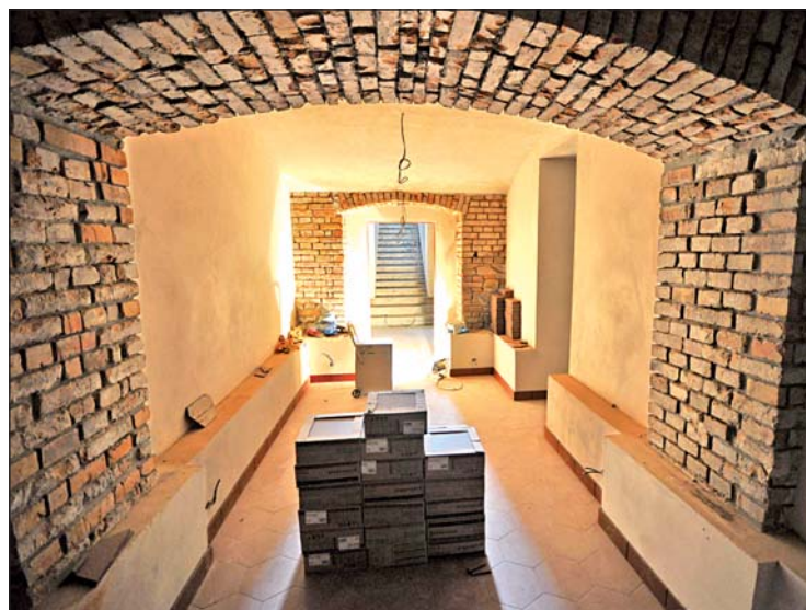
V suterénu budou mimo jiné výstavní prostory a sociální zařízení.