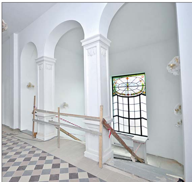
Přístup na hlavní schodiště, kterému vévodí dochované vitrážové okno o rozměrech 2,5 krát 4,5 metru.

Uvnitř domu už se rýsuje finální podoba tanečního sálu, hotelových pokojů i pivních lázní. Kromě toho bude v suterénu nově i muzeum. Město už podepsalo smlouvu o spolupráci s Muzeem Těšínska. „Půjde o tři výstavní místnosti o ploše 60 metrů čtverečních, ke kterým přiléhají dva depozitáře. Místnosti jsou klimatizované a je zde zajištěna i stálá vlhkost. Těšínské muzeum navrhne