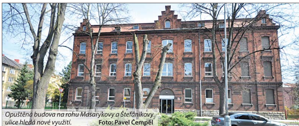
Opuštěná budova na rohu Masarykovy a Štefánikovy ulice hledá nové využití.

Kraj nyní nastavil podmínky, za kterých by Bohumín mohl budovu získat. Může si ji za čtyři miliony koupit a dělat s ní, co uzná za vhodné. Druhou variantou je bezúplatný převod, v tom případě by ale objekt nesměl příštích deset až patnáct let sloužit převážně ke komerč-