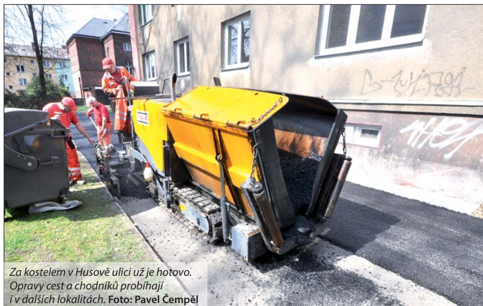
Za kostelem v Husově ulici už je hotovo. Opravy cest a chodníků probíhají i v dalších lokalitách.