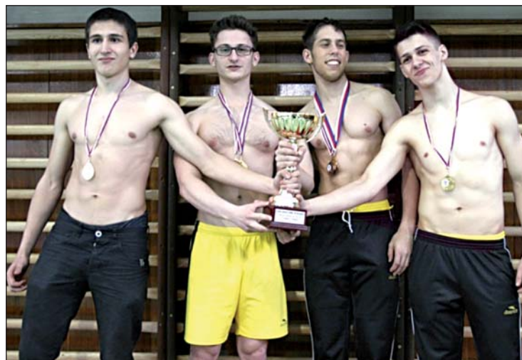
Vítězný kvartet siláků bohumínského gymnázia.

„Konkurence se v soutěži rok od roku zvyšuje a úměrně tomu rostou i nároky na závodníky. Naši devízou, jak se potvrdilo, byla dlouholetá zkušenost se soutěží. Kluci na rozdíl od soupeřů dokázali jít s chladnou hlavou za svým cílem. Patří jim velká gratulace i poděkování za vzornou reprezentaci školy a Bohumína,“ uvedl