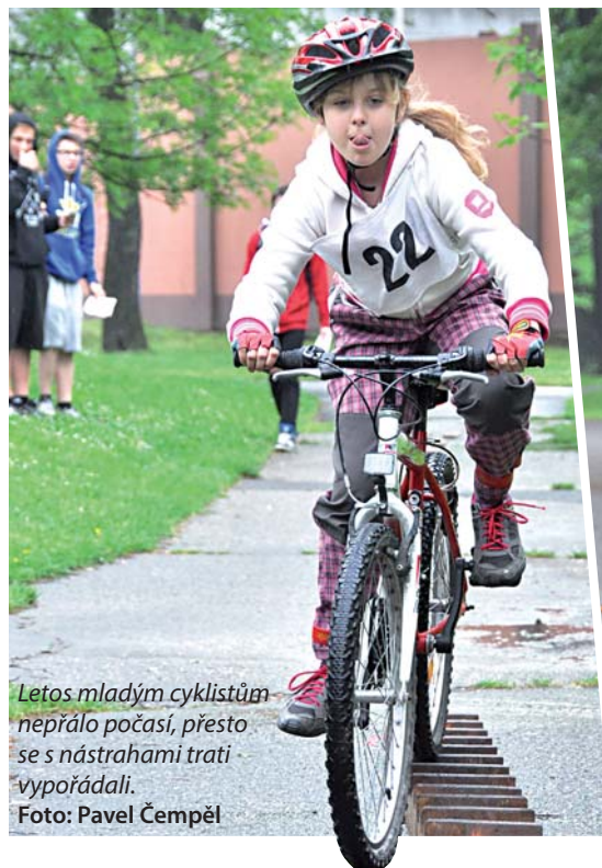
Letos mladým cyklistům nepřálo počasí, přesto se s nástrahami trati vypořádali.

Dopravní hřiště v Hobbyparku nabízí pro tento druh soutěže ideální podmínky. Žádné z okolních měst podobně kvalitním zázemím nedisponuje, proto se v Bohumíně už pár let koná také okresní kolo soutěže. To letošní probíhá v den vydání tohoto čísla Oka, 21. května. (erh)