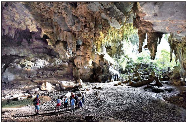
Vstupní prostory vodní jeskyně Majaqua Canteras.