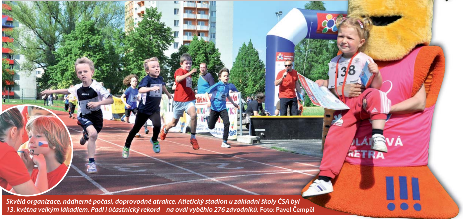
Skvělá organizace, nádherné počasí, doprovodné atrakce. Atletický stadion u základní školy ČSA byl 13. května velkým lákadlem. Padl i účastnický rekord – na ovál vyběhlo 276 závodníků.

Čokoládová tretra, atletický běžecký závod pro děti od tří do třinácti let, v Bohumíně pokořila účastnický rekord. Na ovál u školy ČSA přišlo ve středu 13. května 276 mladých sportovců. Loni se na start dětské verze Zlaté tretry postavilo ve městě 221 mladých závodníků.