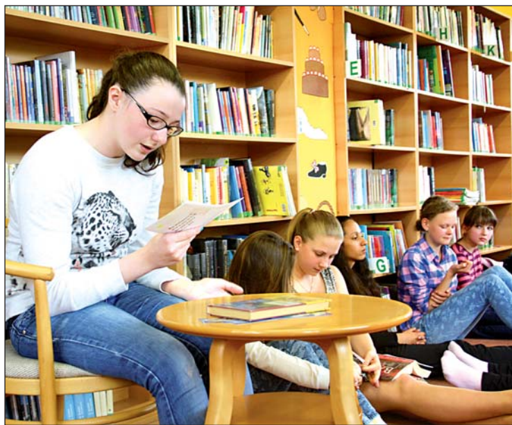
Knihovna K3 opět pořádala soutěž »Nejlepší čtenář neznámého textu«.