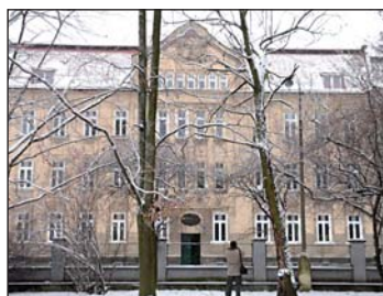
V tomto domě ve Slezské ulici 292 situovaném naproti nemocnici se 1. června od 16 hodin nabízejí v licitaci hned čtyři byty. Dva o velikosti 1+3 a po jednom bytu 1+1 a 1+2.

● Byt 1+1, ul. Seifertova 602 , číslo bytu 5, I. kategorie, 3. patro. Nízkopodlažní dům v klidové zóně poblíž základní školy, parku a centra města. Byt je po celkové rekonstrukci. Plocha pro výpočet nájemného 50,60 m 2 , celková plocha bytu 50,60 m 2 . Prohlídka 25.5. v 15.15–15.30 hodin a 26.5. v 11–11.15 hodin. Opakovaná licitace bytu se koná 27.5. v 16.30 hodin.