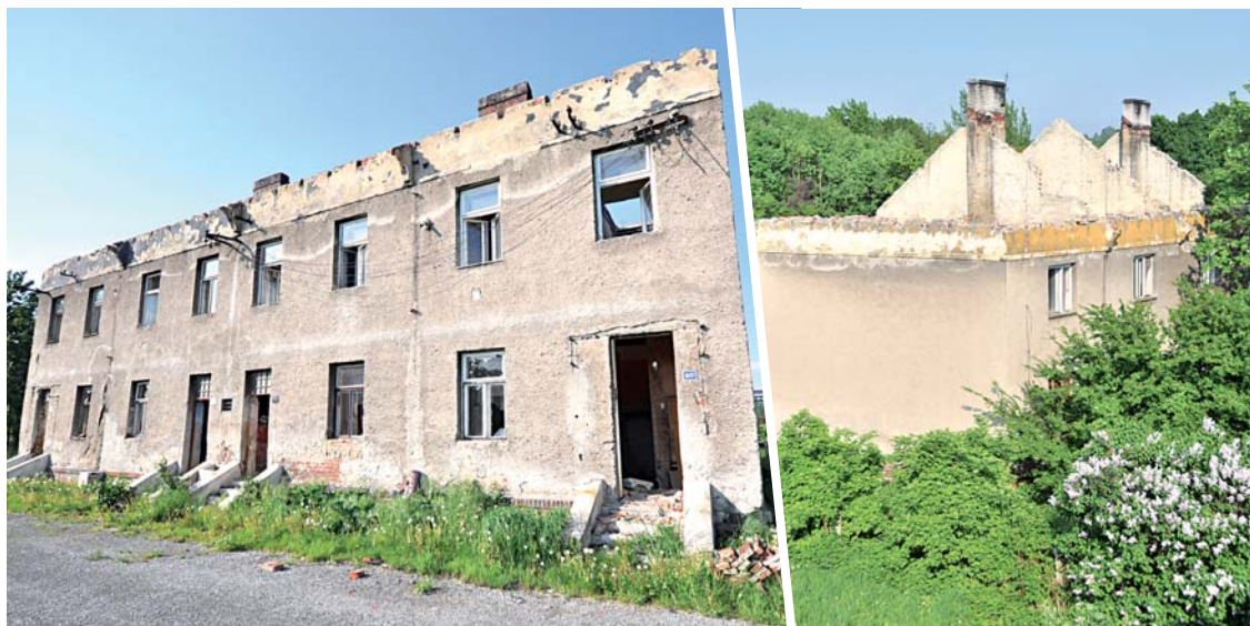
Bývalou osadu v Revoluční ulici tvořily tři domy se čtyřicetimi byty. Každý z domů měl svou menší »hospodářskou« budovu a součástí osady byly i šopy na uhlí a dřevo.