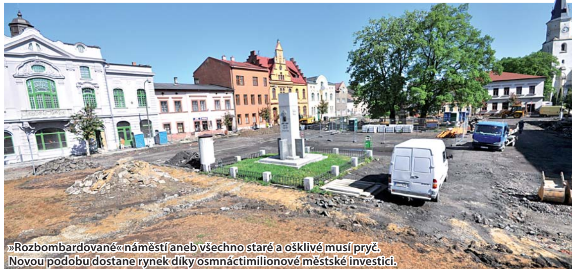
»Rozbombardované« náměstí aneb všechno staré a ošklivé musí pryč. Novou podobu dostane rynek díky osmnáctimilionové městské investici.

V názvu má sice slůvko »starý«, ale za pár měsíců zde bude hned několik dominant zářit novotou. V centru Starého Bohumína finišuje rekonstrukce hotelu Pod Zeleným a současně začala generální přestavba náměstí Svobody. Přestože v jejím případě nabraly práce jistý skluz, termín dokončení by neměl ohrozit. S dokončením obou projektů se počítá v září.