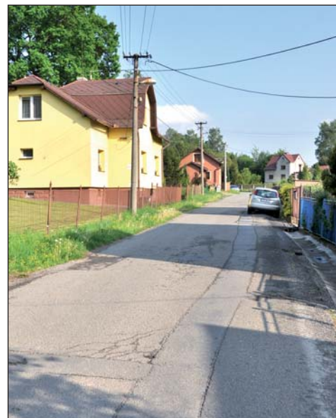
V červnu začne stavba kanalizace v Úvozní ulici. Motoristé zde musí počítat s dopravním omezením.

Budování kanalizace v Úvozní ulici bude probíhat od června do listopadu. V plánu jsou dvě etapy, druhá a pátá. Zdánlivě chaotické číslování je dáno historicky, protože projekt, který stavbu rozdělil do sedmi etap, vznikl už v roce 2005. V realu na sebe etapy II. a V. plynule navazují. Kromě kanalizace dostane ulice v celé délce prací nový povrch. Přibudou zde také výhybny, asfaltové zálivy, díky nimž se mohou auta na úzké ulici míjet.