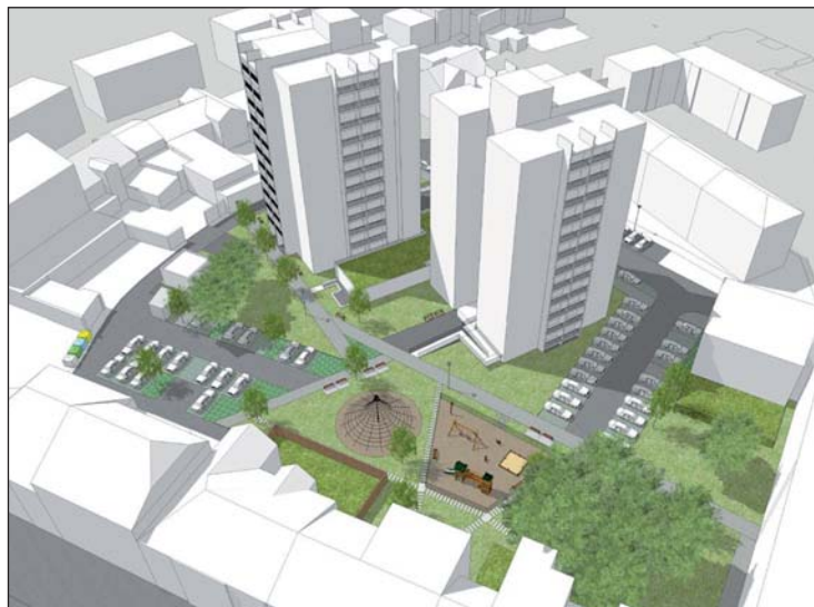
Studie proměny vnitrobloku mezi Alešovou ulicí a hlavní třídou.

„Zaznamenali jsme také protest proti vybudování jednoho z parkovišť. Na základě dalších podnětů bude nutné prověřit zásobování prodejny Hruška, a tím i zachování příjezdu k zadním vstupům