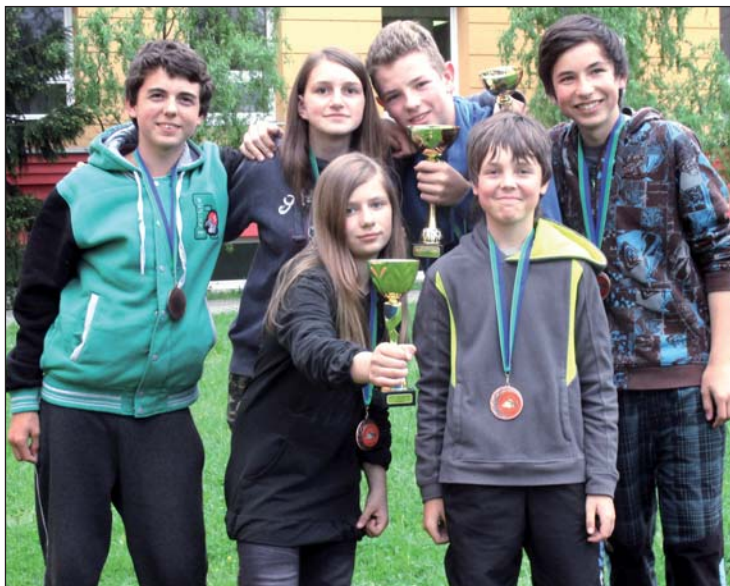
Bohumínské družstvo mladých rybářů, které se účastnilo územního kola v Ostravě.