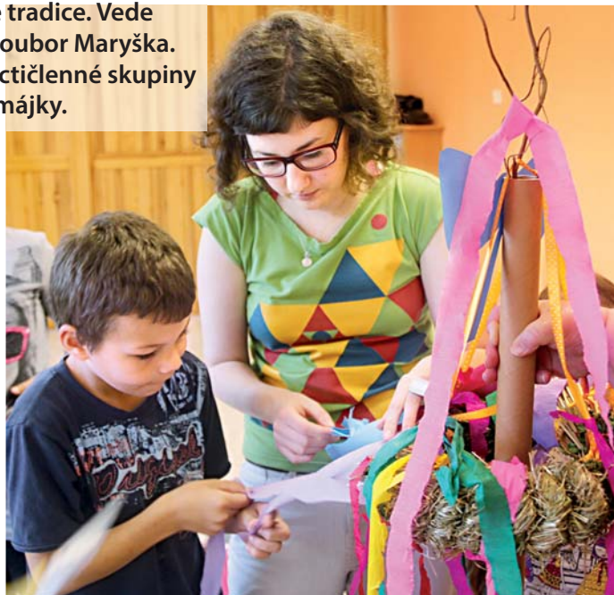
Děti si vyzkoušely zručnost při zdobení májky.

Roční projekt je rozdělený do bloků podle ročních období. Cílem je budovat v dětech pozitivní vztah ke svému regionu, k jeho tradicím, zvykům a také k učení. „V květnu jsme se prezentovali prvním větším tvůrčím počinem. Vlastnoručně jsme vyrobili a hlavně ozdobili májku, dobře známý květnový symbol. K tomu se děti naučily tématické písničky a říkadla,“ uvedla před-