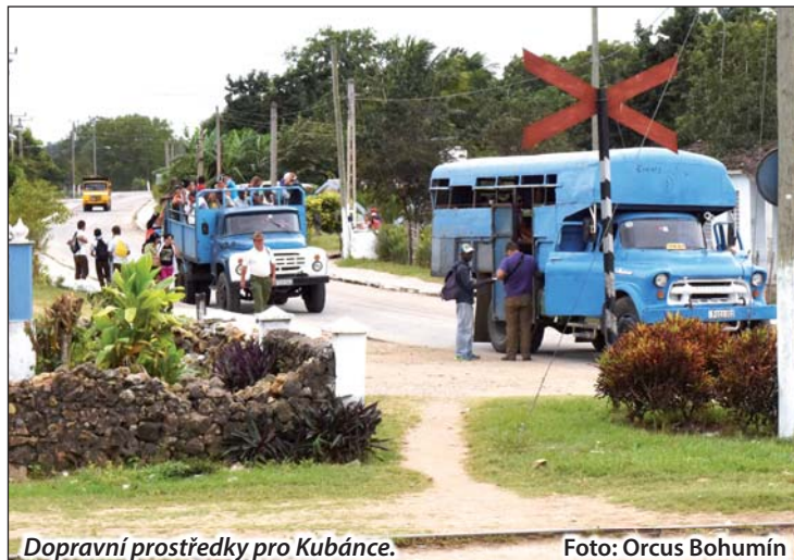
Dopravní prostředky pro Kubánce.