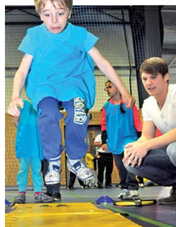
11. ročník AMISu organizoval AK Bohumín a DDM Fontána. Do bojů zasáhlo devět mateřinek a sto třicet dětí.