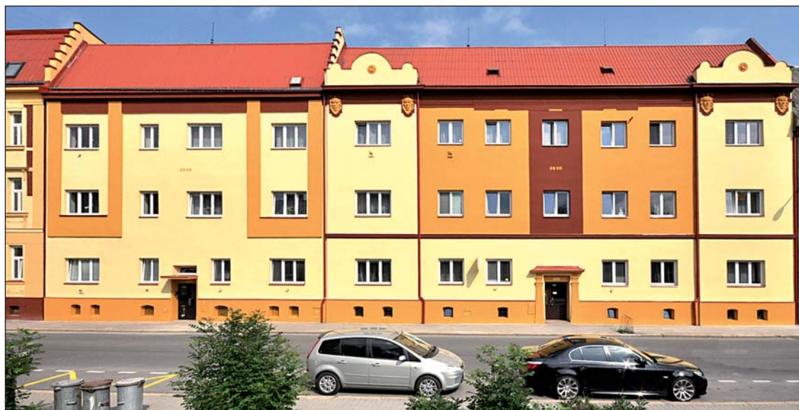
Staronový vzhled dvou vchodů ve Studentské ulici. Družstvo je opravilo podle dobových fotek. U domu 405 byly k dispozici také původní plány skřečošského architekta Dvořáka z roku 1910 - výřez plánu dole.

V uplynulých týdnech prokoukly dva družstevní domy ve Studentské ulici. Dům číslo 405 pochází z roku 1910, sousední vchod 533 je o dva roky mladší. Oprava objektů tak navázala na