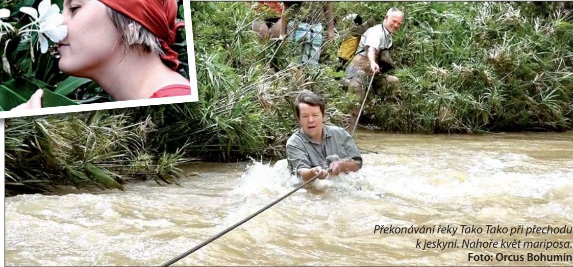
Překonávání řeky Tako Tako při přechodu k jeskyni. Nahoře květ mariposa.