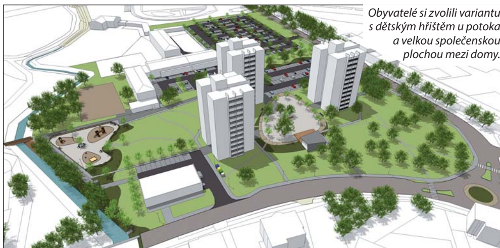
Obyvatelé si zvolili variantu s dětským hřištěm u potoka a velkou společenskou plochou mezi domy.

Lidé dostali k dispozici informace o budoucím projektu i jeho grafické ztvárnění. Na výběr měli ze dvou variant. První počítala s umístěním dětských prvků v blízkosti Bohumínské stružky a s velkou společenskou plochou, lavičkami a mlatovým povrchem mezi věžáky. Druhá nabízela možnost umístit dětské hřiště přímo mezi domy a prostor