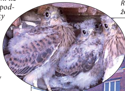
Rodinka poštolek se zabydlela v bývalé budově železárenských energetiků.

kem pět a rodiče se mají co ohánět, aby je nasýtily,“ uvedl autor snímků Martin Pieklo.