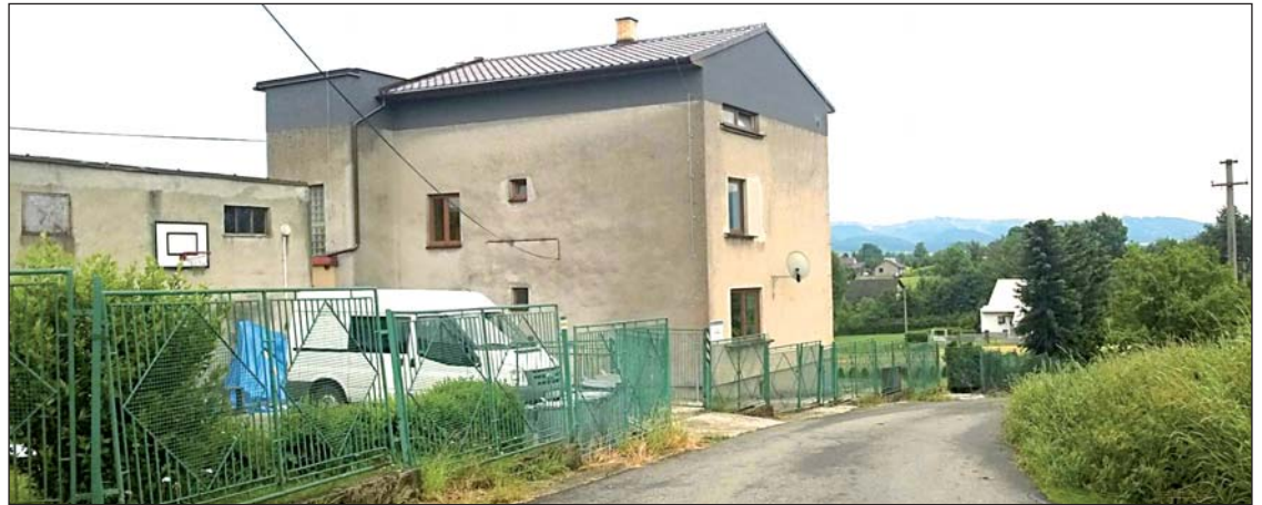
Turistická základna DDM v šedesát kilometrů vzdáleném Návsí u Jablunkova prošla rekonstrukcí za 1,7 milionu. Má novou střechu a práce se dotkly také interiéru.

P rvní turnus dětí vyrazil koncem června na vyhledávanou turistickou základnu bohumínského domu dětí v Návsí u Jablunkova. Letos tady malé výletníky, a především jejich vychovatele, čeká řada novinek. Základna prošla od dubna do června rekonstrukcí za 1,7 milionu.