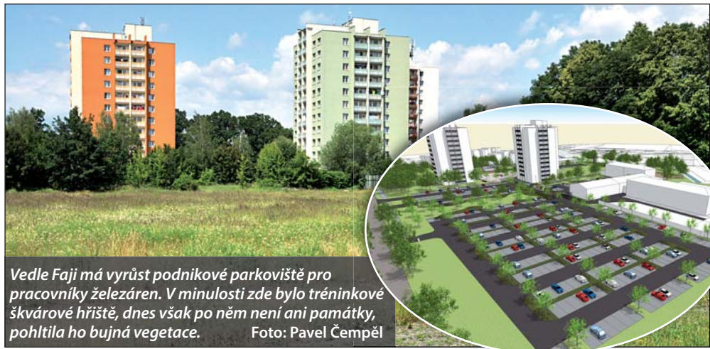
Vedle Faji má vyrůst podnikové parkoviště pro pracovníky železáren. V minulosti zde bylo tréninkové škvárové hřiště, dnes však po něm není ani památka, pohltila ho bujná vegetace.

Kromě připomínek k úpravám veřejných ploch lidé v anketě upozornili i na společenské problémy na minisídlíšti. Trápí je pejskaři, kteří při venčení neuklídají po svých hafanech, a vůbec největší kritika se snesla na zdejší večerku. V jejím okolí se shlukují pochybná individua a tropí zde výtržnosti. Boj s těmito nešvary bude složitější než vizuální proměna celé lokality. Ta se začne projektovat ještě letos, samotná přestavba bude záviset na finančních možnostech města. Předběžně se s ní počítá v letech 2016 až 2017. (tch)