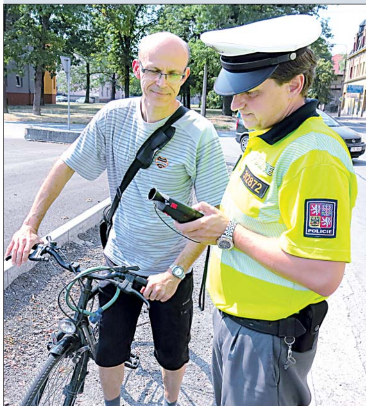
Policisté dávali u drátoven foukat motoristům i cyklistům.

„Kontrolou prošlo sedmnáct motorových vozidel a jednadvacet jízdních kol. Řešil se technický stav vozidel, ale hlavně alkohol,“ uvedl policista Jaroslav Kus. Střízliví řidiči a cyklisté obdrželi jako dárek jednorázový tester na zjištění alkoholu v dechu a nealkoholické pivo. »Prezent« čekal i toho, kdo nafoukal. Dechovou zkouškou konkrétně neprošel jeden z cyklistů. Tester u něj odhalil 0,5 promile alkoholu. Ve správním řízení mu hrozí pokuta od pěti do dvaceti tisíc. (red)