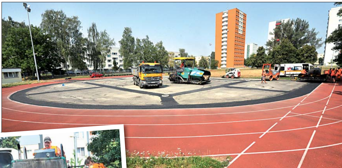
Dosavadní asfaltový plácek bude mít stejný umělý povrch jako okolní běžecký ovál.

Bohumínský atletický klub letos slaví 40. výročí založení a obdržel praktický dárek. Opravenou plochu, která dostane místo dosavadního rozpraskaného asfaltu kvalitní umělý povrch. Atletům, ale i žákům školy, tak bude sloužit ke skoku o tyči a do výšky, jako rozběhová dráha pro hod míčkem a oštěpem. Obnověný plácek se bude hodit také k míčovým hrám.