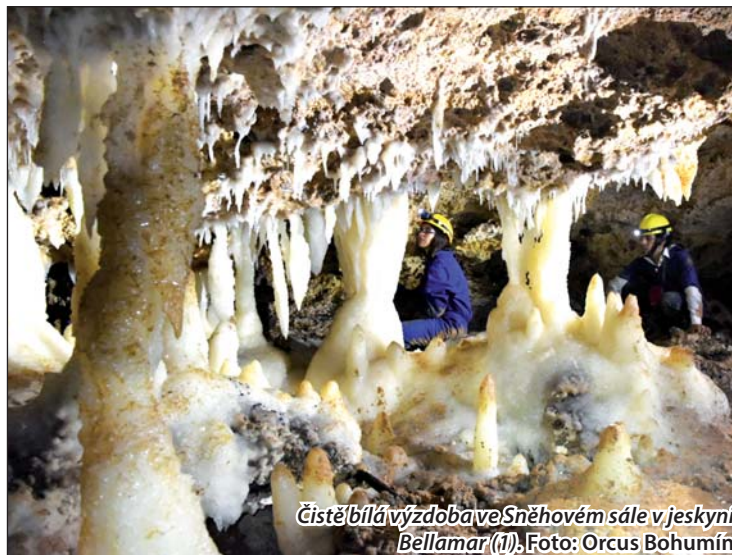
Čistě bílá výzdoba ve Sněhovém sále v jeskyni Bellamar (II).

čekající na exkurzi. Nás očekává ředitel centra Bellamar. Informuje nás, kam všude se dostaneme, a že to jsou části, kam pouštějí jen výjimečně. Mezi turisty ve špinavých overalech působíme asi hodně exoticky, neboť si nás prohlížejí a fotí. Sestupujeme do prvního dómu a na stěnách pozorujeme podobné jehlicové tvary krystalů jako na Krymu. Není to aragonit, ale jsou bohaté a velmi hezké. Pak jdeme kousek po turistické trase až do místa, kde nám Kubánci ukazují