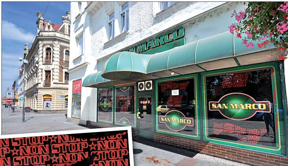
Krám zavřela i jedna z největších heren ve městě, před kterou gambleři postávali na pěší zóně a nedělali hlavní třídě hezkou vizitku.

na 30. Jenže pak přišla nová generace přístrojů – videoterminály.