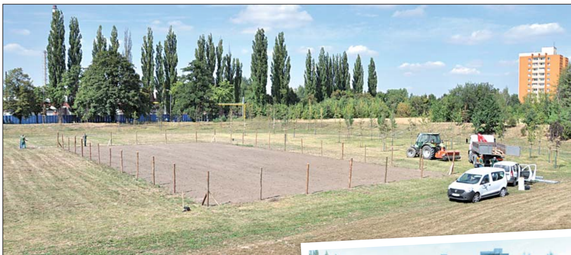
Malé hřiště na Faji prodělalo další terénní úpravy. Zahradníci tady už podruhé zaselí trávník a pro jistotu plochu oplotili. Po nájezdu divokých prasat vypadalo hřiště jako pluhem zorané pole.

Zahradníci proto museli dát plochu znovu do pořádku, srovnat terén a založit nový trávník. A aby se situace neopakovala, město nechalo plácek provizorně oplotit. Bariéra z přírodního materiálu zůstane na místě do doby, než se trávník pořádně ujme a plocha se zpevní.