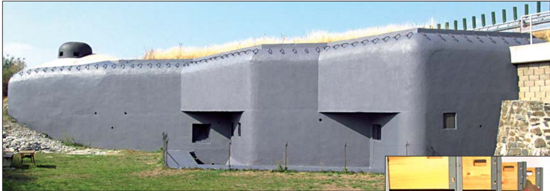
Šedý maskovací nátěr získala i druhá, očím kolemjdoucích více skrytá, levá část bunkru. Díky krajské dotaci vybavil KVH ubikace vojáků v dolním patře srubu.

I když se turistická sezona chýlí ke konci, Klub vojenské historie Bohumín (KVH) zve návštěvníky k prohlídce nových expozic ve vojenském srubu MO-S5 Na Trati.