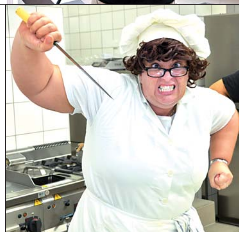
Amatérští herci dali do své role všechno a současně se při natáčení skvěle bavili.

„Před kameru se postavilo asi dvacet ochotníků. Ve svém volném čase, brali si kvůli tomu zpravidla dovolenou. Vážím si proto každého z nich, ať už má významnou roli nebo jen »čudlu«. Navíc do toho dali svou invenci, nápady, kostýmy,“ vysekl kolegům poklonu Kania a poděkoval také provozovatelům hotelu a kameramanům Martinovi a Markovi. (red)