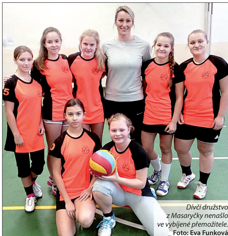
Dívčí družstvo z Masaryčky nenašlo ve vybíjené přemožitele.