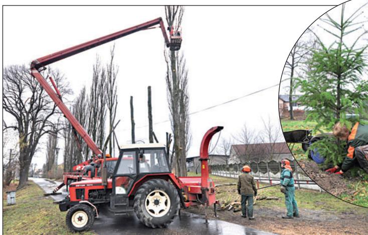
▲ Loni v březnu padlo k zemi jednadvacet topolů v Anenské ulici v Záblatí. ► Odumírající smrky nyní nahrazují douglasky. Několik jich zahradníci v listopadu vysadili poblíž náměstí ve Starém Bohumíně.

V uplynulých letech byl nejčastěji odstraňovaným stromem smrk. Loni se »propadl« na čtvrté místo. Kalamita postupného odumírání smrků však postupuje. Dalšími druhy, které se likvidovaly po ku-