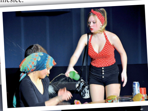
Gymnazisté na prknech bohumínského kina. Jejich Pomáda kombinuje původní filmový muzikál s dalšími popkulturními odkazy.