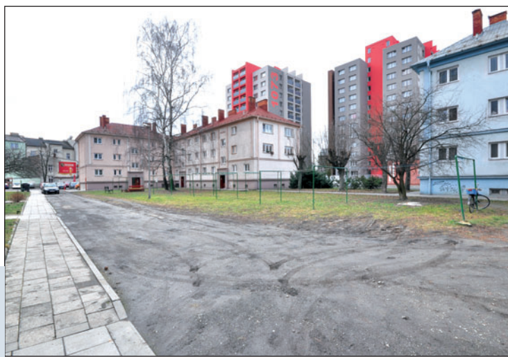
Obyvatelé sami rozhodli, že auta v budoucnu ve dvoře nechtějí. Místo stávající škvárové cesty se rozšíří chodník a trávník.

Město v předstihu seznámilo obyvatele s možnými variantami přestavby. Lidé se v anketě většinou přiklonili k návrhu číslo tři, který spočívá v rozšíření chodníku a zeleně. Zároveň ruší stávající škvárovou cestu. Nájemníci tedy v budoucnu ve dvoře svá auta nezaparkují. Na rozšířený chodník budou smět vjíždět pouze vozidla záchranářů a údržby domů. Místní obyvatelé budou moci