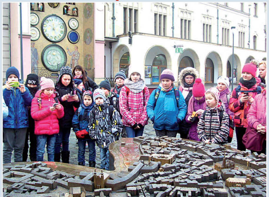
Díky třímetrovému bronzovému modelu historického jádra Olomouce školáci trefili k významným památkám.