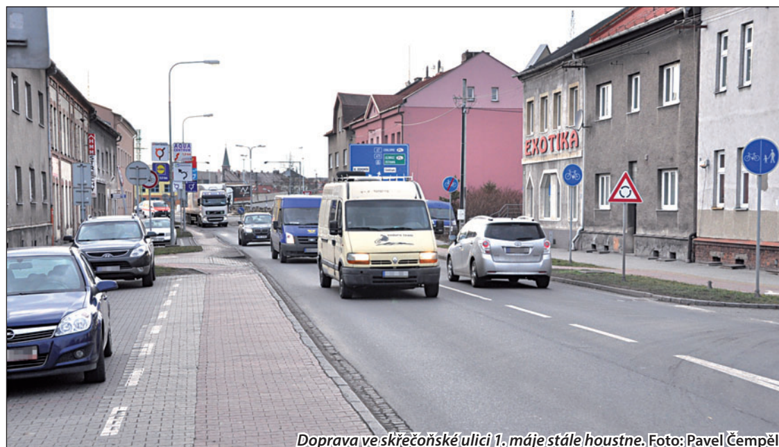
Doprava ve skřečoněské ulici 1. máje stále houstne.

Myšlenka přeložky komunikace I/67 se zrodila už v roce 2008. Navržená spojnice mezi Bohumínem a Karvinou je dlouhá 14,4 kilometru a v zásadě kopíruje trasu železničního koridoru. Tento obchvat by výrazně ulevil dopravou extrémně zatíženému Skřečoni, Dolní Lutyni a Dětmarovicím a urychlil cestu do Karviné. (tch)