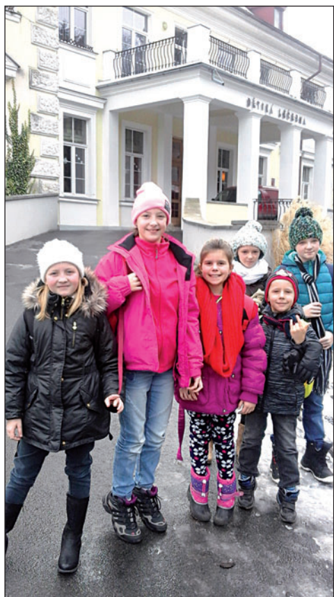
První letošní skupina školáků zavítala do Zlatých Hor na Jesenícku.

Dvaadvacet bohumínských dětí vyrazilo 1. února na první letošní léčebné pobyty do ozdravoven v Jeseníkách či Beskydech. Bohumín je pořádá od roku 2011. Pobyty hradí od roku 2014 v plné výši zdravotní pojišťovny, do té doby je ze dvou třetin dotovalo město. To tak nyní zajišťuje pouze dopravu a koordinaci.