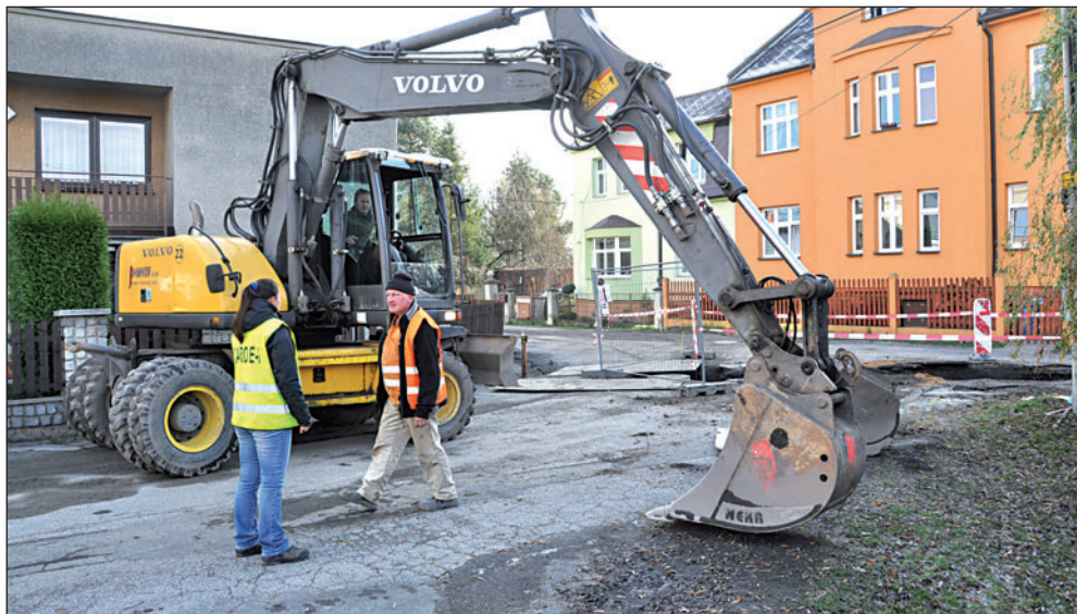
V Malé ulici ve Starém Bohumíně pokračuje po krátké přestávce stavba kanalizace. Vše, včetně opravené komunikace, má být hotovo do května.

Současně musí stavbaři v Úvozní ulici ještě dotáhnout resty z loňské stavby. V posledním