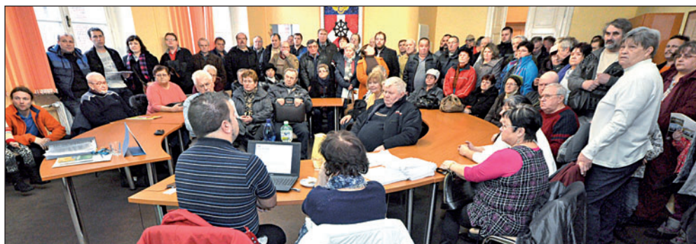
Konzultační den na bohumínské radnici si nenechalo ujít několik desítek zájemců o výměnu kotle. Informace jim zprostředkovali úředníci z hejtmánství.